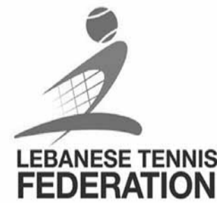
شعار اتحاد التنس

دعا الاتحاد اللبناني للتنس رجال الصحافة والإعلام الى حضور حفل العشاء التكريمي الذي سيقميه على شرف الأبطال والبطلات الذين حققوا نتائج مميزة محلياً وخارجياً في العام ٢٠١٨ وذلك عند الساعة الثامنة من مساء الأحد المقبل الواقع فيه ١٦ كانون الأول الجاري في مقر النادي اللبناني للسيارات والسياحة (ATCL) في الكسليك.