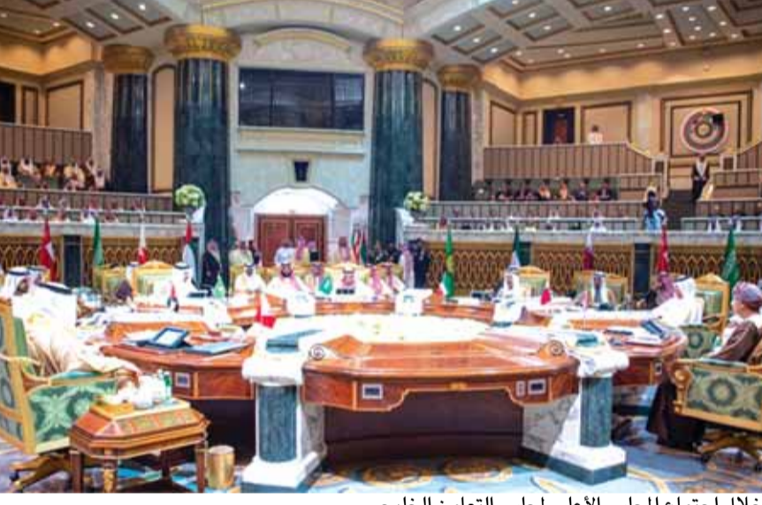
خلال اجتماع المجلس الأعلى لمجلس التعاون الخليجي

المنطقة»، مشيراً إلى أن «قادة دول المجلس أكدوا على التعاون ووحدة الصف بين أعضائه لما بينهم من قيم وتاريخ عريق ومصير مشترك ووحدة الهدف». كما أكد الزباني على الأهمية المحورية لدول الخليج في صيانة أمن واستقرار المنطقة والتصدي للفكر المتطرف من خلال التأكيد على التنوع واحترام حقوق الإنسان، مشيراً إلى أن «التحديات الجديدة تستوجب تعزيز العمل الخليجي المشترك». وشدد البيان على أهمية مواصلة العمل الاحتتم الملك السعودي سلمان بن عبد العزيز، مساء أمس، في قصر الدرعية بمدينة الرياض، أعمال اجتماع الدورة ٣٩ للمجلس الأعلى لمجلس التعاون الخليجي. وأكد البيان الختامي للقمّة الخليجيّة أهمية وحدة الصف والهدف واستكمال التكامل الاقتصادي بين دول مجلس التعاون الخليجي وبلورة سياسة خارجية موحدة وفعالة ومنظومة دفاع مشتركة. وقال الأمين العام لمجلس التعاون الخليجي عبد اللطيف الزباني، خلال تلاوته البيان الختامي، إن «المخاطر عززت أهمية التمسك بمجلس التعاون الخليجي لمواجهة تحديات