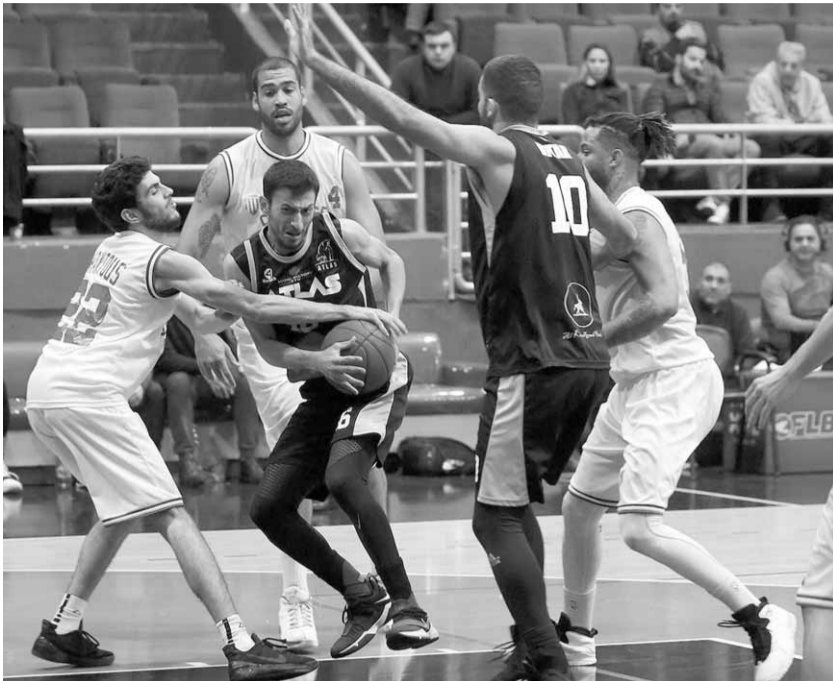
من مباراة الحكمة وأطلس الفرزل

حقق فريق أطلس فوزه الثاني في دوري كرة السلة اللبناني على حساب الحكمة بنتيجة ١٠٤-٩٩ في المباراة التي جرت على ملعب غزير بدون جمهور. وجاءت الأرباع على الشكل التالي: الأول ٢٨-٢٤، الثاني ٤٣-٤٣، الثالث ٦٨-٧٢، والأخير ١٠٤-٩٩.