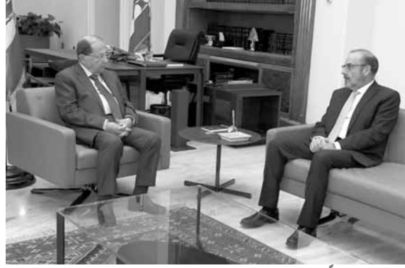
عون مجتمعاً مع الصراف (دا لاتي ونهرا)

عون بالذكري الـ ٧٥ للاستقلال، وقدم له هدية تذكارية عبارة عن بندقية أثرية مرفقة بشعار عيد الاستقلال. واستقبل الامين العام لـ «اللقاء الرئودكسي» النائب السابق مروان ابو فاضل، واجرى معه جولة افق تناولت التطورات السياسية الراهنة والأوضاع في المنطقة، إضافة الى مسار تشكيل الحكومة الجديدة. وأوضح ابو فاضل انه بحث مع الرئيس عون «في التمثيل الرئودكسي في الحكومة».