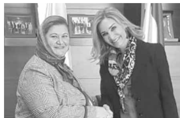
المولى مع سفيرة سويسرا

عن سعادتها بتفعيل التعاون المشترك وتعزيز العلاقات الثقافية والعلمية بما يخدم مسيرة التعليم العالي وقضايا الحوار بين الأديان. وأثر انتهاء اللقاء، قامت السفيرة جوريكس بجولة ميدانية على فروع الجامعة. في ختام الجولة اوتلت المولى تكريماً للسفيرة السويسرية والوفد المرافق.