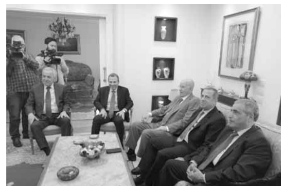
باسيل مع نواب «اللقاء التشاوري»

ذلك الرئيس ليس لديه مشكلة مع وزير سني بينه وبين الاجتماع، صرح باسيل: «طلبت هذا الاجتماع من نحو اسبوع، ومن الواجب زيارة اللقاء التشاوري، وطلبت زيارته للاستماع اليهم جميعا في حديث صريح، وأبديت الملاحظات وهم ايضا ابدوا الملاحظات من جهتهم بهدف التوصل الى حل. وفي رأيي يجب الاعتراف بوجود حثية سياسية وشعبية تمثل خطأ من الاقلية السنية او جزءا منها، ومن جهة أخرى يجب أن تكون المعايير قائمة وصحيحة. وعلى هذا الاساس انا اتمنى واطلب من الاطراف المعنيين بالتشكيل مباشرة امام كل اللبنانيين، فالمعنويون بالتشكيل هم الرئيس سعد الحريري والنواب المعارضون، هذه المشكلة بينهم ويجب حلها بينهم، ويجب اللقاء مباشرة لتوضيح الأمور وتفهمها»، مضيفا «من ناحية أخرى نحن نحرص على أن الرئيس الجمهورية ليس طرفا، ولتأكيد