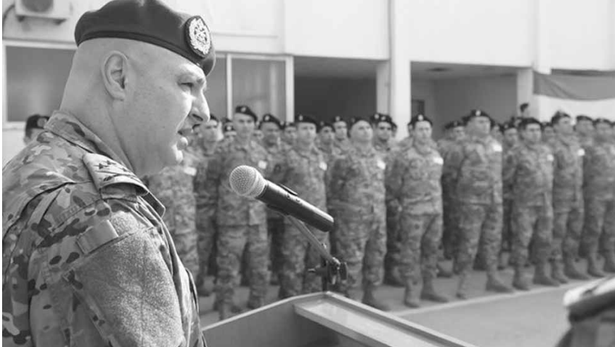
قائد الجيش يلقي كلمته

طويلة وقاسية وملبنة بالصعوبات، لكن بعد تخرجكم من الكلية الحربية ستكونون رجالاً أشداء قادرين على تحمل المسؤولية»، ونوه به اللجنة الفاحصة ومناقضيتها، ومتابعيتها الحثيثة التي أدت الى اختيار التلامذة الناجحين وفقاً لأعلى المعايير التعليمية، ومستوى التلامذة وتحصيلهم العلمي فقط».