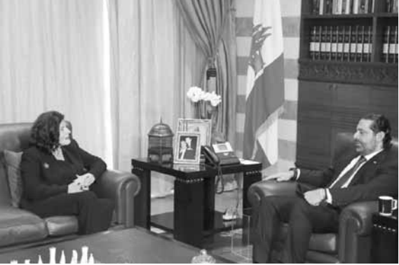
سفيرة فنزويلا عند الحريي (دا لاتي ونهرا)

تلقي رئيس الحكومة المكلف سعد الحريري سلسلة برقيات تهنئة بعيد الاستقلال من رؤساء دول ومسؤولين أبرزها من الرئيس التركي رجب طيب اردوغان، الرئيس الفلسطيني محمود عباس، ورئيس وزراء بولندا ساتوس مورافسكي، رئيس وزراء البوسنة والهرسك الدكتور دينيس زفيريديك، رئيس وزراء تونس يوسف الشاهد والامين العام لجامعة الدول العربية احمد ابو الغيط.