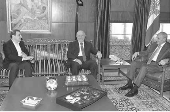
بري مستقبلاً ابو فاعور والعريضي (حسن ابراهيم)

استقبل رئيس مجلس النواب نبیه بري ظهر امس في عين التينة، النائب وائل ابو فاعور والوزير السابق غازي العريضي، وعرض معهما الوضع الراهن ولا سيما تاليف الحكومة.