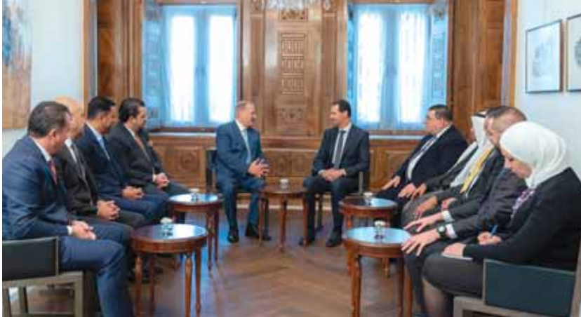
الرئيس الاسد مع الوفد الاردني

استقبل الرئيس السوري بشار الأسد امس وفداً برلمانياً أردنياً يضم عدداً من رؤساء اللجان في البرلمان الأردني ويترأسه النائب عبد الكريم الدغمي. وجرى خلال اللقاء التأكيد على أهمية تفعيل العلاقات الثنائية بين سورية والأردن في جميع المجالات وبما يحقق مصالح الشعبين الشقيقين. وأكد أعضاء الوفد ان نبض الشارع الأردني كان على الدوام مع الشعب السوري في وجه الحرب الإرهابية التي يتعرض لها لأن سورية هي خط الدفاع الأول عن كل المنطقة العربية وانتصارها في هذه الحرب سيكون انتصاراً لجميع الدول العربية في وجه المشاريع الغربية التي تستهدف ضرب استقرارها