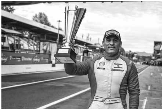
السائق البطل تاني حنا يرفع كأس البطولة

دعا بطل آسيا- أوقيانيا في بطولة «فيري تسانج» لعام ٢٠١٨ السائق اللبناني تاني حنا رجال الصحافة والإعلام إلى حضور المؤتمر الصحفي الذي سيعقد عند الساعة الثامنة من مساء الثلاثاء ٤ كانون الأول المقبل في فندق لورويال (ضبية) للتحديث عن مسيرته في بطولة العام الجاري والتي توجها باحراز اللقب المرموق لأول مرة لسائق عربي.