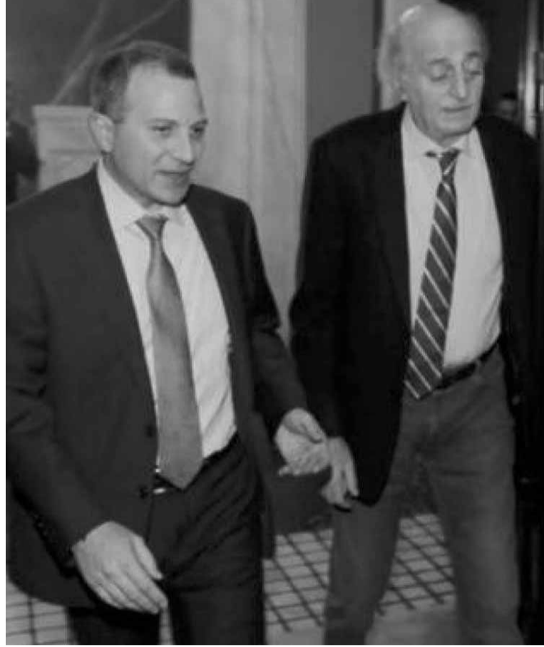
ما خطط له لاعادة وصل ما انقطع مع روسيا ام ان ما بين الجانب الروسي والمختارة يختلف عن الموقف بين المختارة ودمشق؟

بدون شك فان زعيم المختارة لم ينتقل الى موقع التراجع عن موقفه السابق لكنه ينتظر ان ينخفض سقف التصريحات وفق الاوساط، وبالتالي فان تصعيد المستقبل بلغ سقوفا مرتفعة في الرد، لكن الزعيم الدرزي كما يبدو من الصمت او انتقاء صياغة التغريدات ليس في نيته اعادة تفجير الوضع مع حزب الله او التأثير في المبادرة الاخيرة التي يقوم بها باسيل لحل العقدة