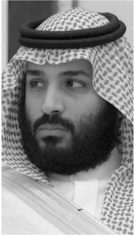
محمد بن سلمان