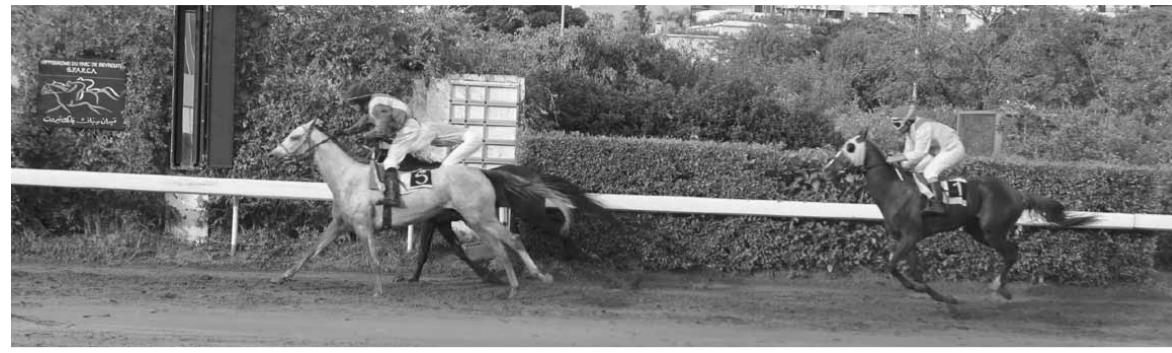
ابراج من برا وكادو عالخش حيث فازت ابراج بنصف طول ووراءهما جيوفاني