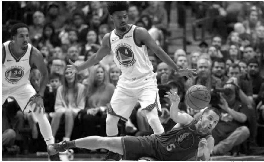
من مباراة دالاس وغولدن ستايت