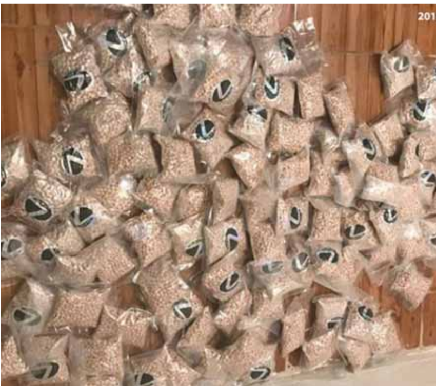
حبوب الكيتاغون من المضبوطات

أعلنت قيادة الجيش - مديرية التوجيه في بيان لها انه: «بتاريخ ١٧/١١/٢٠١٨،