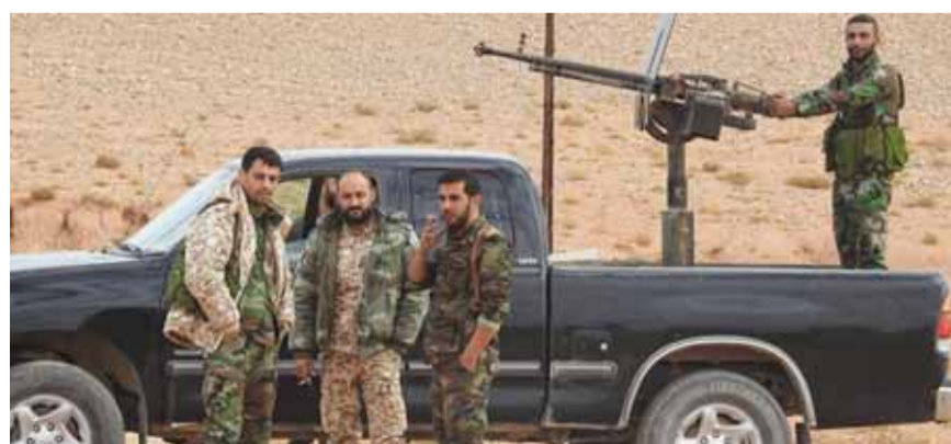
«جبهة النصرة» من السلفيين التكفيريين

ضابط سوري يقول: الإرهابيون يعطوننا المبرر لإنهاء أزمة ادلب بسرعة