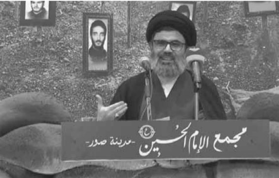
صفي الدين يلقي كلمته من مجمع الامام الحسين

وايثاب عكس ما قدمه على أنه ليس عدوا ومنقذا للبنانيين من مآسي الحروب الداخلية»، مضيفا «اما المسؤولية اللبنانية فهي توضح الموقف الشرعي والوطني والأخلاقي بضرورة مواجهة هذا العدو بالسلاح، والمسؤولية الثالثة هي القيام بالعمليات العسكرية المباشرة بغض النظر عن الخبرة القتالية التي يمتلكها هؤلاء الشباب.»