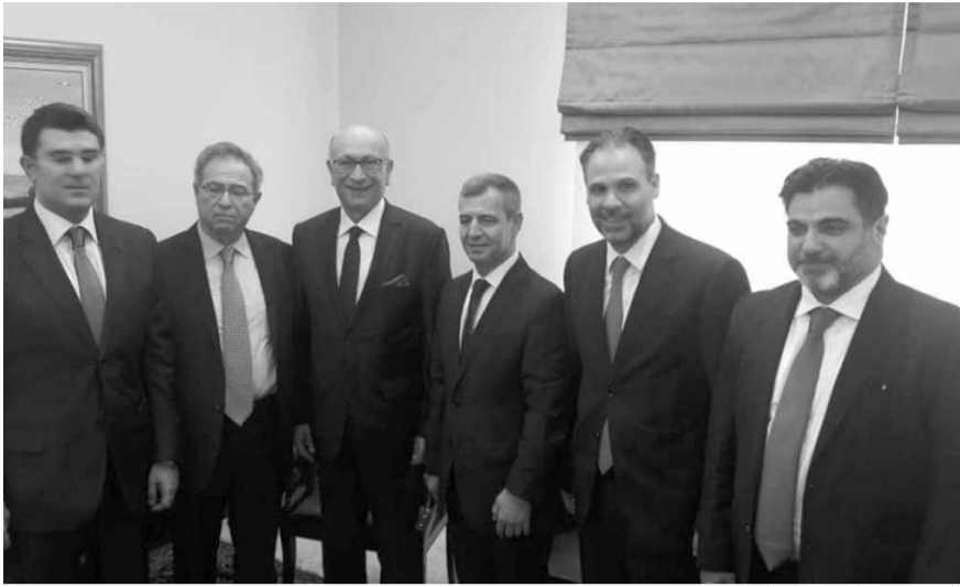
التقيب مع الأعضاء الفائزين

بالإضافة الى ان الانتخابات المقبلة في السنة القادمة والتي سينتخب فيها المحامون تقيماً للمحامين، قد تشهد ترشحاتاً لمترشحين من الطائفة السننية لأن المحامي قمبريس سوف يبقى سنة واحدة في المجلس الذي لا يضم شعيياً. كما قد يترشح شعيي لمركز العضوية أيضاً.