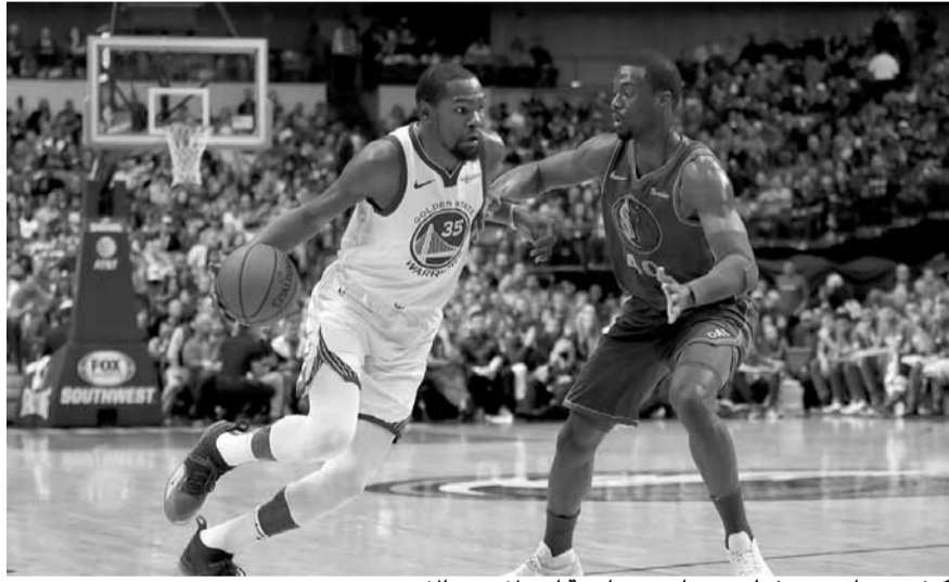
كيفن دورانت من غولدن ستايت بمواجهة أحد لاعبي دالاس

عاد غولدن ستايت ووريز إلى دوامة الهزائم مجدداً، وخسر أمام مضيفه دالاس مافريكس بفارق ٣ نقاط (١٠٩-١١٢)، في المباراة الخيرة التي جرت فجر أمس الأحد في صالة «أميركان إيرلاينز سنتر» في دالاس، من الدوري الأميركي للمحترفين في كرة السلة.