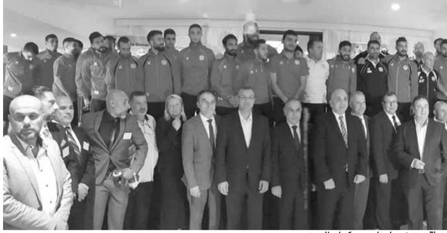
بعثة منتخب لبنان مع كبار الحضور