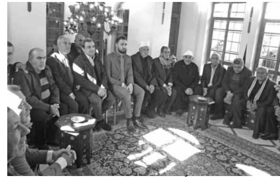
تيمور جنبلاط مستقبلاً زواره

الحضانات وشروط العمل ورفع الرسوم المالية، واستمع ايضا الى مطالب مختلفة، وعرض مشاريع تطويرية للبلدات والقرى من رؤساء اتحادات بلدية ورؤساء بلديات ومجالس بلدية واختيارية ومراجعات من جمعيات وادنية وفروعاً حزبية مواطنين.