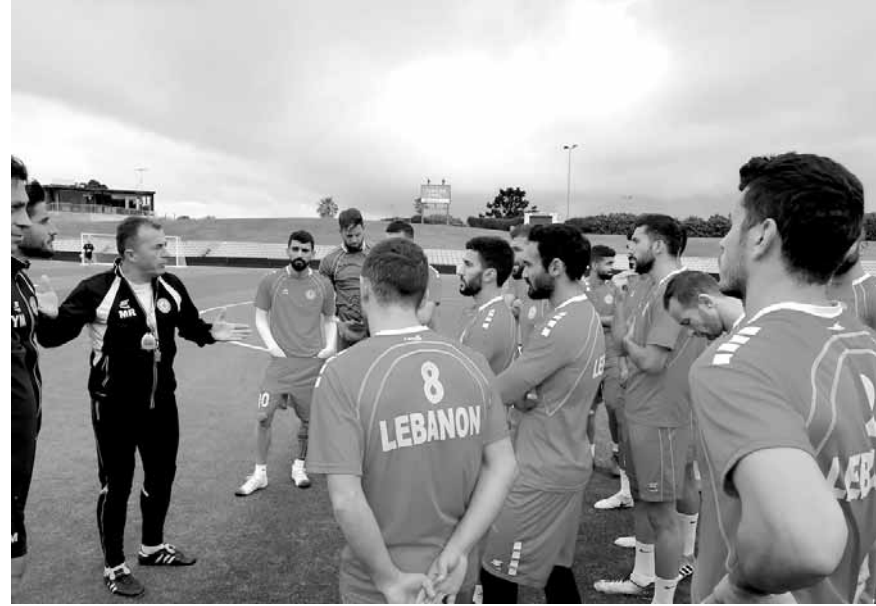
منتخب لبنان في ملعب جوبيلي أوفال

أجرى منتخب لبنان لكرة القدم مرانته أمس السبت في «ستاد جوبيلي أوفال» بمنطقة كسارلتون في سيدني، استعداداً للقاء نظيره الأسترالي مساء الثلاثاء المقبل على أرض الاستاد الأولمبي في منطقة هامبوش، الذي يتسع لحوالي ٨٣ ألف متفرج. ويواكب أفراد الجالية اللبنانية هذا الحدث، وقد حضر عدد منهم إلى الملعب وتابع التدريب والتقط صوراً مع اللاعبين. كما يعول الإتحاد الأسترالي لكرة القدم على حضور كثيف للقاء الذي سيشهد تكريم نجمه تيم كاهيل لمناسبة إعتزاله، لذا، نشط