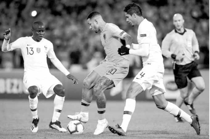
من مباراة هولندا وفرنسا

مبابي لاعب باريس سان جرمان، ولاعب ريال مدريد، لوكا مودريتش، أحق منه بالجائزة.. وتابع: «على الرغم من أنني قدمت مستوى مميز هذا العام، إلا أنني لا أستحق الفوز بالكرة الذهبية، أعتقد أن مبابي، ومودريتش أحق بها مني، بعد أن قداما مستوى مميزا».