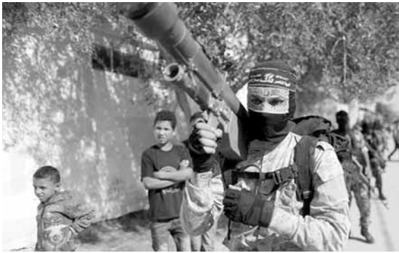
مقاتلون فلسطينيون يحملون صاروخا