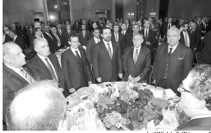
الحريري خلال العشاء الاقتصادي

شدد الرئيس المكلف تشكيل الحكومة بسعد الحريري على أن الحل في موضوع تاليف الحكومة ليس لديه بل لدى الآخرين، مشيراً إلى أن هدفه الأساسي سبيل تطوير البلد، وقال: «لدينا فرصة ذهبية لتطوير لبنان، وخصوصاً بعد مؤتمر «سيدر». وأي حكومة ستاتي قريباً في المستقبل إن شاء الله ستضع في بيانها الوزاري كل الإصلاحات والمشاريع الواردة في المؤتمر، وكل الأقرقاء السياسيين سبق أن وافقوا على ذلك».