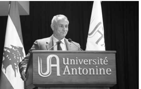
روكز يلتقي كلمته خلال الندوة

رأى النائب شامل روكز «ان المواطنة مفهوم يصعب تفسيره او تلخيصه بصفحة او بمحاضرة واحدة، لان المواطنة هي اسلوب حياة ونهج وواجبات ومسؤوليات، هي احساس قوي يتخطى الذات ليصل الى التضحية في سبيل الوطن او القضية»، مؤكداً «ان الوطن ضائع بين انقسامات طائفية وسياسية ومحاصصات حزبية ضيقة وخلافات تافهة جدا امام وضع لبنان الحرج والخطر على كل المستويات. صحيح ان الوطن ضائع لكن القضية ما زالت تعيش في داخلنا، وهذا المنتدب هذه المرة ليس جهة هو التمسك والتعلق والتشبث بالقضية الاكبر، وهي لبنان القوي، لبنان دولة القانون».