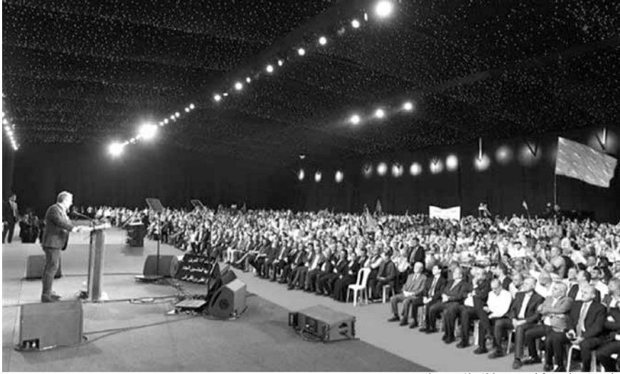
باسيل يلقي كلمته خلال الاحتفال

أكد رئيس التيار الوطني الحر الوزير جبران باسيل في كلمة له خلال إحتفال التيار الوطني الحر بذكرى ١٣ تشرين، أن «كل يوم تساق ضدنا الاقتراءات وتشن علينا الحملات بالفساد يكون اشبع من ١٣ تشرين وكل يوم ننتزع منا الحقوق وتمس المخافقية وتوضع العراقيل للحكومة والمشاريع وتنتزع الصلاحيات يكون ١٣ تشرين»، معتبرا ان «الفساد والظلم والتزوير وجه آخر للثالث عشر من تشرين، وسنقاوم ذلك وننتصر بالنهائية»، لافتسا الى ان «الحرب على الرئيس ميشال