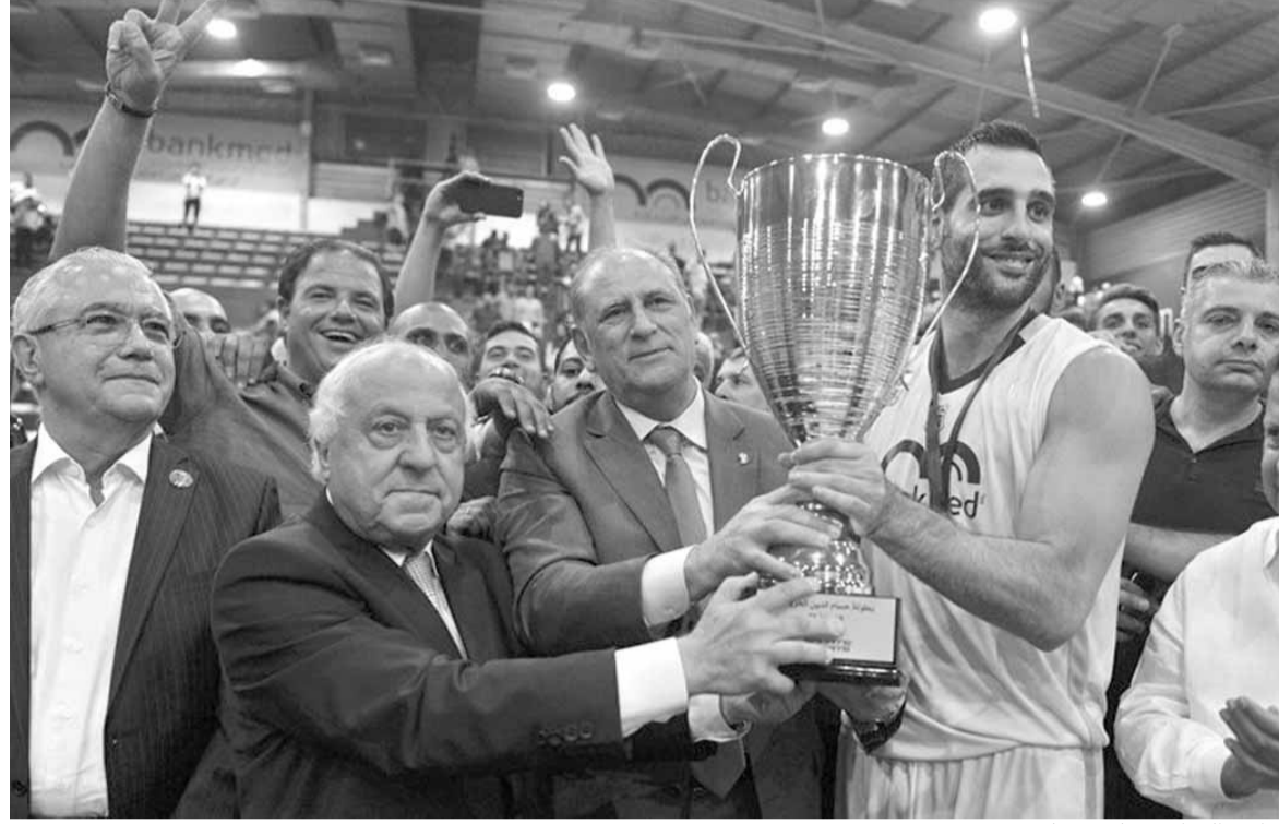
النادي الرياضي (بيروت)