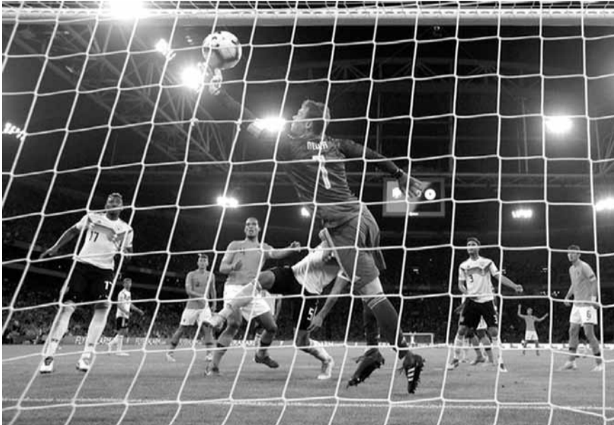
هدف هولندا الوحيد في مرمى ألمانيا

عليه لوف خلال مشواره مع الفريق منذ توليه المهمة في عام ٢٠٠٦. وضمن دوري الفئة الثانية، فازت تشيكيا على سلوفاكيا (٢-١)، وتعادلت جمهورية أيرلندا مع الدنمارك (١-٠).