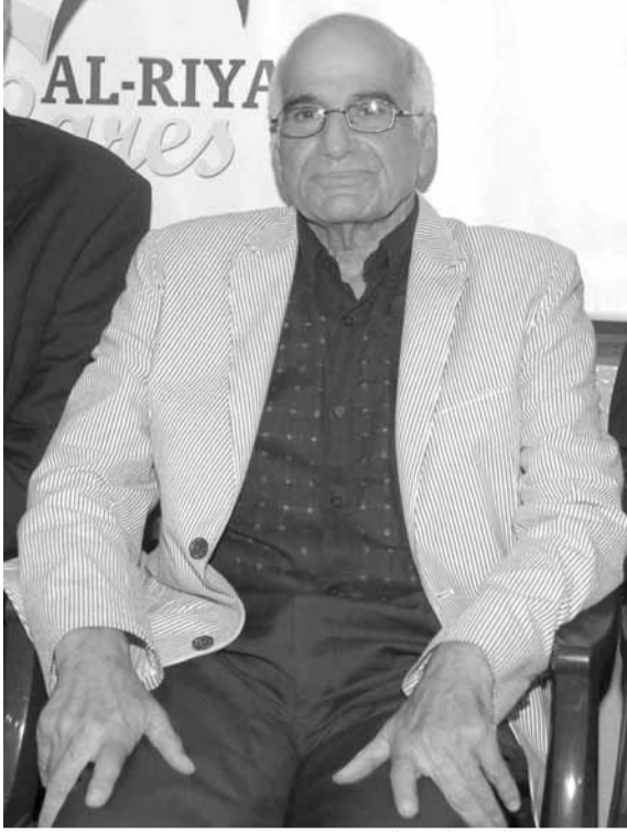
رئيس نادي الفداء (صيدا)