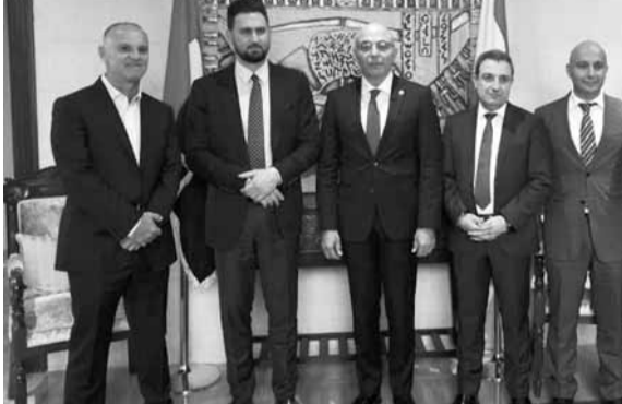
تيمور جنبلاط والجالية في ابو ظبي

اللبنانية في الإمارات، جالية فاعلة متماسكة لا تعرف الطوائف والأحزاب، يميّزها شغفها للعمل والإنتاج ويوحدها حبها للوطن».