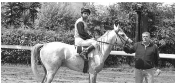
المريح: يراكض اليوم مجموعة على شكله ومثاله ولكن بامكانه بطئهم جميعاً والوصول الى المريح مرتاحاً.