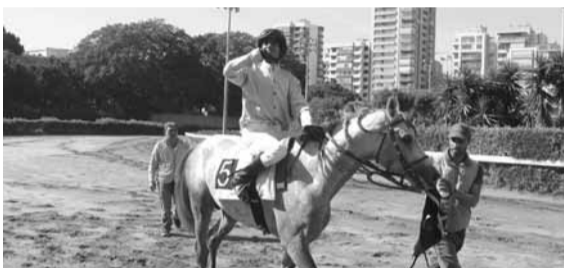
جوهري: بانتصاراته المتتابعة، اظهر انه عاد الى مضاهيه الطيب الذي يبشر بالجهوية التي يتمتع بها اليوم بانه سيكون الفائز.