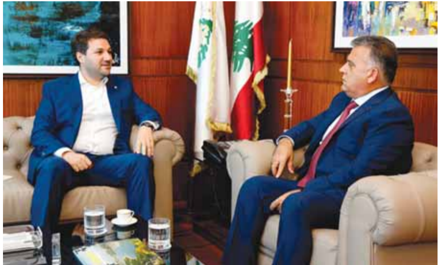
(التفاصيل ص ٣)