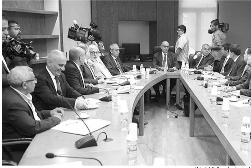
اجتماع لجنة الأشغال

المربطة بمنظومة الصرف الصحي إنفاذاً للقانون ٢٠١٦/٥٣ لمدة أقصاها سنة، نظرا إلى تفاقم المشكلة وتحديدًا في البقاع بوصفه المنطقة التي تحوي المصادرة الأساسية للتلوث.