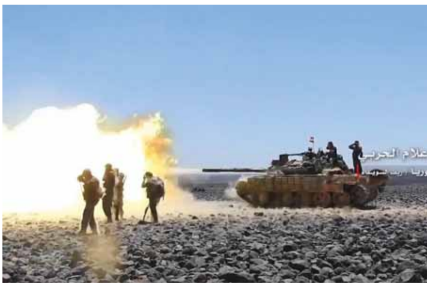
قصف للجيش السوري في بادية السويداء

أحبطت وحدات الجيش السوري المتمركزة على محور تلول الصفا في بادية السويداء امس هجوماً شنه مسلحو تنظيم «داعش» الإرهابي.