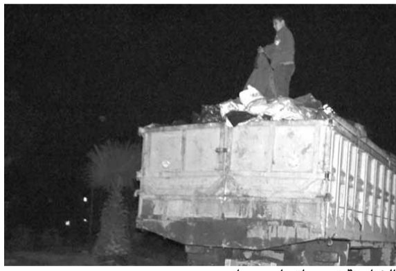
الشاحنة تعبر باتجاه صيدا

استنكرت هيئة متابعة قضايا البيئة في صيدا، في بيان امس، «إصرار قيادة «تيار المستقبل» في صيدا على استئناف استيراد النفايات من بيروت، وذلك على الرغم من العجز الواضح لمعمل النفايات في صيدا عن استيعاب الكميات الكبيرة من النفايات الواردة إليه من جهة أولى، وعلى الرغم من ممانعة الشركة الملتزمة بنفايات بيروت إرسال أي كمية منها إلى صيدا».