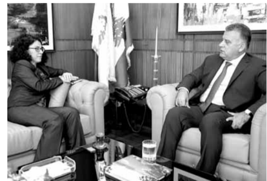
و مع خوري

كما بحث اللواء ابراهيم مع رئيسة مكتب المبعوث الخاص للامم المتحدة الى سوريا ستييفاني خوري مواضيع ذات اهتمام مشترك وسبل التنسيق بين الامن العام ومؤسسات الامم المتحدة في ما يتعلق بالنازحين السوريين.