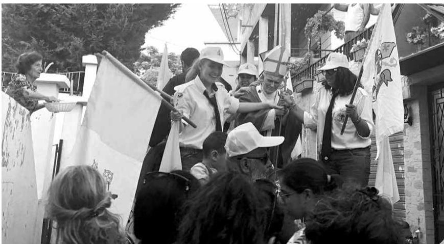
من مسيرة التبارك بذخائر البابا يوحنا بولس الثاني في عقائبت

احتفلت رعية بلدة عقائبت في منطقة صيدا، بذخائر البابا القديس يوحنا بولس الثاني، بمسيرة جابت شوارع البلدة وكنيسة مار جريس القديمة وصولاً الى الكنيسة الجديدة، بمشاركة حشود شعبية.