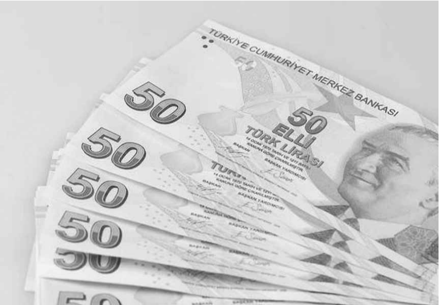
المركزي يتدخل لانقاذ الليرة