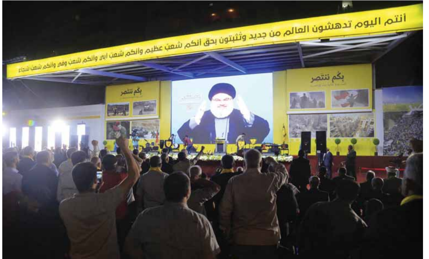
الحشود ترفع قبضاتها للسيد نصرالله

واقول للاسرائيليين: ان حزب الله اقوى من الجيش الاسرائيلي. وتطرق سماحته الى الملف السوري مؤكداً بقاء حزب الله في سوريا وأن سوريا انتصرت، واسرائيل