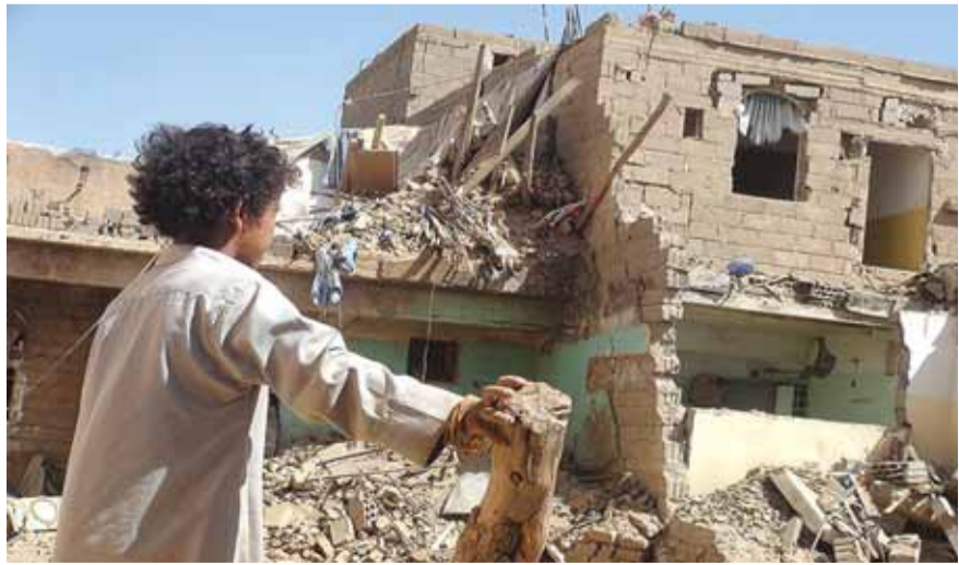
مفلق يميني امام ركام منزله

محافظة الحديدة، أسفرت عن مقتل خمسة هم رجل وزوجته وثلاثة من أبنائهما. وأشار إلى «استهداف التحالف طريق اللابوة في مديريةه الدريهمي جنوب الحديدة بثلاث غارات».