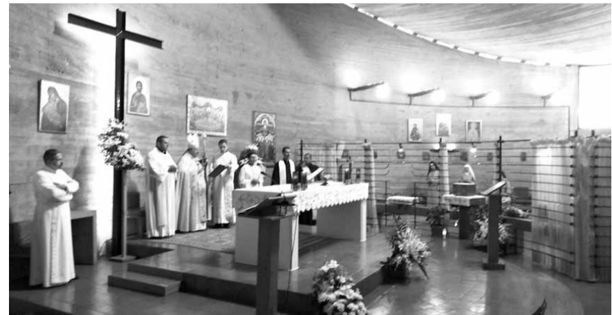
مطر يترأس القداس

احتفلت راهبات الكلايس في لبنان بعيد القديسة كلارا الأسيزية، شفيعتهن ومؤسسة الرهبانية النسائية الأولى للمرتسيسكانيات مع القديس فرنسيس الأسيزي.