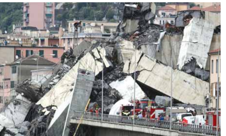
الجسر المنهار في ايطاليا