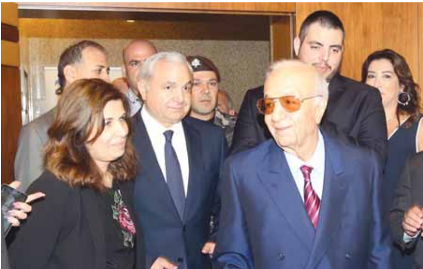
الرئيس ميشال المر ونجله الوزير المر والزملاء في الجمهورية خلال الاحتفال (ص ٤)

قداس في سيدني بذكرى الفقيد الكبير الزميل يوسف الحويك ص ٦