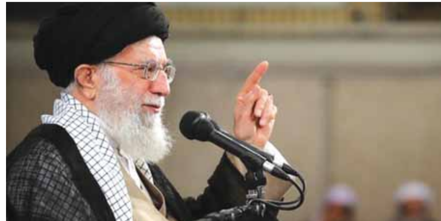
الامام الخامنئي يتحدث (التفاصيل ص ١٦)