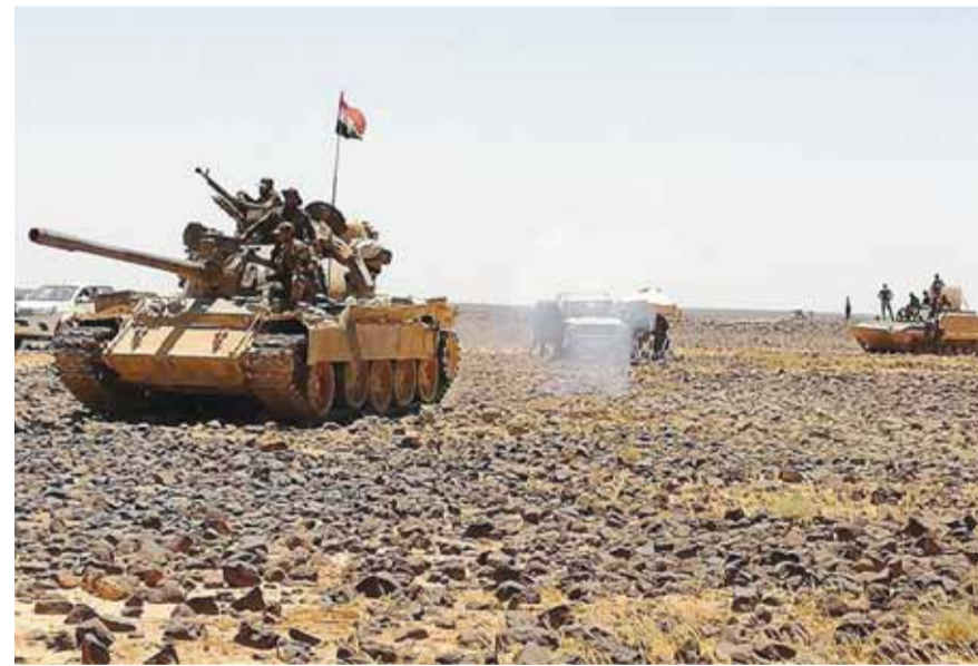
الجيش السوري في بادية السويداء