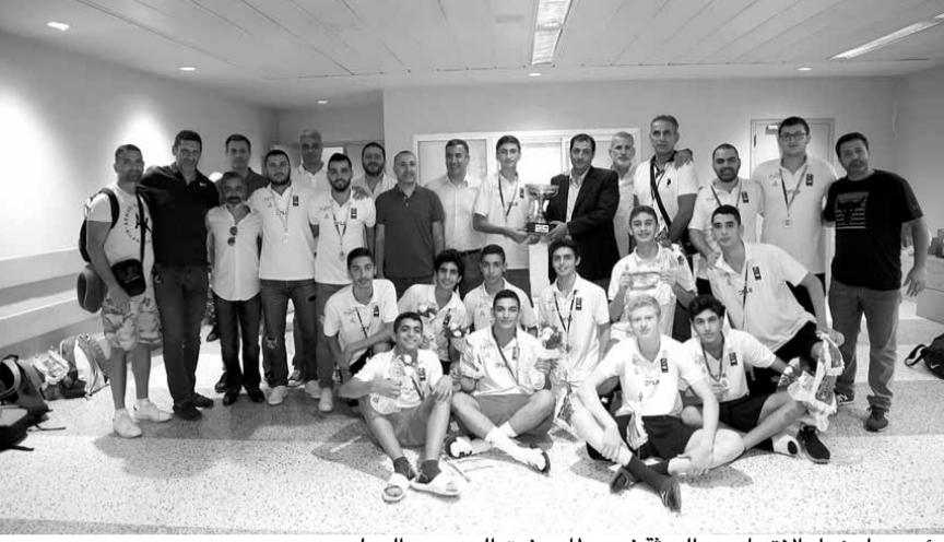
رئيس وأعضاء الاتحاد مع البعثة في مطار رفيق الحريري الدولي