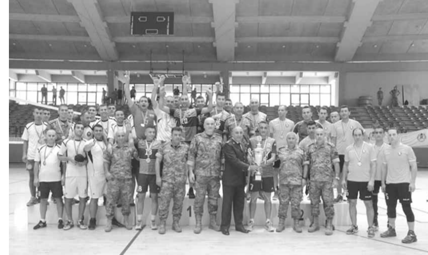
فريق المركز العالي بطل الكرة الطائرة