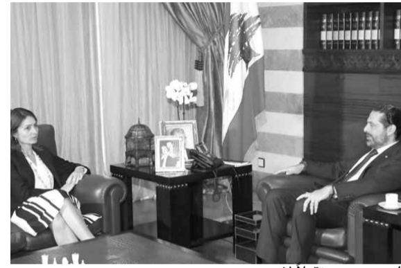
الحريزي مستقبلاً لاسن

استقبل رئيس الحكومة المكلف سعد الحريزي ظهر امس في «بيت الوسط»، سفيراً الاتحاد الأوروبي كريستينا لاسن، وعرض معها المستجدات والأوضاع العامة. واستقبل الحريزي، النائب انور الخليل الذي قال بعد اللقاء: «بحثنا في بعض الأمور العامة، لاسيما في موضوع تآليف الحكومة، وطماننا ان الأمور مسموكة».