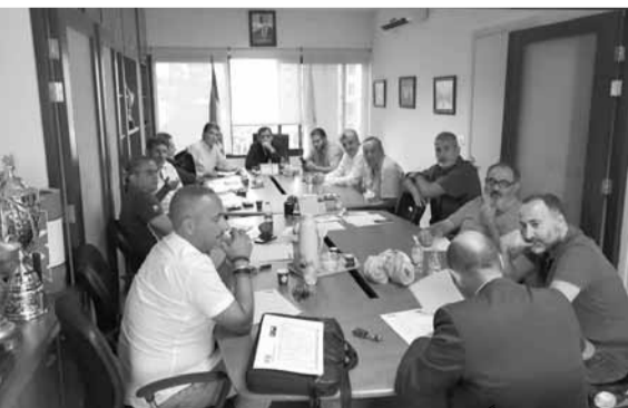
الحلبي مترسدا الاجتماع

إدارة «نيو لوك بروكشن» بودي معلولي. وتناول الاجتماع الشق المالي المتعلق بالنقل التلفزيوني وأمور تتعلق ببطولتي لبنان للدرجة الأولى (رجال وسيدات). واستقر الحاضرون من رئيس الاتحاد حول عدد من المواضيع