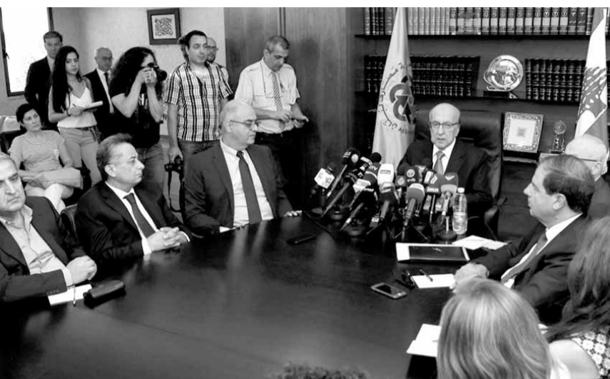
طرييه خلال المؤتمر

وختم: «إن القطاع المصرفي اللبناني لا يزال يتمتع بمناعة واسعة في وجه التحديات الداخلية والخارجية، وبقدرة واضحة على التكيف مع أصعب الظروف السياسية والأمنية والاقتصادية وأكثرها تعقيداً».