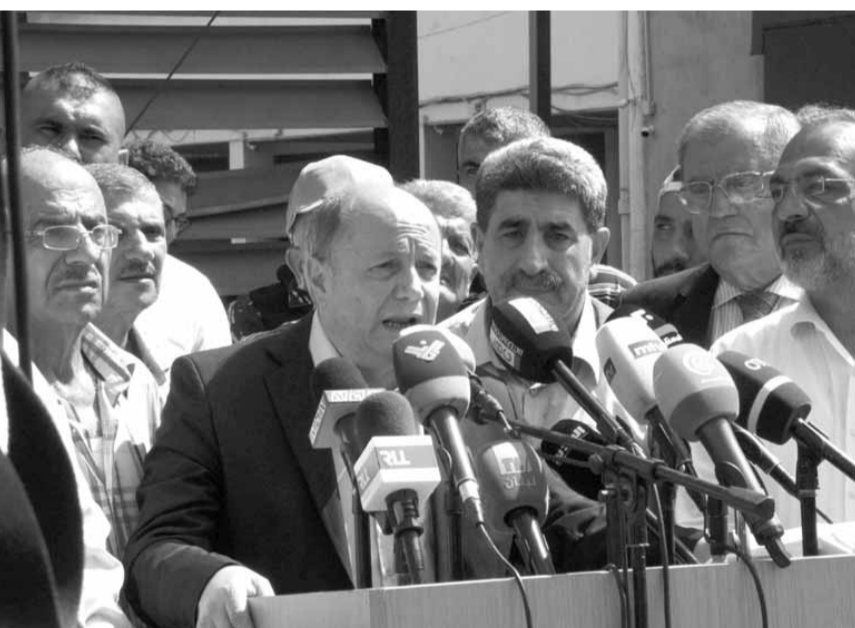
الاسمر وطلبيس يعلنون استمرار التحرك

بدوره تحدث رئيس الاتحاد العام لنقابات السائقين وعمال النقل مروان فياض أمام مصلحة تسجيل السيارات في صيدا احتجاجاً على عدم تنفيذ مطالبهم، وسط انتشار العناصر من قوى الأمن الداخلي أمام المركز في محيطه، من دون أن يؤثر الاعتصام على سير العمل في المركز.