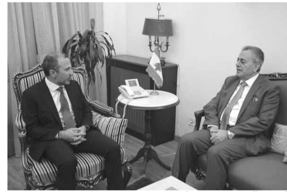
السفير السوري يزور باسيل

أكد سفير سوريا في بيروت علي عبد الكريم علي، أن «الحكومتين اللبناني والسورية تتكاملان عبر وزارتي الخارجية وسفارتي البلدين في ملف النزوح، مشدداً على أن سوريا ترحب بعودة أبنائها إلى وطنهم الأم ومرحباً بالمبادرة الروسية في هذا المجال، ومشدداً على أن سوريا ترفض ما تريد في شأن عودة العمل بمعبر نصيب».