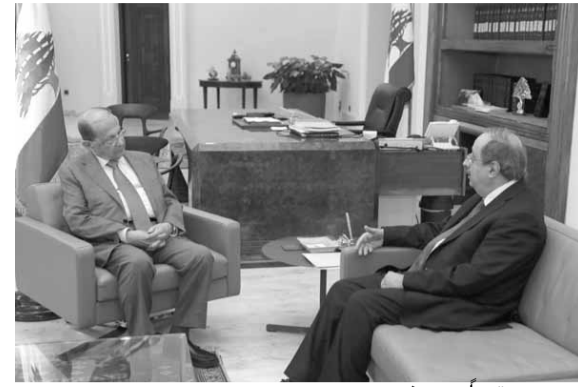
عون مجتمعاً مع مخبير

استقبل رئيس الجمهورية العماد ميشال عون في قصر بعبدا، النائب السابق غسان مخببر، وعرض معه شؤوناً عامة ومشاريع تهم منطقة المزة الشمالي، لاسيما ما يتصل منها بالمسائل البيئية. وعرض الرئيس عون مع وفد من الرابطة المارونية في أستراليا برئاسة الدكتور انطون الهاشم، وأوضاع اللبنانيين والمتحدرين من أصل لبناني هناك. وقال