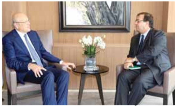
ميقاتي مجتمعاً مع فوشيه

استقبل الرئيس نجيب ميقاتي سفير فرنسا برونو فوشيه في مكتبه، وعرض معه التطورات الراهنة والعلاقات اللبنانية - الفرنسية.