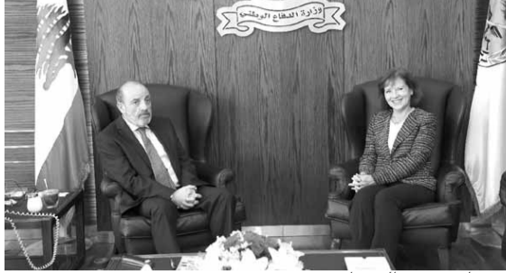
ريتشارد تزور الصراف

استقبل وزير الدفاع الوطني في حكومة تصريف الاعمال يعقوب رياض الصراف، في إطار التهنئة بعيد الجيش، السفيرة الأميركية الزبابت ريتشارد التي اكدت «دعم بلادها للمؤسسة العسكرية».