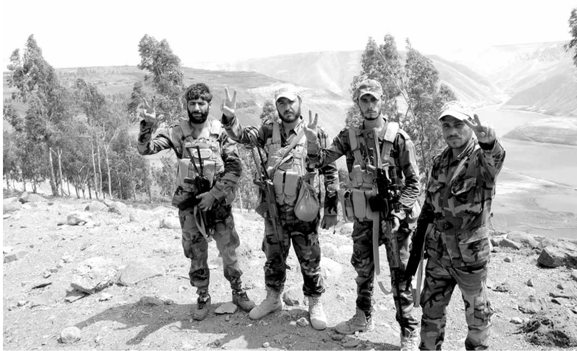
جنود سوريون في وادي اليرموك يرفعون شارة النصر

يذكر أن «هيئة تحرير الشام» (جبهة النصرة) خارج التشكيل المعلن.