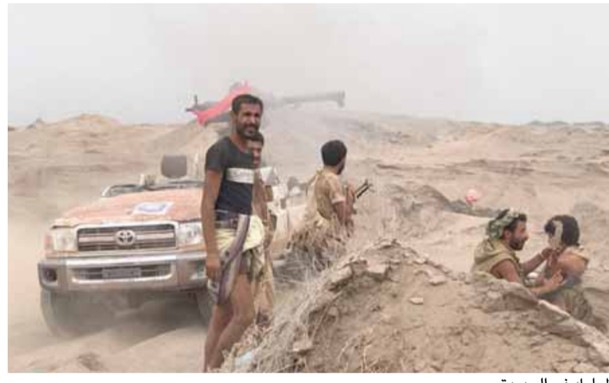
المعركة في الحديدة

أكد أنور قرقاش وزير الدولة الاماراتي للشؤون الخارجية ان العملية التي تشنها القوات الموالية للحكومة اليمنية للسيطرة على ميناء الحديدة، غرب البلاد ستستمر لحين «الانسحاب غير المشروط» للحوثيين.