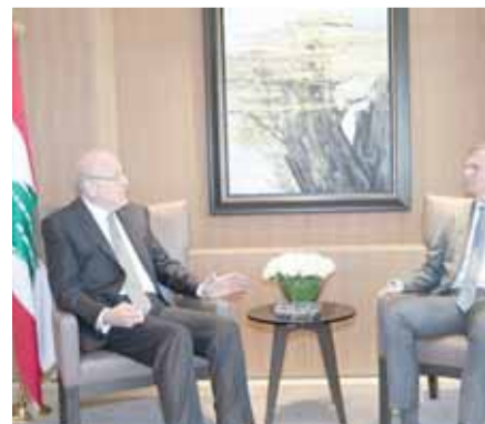
الرئيس ميقاتي مستقبلا شورتز

الرئيس ان تكون له، كما دائما، مواقف داعمة للقضية الفلسطينية وعروبة القدس وحق العودة. كذلك تطرق البحث الى موضوع البوابات الالكترونية الموضوعية عند مداخل مخيم عين الحلوة والاعتراضات عليها..