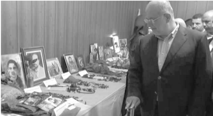
رعد يجول في قاعة الشهيد حسن شري

لها في أوانها وفق برنامج نضع له أولوياته، وتقدر المصلحة في تبني الخطوات فيه، ورهاننا على حضور أهلنا ومواكبتهم ونباتهم ونصرتهم للحق، لا سيما وأنهم لم يخذلوا هذه المسيرة في يوم من الأيام، وإن شاء الله ستكون معا بلوغ أهدافنا كاملة».