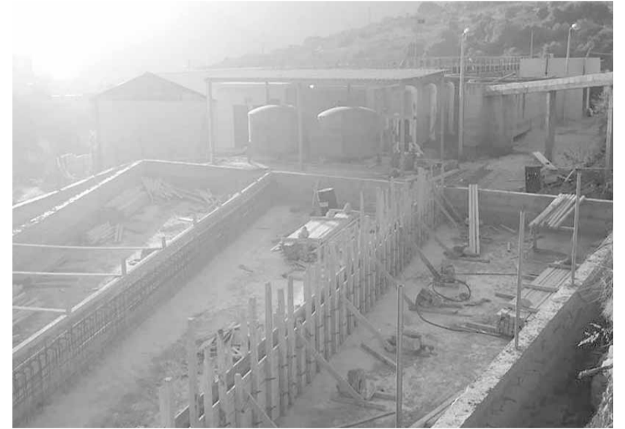
توسيع محطة التكرير