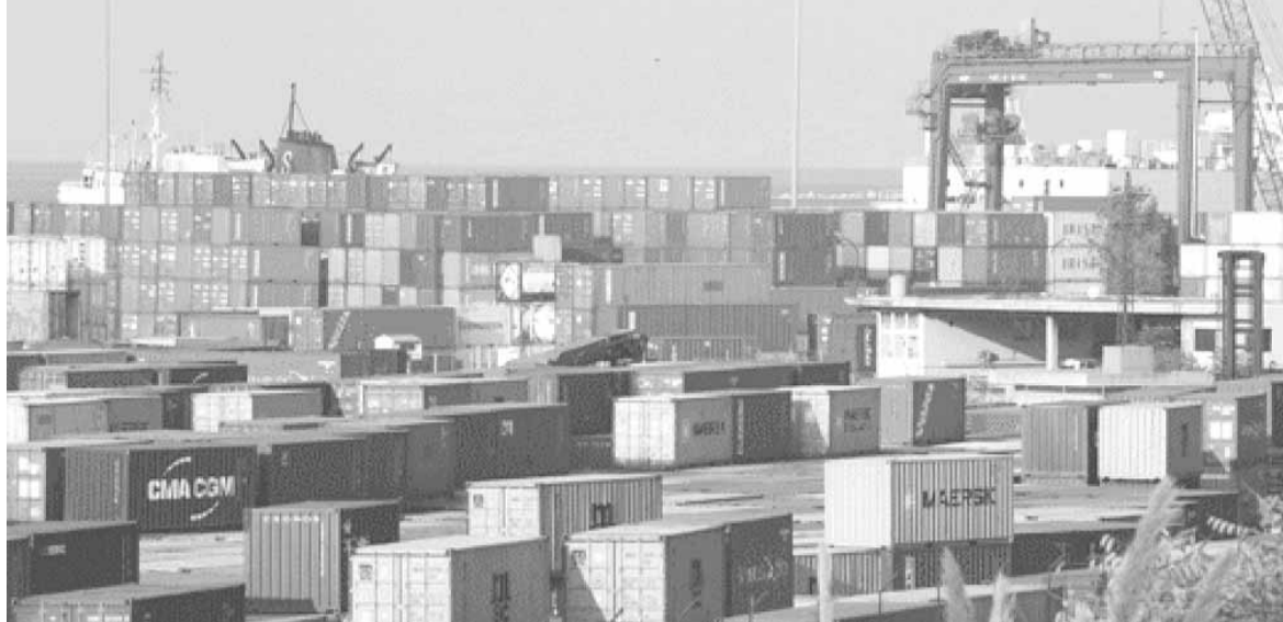
الصادرات اللبنانية عبر مرفأ بيروت

احتلت استيرادات الآلات للصناعات الغذائية المرتبة الأولى، إذ بلغت قيمتها ٣,٤ مليون د.أ. وتصدرت إيطاليا لأحة البلدان المصدرة لهذا المنتج إلى لبنان إذ صدرت ما قيمته ١,٣ مليون د.أ. تليها استيرادات الآلات لصناعة المطاط واللداين بقيمة ٢,٨ مليون د.أ. واحتلت ألمانيا صادرة الدول المصدرة لهذا المنتج بقيمة ١,٣ مليون د.أ. فالآلات لصناعة الورق والكرتون بقيمة ٢,٢ مليون د.أ.