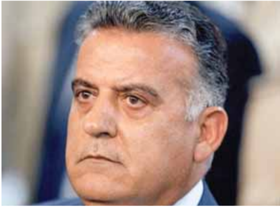
اللواء عباس ابراهيم

سقطت تونس في الوقت القاتل امام انكلترا (٢ - ١) بعد ان قدم المنتخب التونسي عرضا جيدا فيما فازت بلجيكا على بنما (٣ - ٠) والسويد على كوريا الجنوبية (٠ - ١) ويلعب اليوم المنتخب المصري مع روسيا حيث سيشارك النجم المصري محمد صلاح منذ بداية المباراة كما تلعب كولومبيا ضد اليابان وبولندا ضد السنغال.