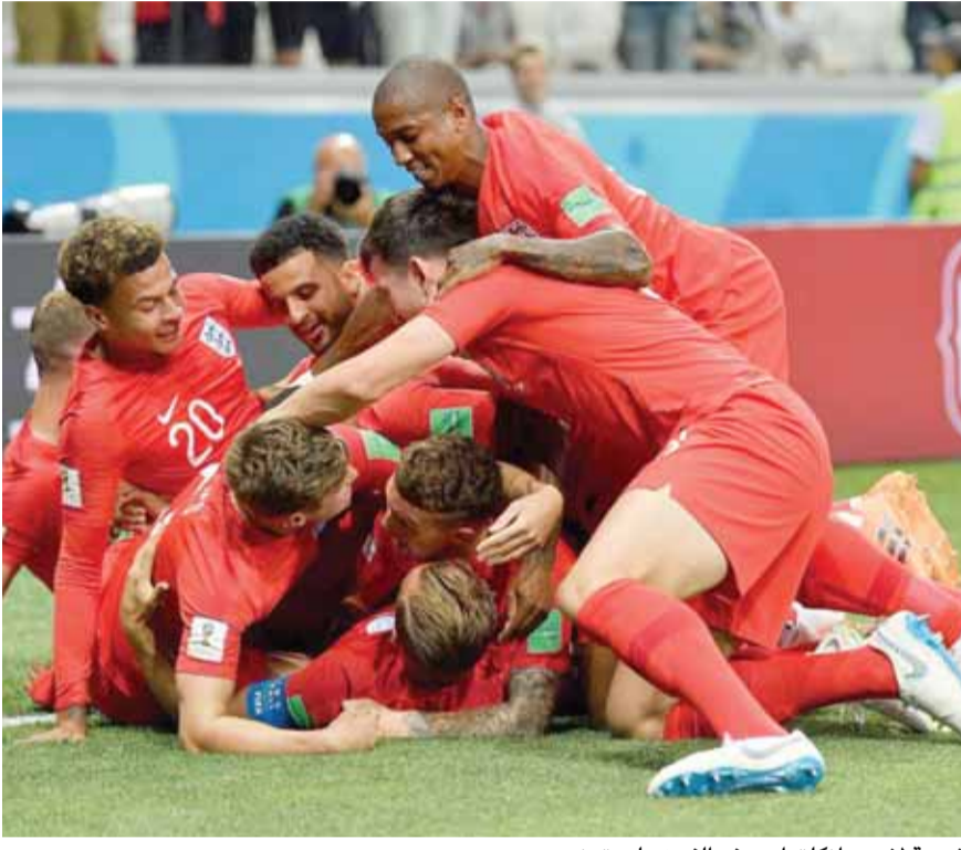
فرحة لاعبي انكلترا بهدف الفوز على تونس

سقطت تونس في الوقت القاتل امام انكلترا (٢ - ١) بعد ان قدم المنتخب التونسي عرضا جيدا فيما فازت بلجيكا على بنما (٣ - ٠) والسويد على كوريا الجنوبية (٠ - ١) ويلعب اليوم المنتخب المصري مع روسيا حيث سيشارك النجم المصري محمد صلاح منذ بداية المباراة كما تلعب كولومبيا ضد اليابان وبولندا ضد السنغال.