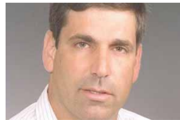
الوزير الإسرائيلي المعتقل غونين سيجيف

قالت إسرائيل إنها وجهت اتهامات للوزير الإسرائيلي السابق غونين سيجيف بالاشتباة بتجسس لصالح إيران.