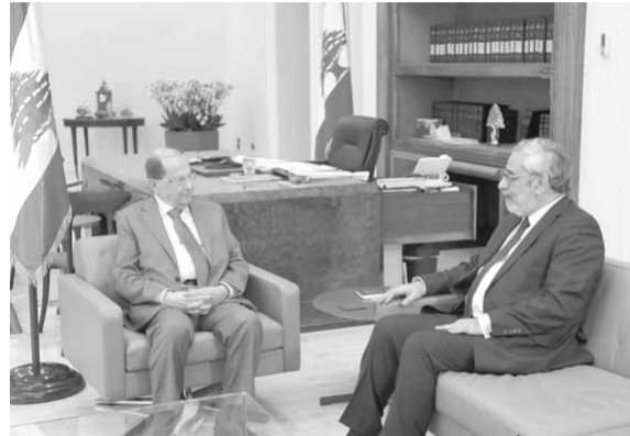
عون مجتمعاً مع بقرادونيان (الداخلي ونهرا)

وفي مستهل اللقاء، القي كاهن الرعية الخوري الياس الحلو كلمة، ورد رئيس الجمهورية بكلمة رحب فيها بالوفد، وشدد على ان «كل انسان ينسب جذوره بغدو كاشجرة المقطوعة التي مصيرها البياس»، متمنيا على الجميع «الانسوا جذورهم ويؤدوا واجبههم تجاه ارضهم واهلهم». واستذكر الرئيس عون «الماسي والالام التي عاشها ابناة المنطقة، خصوصاً ابان مجازر ١٨٦٠، إذ انني متحدر من عائلة سقط منها شهداء كثر خلال هذه المجازر ولم تنج منها الامراة حامل تحدر منها جد العائلة».