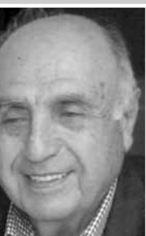
اعداد: لوران ناكوزي