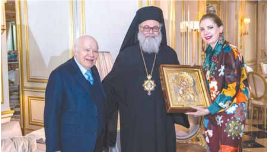
اليازجي يقدم لفارس وعقيلته ايقونة الرجاء من التراث الاورثوذكسي المشرقي في منطقة الشرق الأوسط. وخلال اللقاء قدم اليازجي لفارس ايقونة الرجاء من التراث الاورثوذكسي المشرقي.

اقام نائب رئيس مجلس الوزراء الاسبق عصام فارس لقاء تكريمياً للبطريرك يوحنا العاشر اليازجي، بطريرك الروم الاورثوذكس، تخلته مادبة عشاء في دارته في باريس حضرها، الى البطريرك اليازجي راعي أبرشية فرنسا للروم الاورثوذكس المطران اغناطيوس الحوشي، والمعتمد البطريركي في الامارات والخليج غريغوريوس خوري، وعدد من الكهنة مرافقي البطريرك اليازجي، وعقيلة فارس السيدة هلا ونجله نجاد، ومدير مكتبه العميد وليام مجلي وأصدقاء.