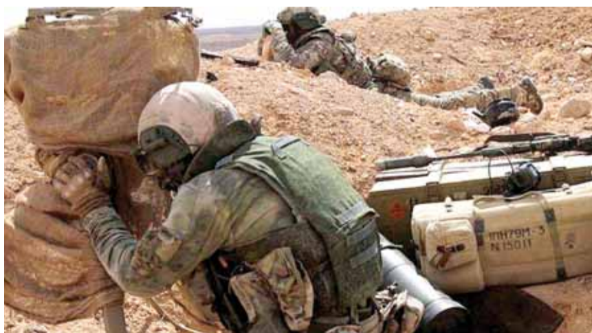
جنديان روسيان خلال المعارك في دير الزور

شن تنظيم الدولة الاسلامية الارهابي هجوما على دير الزور في شرق سوريا استشهد خلاله على الأقل ٢٦ مقاتلا من قوات النظام السوري اضافة الى تسعة مقاتلين روس، وفق ما افاد المرصد السوري لحقوق الانسان. فيما ذكرت وكالة سانا ان الجيش السوري والمقاتلين الروس صدوا الهجوم وسقط لارهابيين ٤٦ قتيلاً. كما افاد المرصد السوري