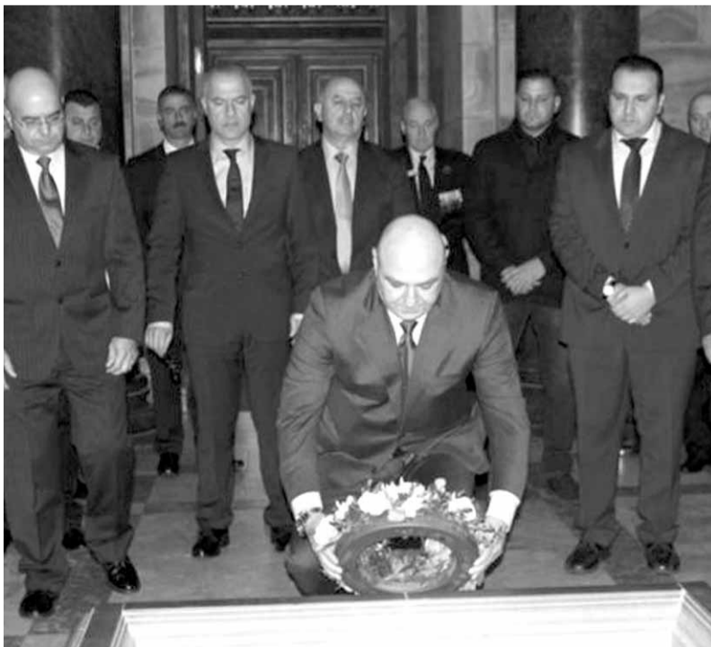
قائد الجيش يضع إكليلاً من الزهر على ضريح الجندي المجهول