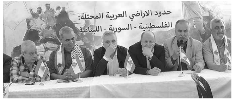
اجتماع الاتحاد العمالي في الجنوب

هنا جرحر العسكري الصهيوني أنياله خائباً منكسراً لأول مرة في تاريخ حروبه مع العرب. هنا قدم المقاومون والمجاهدون أمثولات البطولة والتضحية دفاعاً عن الارض والكرامة والسيادة والاستقلال الحقيقي. هنا نحن نحفل اليوم بعيد النصر والتحرير على هذه الارض المحررة والمقدسة، على نخوض فلسطين الجريحة وشعبها المقاوم، نحفل آمنين مطمئنين بفضل الشهداء الذين افتدوا ارضنا وكرامتنا وامناً ومستقبل اجيلنا من اقصى الجنوب الى اقصى الشمال. ونحن في الاتحاد العمالي العام الذين