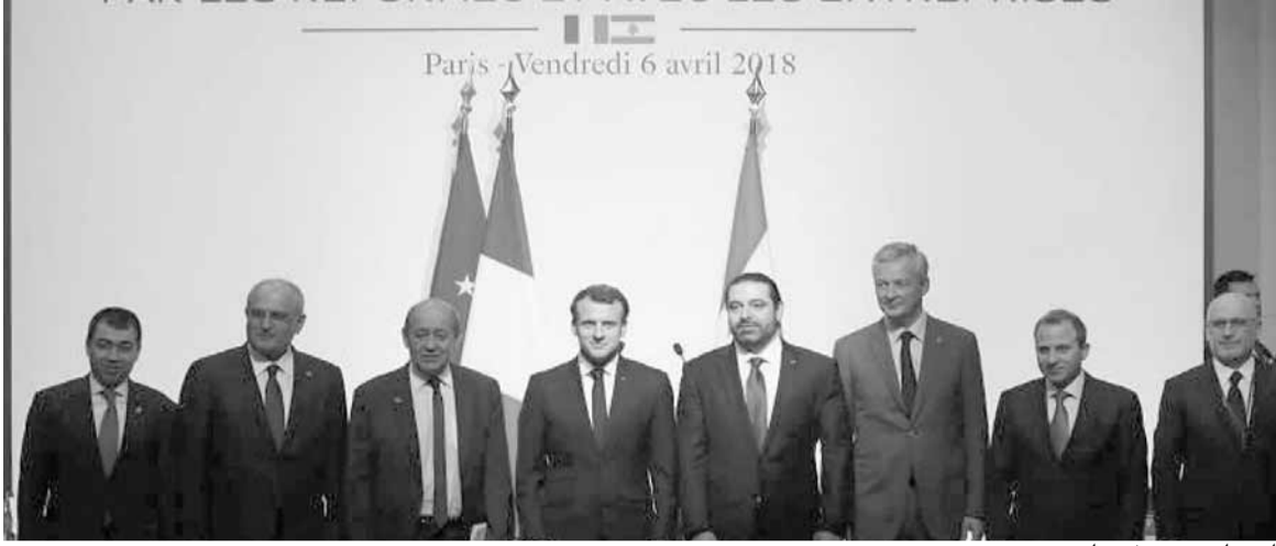
اجتماع سيدر في باريس

تنتقل اليوم مرحلة تشكيل الحكومة الجديدة برئاسة سعد الحريري وسط «الغام» كبيرة ومطبات لا يعرف كيفية الخروج منها لا سيما وانها مطلوبة بالكثير من الاستحقاقات. وبغض النظر عن المطالب السياسية و«الطمع».. بحقائب وزارية لهذه الكتلة او تلك، فان هذه الحكومة مطالبة بمعالجة الملفات الإقتصادية والإجتماعية الداهمة تبدأ بوضع مؤتمر سيدر موضع التنفيذ وتنفيذ وتحديث البنية التحتية وما ينتج عن ذلك من تحسن في الوضع الإقتصادي.