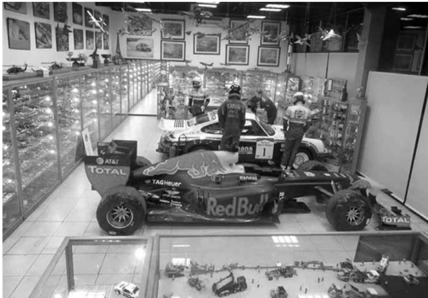
جانف من المتحف الرياضي الفريد من نوعه في العالم

السيارات، ونحو ٥٥٠ مجسم لآمنان زارها كرم وحلبات سباق سيق ولعب عليها. متحف بيلي كرم يقول لنا باختصار رياضي، إن السباقات تدور فقط في الحلبة وليس في الساحات والشوارع، وجوهر إنسانيته يجبرنا الكثير عن قصة رجل لا يلبق به سوى