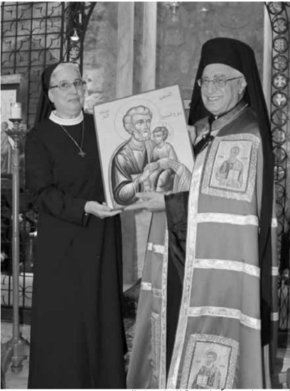
الاخت وازن تقدم ايقونة للبطريك العبيسي

أكد بطريك أنطاكيا وسائر المشرق للروم الكاثوليك يوسف العبيسي، خلال زيارته الراهوية الاولى الى مدينة صيدا، أن «الجمال اللبناني الفريد ليس جمالاً وحسب بل هو رسالة للعالم تعلن أن العيش معاً في وطن واحد ممكن بل هو مطلوب ولو بلغ حد التحدي، ولو عكس صفوه معك في بعض الأحيان، بسبب ضعفنا البشري، لقناعتنا بأن الثنائي والتجافي لا يقودان إلا إلى الانتحار والموت إذ ينافيان إرادة الله الحي الواحد الذي يعيده الجميع»، لافتاً إلى أنه «يطيب لي في هذا الصدد أن أنقل إليكم مقطعاً من الرسالة التي بعثت بها الفاتيكان إلى المسلمين بداعي شهر رمضان «إننا إذ نعترف بما نشترك فيه ونظهر الاحترام لاختلافاتنا المشروعة يمكننا أن نرسخ مزيد من الحزم أساساً سلمتنا لعلاقات سلمية وأن نتنقل من المناخسة والمواجهة إلى التعاون الفعال من أجل الصالح العام».