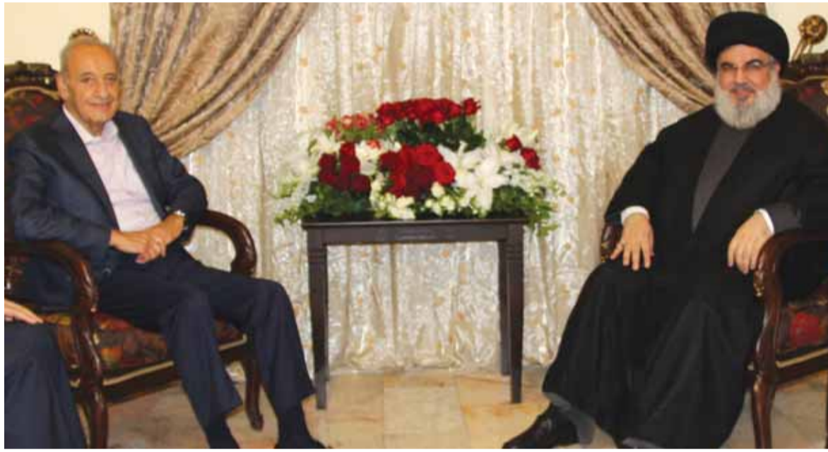
خلال اجتماع بري ونصرالله