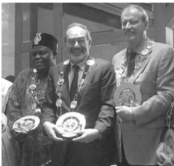
...وكرمأ في مقر الأمم المتحدة