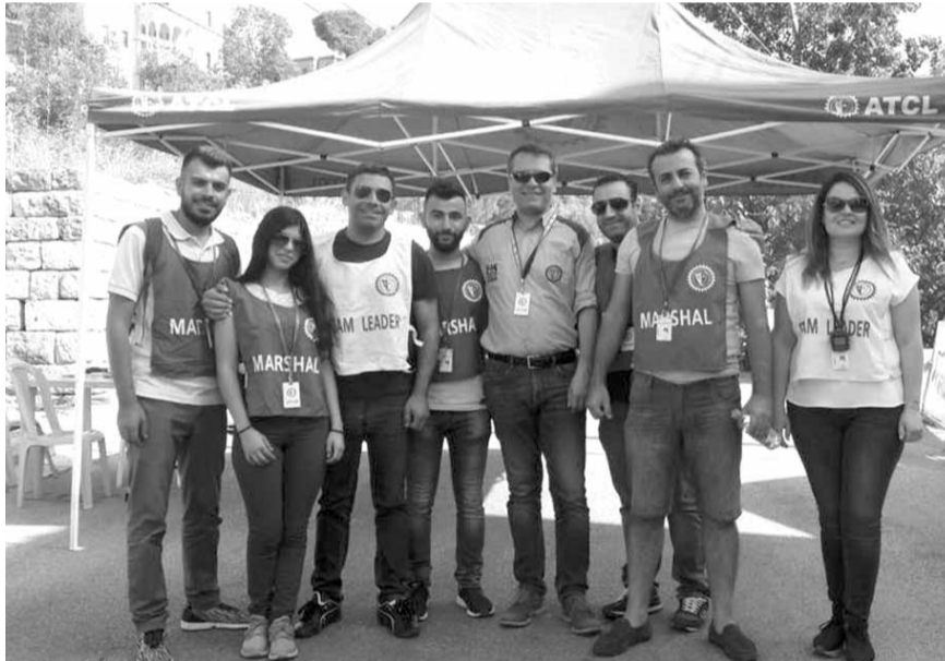
مسؤولو المرحلة الخاصة الأولى

انطلق بعد ظهر أمس السبت رالي جزين السنوي السابع الذي ينظمه النادي اللبناني للسيارات والسياحة (ATCL) على مدار يومين في محافظة الجنوب برعاية اتحاد بلديات جزين وبمشاركة ٢١ سيارة. ويندرج الرالي في إطار الجولة الثانية في بطولة لبنان للرابيات الجاري بعد رالي الربيع. تبلغ المسافة الإجمالية للرالي ٣١٢,٨٨ كلم منها تسع مراحل خاصة للسرعة ستقام الأحد ومرحلة استعراضية واحدة أقيمت السبت برعاية «سيلفر ستار» (SILVER STAR) حيث تبلغ مسافة المراحل العشر ١٣,٤٩ كلم.