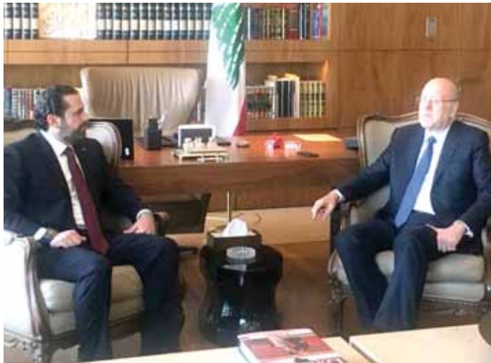
الرئيس ميقاتي مستقبلاً الحريري (التفاصيل صفحة ٢٠)

الله. كما تم التوافق على شتورة بعلبك الهرمل هي من مسؤولية الجيش اللبناني وان الامن في مدينة بعلبك ومدينة الهرمل هو من مسؤولية الجيش اللبناني أياً تكن الحوادث والاشتباكات التي تحصل بين العشائر وهنا لا يجب ان يتدخل حزب الله وفق الاتفاق مع الجيش اللبناني كما ان طريق بيروت صيدا صور كذلك مدينة النبطية حتى مرجعيون هي مسؤولية الجيش اللبناني دون تدخل لحزب الله كذلك منطقة البقاع الغربي وان الجيش يحفظ الامن في هذا المناطق دون أي تدخل بين صلاحياته ووجود المقاومة ويعني حزب الله وسيتم العمل بالاتفاق الذي تم التوصل اليه ابتداء من ١٥ حزيران ٢٠١٨.