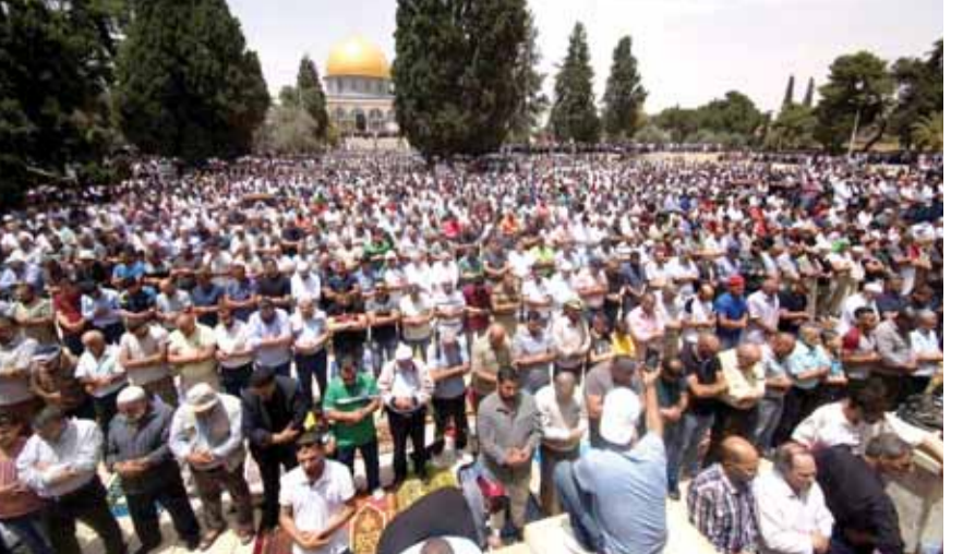
المصلون في الاقصى (التفاصيل صفحة ٢٠)

الله. كما تم التوافق على شتورة بعلبك الهرمل هي من مسؤولية الجيش اللبناني وان الامن في مدينة بعلبك ومدينة الهرمل هو من مسؤولية الجيش اللبناني أياً تكن الحوادث والاشتباكات التي تحصل بين العشائر وهنا لا يجب ان يتدخل حزب الله وفق الاتفاق مع الجيش اللبناني كما ان طريق بيروت صيدا صور كذلك مدينة النبطية حتى مرجعيون هي مسؤولية الجيش اللبناني دون تدخل لحزب الله كذلك منطقة البقاع الغربي وان الجيش يحفظ الامن في هذا المناطق دون أي تدخل بين صلاحياته ووجود المقاومة ويعني حزب الله وسيتم العمل بالاتفاق الذي تم التوصل اليه ابتداء من ١٥ حزيران ٢٠١٨.