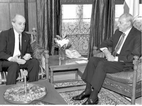
بري مجتمعاً مع سفير إسبانيا (حسن إبراهيم)

استقبل رئيس مجلس النواب نبيه بري في عين التينة قبل ظهر امس السفير الإسباني خوسيه ماريَا فيري الذي نقل له دعوة رسمية من رئيس البرلمان الإسباني لزيارة إسبانيا، وكانت مناسبة للبحث في التطورات.