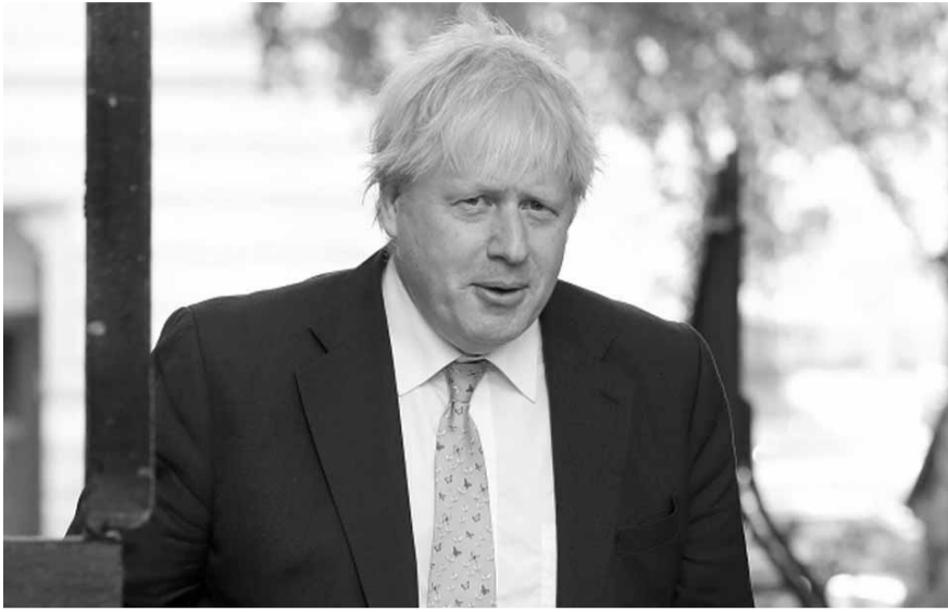
وستواصل تضيق الخناق على بعض الأثرياء المحيطين ببوتين». ووصف جونسون العقوبات المفروضة على الأثرياء الروس بأنها كانت مفيدة جداً، وأضاف: «إذا أقيمت حجارة في حي

هذا العام ٢٠١٨، ومزّح الرجل الذي انتحل شخصية باشينيان حول أنه يأمل ألا يُسمّمه الرئيس الروسي بعامل الأعصاب نوفيتشوك». وقد أثارت تعليقاته ضحكات جونسون الخافتة، والذي بدوره اعترف بأن الملكة المتحدة «كانت توضح تأمل في التمتع بعلاقات أفضل من تلك الموجودة حالياً» مع روسيا.