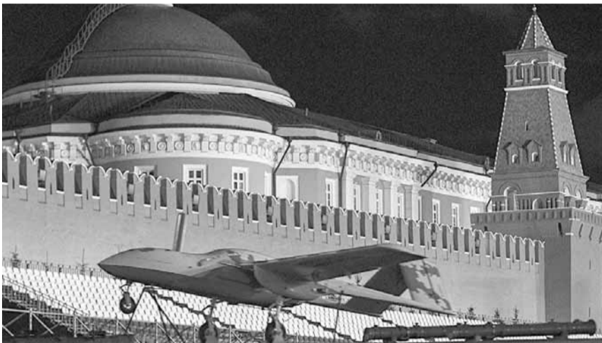
ستكون أول طائرة هجومية بدون طيار «كورسار» قادرة على منافسة الطائرات الأميركية والصينية والإسرائيلية في الأسواق العالمية.

ونشرت صحيفة «Military Watch» أن الطائرة التي عرضت لأول مرة في العرض العسكري في عيد النصر «كورسار» مصممة من مواد مركبة، وهذه أول طائرة حربية وزنها ٢٠٠ كغ وياع جناحها ٦ ونصف متر. وتستطيع أن تكون هذه الطائرة هجومية باستخدام الصواريخ الموجهة