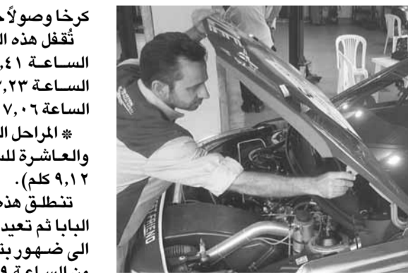
خلال الفحص التقني

تنطلق هذه المرحلة من عازور نزولاً إلى البابا ثم تعيد، صعوداً باتجاه بتدين وصولاً إلى شهور بتدين اللقش. تُقفل هذه الطريق من الساعة ٧،٣٩ حتى الساعة ١٠،٠٩ ومن الساعة ١١،٢١ حتى الساعة ١٣،٥١ ومن الساعة ١٥،٠٤ حتى الساعة ١٧،٣٤. وستدخل السيارة الأولى إلى ساحة جزيّن غدا الأحد معلنةً انتهاء رالي جزيّن السابع عند الساعة ١٧،١٥. ويحيط سباق حفل التتويج. وسيقام مركز التجمع ومنطقة الخدمة في ساحة جزيّن من اليوم السبت الساعة ١٣،٣٠ ظهرًا حتى مساء الأحد الساعة ٢٠،٠٠. وحُدّد مركز قيادة الرالي في مقر بلدية جزيّن. هذا وجرت عملية التحديق الإداري والفحص التقني في «سيلو موتورز» (برمانا) مساء الخميس الفائت.