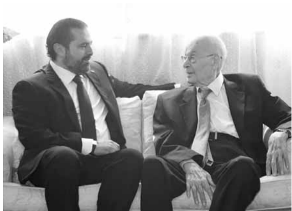
الحريري عند الحص

الذي هو الاساس في توفير فرص العمل للشباب والشابات، والان لدينا فرصة تاريخية في تطبيق مؤتمر «سيدر».