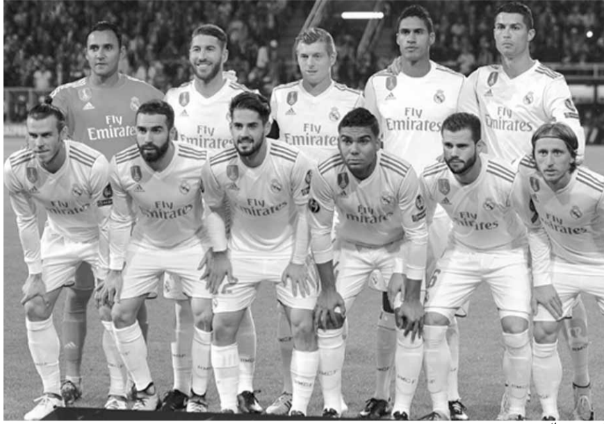
فريق ريال مدريد

من أحرز اللقب كلاعب (عام ٢٠٠٢ مع ريال بالذات) ومدرّب، أن يعزز هذا الإنجاز بلقب ثالث على التوالي. ويرى مواطن زيدان وقلب دفاعه رافايل فاران أنه «سبق أن صنعنا التاريخ (بلقب ثان على التوالي)، ونريد المواصلة. سيكون شيئاً مذهلاً. لا اعتقد أننا نعي حتى الآن حجم ما نقوم به، لكن عندما ينتهي كل شيء سندرك ذلك». وواصل: «من خلال التجربة التي نملكها، ندرك حجم الصعوبة التي نواجهها، لكن الخبرة تمنحنا المزيد من الأمان والاطمئنان أيضاً».