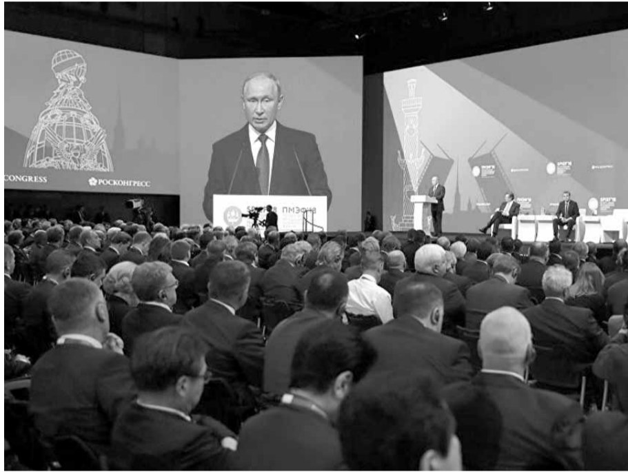
أكد الرئيس الروسي فلاديمير بوتين أن روسيا غير مهتمة بنمو أسعار النفط دون قيود، مشيراً إلى أن «سعر ٦٠ دولارا للبرميل الواحد مناسب لنا».

الطائرة «كورسار» هي مروحية بدون طيار وهذا يقلق المحللين الأجانب. المروحية بدون طيار قد تكون أيضا من الطائرة بدون طيار العادية ولكنها قادرة على العمل بعيدا عن