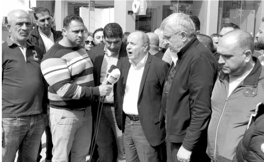
الاسمر خلال إحدى التظاهرات

ويقول رئيس الاتحاد العمالي العام بشارة الاسمر ان التطبيق أخذ وقتاً طويلاً ولكن في النهاية دخلنا في حلول لموظفي الكهرياء والمياه وهناك بداية حل للمستشفيات بعد صدور المرسوم المتعلق بهم من مجلس الوزراء.