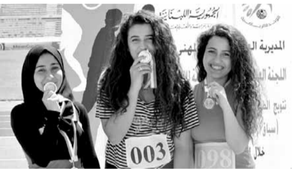
بطلات إحدى الفئات