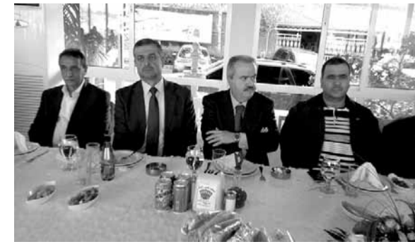
الراعي مجتمعاً مع جنبلاط

وانتصاخا ان يحرر لبنان من الازهاق ويجمي حدوده بالتعاون مع الجيش اللبناني»، داعيا ايضا «الى الاقتراع بكثافة في ٦ ايار، لاننا بحاجة للذهاب الى المجلس النيابي المقبل والحكومة التي سنتبنيق منه بكتلة كبيرة، لكي نكون شركاء حقيقيين في صناعة القرار السياسي في المرحلة