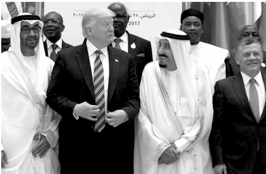
الرياض، ٢٥ أبريل ٢٠١٧

ومن هنا نحن نرى ان الحكمة في السياسة الأميركية هي الضغط على قطر كي تدفع الاموال من اجل تنفيذ المشروع الأميركي الكبير في الشرق الاوسط طالما انني مضطر لكشف سر هو ان ترامب ومحادثاته مع ولي العهد سمو الامير محمد بن سلمان ابلغه ان الولايات المتحدة لا تريد ان تترك الساحة الى روسيا، وانها تريد ان يسيطر النفوذ الأميركي في الخليج