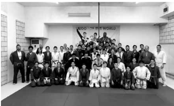
فريق الجودو اللبناني

يتابع فريق الجودو استعداداته مع المدرب البرازيلي غيريال فيسنتيني الذي استقدمه الاتحاد اللبناني للجودو وفرعه منذ اكثر من اسبوع للقيام بتدريب الفريق استعداداً للمشاركة في بطولة اسيا للجودو الذي ينظمها الاتحاد برعاية رئيس الجمهورية العماد ميشال عون اعتباراً من ١٠ الى ١٣ ايار القادم بمشاركة ٤٧ دولة اسبوية. كما يواصل المدرب تدريب الفريق المشارك يومياً الساعة السادسة صباحاً والساعة السابعة مساءً وذلك في مقر الاتحاد المؤقت بنادي بوا-ادما. ودعا الاتحاد كافة الاندية واللاعبين الى حضور فعاليات هذه البطولة والتي تشجيع اللاعبين واضفاء جو من الحماس والندية على منافسات هذه البطولة.