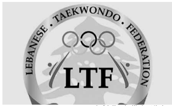
شعار الاتحاد اللبناني للتايكواندو

لتحقيق الهدف الاساسي للاتحاد وهو بناء مجتمع أفضل.