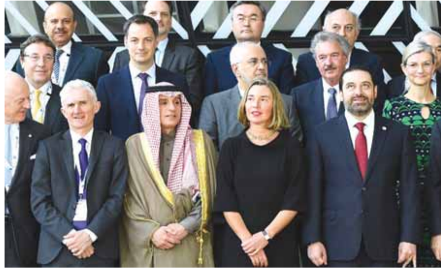
المشاركين في مؤتمر بروكسل

النيابية... اما الملف البارز الذي جاء من خارج السياق فهو اعلان مدعي عام باريس فرنسوا مولان وجود معلومات استخباراتية عن تورط عشرات اللبنانيين بعملية تمويل تنظيم «داعش»، وقد تبين وجود «تقصير» مقصود من رئاسة الحكومة لمصالح انتخابية. وفي هذا السياق، اعلنت السلطات الفرنسية انها تعرفت الى مئات ممن شاركوا في تمويل «داعش» في فرنسا وفي الخارج، والخطر، تأكيد المدعي العام ان الأجهزة الامنية، رصدت ٣٢٠ يجمعون الاموال لجماعات متشددة، مشيراً الى ان هؤلاء «متمركزون بشكل خاص في تركيا ولبنان»، ويستخدمون ثغرات في نظام الحوالات المالية الذي يسمح بإرسال الاموال سريعاً إلى شخص آخر، لتمويل الاسلاميين المتطرفين الذين يقاتلون في العراق وسوريا. ووفقاً لوساط ديبولماسية في بيروت، حصل