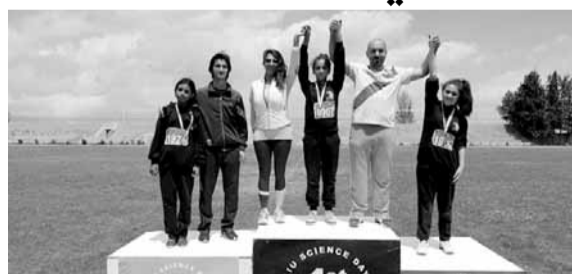
نتيجة إحدى الفئات

اختتمت على إستان جمال عبد الناصر في بلدة الخيارة البقاعية، بطولة اللياقة البدنية في محافظة البقاع، ضمن دورة الألعاب الرياضية المدرسية التي تنظمها وحدة الأنشطة الرياضية والكشفية في وزارة التربية والتعليم العالي، بإشراف مندوبة