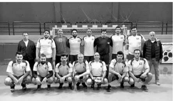
فريق فوج الاطفاء

استعاد فريق فوج الإطفاء بيروت حامل اللقب توازنه وحقق فوزه الخامس هذا الموسم على حساب ضيفه الجمهور بنتيجة ٣٩-٢٥ (الشوط الأول ٢٠-١٣)، في المباراة التي اقيمت بينهما في قاعة حاتم عاشور لنادي الصداقة، في افتتاح مباريات المرحلة السابعة (الثانية اياً) من بطولة لبنان في كرة اليد.