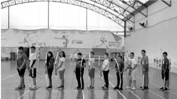
لقطة من المنافسات

نظم الاتحاد اللبناني للقوس والنشاب المرحلة الاولى من بطولة لبنان العامة داخل القاعة وذلك على ملاعب الوحدة الرياضية في بئر حسن. حضر المباراة رئيس الاتحاد اللبناني ونائب رئيس الاتحاد الأوروبي جاك تامر. جرت الرمزية على مسافة ١٨ متراً وعلى مرحلتين: الذهب والياق بمشاركة لاعبين من كل من الاندية التالية: الشباب مارالياس - الرياضي - الجمهور - مون لاسال - المركزية جونيه - الفوز طرابلس - الصفا والسان جورج حمايلا. وقد تقرر إستكمال المرحلة الثانية (التصفيات) في موعد يحدد لاحقاً.