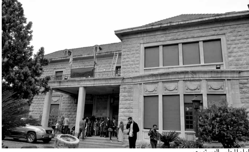
امام المجلس الدستوري

أصدر المجلس الدستوري، أمس، قراراً يحمل الرقم ٢٠١٨/١، تعليق المادة ٤٩ من قانون الموازنة العامة المطعون فيه. ونص القرار على ما يأتي: «المستدعون النواب: سامي الجميل، نديم الجميل، سامر سعاده، فادي الهجر، طلي ماروني، سـيـر جـورج، طورسر كسيان، ايلي عون، جيلبرت زوين، يوسف خليل ودوري شمعون. إن المجلس الدستوري الملتمخ في مقره بتاريخ ٢٦/٤/٢٠١٨ برئاسة رئيسه عصام سليمان وحضور نائب الرئيس طارق زياده،