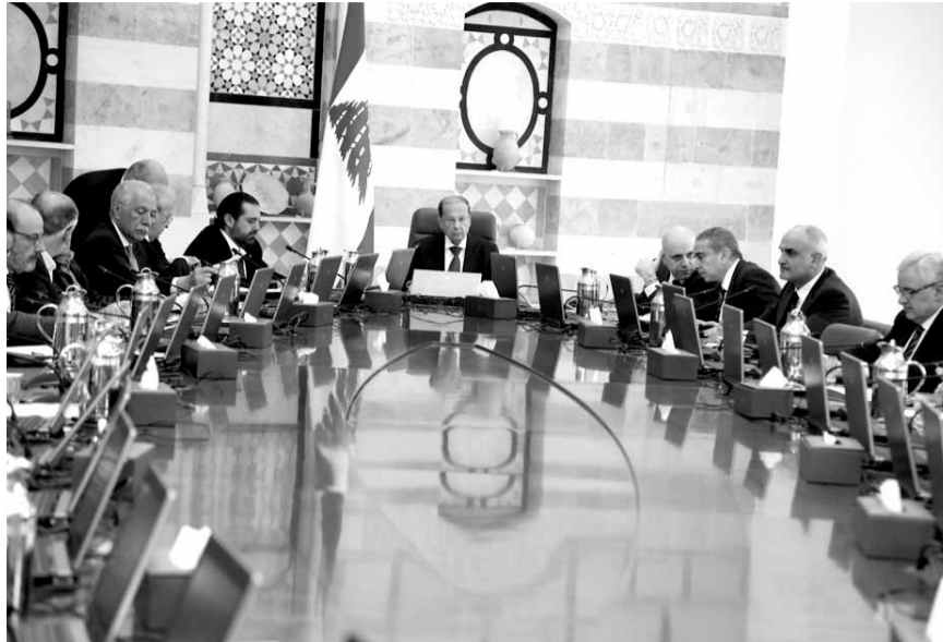
عون يتّراس الجلسة (الالاتي ونهرا)

البنانيين نبهت الى ضرورة تفادي كل ما يؤثر على خياراتهم وقناعاتهم من مغريات وممارسات تكثر هذه الايام. وانا اعرف من خلال معايشتي للحياة السياسية اللبنانية ان ثمة مظاهر موسمية نبهت اللبنانيين بالامس على عدم الاخذ بها.