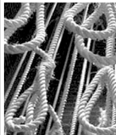
وانه يجب ترك هذا الامر حتى نهاية الحرب السورية.

ادانت المحاكم العسكرية السورية بشكل شفاف وواضح وقضائي ٦٠٠ مجرم حرب قاتل في الحرب السورية واعترف بانته قتل وذبج ضباط وجنود من الجيش السوري وصدرت احكام في حقهم باعدامهم رميا بالرصاص. والقرار هو امام الرئيس السوري الدكتور بشار الاسد، وقد علمت به دول اوربية وقام رؤساء دول اوربية سرا بارسال رسائل الى الرئيس الاسد يتمنون عليه فيها اعدام الـ ٦٠٠ مجرم حرب لان ذلك سيشكل اذى كبير الى سوريا في شأن اعدام ٦٠٠ مجرم حرب، حتى لو انهم قتلوا ضباطاً وجنوداً من الجيش السوري