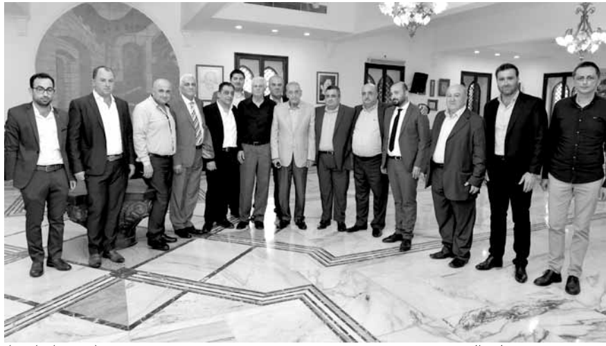
بري مع وفد من بلدة الصرْفند (حسن ابراهيم)

قال رئيس مجلس النواب نبيه بري، ان «الانتخابات النيابية بقدر ما تمثل محطة لتجديد الحياة السياسية في اي نظام في العالم، الا انها بالنسبة للبنان، الذي يجاور محيط اقليمي مشتعل بالازمات، هي أيضاً محطة يجب ان يقدم فيها اللبنانيون معاداة تقوم على ان اقصر طرق رسم معالم مستقبل الشعوب وتحقيق آمالها يكون من خلال صناديق الاقتراع وزيادة مساحات الديموقراطية وليس اي شيء آخر».