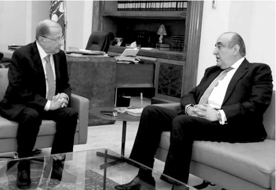
عون مجتمعاً بعبود (اللاتي ونهرا)

نتيجة الانتخابات النيابية المقبلة وتشكيل حكومة جديدة من شأنهما ان يوطدا هذا التوجه.