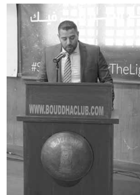
فرنسا جونيور سعادة يلقي كلمته