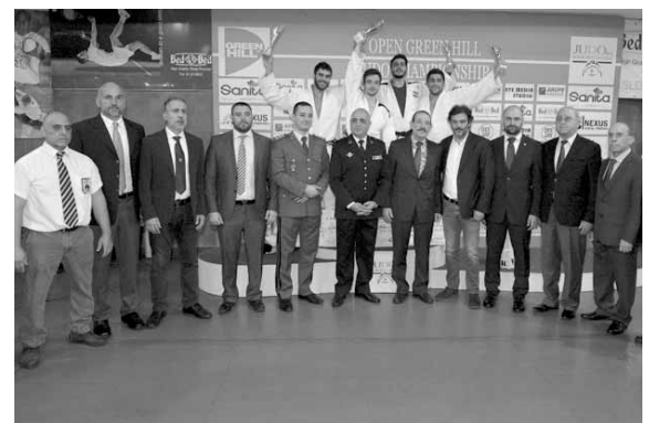
نتويج احدى الفئات