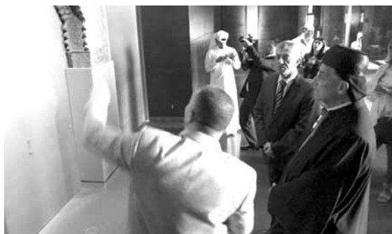
الراعي في المتحف

يعيشون فيه، يساهمون أيضا وبشكل كبير بنمو هذه الدولة وازدهارها على كل الأصعدة».