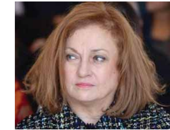
الرئيسة عادة عون

وعندما يصبح السيد المسيح الذي اعبدته واعتبره مرجعي الروحي والحياتي والابدي وكل ما يحصل معي بارادته وبارادة ربنا، كيف يصبح المسيح يا حضرة الرئيسة للمساومة وتقولين لي وقع على هذا الاعتذار وانسى الشيك عندي وبعد اشهر سأصالحك مع سركييس سركييس وتنتهي القضية. يا حضرة الرئيسة مضي عمري مر الزمن، شاهدت آلاف الجثث في لبنان شهداء في سبيل البقاء من اجل لبنان، تطوعت في الجيش لمدة ١٤ سنة وخاطرت في حياتي كطيار حربي الى اخر حد في وجه طيران العدو الاسرائيلي. ثم انتقلت الى رئاسة تحرير صحيفة واطلاقتها هي جريدة الديار، وقلت الحقيقة فيها، وعلى كل حال اترك الى الرأي العام اللبناني ان يحكم علي، فانا لست مخول ان اقول عن نفسي اي شيء.