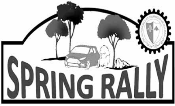
شعار رالي الربيع

ينظم النادي اللبناني للسيارات والسياحة (ATCL) رالي الربيع الرابع والثلاثين بعد غد الأحد في قضاء كسروان وجبيل. ويندرج هذا السباق في إطار الجسولة الأولى من بطولة لبنان للرياليات للعام الجاري. تبلغ المسافة الاجمالية للرالي ٣٢٨,٤٩ كلم منها ٩٢,٧٣ كلم طول المراحل الخاصة للسرعة وعدها ثمانين. ينطلق المتسابقون عند الساعة السابعة والنصف من صباح الأحد من كازينو لبنان. ■ المراحل الخاصة ■ وفي ما يلي المراحل الخاصة للسرعة: * المرحلة الخاصة الأولى، الرابعة والسابعة للسرعة: ١٥,٤٢ كلم. - نهر ابراهيم - مشان: تنطلق هذه المرحلة من نهر ابراهيم صعوداً مفترق بزحل باتجاه الشركة الفينيقية لقوات نهر ابراهيم لتوليد الكهرباء صعوداً الى فكري، مستديرة بير الهييت وصولاً الى مشان حيث نقطة التوقف قبل مفترق مشان، طريق فكري، قرطبا. تتقل هذه الطريق من الساعة ٠٦,٢٢ حتى الساعة ٠٩,٤٩ من الساعة ١٢,٤٩ حتى الساعة ١٦,٦٦ ومن الساعة ١٣,١٦ حتى الساعة ١٦,٦٦ * المرحلة الخاصة الثانية، الخامسة والثامنة للسرعة: ١٤,٦٣ كلم. - منصف - سبيل: تنطلق هذه المرحلة من المنصف صعوداً، باتجاه، شيخان، غرزوز،