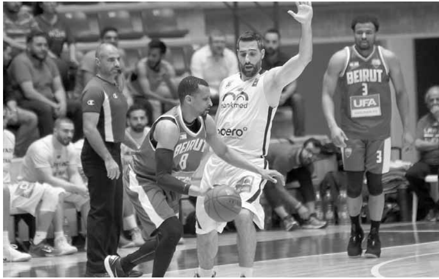
من مباراة الرياضي وبيروت

الفائز على الأنطوني (١٠٨-٦٦). على صعيد آخر، تنطلق بعد غد السبت منافسات الفايبل فور لبطولة لبنان، فيلتي عند الساعة ١٧،٢٠ الهومتيم مع الحكمة على ملعب الهومتيم في سنتر أغباليان في مزهر - بصاليم.