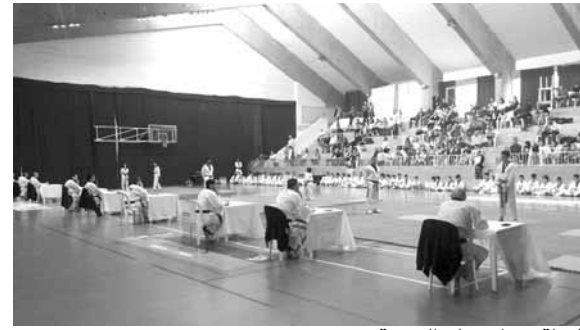
لقطة من امتحان الترقية

نظم الاتحاد اللبناني للتايكواندو امتحان الترقية للحزام الأسود أول، ثاني وثالث دان - يوم في نادي المون لاسال عين سعاده. شارك في الامتحان ٦٢ لاعبا ينتمون الى عدة اندية وهي: نادي النسر الأسود، نادي المون لاسال، نادي الغولدن بايدي، نادي اللويزة، نادي اللواء الرفيد، نادي الأنترنيك (بيروت).