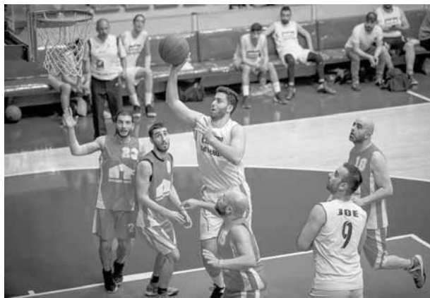
من إحدى المباريات

انطلقت النسخة السابعة لبطولة الـ «كو-ليغ» التي تنظمها «سورتس مانيا» في كرة السلة تحت إشراف الاتحاد اللبناني للعبة، بمشاركة ١٦ شركة ومصروف على ملاعب سنتر ديمرجيان في النقاش. واللافت في هذه السنة هو نسبة تقارب المستوى الفني للفرق مما يجعل المنافسة محتدمة منذ الدور الأول.