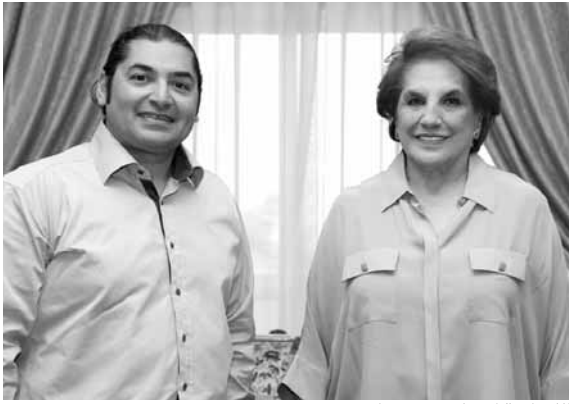
اللبنانية الأولى مع جيام

ان يتحلى المرء بالعزيمة والتصميم للوصول الى تحقيق حلمه، مشيدة بنجاحات اللبنانيين ذوي الطاقات المميزة الذين يرفعون اسم لبنان عالياً في بلدان الاغتراب.