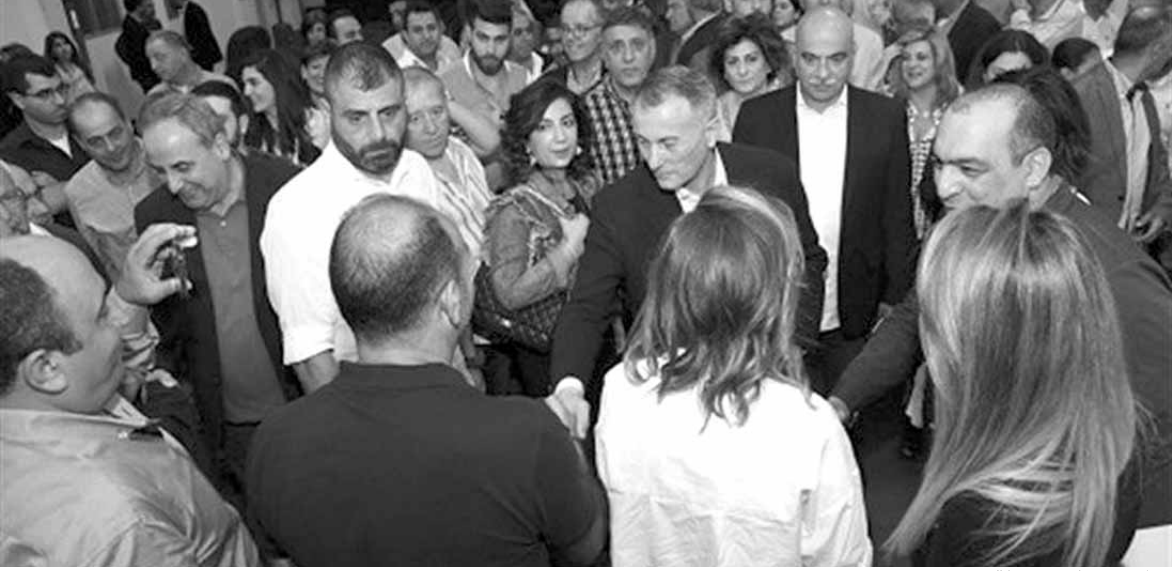
روكز في بلدة سهيلة

اللبنانيين عبر منع من يحاولون شراء ارادتهم وكرامتهم ليزيدوا الفساد الذي اعتادوا عليه سابقاً»، وقال: «نحن نعرف مدى خيرتهم بالفساد، ولذلك نأمل أن يكون اللبنانيون لهم بالمرصاد». وأشار إلى «أن الفساد موجود بشكل أساسي لدى بعض الطبقة السياسية التي تغضيه، وتمنع تنفيذ أي مشروع خارج إطار المحاصصة، وفي المؤسسات الإدارية حيث تحكم السمسات عمل بعض الموظفين الفاسدين الذين يعرقلون معاملات المواطنين، والذين يغطيهم زعماء سياسيون لترميز مصالحهم». وقال: «من هنا لا بد من محاربة الفساد ليحصل المواطنون على حقوقهم بعيداً عن زواريب الفساد ومعاملتهم كزبائن». وأضاف: «الفساد موجود أيضاً في مؤسسات خارج إطار الدولة،