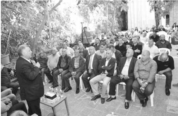
ترو يلقي كلمته

نمن احدا، فهذه واجباتنا، سواء كان نائباً او مواطناً او مسؤولاً»، لافتاً الى «أن المشاريع التي تتحقق في نتيجة مطالبات ومتابعات من الجميع».