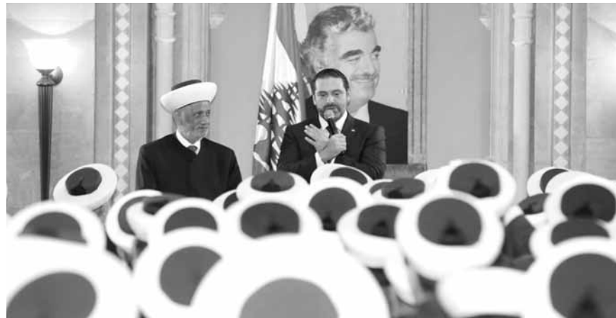
الحريري مع دريان في دار الفتوى

بينهم، وهذا هو القاسم المشترك بينهم. يجب ان يتفقوا على التفاصيل، وقد سمعنا التصريحات الاخيرة التي صدرت من اطراف بما فيها من السيد حسن نصرالله. ويبدو انه خلال المشاورات الحاصلة هذا الامر سيكون مطروحاً، وكما قال الرئيس نبيه بري كل طرف يجب ان يجتاز جزءاً من الطريق للوصول الى القواسم المشتركة».