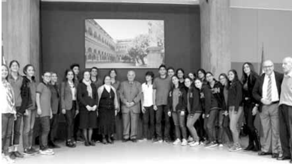
رزق وهيئات المدرسة وطلابها

يكون دائماً بالسلاح، بل سلاح الموقف الذي ينتصر والقرار الشعبي الذي ينتصر».