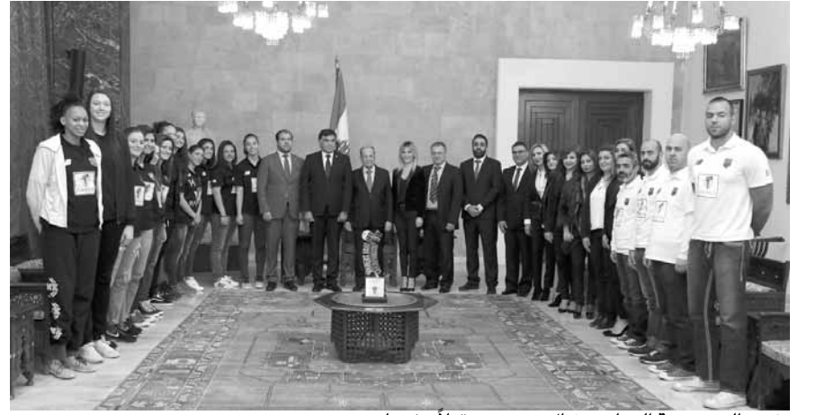
رئيس الجمهورية العماد ميشال عون مستقبلاً وفد نادي هومنتمن

استقبل رئيس الجمهورية العماد ميشال عون اللجنة الإدارية لنادي «هومنتمن» الرياضي برئاسة هراير جبرار خجادوريان مع عدد من الإداريين والمدربين واللاعبين واللاعبين.