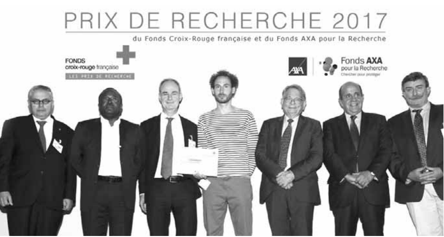
خلال انعقاد المؤتمر

للأبحاث، أن التضامن والتعاقد بين شرائح المجتمع هو الطريق السليم نحو غد أفضل. ونحن على قناعة راسخة بأن العلم يلعب دوراً حاسماً في تمكين الناس من تحديات العصر وبناء حياة أفضل، وهي واحدة من اهتمامات مجموعة أكسا. وبالإضافة إلى الدعم المالي، يدعم صندوق أبحاث أكسا الباحثين أيضاً في جهودهم لنشر أبحاثهم على الجمهور.