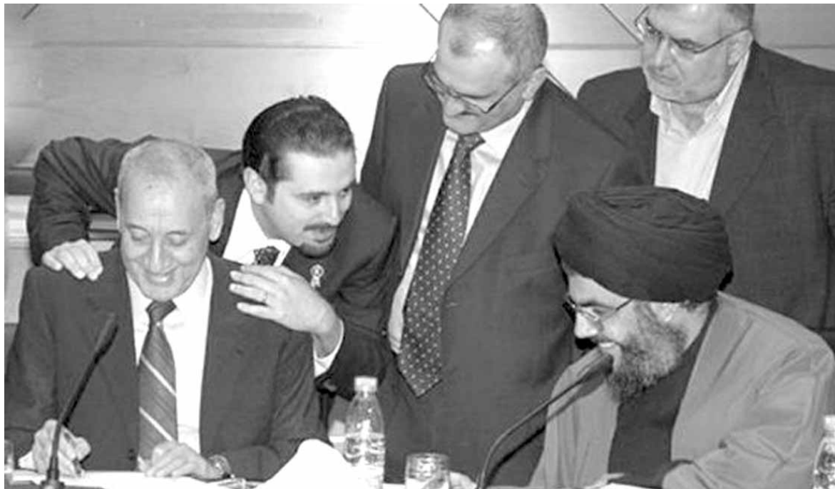
ناجي سمير البستاني

وبالنسبة إلى خيارات رئيس الحكومة، كشفت الأوساط السياسية المطلعة أنّ الحريري ينتظر ما سيُعرض عليه من مخرجات في الأيام المقبلة، واجهتها من جانب رئيس الجمهورية ورئيس مجلس النواب، وخلفياتها الفعلية من جانب «حزب الله»، ليبنى على الشيء مُقتضاه. وأضافت أنّ عزم رئيس الجمهورية وعمله المستمر لفرض إستقلال لبنان