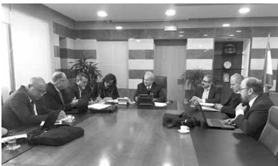
حمادة يترأس اجتماع مجلس التعليم العالي

الموازنة المدرسية للعام ٢٠١٧/٢٠١٨، بوجوب التقيّد بأحكام القانون ٩٦/٥١ ولاسيما المادة الثالثة منه لجهة الحاق البيانات والمستندات المطلوبة بالموازنة كما ورد في هذه المادة، ووفقاً لما يلي: تقديم الموازنة قبل ٢٠١٨/١/٣١. توقيع الموازنة من مدير المدرسة ورئيس لجنة الأهل او من مندوبي اللجنة في الهيئة المالية في الحالة المنصوص عليها في الفقرة الأخيرة من البند ٨ المادة العاشرة. إرفاق صورة طبق الأصل عن محضر الهيئة المالية المتعلق بموقفها من مشروع الموازنة وبموقف لجنة الأهل منه، إرفاق صورة عن بيان المعلومات بالاسماء والرواتب والاجور المقدم الى إدارة صندوق التوعوضات لأفراد الهيئة التعليمية في المدارس الخاصة، وإرفاق ما تضمنه البند الثالث والرابع من هذه المادة»