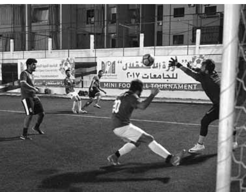
من مباراة الجامعة الأميركية وجامعة AUST