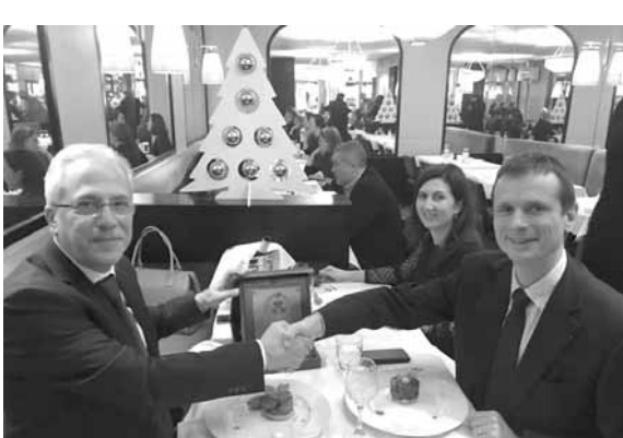
خطار مع نظيره الفرنسي

على يد خبراء فرنسيين بالإضافة إلى إمكانية التعاون في مجالات أخرى ذات الصلة. وأكد على ضرورة متابعة التعاون بكافة المجالات المتعلقة بعمل الدفاع المدني.