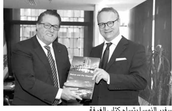
سفير النمسا يتسلم كتاب الغرفة

لبنان كمرّ لها للدخول إلى أسواق المنطقة وكذلك الاستثمار في المشاريع الكبرى التي يطرحها لبنان». أما سفير النمسا، فرحب بدعوة شقير إلى تعزيز التعاون وتنمية العلاقات الاقتصادية لا سيما التجارة البينية، مشيراً إلى انه سيعمل لدى المعنيين في بلاده «على تحقيق كل هذه الأفكار التي تصب في مصلحة البلدين». وفي نهاية الاجتماع قدّم شقير كتاب الغرفة إلى السفير النمساوي.