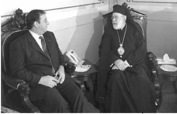
عوده مجتمعاً فرشييه

يختص بالفية وجود الرهبان الروس في شبه جزيرة الجبل المقدس آتوس. وللمناسبة سوف يقام في بيروت خلال شهر آذار ٢٠١٨ معرض بعنوان «مريم» يضم ايقونات (Lithographs) للعدراء مريم والدة الإله ومشاهد من حياتها مأخوذة من مجموعة دير سيمونوس بتراس. وقد بحثت مع سيادته في المكان الذي سيقام فيه هذا المعرض. اللقاء مع سيدنا دائماً مفيد والحديث معه يغني كثيراً».