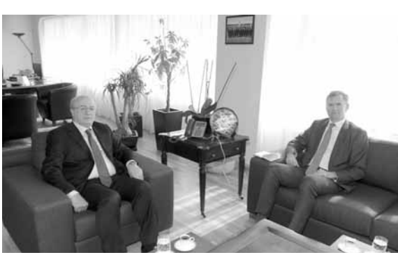
شورتر يزور الخوري

استقبل وزير الثقافة الدكتور غطاس الخوري، في مكتبه في الوزارة، السفير البريطاني هيوغو شورتر، وتم البحث في مجمل التطورات الحاصلة والأوضاع العامة في لبنان والمنطقة، وكذلك في تعزيز التعاون الثقافي بين البلدين.