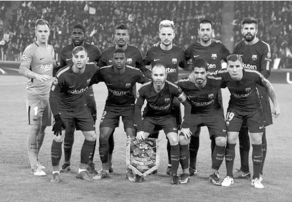
فريق برشلونة المتصدر

دور المجموعات «الدينا مباراة»، وحتى انتهاء الدقائق التسعين، لا يمكننا التفكير بسلبية.. ويحل اشبيلية الخامس بفارق نقطتين عن ريال واثنتيكي على فياريال السادس في مباراة قوية، وذلك بعد ايام من الاعلان عن اصابة مدربه الارجنتيني ادواردو بيريسو بسرطان البروستات.