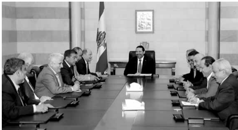
الحريري مع وفد العمالي