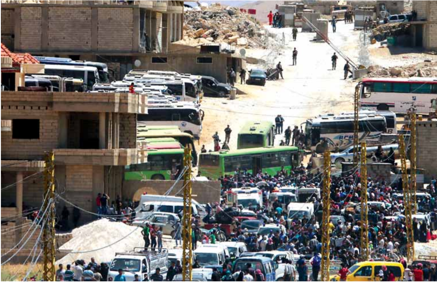
المسلحون والمدنيون قبل الصعود الى الحافلات

وبالتالي فانهم ليسوا بحاجة الى حمولة زائدة إضافية من وزن «الضيف المهزوم».