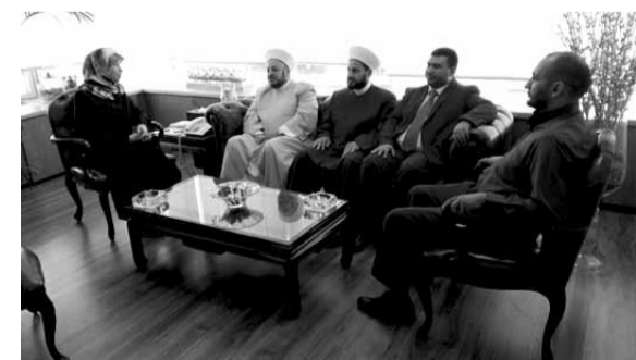
عز الدين مستقبلة وفداً من علماء ازهري البقاع

إستقبلت وزيرة الدولة لشؤون التنمية الإدارية الدكتورة عناية عز الدين، في مكتبها في الوزارة، وفداً من الاتحاد العمالي العام برئاسة الدكتور بشارة أسمر، وتم التمدد في موضوع الإصلاح الإداري على ضوء ما تعانيه الإدارة اللبنانية