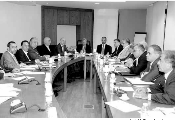
اجتماع لجنة الإدارة

هناك ١٢٠ ألف شخص دخلوا المستشفى خلال السنة منهم الف و ١٢٠ صار حولهم اشكاليات وهذا شيء يجب ان نأخذ في الاعتبار». وتابع: «عرض دولته لامر شامل وحدد ما هو دور وزارة الصحة في هذا المجال، هل هي التي ستكون مشرفة ومنفذة او ان يتعاقدوا مع شركات خاصة ويشرفوا عليها او ان هناك هيئة في وزارة الصحة مؤلفة من كل الصناديق التي تتعاطى أمور الاستشفاء والهيئة التي تتجمع للمرة الأولى منذ ١٠ الى ١٥ عاما، حسب دولته، هذه الهيئة تنسق وتضع المعايير لكي لا يضع كل صندوق معايير، لذلك وقف الهدر يبدأ من هنا، وبالتالي دولته يعمل في هذا الإطار والخطة تدرس وهي تشمل عموما عناصر التأمين، تغطية الوزارة، نوع الخدمات، ادارة الخدمات، وتمويل هذه الخدمات، هذه خطة شاملة ومقارنته مع بقية الدول، لكي يأخذوا ما هو الأقرب الى الواقع اللبناني ليعتمده».