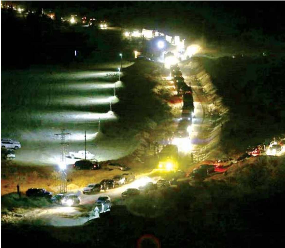
القافلة ليلاً في فليطة