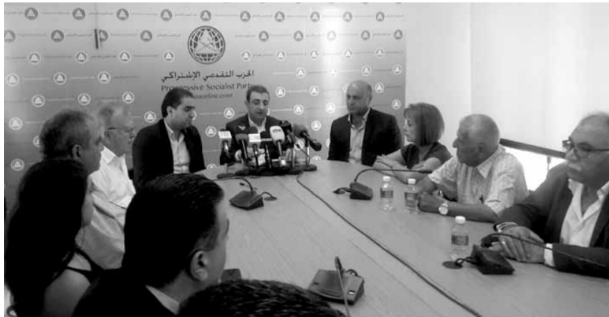
خلال المؤتمر الصحافي

وغير محق ودون الالتزام بالآلية المنصوص عليها في القانون ٥١٥. والتأكيد على ضرورة السير في مشروع دعم وتطوير المدارس الرسمية في لبنان التي تبقى هي المكان الافضل لاستيعاب الطلاب اللبنانيين دون الخضوع للتخثير من الإبتزاز والرغبات بتحصيل المبالغ المالية والتجارية. واعداد النظر بالتقديرات للمدارس الخاصة، و اشار ان انه في موازنة العام ٢٠١٧ مجموع الإنفاق على مدارس تحت مسميات المدارس المجانية او هيئات لا تتوخى الربح وزارتي التربية والشؤون الاجتماعية يبلغ ٢٠٥ مليارات، وهذا المبلغ بحسب موازنة ٢٠١٧ موزعة على الشكل التالي: