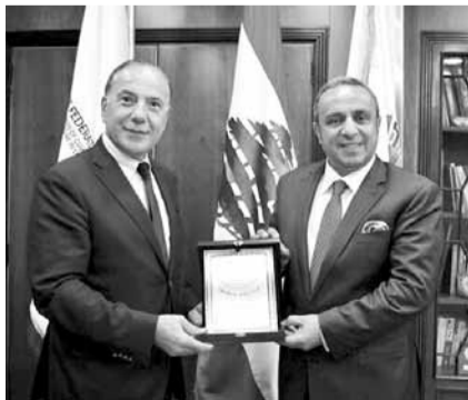
دع تقديري لديبوسي

طرابلس ولبنان الشمالي بما تمثله من تطورات مستقبلية لبناء الشمال هي الحاضرة الجامعة لكل مكونات المجتمع الاقتصادي الوطني»، وقال: «كلي اعتزاز أن أكون في عداد من يخدمون وطنهم الحبيب لبنان بلد الرسالة والانفتاح والتواصل، وكذلك سروري الموصول في أن أكون سفير البلادي الجزائر الحبيبة في بلد التحرر والشهادة». وفي المناسبة قطع قالب الحلوى. ثم جال الجميع على مختلف مشاريع الغرفة القائمة واطلعوا على تلك التي سيتم اطلاقها في القريب العاجل.