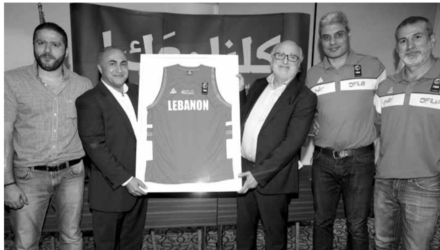
قميص منتخب الرجال من الحاج الى كاخيا

عملنا منذ سنوات على رعاية الأنشطة والدورات الرياضية والمنتخبات الرياضية وعلى رأسهم منتخب لبنان للرجال في كرة السلة الذي كان لنا شرف رعايته عبر ماركة (بيك) منذ عشر سنوات. كما أود ان اشكر اللجنة الأولمبية اللبنانية على التعاون بيننا. ومرة جديدة فان منتخبات لبنان في كرة السلة هي أمانة في أعناقنا خاصة ان لعبة كرة السلة هي لعبة على مستوى الوطن حيث قررنا دعماً مرة جديدة في أعلى بطولة قارية الا وهي بطولة الأمم الآسيوية للفترة الأكبر في العالم متمنين لمنتخب الأرز التوفيق في الاستحقاق القاري الكبير ونأمل ان تزين الميداليات الذهبية عنق اللاعبين الذين يقدم لهم الاتحاد اللبناني برئاسة الأستاذ بيار كاخيا كل الدعم والرعاية. ان العلاقة مع الاتحاد اللبناني هي علاقة ثابتة ووطيدة وطويلة الأمد باذن الله.