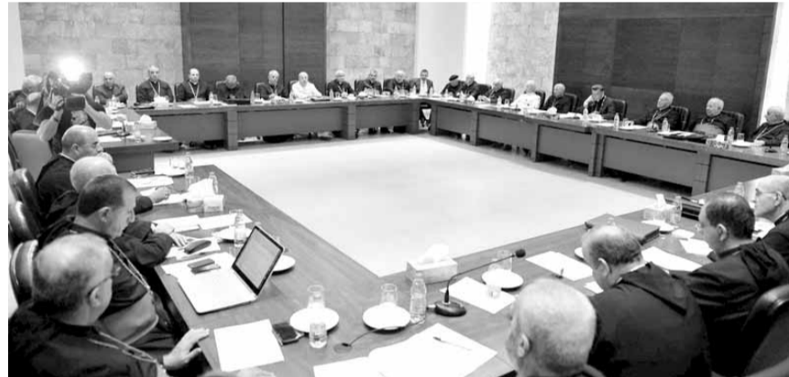
الراعي يترأس اجتماع المطارنة الموارنة

عقد المطارنة الموارنة اجتماعهم الشهري في الكرسي البطريركي في الديمان، برئاسة الكاردينال مار بشارة بطرس الراعي ومشاركة الآباء العامين، وتدارسوا بطرس الراعي ومشاركة شؤنا كنسية ووطنية. وفي ختام الاجتماع أصدروا بياناً، تلاه امين سر البطريركية الاب رفيق ورشا، وجاء فيه: