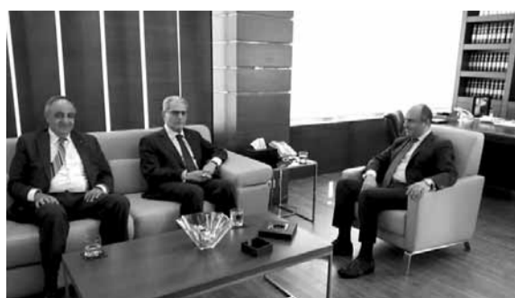
بوعاصي مستقبلاً الخانز

النازحين، بالتنسيق مع الأمم المتحدة، إلى مناطق آمنة من سوريا لثلايقون في المخيمات والعراء معرضين لفصل الشتاء القارس».