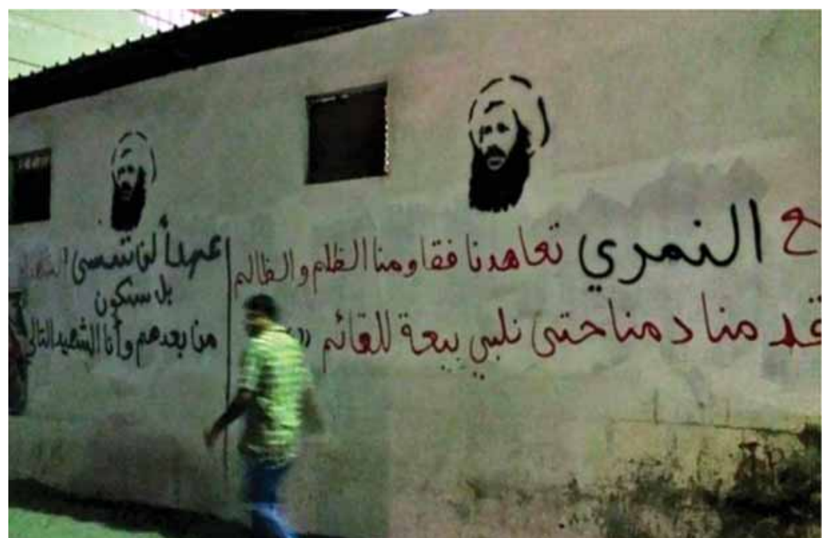
شعارات مؤيدة للشيخ نمر باقر النمر في العوامية

بعد مرور اكثر من ستة ونصف على اعدام السعودية لرجل الدين والقسيادي الشيعي نمر باقر النمر والذي ادى الى مواجهات في موطنه العوامية شرق السعودية افادت تقارير امس بأن مئات من السكان يقرون من بلدة العوامية الواقعة في شرق السعودية، بعد أسابيع من الاشتباكات بين بعض المسلحين وقوات الأمن. وهذه هي أحدث موجة من الاضطرابات الشديدة في المنطقة الشرقية التي تطلتها أغلبية شيعية والتي تطالب بمزيد من الحقوق والحرية الدينية. ويبدو أن الاضطرابات في الأسابيع الأخيرة دخلت مرحلة جديدة أكثر خطورة. (تتمة الخبر السعودي ص ١٦)