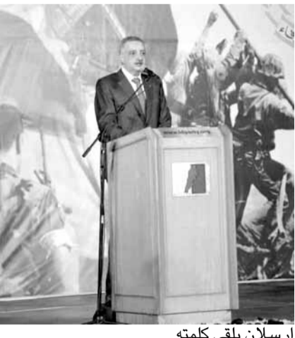
إرسلان يلقي كلمته

أقامت دائرة الشويفات في الحزب الديمقراطي اللبناني حفل عشاءها السنوي الاول بمناسبة عيد الجيش اللبناني، في المنتجع السياحي «لا سبيستا - خلدة، بحضور وزير المهجرين النائب طلال أرسلان وعقبيلته، وزراء الدفاع الوطني يعقوب الصراف، السياحة أواديس كيدانياً والطاقة والمياه سيزار أي خليل، الوزير السابق مروان خير الدين، وشخصيات سياسية وامنية، وممثلي أحزاب ورؤساء بلديات ومخاتير من المنطقة وفاعليات اقتصادية ومصرفية وجمعيات وأندية رياضية.