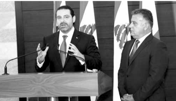
الحريزي يتحدث والى جانبه اللواء ابراهيم

أكد رئيس مجلس الوزراء سعد الحريزي، بعد استقباله مدير عام الأمن العام اللواء عباس ابراهيم، «اننا لن نقبل ان يكون هناك اي نوع من الإرهاب على اي أرض لبنانية»، مشيراً الى أن «الدولة قامت بواجبها وحصل التفاوض مع «جبهة النصرة»، واستطعنا ان نصل إلى هذا الحل وسنكمل في معالجة هذا الموضوع، والمفاوضات كانت صعبة لكن أنهينا هذا الوضع الموجود في جرود عرسال».