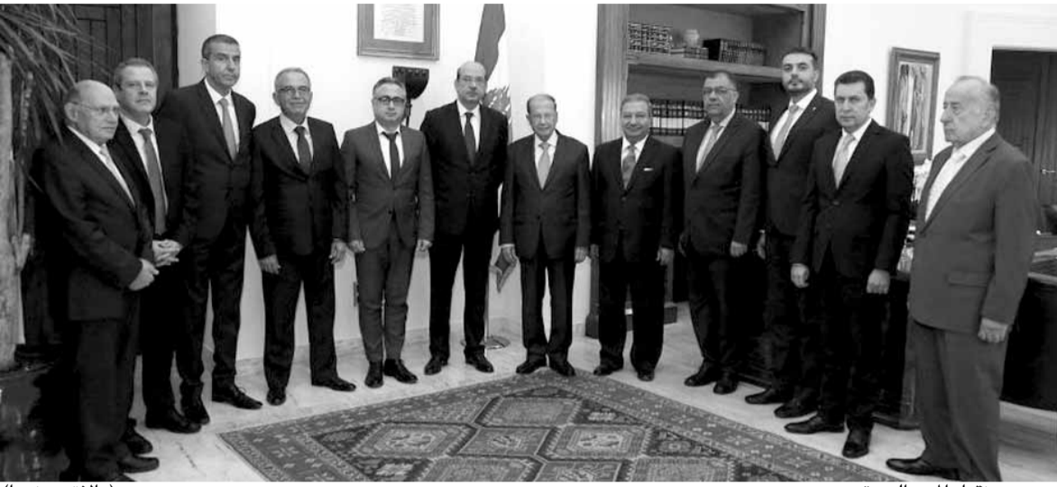
عون مع نقيب المهن الحرة