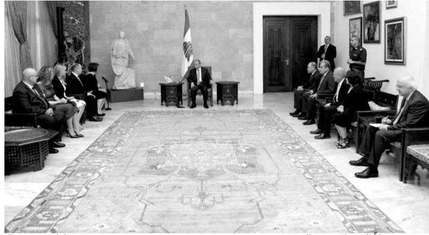
عون مستقبلاً الوفد الأسترالي (دالاتي ونهرا)