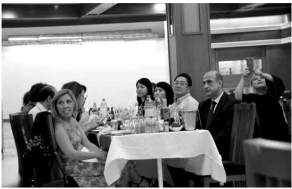
طاولة السفير الياباني مع رئيس الجمعية فادي عون

بحضور السفير الياباني ماتاهيرو ياماغوشي وعقيلته إلى جانب المحق الثقافي وعدد من موظفي السفارة اليابانية في لبنان، احتفلت جمعية كوكوشوكورين / آي إس كاي إف -لبنان الرياضية مع أصدقائها من شخصيات ورجال، بعيد تأسيسها العشرين ضمن حفل عشاء ساهر أقيم في مطعم «تلال السهر» في عجلتون. افتتحت السهرة بكلمة ترحيب وأخرى استعرضت فيها إنجازات الجمعية ودور السفارة اليابانية في دعمها منذ تأسيسها وحتى اليوم، كما تضمنت شكرًا لأصدقاء وداعمي الجمعية ورجال نشاطاتها.