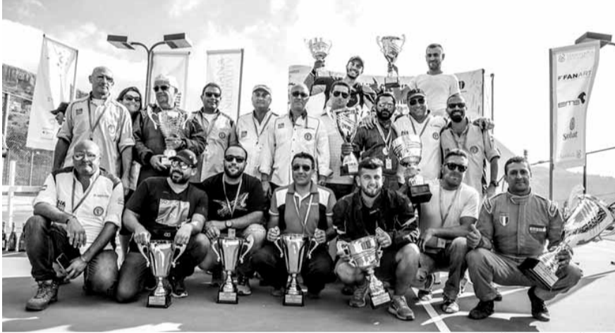
كبار الحضور مع السائقين بعد تنويعهم