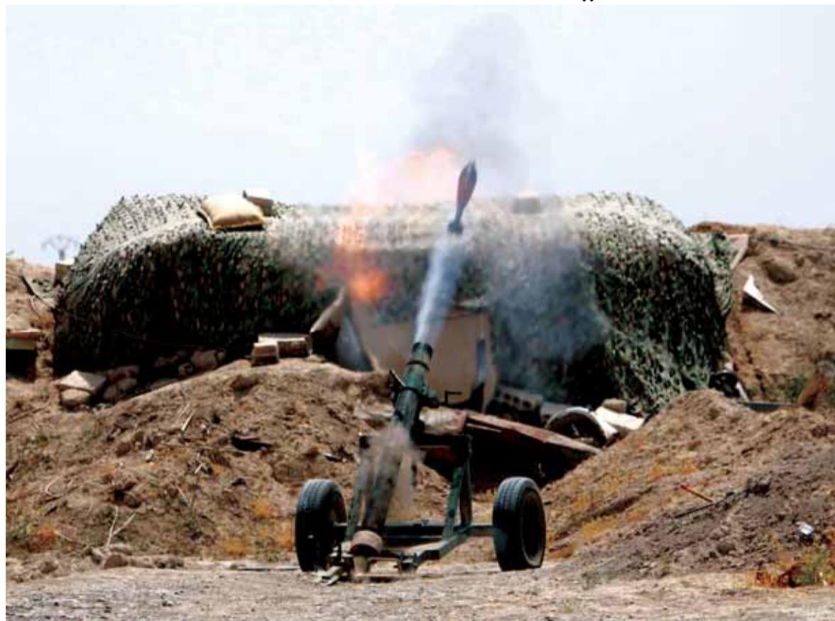
اشتباكات بين قوات سوريا الديمقراطية و داعش في الرقة

في موازاة تقدم قوات سوريا الديمقراطية ذات الاغلبية الكردية في الرقة بدعم جوي من طائرات التحالف الدولي، بدأ الاكرد باتخاذ اجراءات ادارية في المناطق الكردية لجهة استبدال لوحات السيارات السورية بلوحات ذات رموز كردية واعتماد اللغة الكردية في المدارس كلغة اساسية وكذلك بطاقات الهوية السورية ببطاقات كردية، واستبدال الموظفين السوريين باكرد. لكن التعامل حتى الان مازال في العملة السورية وحسب مصادر كردية فانهم سيوسعون اجراءاتهم الاستغالية عن الدولة السورية لجهة قيام نظام خاص بالاكرد، وهذا ما زاد من المخاوف التركية مع حشود عسكرية للجيش التركي قبالة عين العرب (تتمة الخبر السوري ص ١٦)