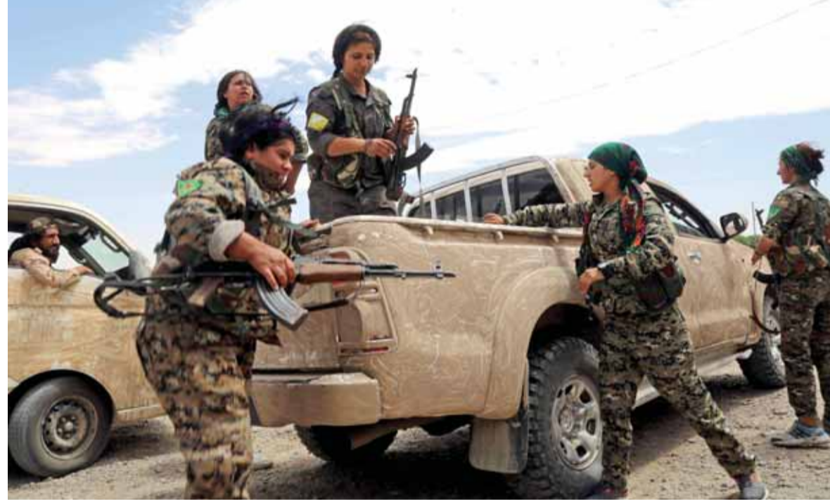
مقاتلات كرديات على مشارف الرقة