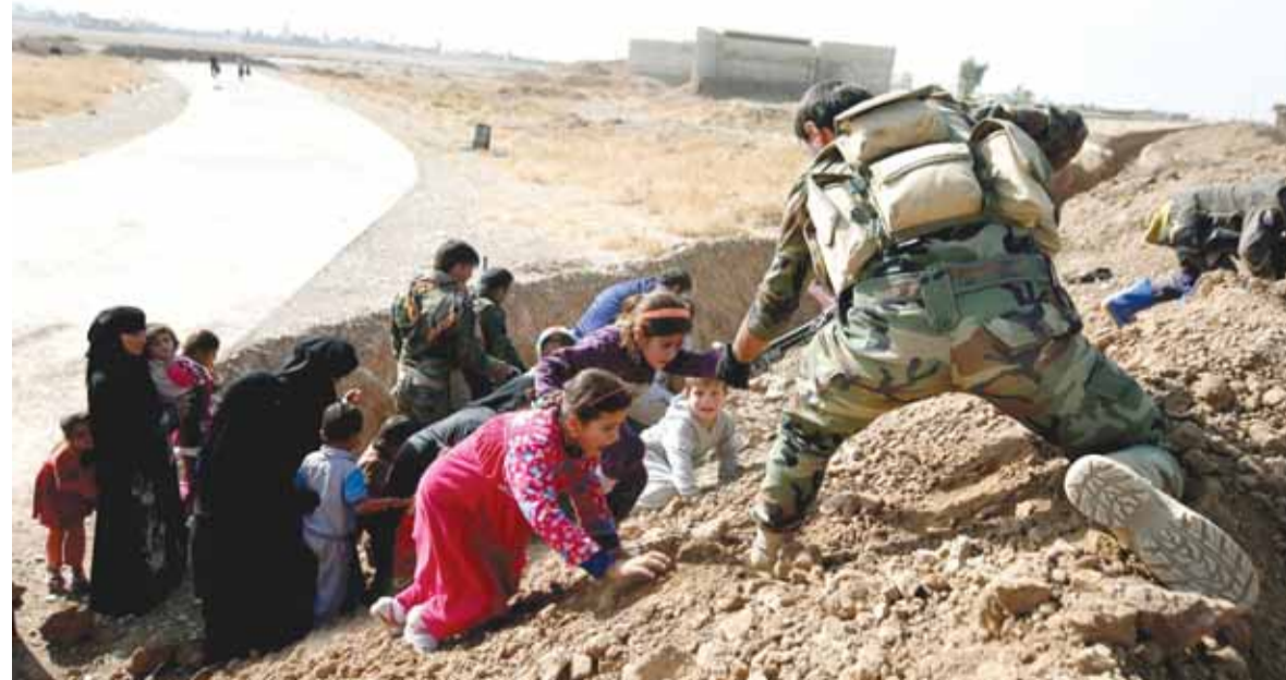
جندي عراقي يساعد عائلة عراقية للخروج من مناطق الاشتباكات

صغيرة ما زالت بحوزتهم في الموصل القديمة حيث تستمر معارك عنيفة، وسط دمار هائل لحق بالمدينة، ونزوح مئات الاف من سكانها.