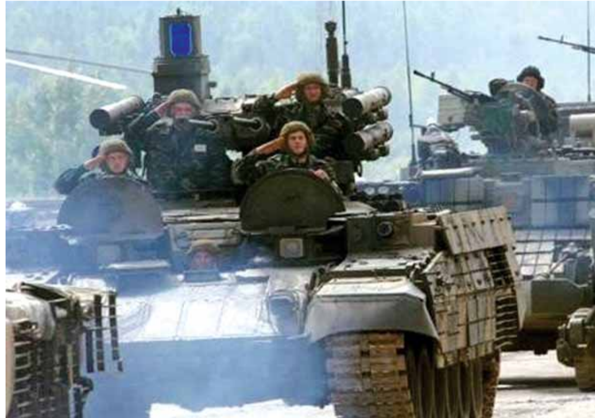
عرض لأليات الروسية المتطورة في قاعدة حميميم

تراجعت واشنطن عن تهديداتها مبررة بان السلطات السورية استجابت كما يبدو للتحذيرات الأميركية، كما قال وزير الدفاع الاميركي جيمس ماتيس مشيراً الى ان الهجوم الكيميائي الذي كانت تتوقعه واشنطن لم يحصل حتى الآن. وجاءت تصريحات ماتيس على متن طائرة أقلته من ألمانيا إلى بروكسل في إطار جولته الأوروبية، بعد يومين من إعلان البيت الأبيض عن رصد أدلة على التحضير لهجوم كيميائي جديد في سوريا.