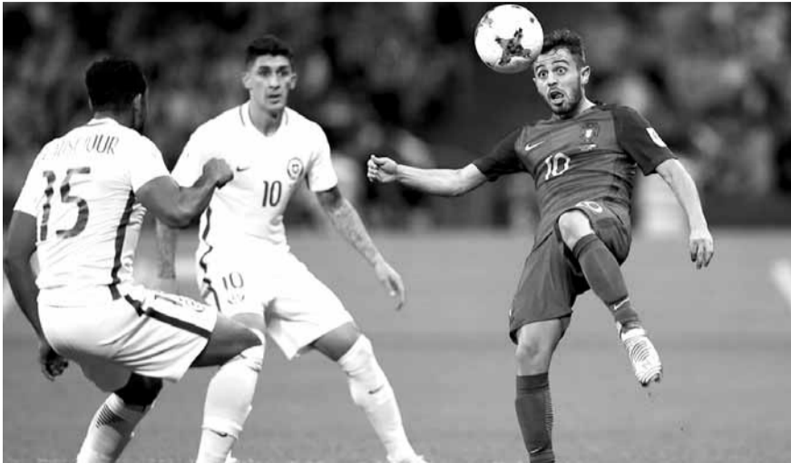
من مباراة البرتغال وتشيلي

الاولى حيث اشرك ٢١ من اصل ٢٣ لاعبا، وقال الهدف التاريخي لكاس العالم (١٦ هدفا) ميروسلاف كلوزه الذي يشرف على تدريب المهاجمين في التشكيلة الحالية «نريد ان يأخذ كل لاعب فرصته وان يلعب ٥ مباريات، لقد حققنا الهدف المنشود».