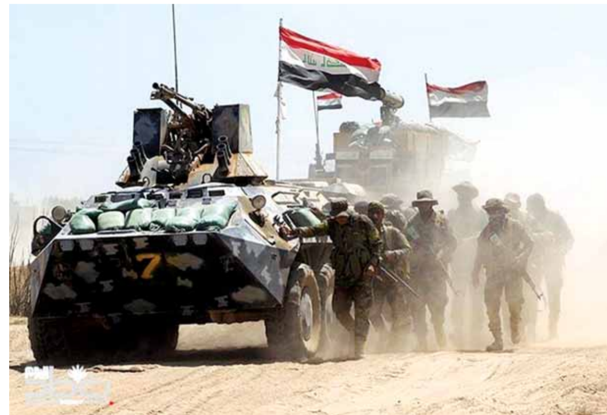
الجيش العراقي داخل الموصل

الموصل تنتظرها معارك شرسة للقضاء على هذا العدد القليل من مقاتلي تنظيم الدولة. ويأتي هذا بعد تواتر تصريحات القادة العسكريين والسياسيين العراقيين بأن استكمال السيطرة على المدينة القديمة سيكون خلال أيام.