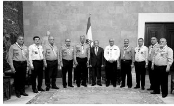
عون مستقبلاً وقد من كشف لبنان

دعا رئيس الجمهورية العماد ميشال عون، الحركة الكشفية في لبنان، الى «لعب دورها الكبير في استيعاب الجيل الشاب اللبناني وإبعاده عن الأوقات المدمرة التي تتهدده، وفي مقدمها أفة المخدرات»، مجدداً الدعوة الى التعاون بين من يعمل على مكافحة المخدرات ومن يعمل على توعية الشباب والعائلات من خطر المخدرات ومن يعالج رواسب التعاطي، لأن من شأن هذا التعاون أن يحقق نتائج مهمة لجهة خفض نسبة المتعاطين الى الحد الأدنى ولجم تزايد عدد المدمنين».