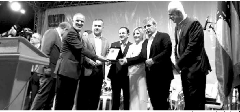
كيدانيان في مهرجان بنت جبيل

لبنان وركزت في هذه الحرب على بنت جبيل، أرادت أن تدمر التراث، استهدفت وسط المدينة ومبانيها وأرادت أن تمحو من الذاكرة هذا التراث، وما نحن بعد هذه السنوات الطويلة ناتي هنا لنقول أن تراث بنت جبيل لا يموت ولا يندثر أبدا هو ينبعث من جديد بأفضل حلة وأفضل مما كان». وأضاف: «أمامنا، وكما أكد الاخ الكبير دولة الرئيس نبيه بري في مجلس النواب باعتباره رئيس هذه السلطة التشريعية، في هذه المرحلة الفاصلة عام ٢٠١٨ متوسع