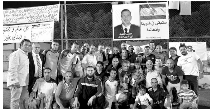
فريقا قدامى النجمة والجمل مع كأسى المركزين الاول والثاني