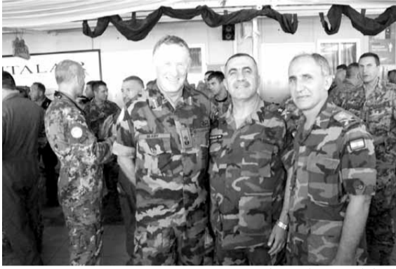
المشاركون في الاحتفال

أقيم في المقر الجوي للمروحيات الإيطالية في «اليونيفيل» في التاقورة، احتفال تسليم وتسلم بين القائد الجديد للقيادة جوليانو اينكو وسلفه جوفاني ماريا سكوبيليني، برعاية قائد اليونيفيل ورئيس بعثتها في لبنان الجنرال مايكل بييري، وحضور السفير الإيطالي ماسيمو ماروتي، نائب قائد قطاع جنوب اللطاني العميد عباس زمط، رئيس جهاز الارتباط في الجيش العميد حمدان حجار، قائد القطاع الغربي لليونيفيل الجنرال فرانيسكو أوللا، وكبار ضباط اليونيفيل والجيش.