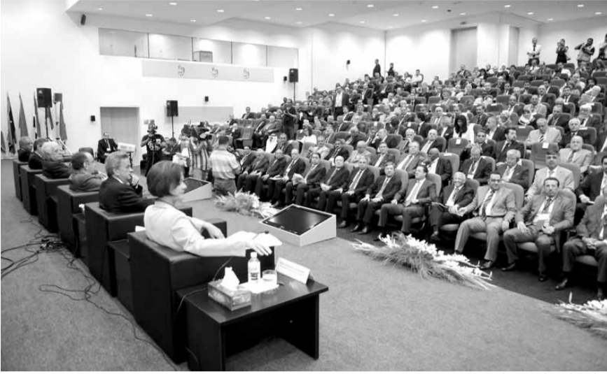
خلال احد المؤتمرات

• الرؤى الاقتصادية وتحديات الإصلاح وخلق فرص العمل،