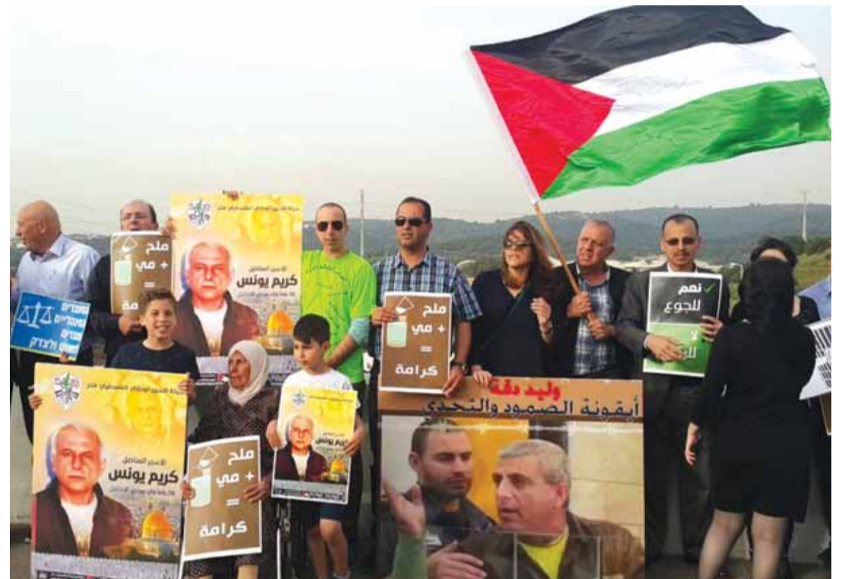
فلسطينيون يحملون صور الأسرى ومن بينهم صورة عميد الأسرى