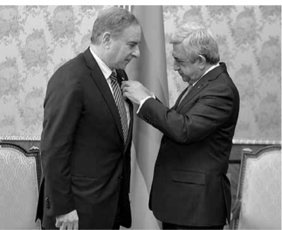
رئيس ارمينيا يقبل فرعون وسام الصداقة

منح رئيس جمهورية ارمينيا سيرج سركيسيان وسام الصداقة لوزير الدولة لشؤون التخطيط ميشال فرعون خلال استقباله في إطار زيارته الى ارمينيا، مخنيا على جهوده المبذولة في مجال تطوير العلاقات وترسيخ الصداقة بين الشعبين والبلدين.