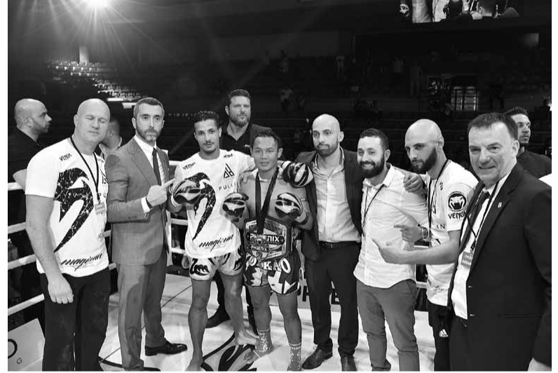
يريفانيان مع اركانه بعد تتويجه التايلاندي ساين شاي