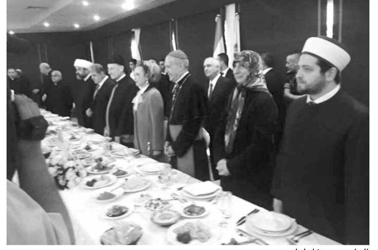
الراعي بين فاعليات صور

أضاف: «من أجل هذا الالتزام، كان شعار يوبيل مدرسة قدموس: «من أجل الجنوب... خمسون عاما باقون ومستمرّون في التربية والتعليم». وقد كتب على البالونات الخمسين التي طارت في الهواء الطلق للدلالة على هذه الاستمرارية المفتحة منذ الآن نحو اليوبيل الماسي الخامس والسبعين وما يليه. وهذا يشكل علامة رجاء لأجيالنا الطالعة. فلا خوف على المستقبل طالما عندنا مدرسة حرة، رسمية كانت أم خاصة أم كاتوليكية، لا تخضع لأية إيديولوجية أو لأي تدخل سياسي من أي نوع كان».