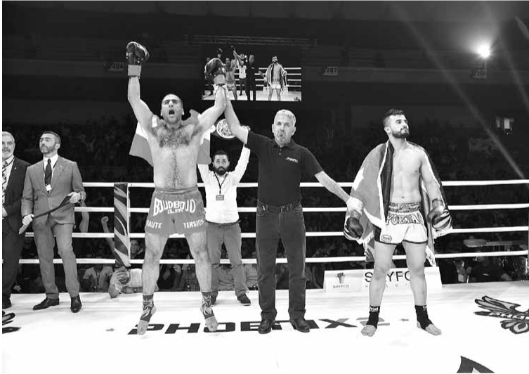
لحظة اعلان فوز احد اللبنانيين