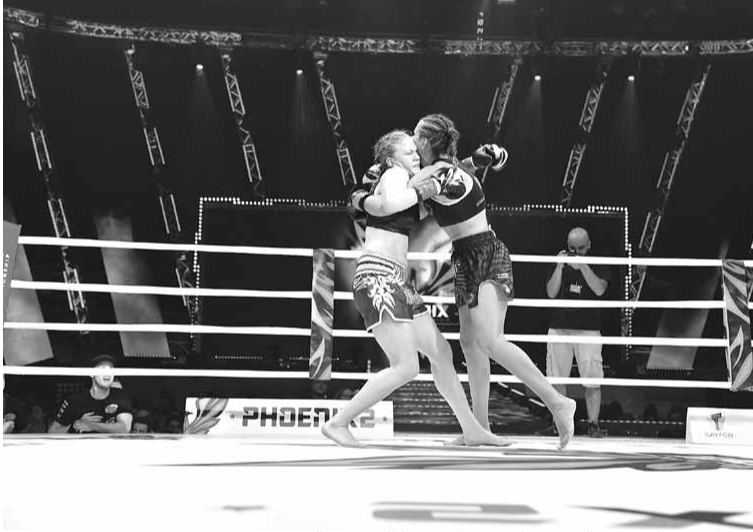
التحام بين البيروفية شفشنكو ومنافستها السويدية