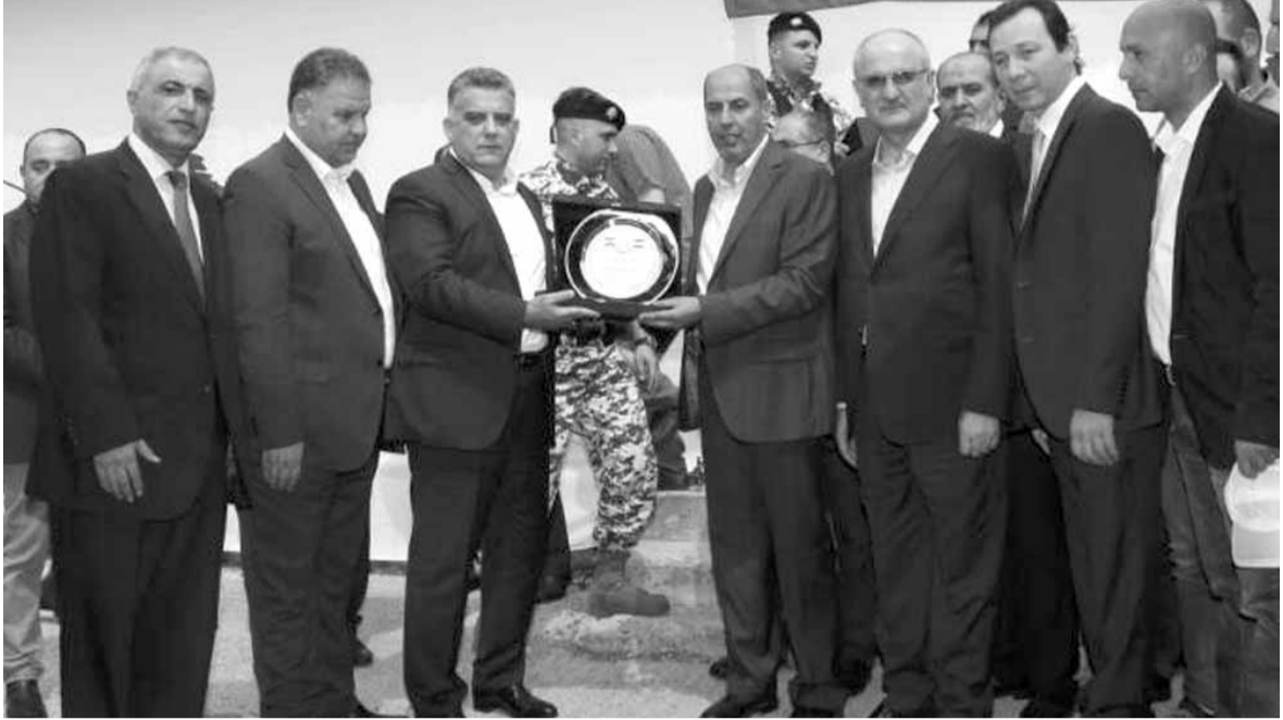
درع تذكارية للواء ابراهيم