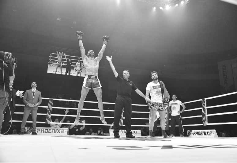
...أحد الفائزين يعبر عن فرحته