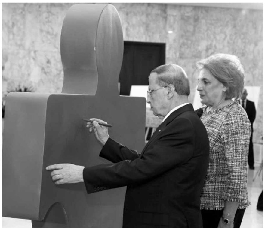
الرئيس عون وعقيلته يوقعان على مجسم شعار التوحد

أكد رئيس الجمهورية العماد ميشال عون أن التوحد قضية انسانية ووطنية، مشيراً الى أنه «لا يجب أن نسمح بان يتم التعاطي مع الذين يعانون من هذه الحالة وكأنهم كمية مهملّة او نسب مئوية، فننسى الانسان فيهم، وننسى انهم يشعرون ويتألمون كسائر الناس»، مشدداً على ضرورة أن تتضافر كل الارادات لجعل المعاناة أقل قسوة وغد التوحد اكثر أملاً. وإذ دعا الرئيس عون المؤسسات السياسية والاجتماعية والتربوية الى مقاربة هذه الحالة من منطلق ان ابناء التوحد هم جزء لا يتجزأ من مجتمعنا ولهم مكانهم وحقوقهم، وأولها حق الاندماج، فإنه توجه الى الطاقات العلمية في لبنان للانخراط في الجهد العالمي لكشف أسباب التوحد والمساهمة في وضع مناهج تعليمية يمكن التأسيس عليها من اجل تأمين تطور الاطفال المصابين ومواكبتهم في كل مراحل حياتهم. ومواقف الرئيس عون جاءت خلال الاحتفال الذي اقيم في القصر الجمهوري في بعبدا لمناسبة اختتام شهر التوعية على التوحد، وتنت في خلاله اضاءة الواجهة الخارجية للقصر باللون الأزرق الذي يعتبر رمزاً عالمياً