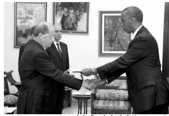
الرئيس عون يتسلم أوراق أحد السفراء