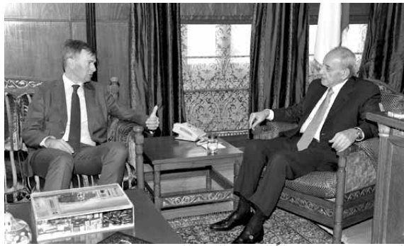
الرئيس بري مستقبلا السفير البريطاني

استقبل رئيس مجلس النواب نبيه بري، في عين التينة، السفير البريطاني في لبنان هيوغو شورتر وعرض معه التطورات الراهنة. وقال السفير البريطاني بعد اللقاء: «عرضنا موضوع الانتخابات مع قرب نهاية ولاية المجلس النيابي وضرورة الحفاظ على المؤسسات الدستورية»، مثنيا على «الجهود التي بذلت لإعادة تفعيل المؤسسات من خلال انتخاب رئيس الجمهورية وتشكيل حكومة جديدة وتفعيل عمل البرلمان في الاشهر الاخيرة». اضاف: «وتطرقنا الى موضوع دعم لبنان، وهنا اود ان اشير الى البيان الذي وقعته بالشراكة مع سفراء الدول الداعمة للبنان وكذلك سفيرة الاتحاد الاوروبي. الرسالة التي تشجع كل الافرقاء لاستغلال الوقت المتبقي للاتفاق على قانون للانتخاب واجراء الانتخابات في جو آمن ومستقر سياسيا وبشفافية، واتفقتا في الرأي مع الرئيس بري على ضرورة وجوب انجاز قانون للانتخاب يتضمن «الكوتا» النسائية». واشار الى «ان الباقي ٤٥ يوما لانتهاء ولاية