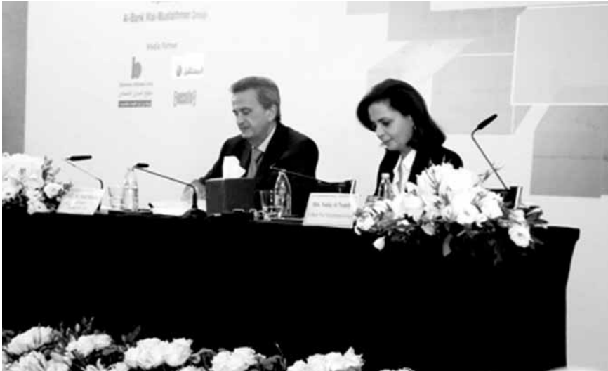
سلامة والى جانبه النملي

أكد حاكم مصرف لبنان رياض سلامة أن «استمرار التعاون بين جمعية المصارف والبنوك المراسلة يعزز الثقة بالقطاع المصرفي لدى المصارف المراسلة رغم المخاطر والتحديات الإقليمية والدولية المحيطة بالعمل، ويعمل المصارف المراسلة عينها التي تلجأ بدافع متطلبات الـ compliance والرسملة، إلى خلق علاقاتها عبر سياسة الـ De-Risking في العديد من الدول (أميركا اللاتينية، أفريقيا...)» معتبراً أن «تحرك جمعية المصارف مع المصارف من جهة، وتحرك مصرف لبنان مع السلطات حالاً دون تعرض هذه العلاقة لأي مشكلة، ما حمى لبنان من مخاطر الـ De-Risking ورأى أن «تطبيق المعايير الدولية في مجال مكافحة تبييض الأموال وتمويل الإرهاب يحمي المجتمعات والاقتصادات والمصارف من مخاطر هذه السياسات».