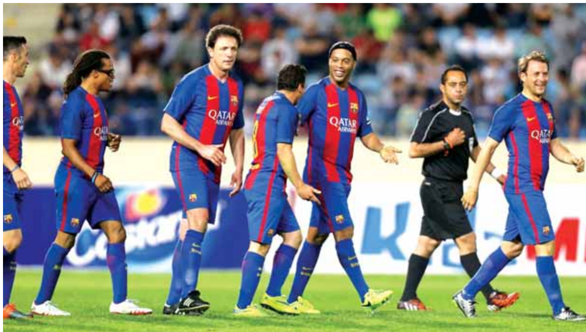
(التفاصيل صفحة ١٤)