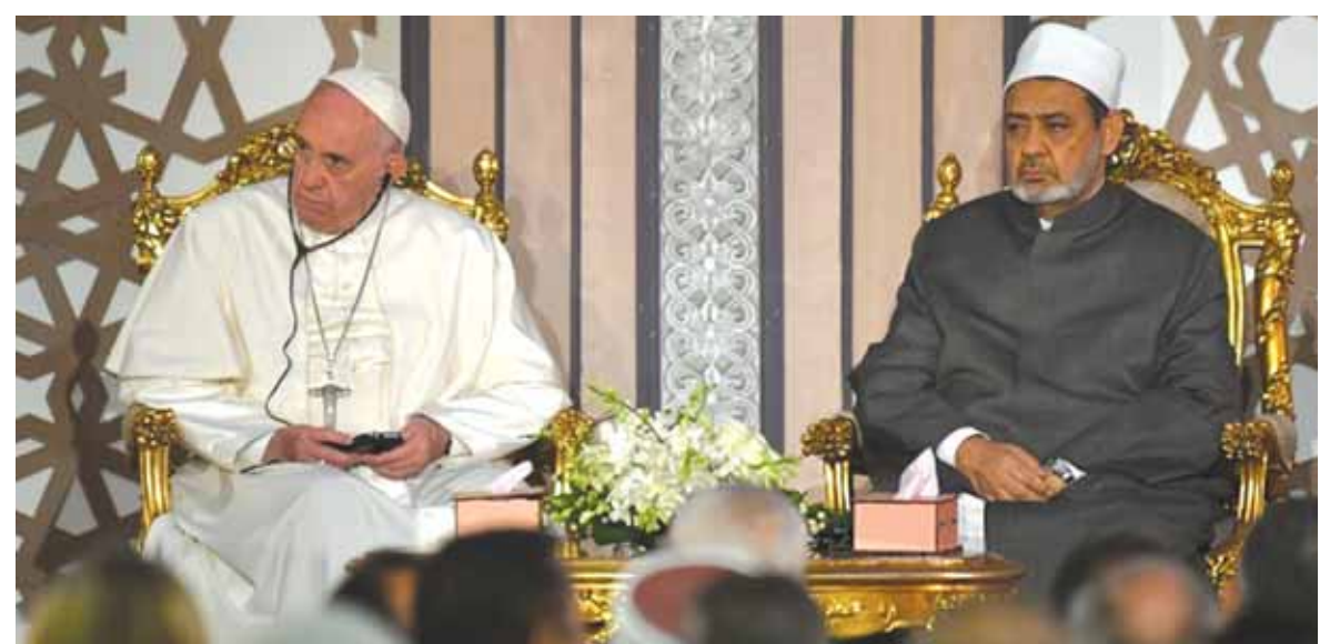
البابا وشيخ الازهر