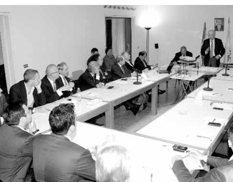
طاولة مستديرة في التجمع

ثم كانت مناقشة عامة شارك فيها جميع الحاضرين حول سبل تفعيل النضال لتحقيق هذا القانون وسبل تبني الخطوة المقترحة من واكيم. في ختام الندوة، أقر الحاضرون إنشاء لجنة خاصة ضمن الأعضاء تضم الأعضاء الراغبين لوضع تصور وخطة تتمحور حول جمع المعلومات اللازمة وإعلام جميع المواطنين عن الوضع الشاذ والمقلق من جهة، والعمل على إيجاد وسائل لتسهيل مرور الإصلاحات الضرورية». وناشد التجمع «جميع المسؤولين السياسيين إيلاء هذا الأمر أقصى الاهتمام وإقرار القوانين اللازمة قبل قوات الأوان».