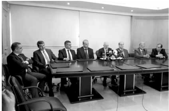
فيناينوس في مؤتمره الصحافي