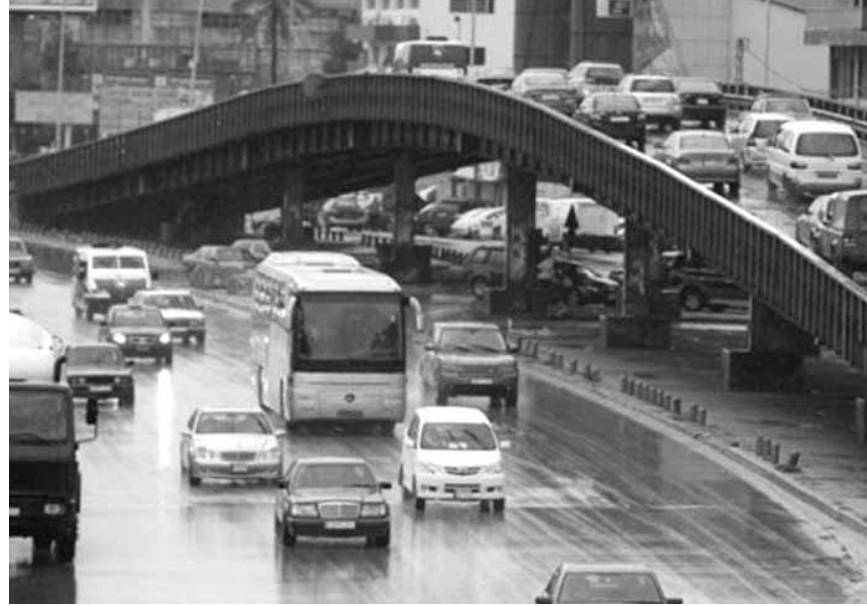
على محاكاة كمية المركبات التي قد يتوقع ان تستفيد من صلتى الوصل.