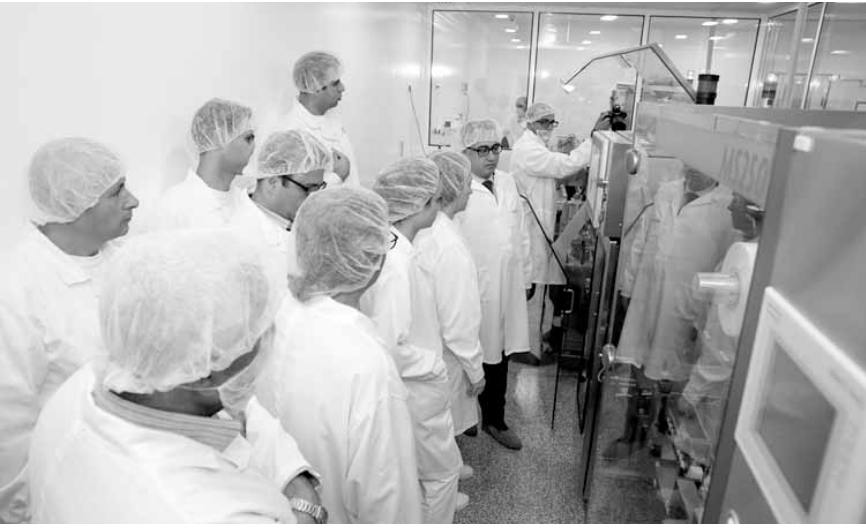
الوفد خلال جولته