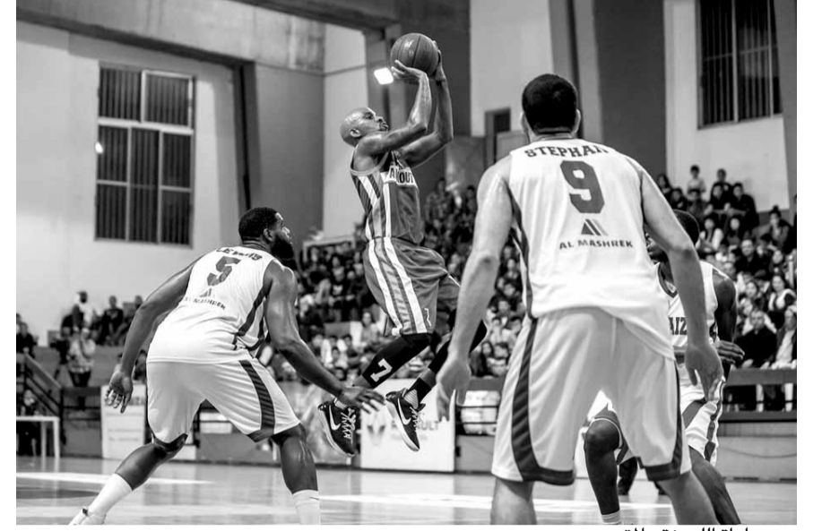
من مباراة اللويظة والمتحد

فرط نادي النجمة بفرصة احتلال المركز الثاني في ترتيب الدوري اللبناني، إذ تحول تقدمه بهدفين على غريمه الأنصار الى تعادل ٢-٢ في الوقت الضائع، في قمة المرحلة الثامنة عشرة. وفشل النجمة في الإفادة من خسارة المتصدر العهد أمام النبي شيت (٢-١)، حيث كان في مكانه تقليص الفارق معه الى ثلاث نقاط فقط، إلا ان اضاعته تقطن ١١٤ من مباراة القمة الـ ١١٤ للدوري حرمته هذه الفرصة، وادت الى تراجع للمركز الثالث بفارق نقطة عن