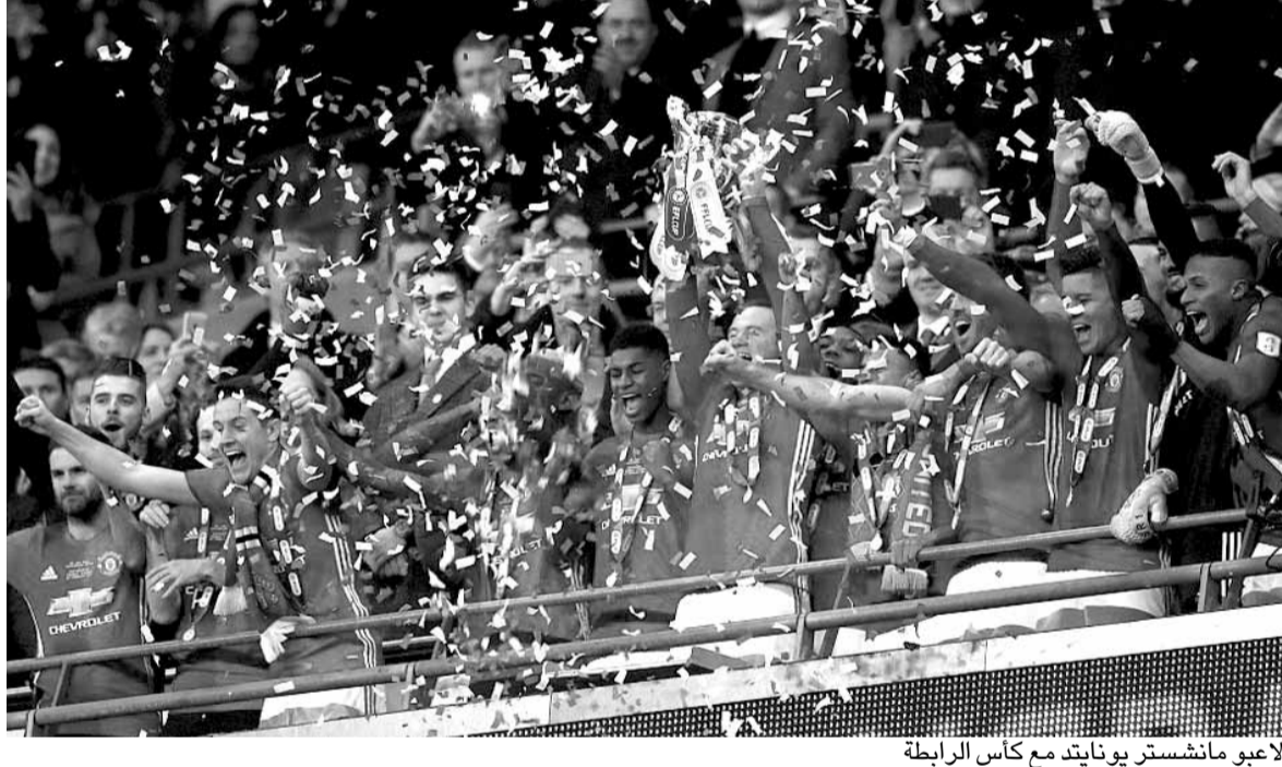
لاعبو مانشستر يونايتد مع كأس الرابطة

اكويلاي لاندريا بارنولتشي نفذها الكولومبي كارلوس باكا واهدى الفوز للضيوف (٢٢). ورفع لانسبو رصيده الى ٥٠ نقطة مقابل ٤٧ لميلان. وانقد المهاجم الدولي فابيو كوالياريا فريقه سمبدوريا من الخسارة بتسجيله هدف التعادل مع ضيفه باليرمو ١-١ في الدقيقة الأخيرة. وافتتح باليرمو التسجيل في الشوط الاول من ركلة جزاء احتسبت اثر خطأ في المنطقة المحرمة ارتكبه المهاجم الدولي البولندي بارنوش بيريسنسكي ونفذها بنجاح المقدوني ايليا نستوروفسكي (٣١). وانتظر سمبدوريا حتى الدقيقة ٩٠ لادراك التعادل عبر كوالياريا بعد ان تلقى كرة بالخاص من الكولومبي لويس موريل انهاها في الشباك. وبقي سمبدوريا عاشرًا برصيد ٣٥ نقطة، وباليرمو في المركز الثامن عشر. اول مراكز الهبوط الى الدرجة الثانية، وله ١٥ نقطة. وكان جنوى قريباً جداً من تلقي الخسارة على ملعبه امام بولونيا الذي تقدم عبر فيديريكو فيبياني (٥٧) قبل ان يخسر جهود لاعبه اليوناني فاسيليوس توروسيديس بالبطاقة الحمراء. واتهم ضغط جنوى الذي استثمر النقص العددي، عن هدف التعادل في الوقت بدل الضائع عبر الفرنسي اوليفيه تشسام (٩٠+٤).