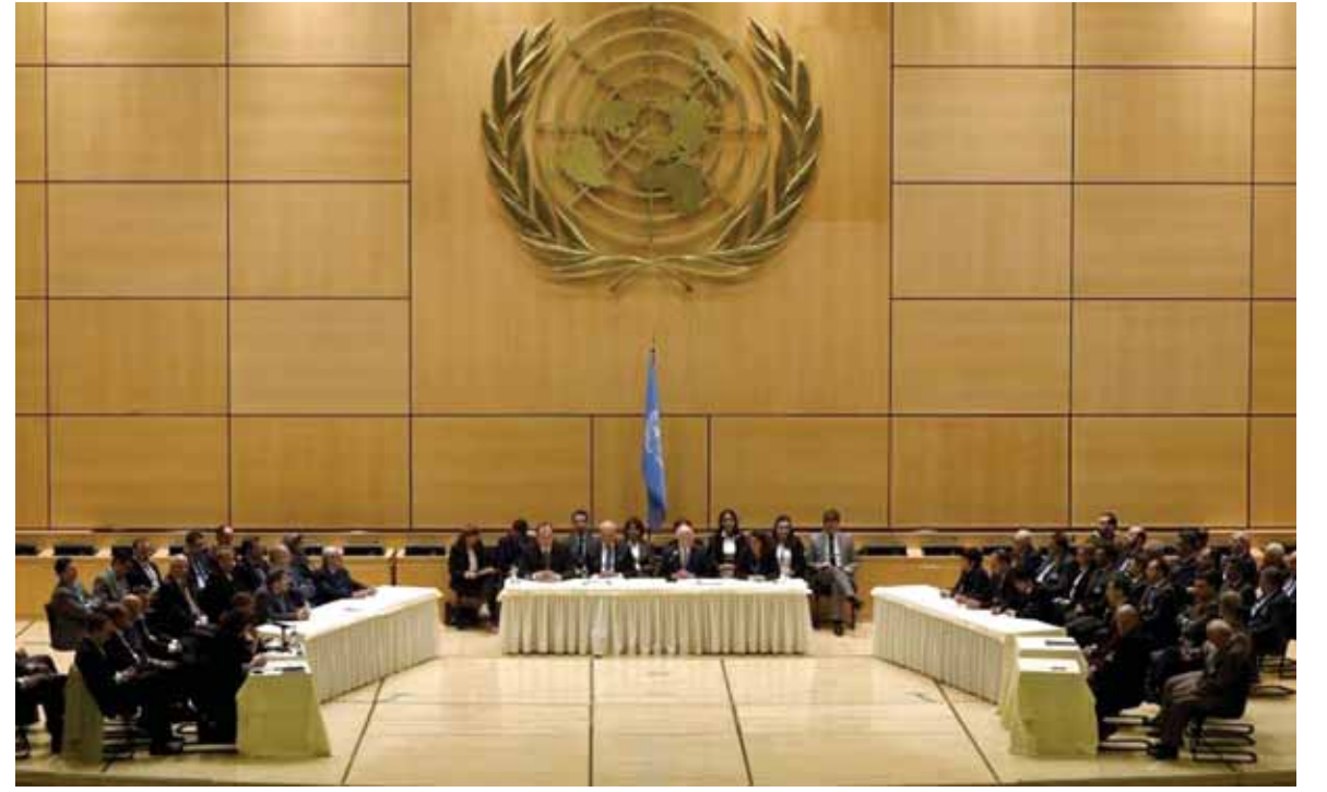
المشاركون في جلسة افتتاح مفاوضات جنيف