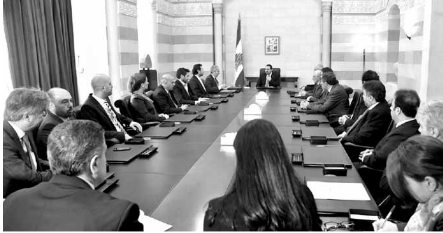
وقد التجار عند الرئيس الحريري

يستمر مجلس الوزراء في درس مشروع قانون موازنة ٢٠١٧، حيث ترأسه الرئيس سعد الحريري، وجرت خلاله مواصلة البحث في مشروع الموازنة العامة، واستمرت الجلسة لغاية السابعة والنصف مساءً، تحدث على أثرها وزير المال علي حسن خليل فقال: «أحرزنا اليوم تقدماً كبيراً جداً، وقد أنجزت مبدئياً كل المواد القانونية المتعلقة بالموازنة، وبدأنا بنقاش الإجراءات الضريبية والتعديلات، وقد حدد دولة الرئيس موعداً لثلاث جلسات تعقد الأسبوع المقبل بدءاً من يوم الإثنين. وبحسب تقديراتنا، من الممكن أن ننجح إقرار الموازنة خلال هذه الجلسات».