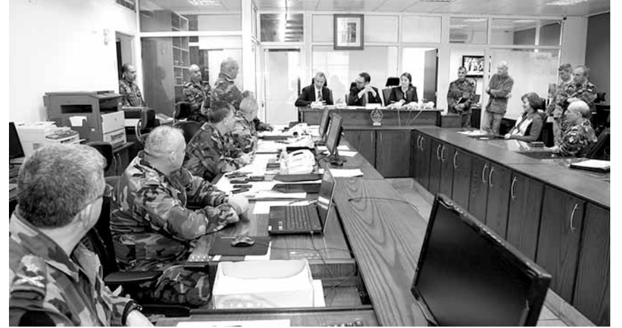
الوفد الأميركي في وزارة الدفاع

لقوى الجيش المنتشرة على الحدود الشرقية، وجهوزيتها القتالية لمواجهة التخطيمات الإرهابية وسيط أعمال التسلل والتخريب.