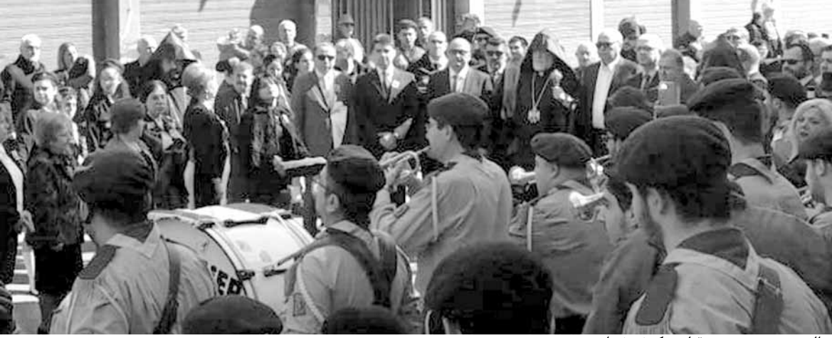
اهالي برج حمود يستقبلون كيشيشيان

وذبح الخراف وصولاً الى مدخل الكنسية حيث تجمع المؤمنون».