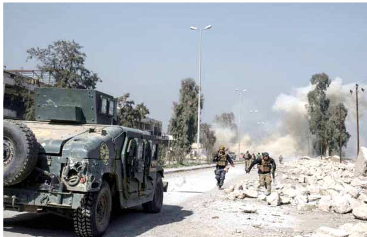
المعركة بالقرب من مطار الموصل

إعادة تجميع صفوفهم. إنها أفضل طريقة للقضاء عليهم بسرعة».