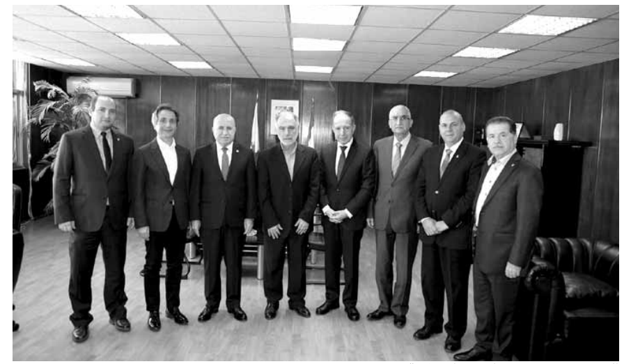
الوزير فنيش مستقبلاً وفد الاولمبية

عبر رئيس اللجنة الاولمبية اللبنانية جان همام عن بالغ ارتياح اللجنة الاولمبية خصوصاً والعائلة الرياضية عموماً في لبنان إلى تولي الوزير محمد فنيش مقاليد وزارة الشباب والرياضة نظراً لما يتمتع به من خصال وقيم اخلاقية إضافة الى تجربته الغنية في موقع المسؤولية الحكومية بفعل تمرسه على هذا الصعيد خلال السنوات الماضية.