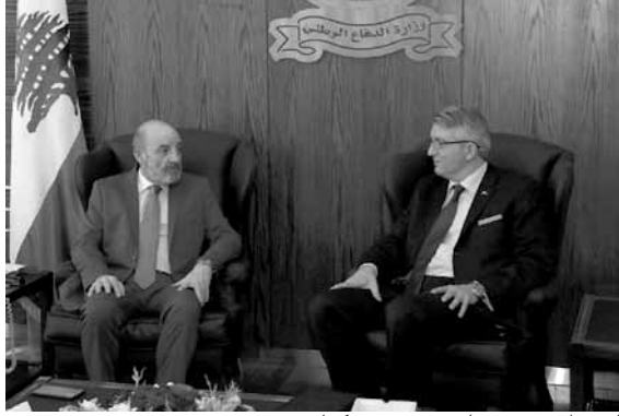
الصراف مجتمعاً مع سفير تركيا

استقبل وزير الدفاع الوطني يعقوب رياض الصراف، قبل ظهر امس في مكتبه في الوزارة، سفير تركيا شغاطاي ارسينز وتم التداول في القضايا المشتركة وسبل تطوير التعاون العسكري والمدني بين البلدين.