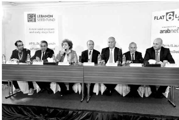
خلال الإعلان عن الصندوق

مع أكثر من ١١٠ استثماراً في الشركات الناشئة من مصر والمملكة العربية السعودية والامارات العربية المتحدة في قطاعات مختلفة تقدم Flat6Labs Beirut الخبرة الإقليمية والمهارات العملية اللازمة لتمكين الشركات اللبنانية الناشئة