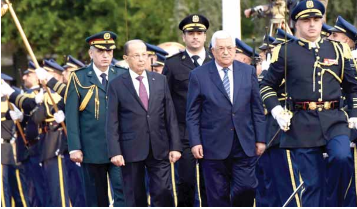
الرئيسان عون وعباس يستعرضان حرس الشرف