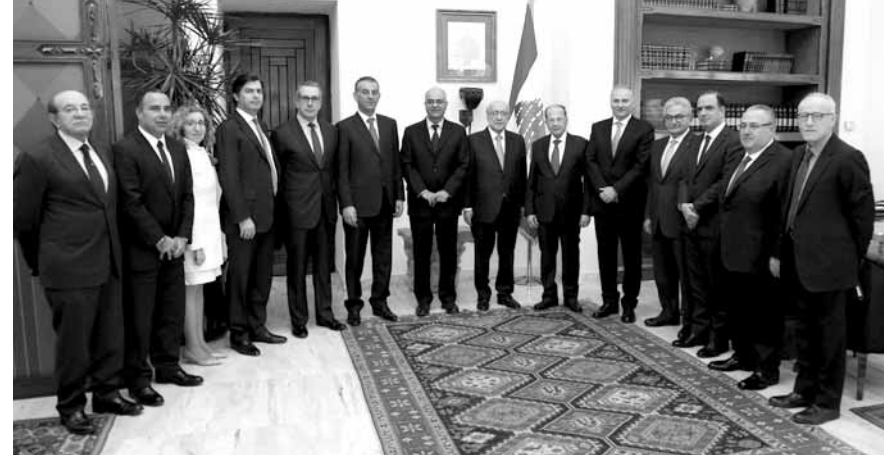
وقد المصارف عند الرئيس عون