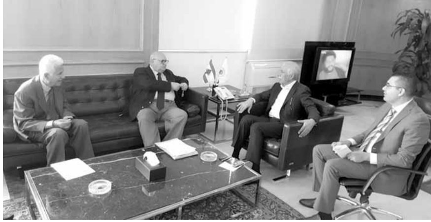
زعيمت مع وفد بلدية صيدا

بشأن الاشراف على جزيرة صيدا.» وشكر الوزير على «ما يقوم به من اعمال لمدينة صيدا.» وتابع زعيمت بشأن الاماني المناطق مع عدد من ممثلي البلديات وفاعليات المناطق.