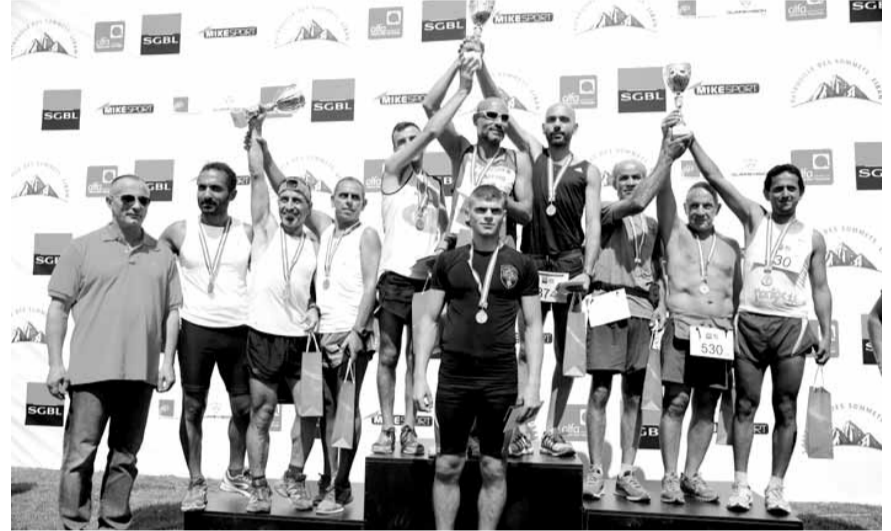
نتيجة الإبطال وبدا العميد روكز إلى اليسار

من جرود الممتد انطلق المشاركون امس في «سباق القمم» السادسة صباحاً نحو الجرود الكسروانية، حيث اختبروا فريدة مسالك لبنان الطبيعية التي تربط بين باكيش والمزار، مروراً بسد شبروح ففسر فقرا الطبيعي. وقد وصل عدد المشاركين في السباق السنوي الأول الذي أطلقته جمعية «سباق القمم Patrouille Des Sommets» برعاية وحضور العميد الركن المغوار شامل روكز إلى ١٨٠٠ مشارك أتوا من كل المناطق اللبنانية واقتربوا الأرض في خيمهم التي نصبوها في جرود باكيش ليل السبت، بعد أن استمعوا إلى تعليمات وتوجيهات رئيس الجمعية غابي أبي صعب الخاصة بالسباق، وتشاركوا عشاءاً قروباً متعاً حول النار امتد حتى ساعات متأخرة من الليل. وكانت رعاية العميد روكز للسباق ومشاركته فيه ملفتة ومشجعة للمشاركين، ولم تخلو ليل السبت من التشديد على أهمية النشاط. وقد توجه للمشاركة بالقول: «علمت أنكم قادمون من مختلف المناطق اللبنانية، تنوعكم يعكس روحية المؤسسة العسكرية التي أنبت منها، عيشوا لبنانيتكم ومواطنيتكم بهذه