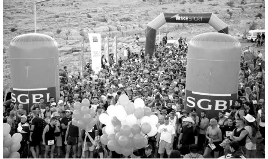
قبيل انطلاق السباق