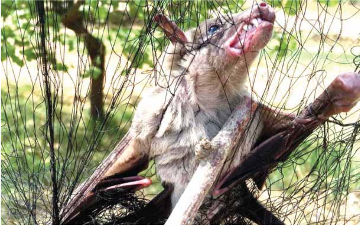
الخفاش داخل الشباك

وهي المرة الاولى التي يشاهد فيها خفاش من هذا النوع في البلدة، والذي لا يتواجد سوى في الأمازون في البرازيل ويعيش في الغاوير.