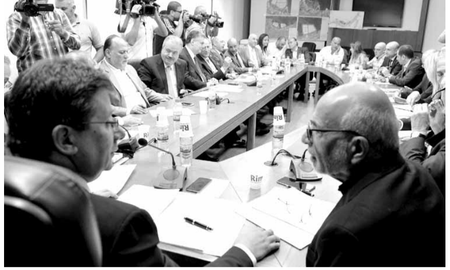
اجتماع لجنة المال برئاسة كنعان

عقدت لجنة المال والموازنة جلسة برئاسة النائب إبراهيم كنعان، خصصت للبحث في ملف النفايات، في حضور وزير الزراعة: اكرم شهيب، والنواب اغوب بقرادونيان، سامي الجميل، فادي الهبر، علي عمار، نواف الموسوي، حكمت ديب، ياسين جابر، ألان عون، سيمون ابي رميا، عاطف مجدلاي، احمد قنفت، جمال الجراح، هنري حلو، ايلي ماروني وسامر سعادة، رئيس مجلس الإنماء والإعمار نبيل الجسر، ومجموعة من الخبراء من ضمن اللجنة الفنية العاملة مع الوزير شهيب.