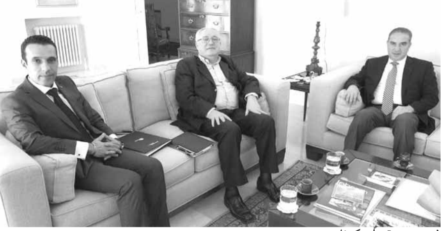
فرعون مجتمعاً بمركزل

استقبل وزير السياحة ميشال فرعون وفداً من تجمع رجال الأعمال اللبنانيين والفرنسيين في فرنسا HALFA برئاسة أنطوان منسى وعضوية نائب الرئيس منصور خوري والأمين العام نيقولا فيعاني والسيدة أولين فيعاني قربان، وجه اليه دعوة مفتوحة للقاء الجالية اللبنانية في فرنسا والقاء محاضرة عن الوضع السياسي والسياحي في لبنان وكيفية تمتين العلاقات