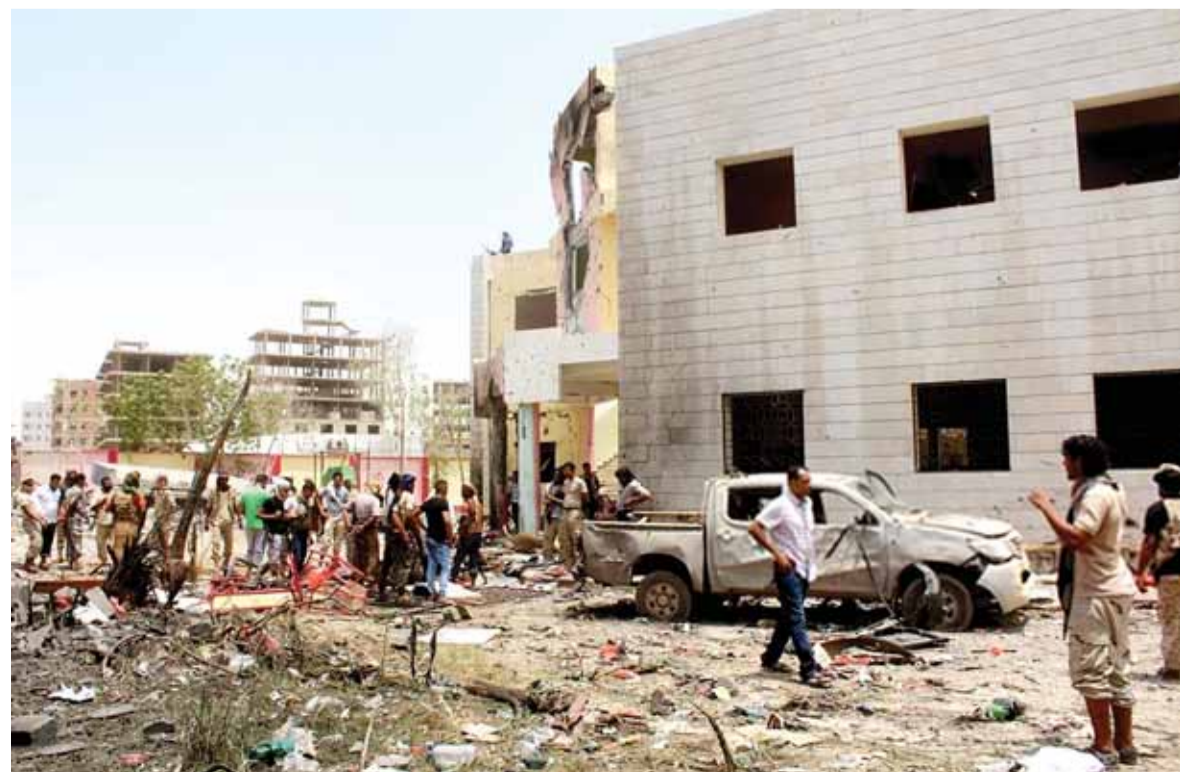
آثار الانفجار في عدن

استهدف تنظيم «داعش» الراهبي حفل زفاف في كربلاء بخمسة انتحاريين مما ادى الى مقتل ١٨ شخصاً، فيما ارتفع ضحايا الهجوم في عدن الى ٦٠ قتيلاً.