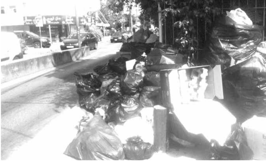
نفايات في جونية