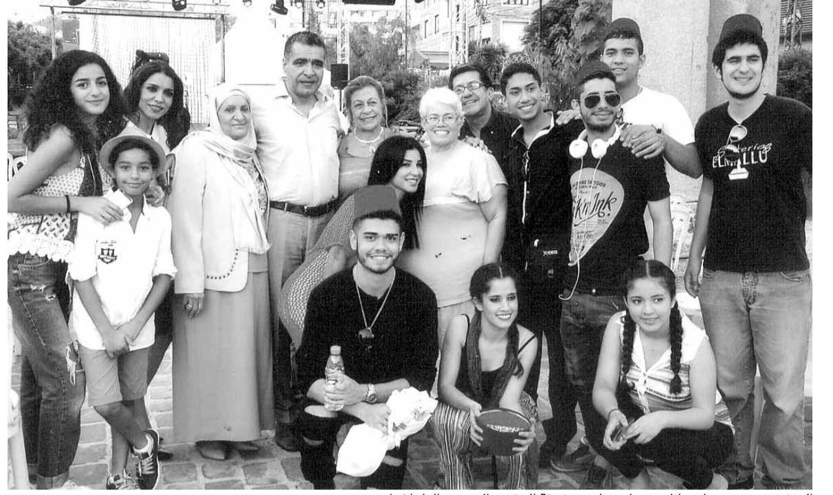
السفير حسن ضيا وعائلته مع اعضاء من فرقة الرقص الشعبي الباراغواني