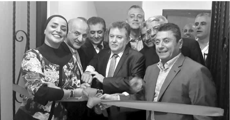
افتتاح فرع التعاونية