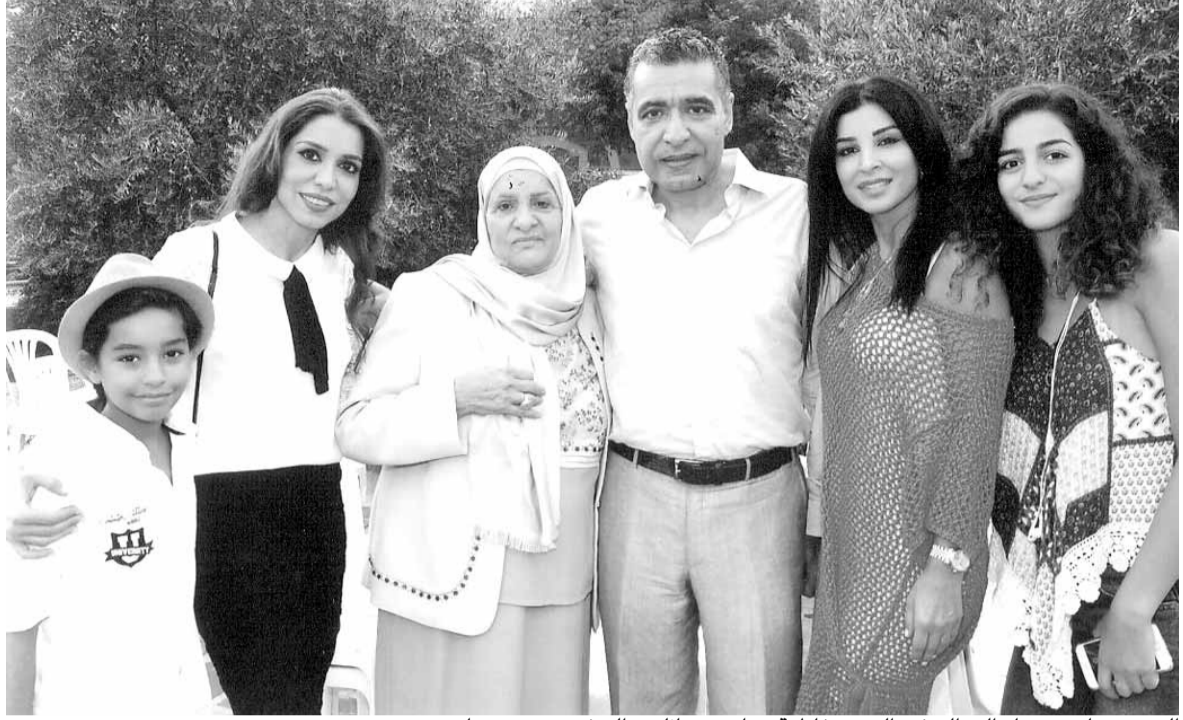
السيدة هنادي ضيا والدة السفير السيدة فاطمة جباعي وعائلته والسفير حسن ضيا

جهد وهبي. حضر الحفل الى جانب رئيس بلدية جبيل الاستاذ زياد حواط شخصيات ديبلوماسية وثقافية واعلامية. والقي سعادة السفير حسن خليل ضيا كلمة في المناسبة نوه فيها على رسالة لبنان الثقافية ودعا الى بناء السلام وجسور الصداقة بين شعوب العالم، كما جاء في كلمة رئيس البلدية تاكيد على دور جبيل في ابراز صورة لبنان الحضارية.