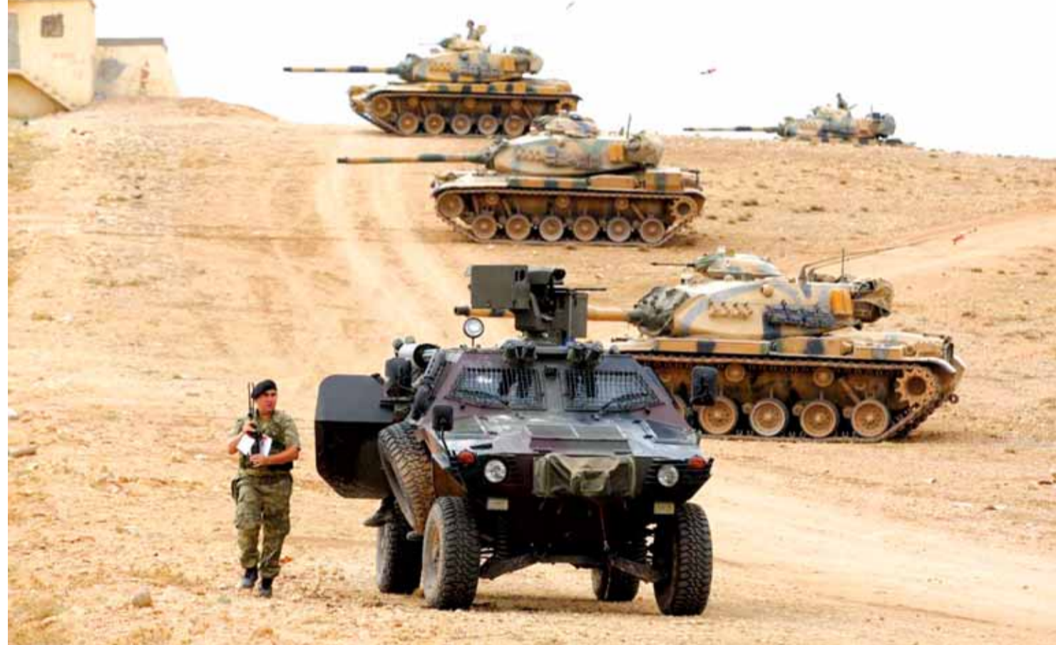
المزيد من الدبابات التركية الى الاراضي السورية

التطورات السورية تتسارع على وقع تصاعد العمليات العسكرية التركية ضد قسوات سوريا الديمقراطية في منبج مع معلومات عن حشود تركية لمواجهة مدينة «عين عرب» كوبياني، التي تسيطر عليها وحدات حماية الشعب الكردي.