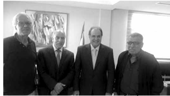
قزي مستقبلاً وفداً من «الديموقراطية»

القوانين، إضافة إلى حل مشكلة بعض القطاعات العمالية كالسائقين والصيدادين والعاملين في المؤسسات».