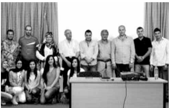
المشاركين في الندوة

وأبدى خشبيته من عدم إقرارها، «وما إذا كانت الحكومة ستتمسك كما السنوات الماضية، بعدم إقرار الموازونات العامة، لكن على المسؤولين السياسيين أن يعوا أن الوضع الإقتصادي والمالي عام ٢٠١٧ أخطر بكثير من الأعوام السابقة، من هنا يفترض إقرارها وعدم التلهي بأمور أخرى». ولفت إلى أن «مشروع الموازنة أصبح ملغاً سياسياً - مالياً بامتياز، لذلك يحتاج إقراره إلى التفاهم والتوافق السياسي، لمعالجة المعوقات التقنية على صعيد قطع الحساب، وإعترضات على السلسلة، وإجراءاتها الضريبية».