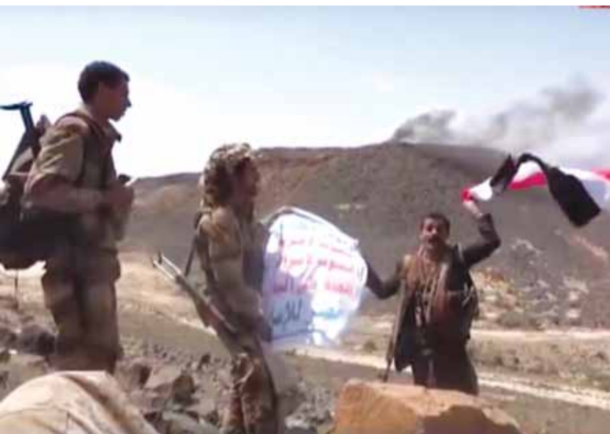
الجيش اليمني واللجان الشعبية يرفعون العلم اليمني

لعملية نوعية تمكن خلالها الجيش اليمني واللجان الشعبية من دحر العسكريين السعوديين من قلل الشيباني اليمنية المطلة على منفذ علب.