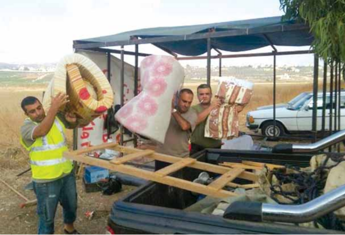
متطوعو الدفاع المدني ازالوا خيمهم قرب الحدود بعد وعود تلقوها بحل قضيتهم على ان يعقدوا مؤتمرا صحافيا اليوم في ساحة الشهداء