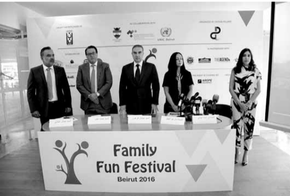
فرعون يلقي كلمته

أطلق مركز الأمم المتحدة للإعلام في بيروت بالتعاون مع شركة Design Pillars، لتنظيم المناسبات العامة، والخاصة، «مهرجان العائلة» في نسخته الأولى برعاية وحضور وزير السياحة ميشال فرعون، خلال مؤتمر صحافي عقد في وزارة السياحة، حضره هاغوب ترزيان مفلاً رئيس مجلس بلدية بيروت جمال عيتاني، رئيس اتحاد غرف