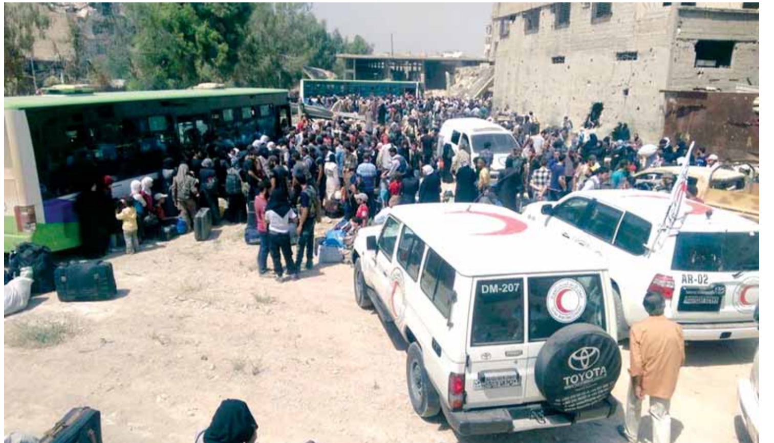
عملية إخلاء داريا من المسلحين... والاهالي يخرجون الى مناطق آمنة

ووضعت مصادر متابعه هذه العملية في خاتمة الإنجازات الكبيرة للجيش السوري في فرط عقد الجماعات المسلحة داخل المناطق المحيطة بالعاصمة دمشق، إضافة الى قطع الارتباط العسكري والجغرافي مع الريف الجنوبي ومحور خان الشيخ ومحور القنيطرة، وبالتالي توسيع الطوق الجغرافي