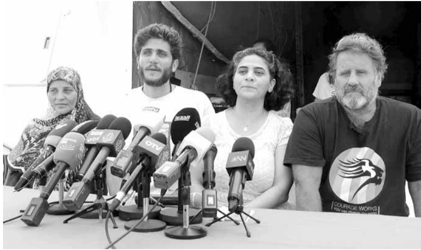
غرينيس اطلقت مبادرتها