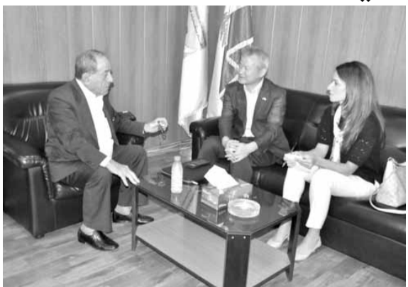
القنصل الكوري عند الحسيني

ضباط وافراد الكتبية الكورية في منطقة صور وتفاعلهم مع أبناء المجتمع المحلي»، وقال: «أن الاحتفال السنوي الذي سوف تقيمه جمعية التلاقي اللبنانية الكورية سوف يكون مميزاً هذا العام وسوف يؤكد على مئانة الروابط التي تجمع بين الشعبين اللبناني والكوري من عادات وتقاليده».