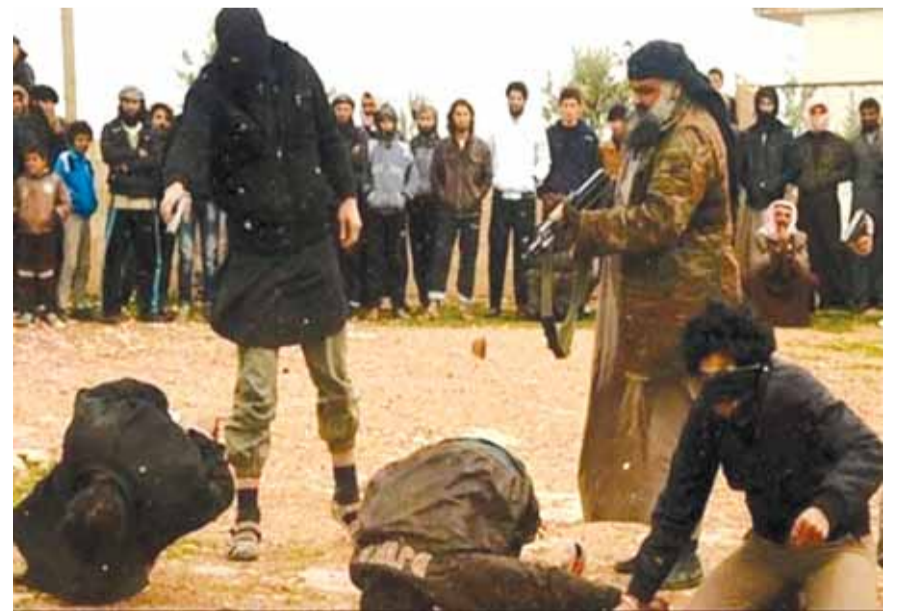
«اعشيون» يعدمون شاباً ريميا بالرصاص

بسبب محاولتهم الهروب من المناطق التي يسيطر عليها داعش، إلى ناحية العلم قرب تلال حميرين غرب الحويجة بمحافظة كركوك.