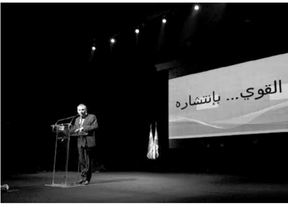
باسيل يلقي كلمته

من داخل الإنتداب أو الوصاية أو الاحتلال، هؤلاء كلهم نقول إنهم هم السابقون، وأنتم اللاحقون، رحمت الله على السابقين وبعثت الله على اللاحقين». وقال: «أنا شعب متجنز في أرضه وقوته أنه عندما ينتقل إلى مكان آخر ينجح، ونقول ذلك في الوقت الذي تتعرض فيه أرضنا للغزو، ولتبدل هويتها، وتعلمون أن لا جنسية من دون أرض، ولا معنى لوطن من دون أرض، فالأرض هي ارتباط الإنسان بوطنه وجنسيته لأنه عندما تضع الأرض،