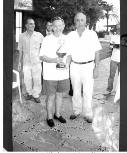
صورة تجمع البستاني وشكر الله