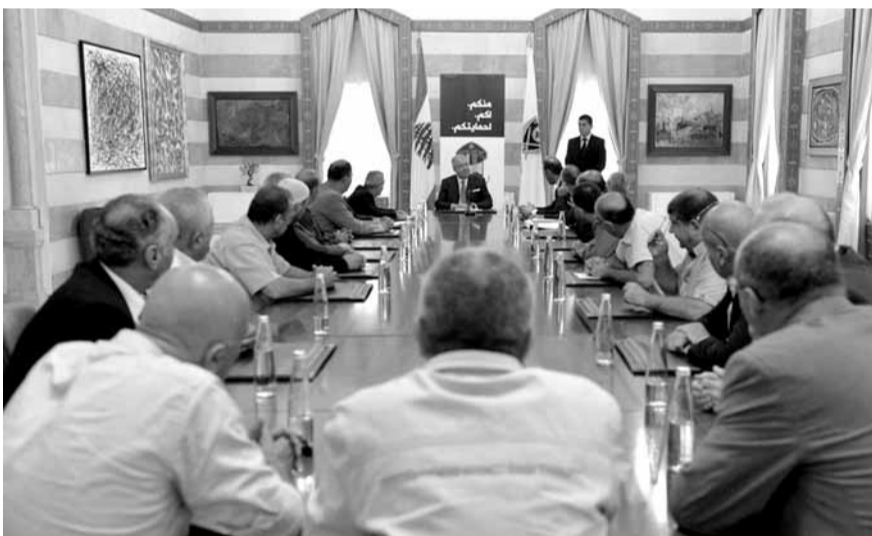
المشوق مع الوفد