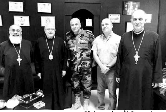
درويش مستقبلاً مسلم وعاركة

الجيش وسائر القوى الأمنية في الحفاظ على الأمن، وبالخطوات الإستباقية التي يقوم بها لتوقيف المشتبه فيهم بالانتماء الى المنظمات الإرهابية»، معتبراً ان «الجيش هو صمام الأمان للوطن وعلى الجميع التعاون معه وتقديم كل دعم ممكن له».