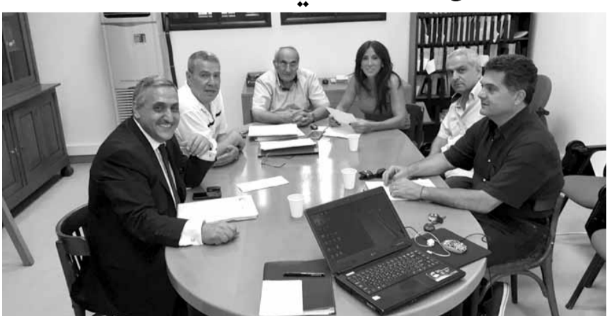
من اجتماع اللجنة الادارية للنادي واللجنة المنظمة للدورة

تبلغ جوائز الدورة ١٢ الف دولار اميركي (٦ آلاف دولار جوائز مالية و٦ آلاف دولار جوائز عينية). وسيحصل الفائز في فئة فردي الرجال على الف دولار وهو من الأعلى في لبنان لهذه الفئة بينما ستحصل الفائزة في فئة فردي السيدات على ٨٠٠ دولار اميركي. وغابت بطلة لبنان السابقة بالتنس ناهيا ابو خليل مديرة للدورة. هذا وعقدت اللجنة الادارية للنادي والمنظم واللجنة المنظمة للدورة جلسة وضعت خلالها كافة الترتيبات لانجاح الدورة حيث بدأت عملية تأهيل المعين ذات الأرضية الترابية.