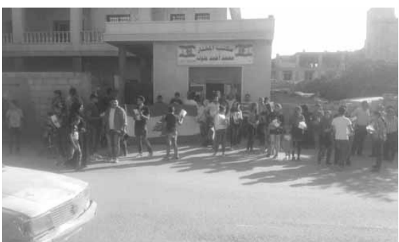
حاجز محبة في عرسال

وعلم الجيش الذي يؤكدون من خلاله تأييد ودعم الجيش اللبناني في تحركاته لحمائية أبناء الوطن جميعاً. وشعار الجيش هذه السنة حماية ١٠٥٤ كلم، ونحن في جزء كبير من هذه المساحة.»