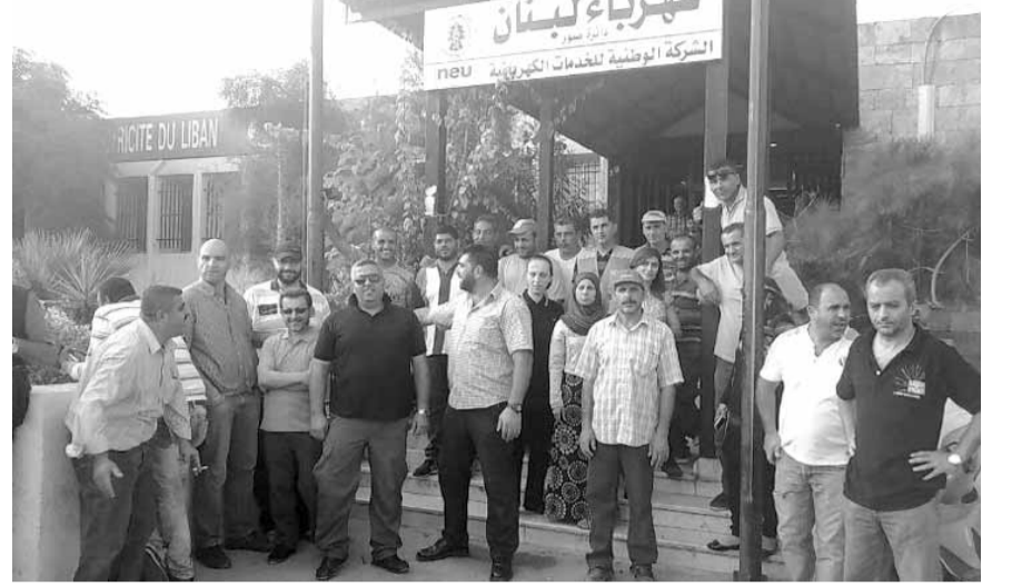
خلال الاعتصام في صور

أعلنت شركة «NEW» للخدمات الكهربائية في مؤسسة كهرياء لبنان في بيان توضيحي أمس أنها ورغم الاضراب المستمر منذ حوالي العشرة ايام، فانها ما تزال تقوم بكل ما يلزم لتأمين التصلبكات وكافة أعمال الصيانة ضمن ما تسمح به الظروف الناجمة عن الاضراب ونفت صدور اي بيان آخر عنها يتعلق بامور الصيانة