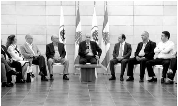
جعجع مستقبلاً وفداً من تنورين

عليه كي يبقى دون محاسبة أو يفضل رئيساً على قياس صغير ويتحكم به.»