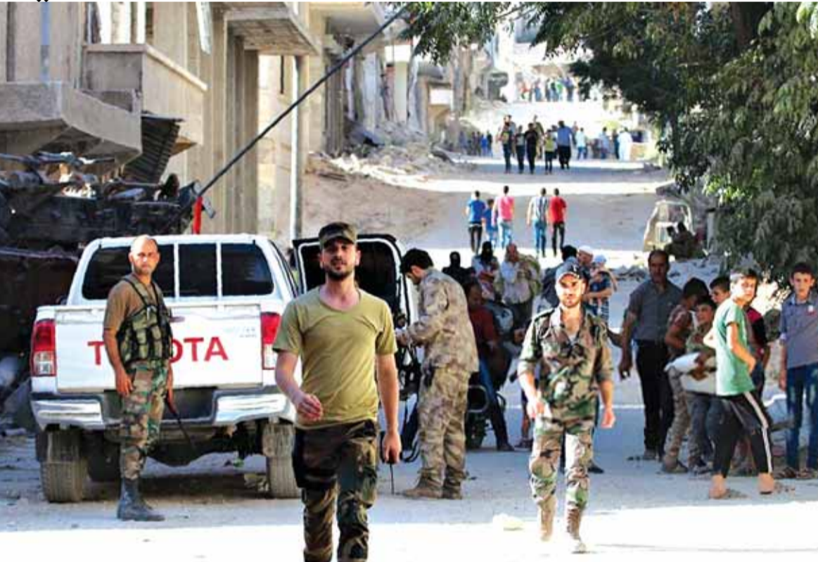
الجيش السوري يؤمن عودة المدنيين الى حي بني زيد

تقدم الجيش السوري ومجاهدو حزب الله في مدينة حلب وسيطرتهم على حي «بن زيد» واكتمال الحصار على مواقع المسلحين في الاحياء الشرقية في حلب، سيغير المعادلات سيؤدي الى موازين جديدة على الأرض، ستفرض تأثيرها على المفاوضات القادمة واخر اب برعاية اميركية - روسية. كما ان المشهد الحلبى الجديد اسقط كل الاحلام عن الشمال السوري وقيام دوليات وتقسيم سوريا. وبالتالي فان ما حصل في حلب «تحول» كبير في مسار الصراع الذي بدأ عام ٢٠١١. وقد استكمل الجيش السوري تنظيف حي «بن زيد» من الاعماد فيما قامت مروحيات عسكرية سورية (تتمة الخبر السوري ص ١٦)