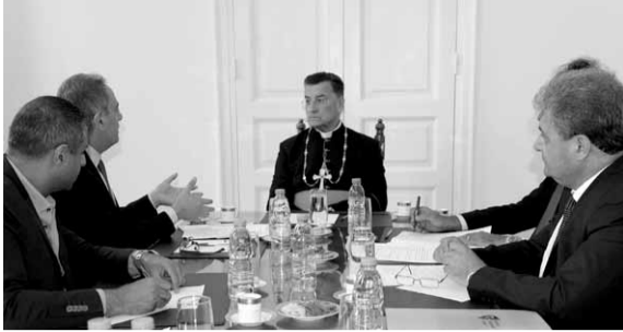
خلال اجتماع مكتب التنسيق بين المؤسسات المرتبطة بالبطريركية