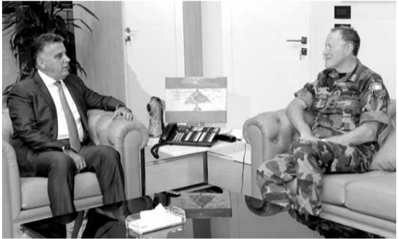
بيري خلال زيارته إبراهيم

إلى الحفاظ على الاستقرار والهدوء في جنوب لبنان.