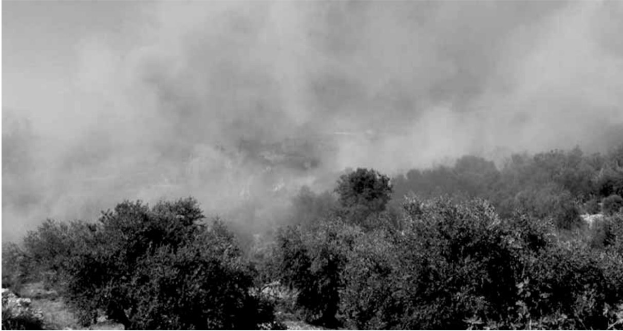
الحريق في حبالين

على اثر موجة الحرّ الشديدة التي تمرّ في منطقة الخليج منذ ايام والذي وصفها الخبراء انها غير مسبوقة، اجتاحت النيران منذ ظهر أمس الاول مناطق عريضاليم، حومين، حيوش حيث التهمت مئات اشجار الزيتون والتين والعنب وأراضي شاسعة في البلدات الثلاث، واستمرت حتى ساعات الصباح من اليوم الثاني على الرغم من تدخل عشرات الشبان الذين هبوا للمساعدة للمحافظة على أرزاق اهلهم وابتاء بلداتهم. وتدخلت سيارات الإطفاء التابعة للدفاع المدني التي عجزت عن ملاحقة النيران التي وصلت الى بعض المنازل في بلدة عربصاليم ومنها منازل المواطنين كما أتت النيران على أشجار العنب والتين ومثلت من الزيتون. وعملت الهيئة الصحية الاسلامية على مواكبة المواطنين وإرشادهم للوقاية من آثار النيران وما تسببه من حالات اختناق. وقد ناشد المواطنون الدولة اللبنانية زيادة عديد أفراد الدفاع المدني وتجهيزهم بما يلزم من معدات وسيارات اطفاء لمنع امتداد الحرائق للحفاظ على بيئة نظيفة.