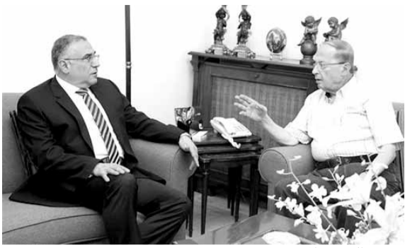
عون والسفير المصري

تأسيس مشروع وتقنية لتأمين هذه العودة الي مناطق آمنة. عندما كنت اتكلم عن ذلك كان البعض يقول لي هذا خيال، اما اليوم فقد اصبح الخيال حقيقة ورئيس حكومة لبنان نفخر به وبخطابه.»