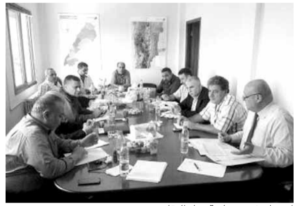
اجتماع في مصلحة مياه البقاع

مبنى بلديتها لوضع آليات منظمة ومدروسة لتنفيذ الخطة الرامية إلى تأمين المياه إلى المشتركين بشكل عادل وأقساح المجال أمام المواطنين للمبادرة إلى تقديم طلبات اشتراك سنوية للمصلحة وبالتالي ضبط العيارات وتحريير محاضر ضبط لكل مخالف يتعدى من جديد على مصادر مياه المصلحة. على أن يسبق ذلك اطلاق حملة اعلامية لتوعية المواطنين وتعريفهم حقوقهم وواجباتهم.