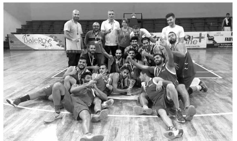
فريق الانطونية بعديا يحتفل باللقب