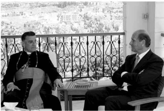
الراعي مستقبلاً شربل

فأين الكرامة لنتنظر سنوات ليقرروا عنا من سيكون رئيسا للجمهورية؟»