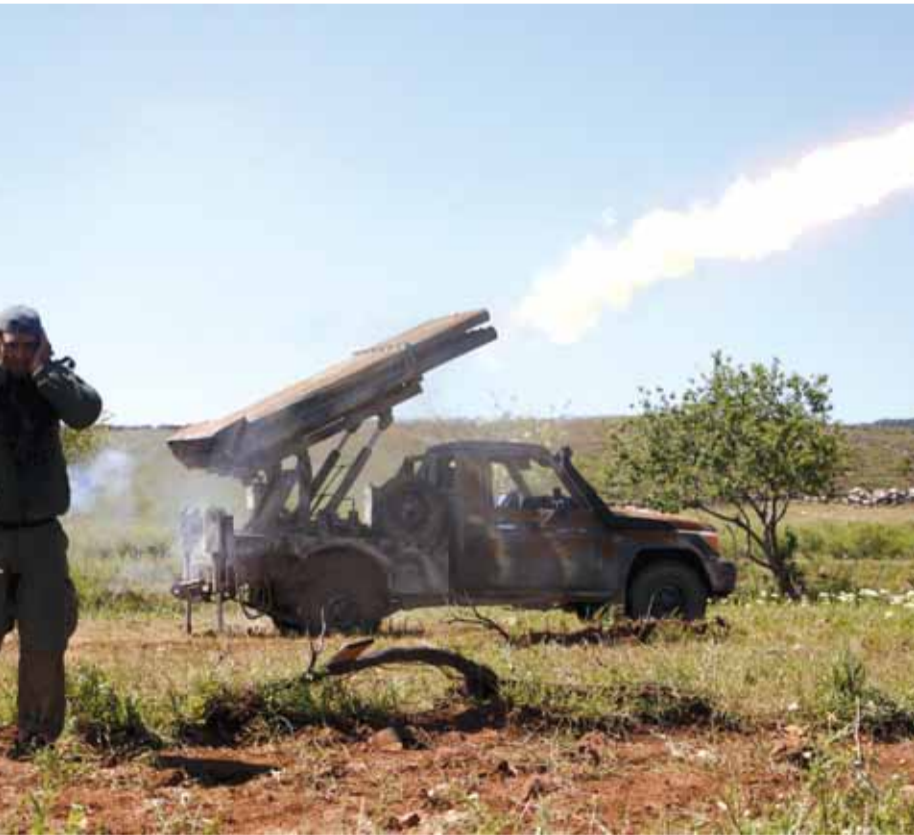
قصف الجيش السوري على مواقع المسلحين في حلب

مسؤولون اميركيون أنها تعرق الانتقال السياسي في سوريا. من جهته، أعلن وزير الخارجية الروسي أنه بحث تطورات الأوضاع في سوريا وسبل مكافحة «الإرهاب» مع نظيره الأميركي، فضلاً عن الخطوات التي يمكن القيام بها لتنفيذ الاتفاقات حول سوريا. وقال لافروف إن الولايات المتحدة قادرة على فصل المعارضين المعتدلين عما وصفها بالمنظمات الارهابية في سوريا لكنها لا تقوم بذلك، وفق تعبيره. وشدد على ضرورة أن تُعقد المفاوضات السورية