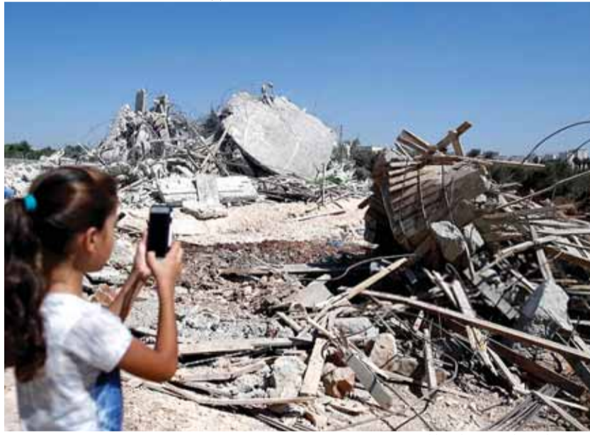
منزل هدمه الاحتلال في قلنديا امس