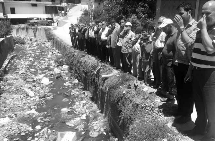
الاعتصام على ضفة النهر

البلدات مع محطة تكرير، وأشجار الى ان «كل الدراسات والنتائج من الملاكين ملحوظة في الملف ولكن للأسف ما زال الملف معلقاً في مجلس الإنماء والإعمار». وتحدث رئيس بلدية مشمش الذي وصف الواقع بهـ«الكارثي»، وقال: «إننا مهددون بالموث من جراء التلوث من الهواء ومياه الأنهر التي تسعين بالمئة منها مجاري والتي يعتمدها البيئمة محمد المشنوق ومجلس الإنماء والإعمار ورئيسه نبيل الجسر وكافة المعنّين «بإنتقاذ جرد عكار ووقف الضصر عنه وعن صحة اهله والأفراج عن الملف العالق بالأدراج منذ ما يقارب الخمسة عشر عاما لإنشاء صرف صحي لكل