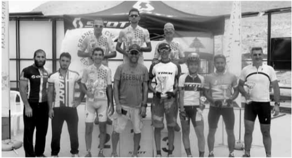
الفائزون بعد تتويجهم

نظم الاتحاد اللبناني للدراجات الهوائية سباق بطولة لبنان للدراجات الجبلية لسنة ٢٠١٦ بمشاركة لاعبي سبع جمعيات اتحادية على مضمار التزلج جونكسيون-كفرديان لخمس دورات بمجموع ٢٠ كيلومتراً. فاز بالسباق بطل لبنان