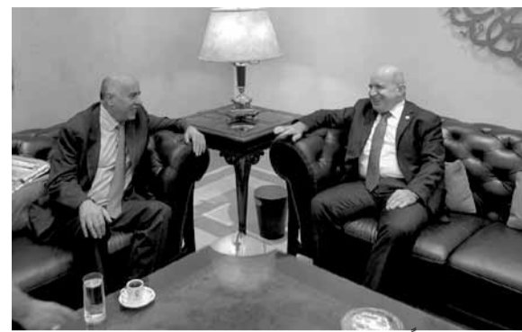
حيدر مستقبلاً الرجوب

استقبل نائب رئيس اللجنة الأولمبية اللبنانية رئيس الاتحاد اللبناني لكرة القدم المهندس هاشم حيدر في مكتبه رئيس اللجنة الأولمبية الفلسطينية رئيس الاتحاد الفلسطيني لكرة القدم اللواء جبيريل الرجوب في زيارة خاصة تم التباحث خلالها بشؤون الرياضة العربية بشكل عام وكرة القدم العربية والآسيوية بشكل خاص.