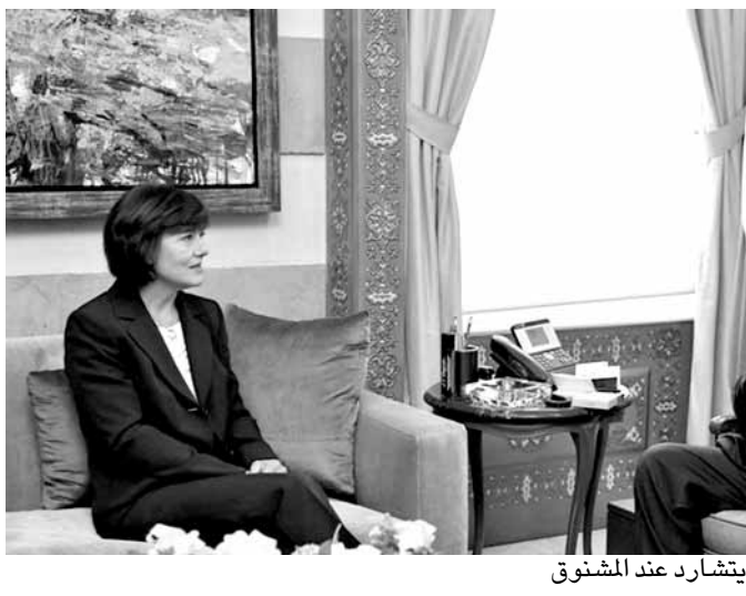
ريتشارد عند المشنوق

الرئيسي. جاء ذلك خلال لقائه اليوم السفارة ريتشارد التي استمعت إلى رأيه في القضايا السياسية المطروحة، وتطرق البحث إلى اطر دعم الحكومة اللبنانية لتخفيف اعباء النزوح السوري. وشكر المشنوق للسفيرة الأميركية تأكيداً أهمية استمرار الشراكة ودعم التعاون الأمني مع لبنان.