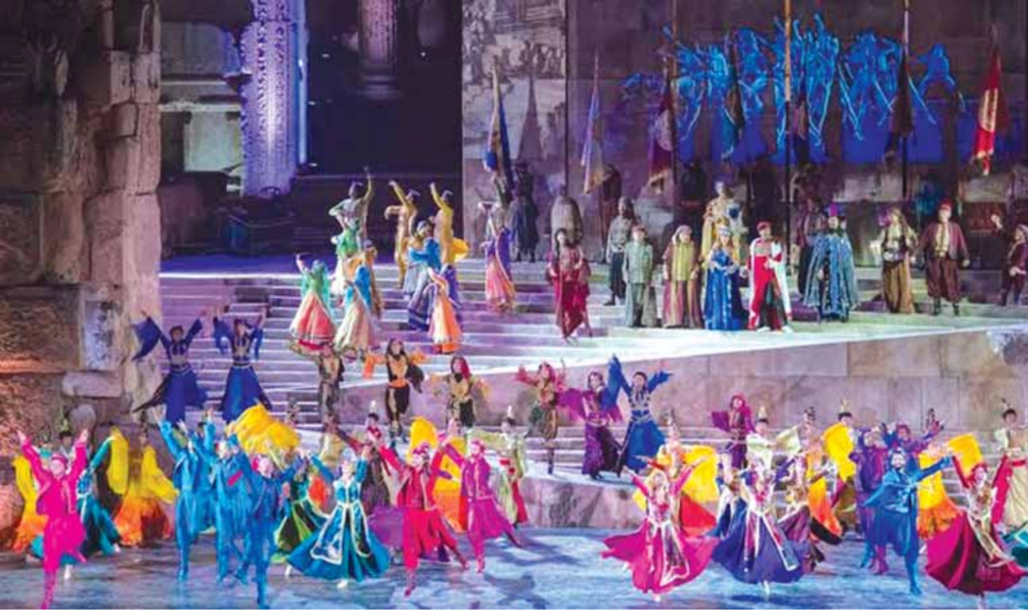
لوحة فنية لفرقة كركلا خلال افتتاح مهرجانات بعلبك الدولية

لماذا لا يحدث انقلاب عسكري في لبنان؟ لن نذهب مع القائلين بان الولايات المتحدة تعمل على تعزيز الجيش من أجل تلك اللحظة، أي من أجل جمهورية الموز. من يلتقي العماد جان قهوجي أو كبار الضباط يلاحظ أنهم أكثر ديمقراطية بكثير من ملوك الطوائف في البلاد... خبير في إحدى المؤسسات الدولية وضع تقريراً مفصلاً حول لبنان وبعث به إلى الإدارة المركزية لهذه المؤسسة، الغريب أن التقرير ينتهي بفقرة تعتبر أن لبنان بات بحاجة إلى عملية جراحية، والأفوه ماض، حتماً، إلى الانفجار. الانفجار الذي يهدد بإزالة الدولة في لبنان. كلام لا يمكن تصوره حول الطبقة السياسية الموهلة في الفساد، وفي الزبائنية، وفي غياب شامل لأي رؤية أو حتى لأي تفكير استراتيجي، بل إن الجمهورية تدار، وبالطرف الواحد، كما تدار «مقاهي الحشيش».. والتقرير يشير إلى أن أزمة مثل «أزمة القمامة» لم تحل حتى الآن رغم انقضاء أكثر من عام على اندلاعها، والسبب هو العمولات والسمسرات، والتفويضات، والتي حد الإشارة إلى «الصوملة السياسية» و«الصوملة الاقتصادية»، على السواء... فصل كامل في التقرير عن مشكلة الكهرباء، يطلق عليها «فضيحة القرن في لبنان»، وكاد يقول «جريمة القرن في لبنان»، المثير هنا أن واضع أو واضعي التقرير يلاحظون أن ثمة