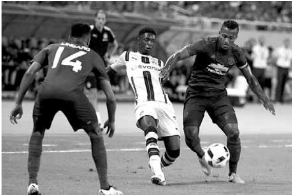
صراع على الكرة في لقاء دورتموند ويونايتد