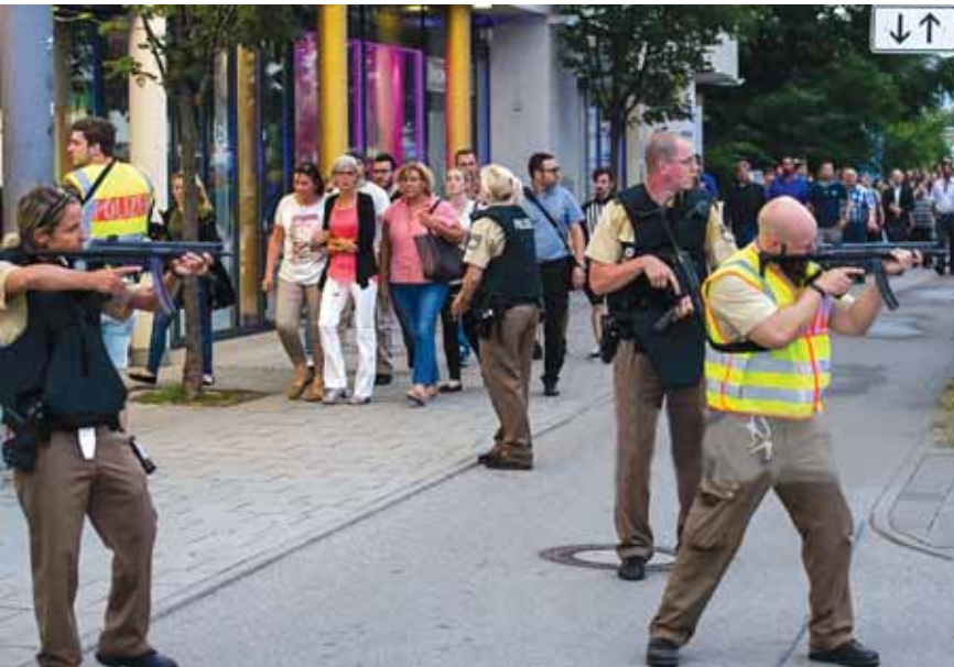
الشرطة الألمانية تلاحق ملقحي النار

النار بالمركز الأولمبي التجاري بميونخ، حيث أظهرت لقطات تلفزيونية العشرات من سيارات الطوارئ والشرطة أمام مركز التسوق، وسط تحليق مروحيات تابعة لها. ونقلت «رويترز» عن الشرطة الألمانية أن أكثر من مسلح شاركوا في الهجوم على المركز ونقلت وكالة «رويترز» عن شرطة ميونيخ تأكيدها سقوط العديد من القتلى في إطلاق