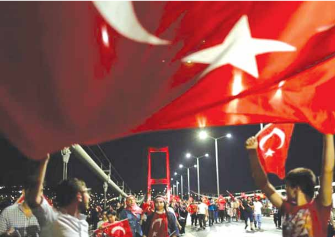
تظاهرات في تركيا داعمة لاردوغان

لا تزال عمليات الاعتقال مستمرة في تركيا للمشتبه في ضلعهم بمحاولة الانقلاب الفاشلة، فقد ذكرت وكالة أنباء «الأناضول» أمس عن أن النيابة العامة في أنقرة أمرت بتوقيف ٢٨٣ عنصراً من فوج الحرس الرئاسي للتحقيق معهم. وتم القبض على عقيد من المشاركين في الانقلاب وهو مختبئ في خزانة ملابس خوفاً من رجال الأمن، كما أفادت وكالة الأناضول أمس، وذكرت الوكالة أن عناصر من مديرية مكافحة الإرهاب اعتقلوا العقيد في منزل أحد أقاربه. وتفيد المعطيات الأولية بأن العقيد قاد شخصياً عملية قطع ومنع الحركة فوق جسر البوسفور في إسطنبول. وأثبت التحقيقات أن العقيد كان يتواصل مع الانقلابيين عبر «واتس اب». إذ كتب لرفاقه أثناء محاولة الانقلاب: «هل من الممكن إطلاق النار على الجسر المعلق الثاني؟...» في منطقة تشينغالكلي قتل ٤ أشخاص أيدوا المقاومة... لا توجد أي مشاكل. لا تسمحوا لهم بالاقتراب أطلقوا النيران عليهم». على صعيد آخر، الغت أنقرة عشرة آلاف جواز سفر لأشخاص موقوفين أو قد يغفرون خارج البلاد. واللافت أمس، كان موقف للرئيس الأميركي باراك أوباما يؤكد فيه عدم تلقيه معلومات استخباراتية مسبقاً حول الانقلاب في تركيا. ■ اردوغان يتقدم مبنى البرلمان هذا، وشدد الرئيس التركي رجب طيب اردوغان على أنه مهما طال الزمان أو قصر لن نسمح لأحد بتقسيم البلد وسنحافظ على وحدة شعبنا وبلادنا. وفي كلمة للشعب بعد صلاة الجمعة، أكد اننا سنقف دائماً