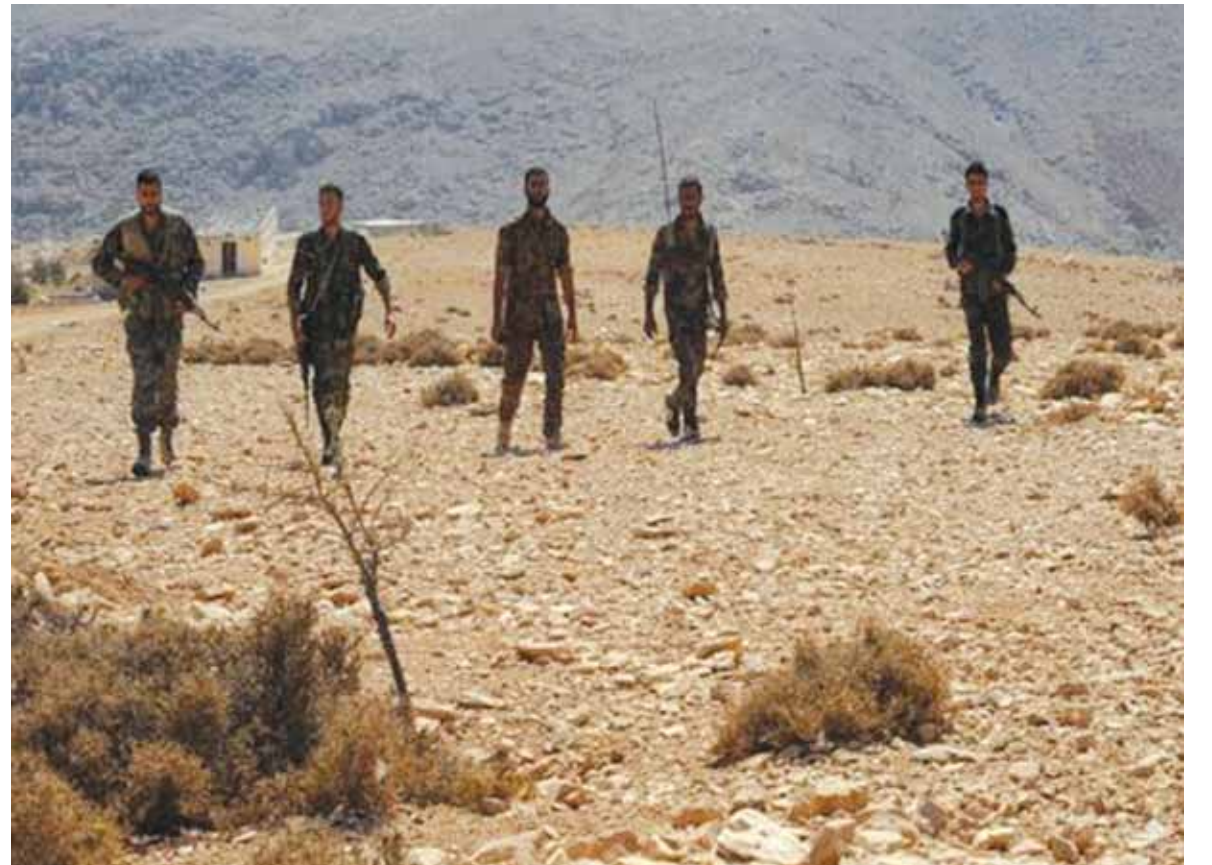
تقدم للجيش السوري في ريف دمشق الغربي

أعلن المتحدث الرسمي باسم الخارجية الأميركية جون كيري، أن المشاركين في اللقاء الثلاثي الروسي - الأميركي «الأممي» يبحثون في جنيف تعزيز نظام وقف الأعمال العدائية في سوريا وتحسين الوضع الإنساني وخلق ظروف مؤاتية لإيجاد حلول سياسية للنزاع السوري. وقال كيري، لوكالة «سيوتيك» نحن عموماً نبحث على مستوى العمل مع المسؤولين الروس سبل تعزيز وقف الأعمال العدائية وتحسين الوضع الإنساني وإنشاء ظروف ضرورية لإيجاد حل سياسي لهذا النزاع. كما أكد كيري، أن بلاده متمسكة بالمضي قدماً في الخطوات التي تمت الموافقة عليها من قبل وزير خارجية أميركا جون كيري، ووزير الخارجية الروسي (تتمة الخبر السوري ص ١٦)