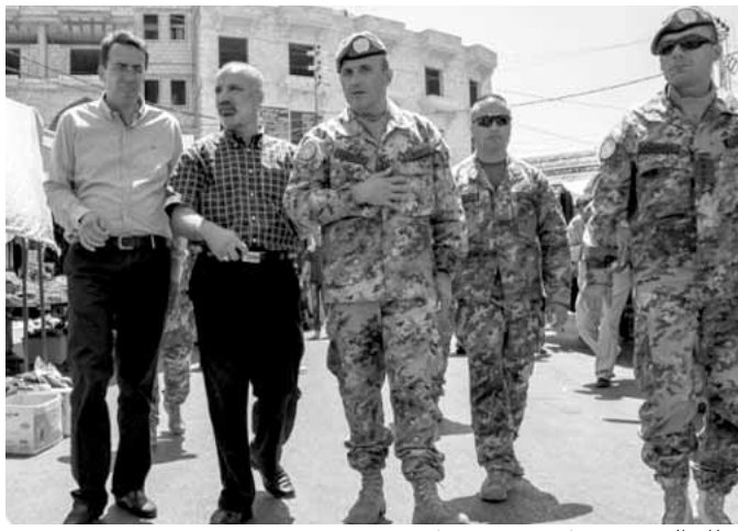
قائد القطاع الغربي جيول في بنت جبيل

الحكومة اللبنانية لدى «اليونيفيل» ونائب رئيس الأركان للعمليات العميد محمد جانيه.