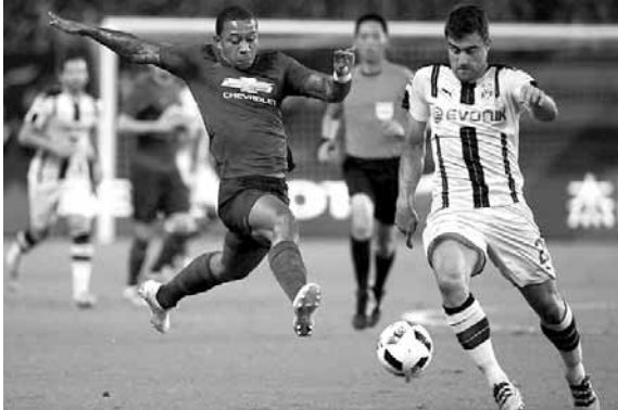
من مباراة بوروسيا دورتموند ومانشستر يونايتد

مجددا لتسقط الكرة أمام جونزالو كاسترو، الذي لم يجد صعوبة في إيداعها مرمى الشياطين الحمر في الدقيقة (١٩).