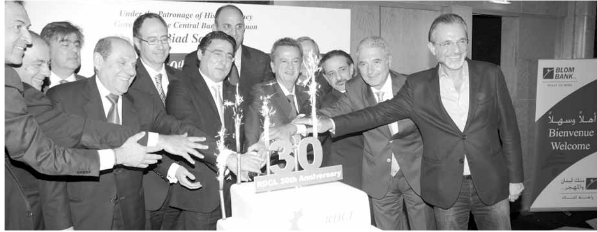
الحاكم زمكل مع أعضاء التجمع

وأوضح سلامة: «أن القروض المستعملة من البنك المركزي والتي استفادت المصارف من أعضائها من الإحتياطي الإلزامي والتي استفاد منها المواطن اللبناني وصلت إلى ٩ مليار دولار، وهذه سببها ٦٨٥ مليون دولار لم يستهلك وستستنفذ وإذا لزم الأمر مستعدون لزيادتها وبقى لنا الإستقرار بسعر صرف الليرة اللبنانية والإستقرار بمستوى الفوائد ما زالت قوية، والبرامج التحفيزية التي تقوم بها وتطلقها طالما تهدد سلامة الليرة ولم تهدد الإستقرار المصرفي نحن مستمرون بها. وقد قمنا ببعض المبادرات أخيراً لزيادة إحتياطات البنك المركزي من العملات الأجنبية، هناك بعض التدابير قمنا بها مع بعض المصارف زادت الموجودات إلى ٧٥٠ مليون دولار، كما أننا نعمل مع وزارة المالية لاستبدال سندات بالليرة اللبنانية بسندات بالدولار الأميركي تصدرها الدولة اللبنانية بقيمة مليار دولار، أي مما يؤمن للبنك المركزي بحدود مليارين و٧٠٠ مليون دولار أميركي، وقد تصل إلى ٣ مليارات مما يطمئن على القدرة للإستمرار وتحفيز الإقتصاد والحفاظ على الليرة اللبنانية.»