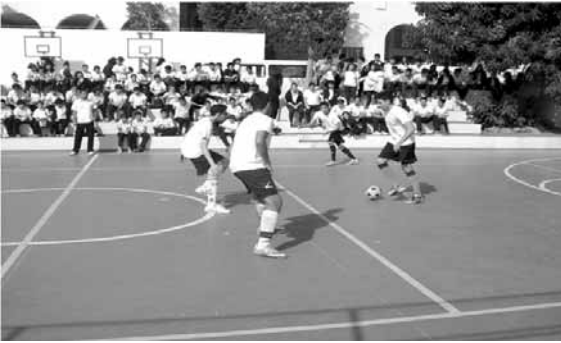
لقطة من المنافسات