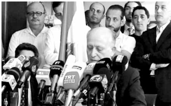
ريفي خلال مؤتمره الصحافي

على أثر فوز اللائحة التي دعمها للانتخابات البلدية في طرابلس، أعلن وزير العدل المستقيل اشرف ريفي خلال مؤتمر صحافي عقده في دارته في المدينة امس، أن «طرابلس الأبية تقول كلمتها وهي لا تزال على العهد والوعد»، وقال: «أرادوها تهريبية محاصصة وتحالفا هجيناً، فقلنا اننا لن نقبل بان يسيطر على المجلس