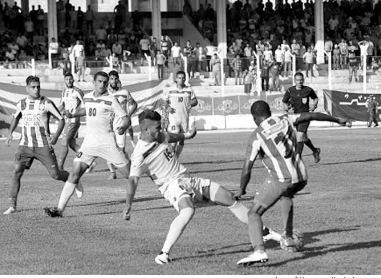
من مباراة العهد والأناضار

وسعى الانصار الى التعادل لكن هجماته عابها البطل والفردية، لتنتهي المباراة بفوز ثالث للعهد على الأناضار هذا الموسم بعد أن تخطفه ١-٣ في الدوري.