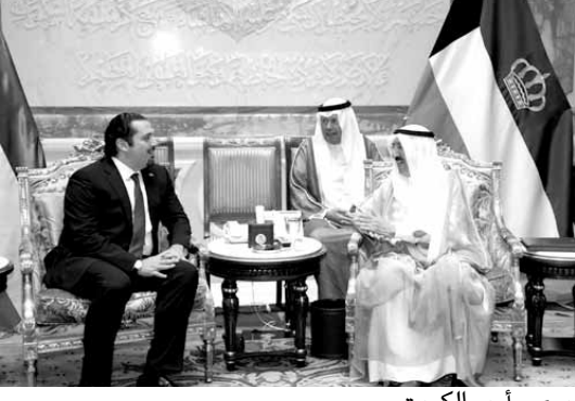
الحريري وأمير الكويت

تمر بها المنطقة العربية والأوضاع في لبنان من مختلف جوانبها والعلاقات الثنائية بين البلدين. بعد اللقاء، تحدث الرئيس الحريري الى الصحافيين فقال: «تباحثنا في عدة امور ولا سيما على الصعيد الإقليمي، وقد توافقنا على ضرورة أن تكون لدينا علاقة جيدة جدا مع إيران، ولكن التدخلات الحاصلة من قبلها غير مقبولة. كذلك شرحت لسموه بالتفصيل المبادرات القائمة في لبنان من أجل انتخاب رئيس للجمهورية، والجهود التي نقوم بها نحن في هذا الاطار، وأهمية أن نصل الى نهاية هذا الفراغ القائم، لأن الوضع الاقتصادي والاجتماعي لم يعد مقبولاً». كما زار الحريري مجلس الأمة الكويتي حيث استقبله رئيس مجلس الأمة مرزوق الغانم.