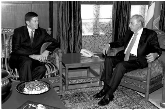
بري مستقبلاً غاون

باعدة انتخابه رئيس لمجلس الشورى. واستقبل الرئيس بري في عين التينة رئيس منظمة مراقبة الهدنة الجنرال آرثور دايفيد غاون على رأس وفد من المنظمة. كما استقبل الأمين العام للاتحاد البرلماني العربي فايز الشوابكة.