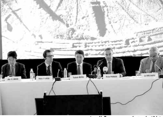
خلال اجتماع مجموعة العمل

والعرب موجودة، وتدعو الجميع الى الحضور، فلبنان هو بلدهم الثاني، وهم لا يحتاجون الى الدعوة، ونحن ساهرون على كل الامور التي تخص بالسائح». أضاف «منذ أربع سنوات، اتخذ قرار من مجلس الوزراء باستلام الجيش طريق المطار، ولم يحصل أي حادث أو مشكلة، فالطريق بعهدة الجيش اللبناني بشكل واضح، وليس موضوع هاجس». من جهته، قال الفرعون: «استعرضنا بعض الامور التي لها علاقة بتنشيط قطاع السياحة في لبنان وما شهده في الفترة الأخيرة من طفرة نوعية تحققت بفضل الجهود التي قامت بها الوزارة والوزير بشكل شخصي». ورداً على سؤال حول ظل الظروف القائمة، هل تشجع المصطافين والسياح العرب للقدوم الى لبنان؟، فاجاب: «بكل تأكيد. لقد حضرت انا وعائلتي، وانا مستعد للمجيء في أي وقت الى لبنان، فلبنان دائما معطاء في أي وقت، خصوصا الآن اذ لم نجد فيه الاكل احساس بالراحة والأمن والاستقرار والطمانينة، وادعو كل العرب للحضور اليه».