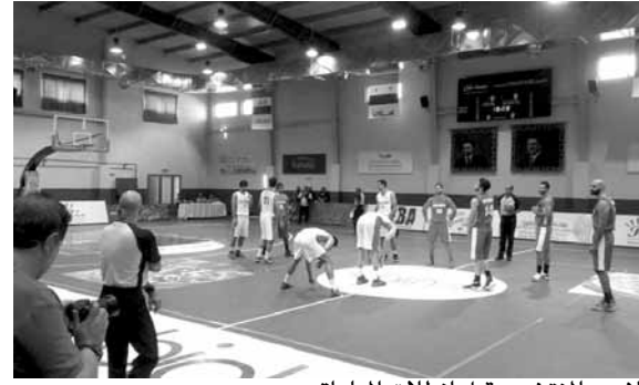
لاعبو المنتخبين قبل انطلاق المباراة

استهل منتخب لبنان للرجال في كرة السلة منافسات بطولة غرب آسيا للمنتخبات بخسارة أمام إيران بفارق ٦ نقاط (٧٥-٨١)، الربع الأول (١٥-٢٠)، والنصف الثاني (٣٦-٥١)، والثالث (٦٠-٦٠)، في المباراة التي جرت أمس الإثنين في العاصمة الأردنية عمان في افتتاح البطولة.