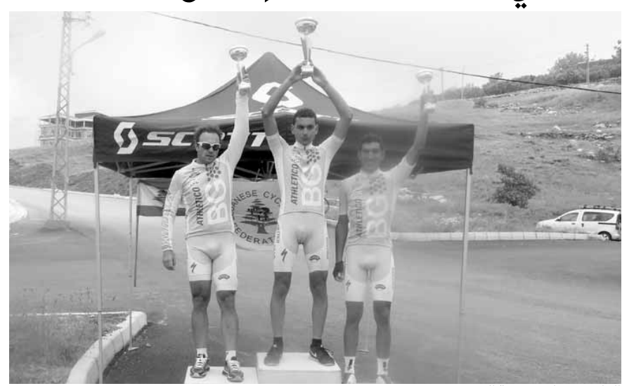
الفائزون على منصة التتويج

بين شمس ومطر أيار الخريفي، نظم الاتحاد اللبناني للدراجات الهوائية سباق بطولة لبنان للطريق لفئة النخبة للدراجات الهوائية لسنة ٢٠١٦، في منطقة الزعرور في أعلى المتن الأوسط على حلبة مغلقة بين مفترق الزعرور ومفترق بسكتنا بطول ٥ كم لتسع دورات والمسافة اجمالية بلغت ١٣ كم.