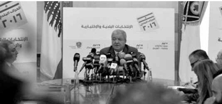
وزير الداخلية خلال مؤتمره الصحافي

علّق المدير العام السابق للأمن العام اللواء جميل السيد على نتائج الانتخابات البلدية في طرابلس فغرد عبر «تويتر»: «طرابلس أسقطت أصحاب المليارات الحريري، ميقاتي، الصفدي ومعهم كرامي الجسر، كجارة». مضيفاً: «هو قصاص شعبي عليهم جميعاً! استفاد ريفي وفاز الفقراء، صحتين».