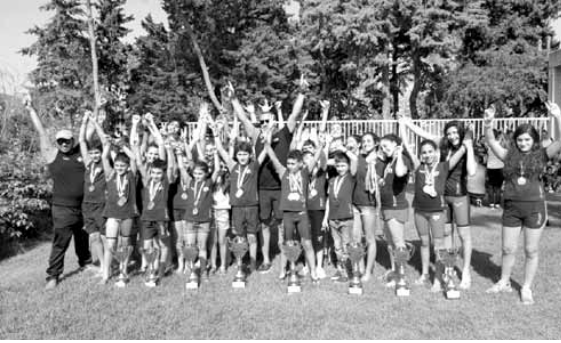
سباحو وسباحات نادي المطيلب