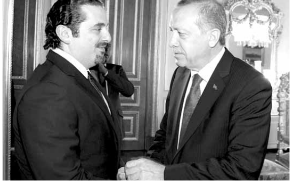
الحريري يزور اردوغان

استقبل الرئيس التركي رجب طيب اردوغان عصر امس في قصر يلدز باسطنبول، الرئيس سعد الحريري وعقد معه اجتماعاً مطولاً استمر قرابة الساعة ونصف الساعة، تم خلاله عرض الأوضاع في لبنان من مختلف جوانبها وتداعيات الأزمة السورية وآخر المستجدات في المنطقة.