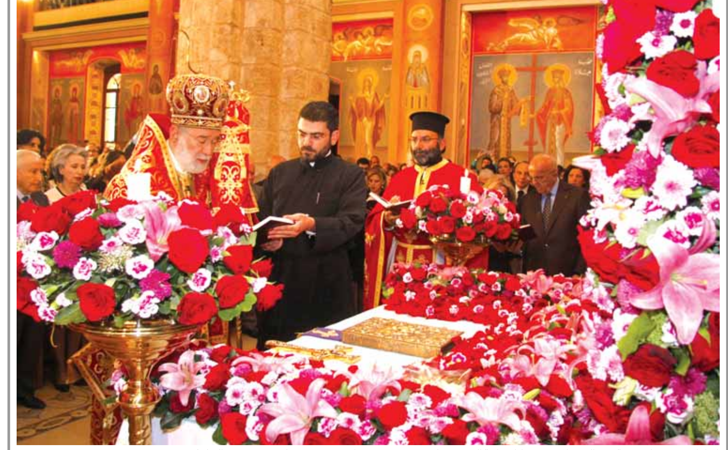
المطران عودة خلال رتبة دفن السيد المسيح في كاتدرائية القديس جاورجيوس في وسط بيروت (التفاصيل صفحة ٥)