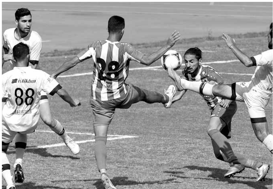
من مباراة الأنصار والنبي شيت