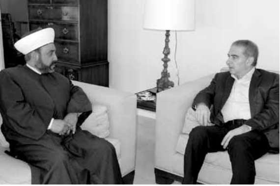
فرعون مستقبلا عريمط

اثنى القاضي الشيخ خلدون عريمط على الدور الإيجابي الذي لعبه وزير السياحة ميشال فرعون لتأمين المنافسة في انتخابات بلدية بيروت .