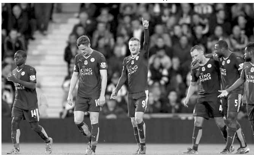
هل يتوج ليستر سيتي في مانشستر غداً ؟

الدوري الألماني في كرة القدم بتوقيت بيروت : السبت : بايرن ميونيخ - بوروسيا مونشنغلادباخ (الساعة ١٦,٣٠) بوروسيا دورتموند - فولفسبورغ (الساعة ١٦,٣٠) هانوفر - شالكه (الساعة ١٦,٣٠) مايننتس - هامبورغ (الساعة ١٦,٣٠) هوفنهايم - إنغولشتات (الساعة ١٦,٣٠) دارمشتات - أينتراخت فرانكفورت (الساعة ١٦,٣٠)