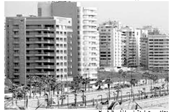
نتائج متباينة في آذار ٢٠١٦

بعد تسجيله أداء قوياً في خلال شباط ٢٠١٦، سجل القطاع العقاري اللبناني نتائج متباينة في آذار ٢٠١٦. وفي التفاصيل التي نشرها التقرير الأسبوعي لبنك الاعتماد اللبناني، أظهرت إحصاءات المديرية العامة للشؤون العقارية تحسناً شهرياً بنسبة ٦,٩٧٪ في أداء القطاع العقاري في لبنان في خلال شهر آذار، بحيث زاد عدد المعاملات العقارية الى ٥,٥٢٥ معاملة من ٥,١٦٥ في شباط الفائت. من جهة أخرى، تراجعت قيمة المعاملات العقارية الى ٧١,٧٨١ مليون د.أ في خلال آذار من ٨٨٥,٢٨ مليون د.أ في شباط الفائت، أي ما يمثل انخفاضاً شهرياً بنسبة ١٨,٩٢٪. على اساس تراكمي، ارتفع عدد المعاملات العقارية بنسبة ١٥,٧٣٪ على صعيد سنوي الى ١٤,٩٨٥ في خلال الفصل الاول من العام ٢٠١٦ من ١٢,٩٤٨ معاملة في خلال الفترة نفسها من العام الماضي. في الإطار نفسه، ارتفعت قيمة معاملات المبيع العقارية بنسبة ٣١,٣٥٪ على صعيد سنوي الى ٢,١٣ مليار د.أ حتى شهر آذار الفائت، من نحو ١,٦٢ مليار د.أ في خلال