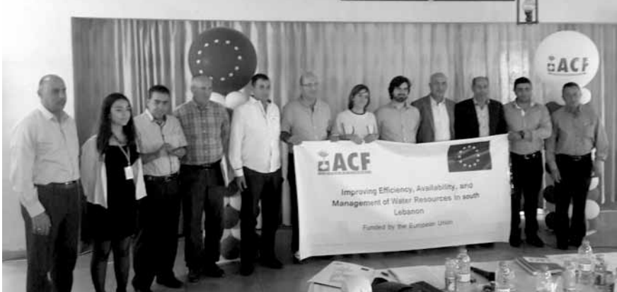
خلال اطلاق المشروع

الجوع الدولية روي أوليفيرا أن «الشراكات مع السلطات والمؤسسات المحلية أساسية لتطوير مشاريع مستدامة». إلى ذلك، فإن هذه الأعمال ضرورية نظراً إلى الظروف السيئة لأنظمة توزيع المياه وتخزينها والتي تؤدي غالباً إلى خسارة كميات كبيرة من المياه يمكن استخدامها بطريقة أخرى منتجة. وتمنع التكاليف المرتفعة لتشغيل نظام المياه مؤسسات المياه من تحسين شبكتها الواسعة من أنظمة التشغيل التي تغتقر إلى الكفاءة. وازداد الوضع سوءاً مع تدفق اللاجئين السوريين في عام ٢٠١٢. مما استنفد شبكات المياه في البلاد. وقال أوليفيرا: «لنبي احتياجات السكان المتناظرين بالنزاع، غالباً في الحالات الطارئة، ولكن بعد أكثر من خمسة أعوام من الأزمة في سوريا، من الأساسي تطوير مشاريع طويلة الأمد تعود بالنفع على كل المجتمعات المحلية». وستكون نوعية المياه والمحافظة عليها المحور الأخير للمشروع، لأن نوعية المياه وكميتها للأغراض المحلية أو الزراعية أساسية لمستقبل لبنان. تجدر الإشارة إلى أن الحقل اختتم بتوقيع مذكرة تفاهم بين منظمة العمل لمكافحة الجوع الدولية والبلديات التسع المستفيدة بهدف ترسيخ دور كل بلدية في البرنامج.