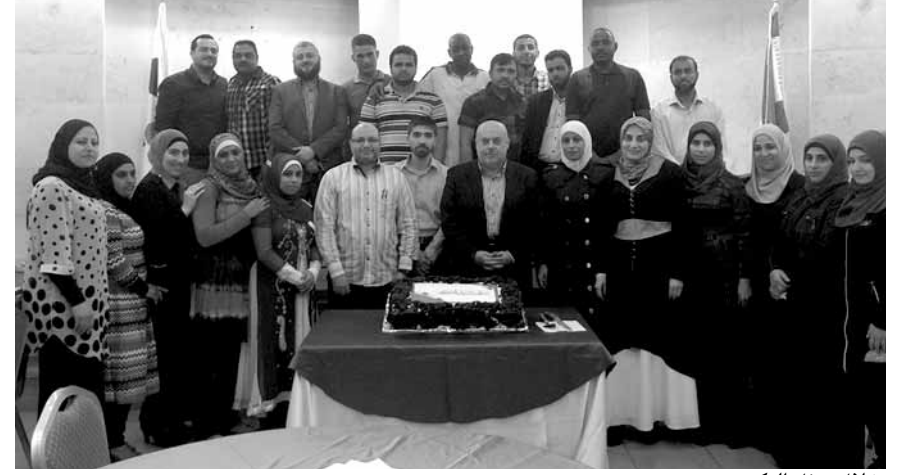
خلال حفل التكريم