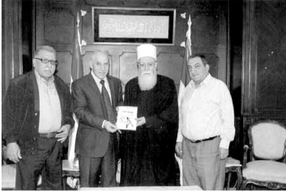
«الديموقراطية» عند شيخ العقل

وللتطورات في الأراضي الفلسطينية المحتلة «حيث يعمن العدو الصهيوني في التكتيل بالشعب الفلسطيني وحقوقه.»