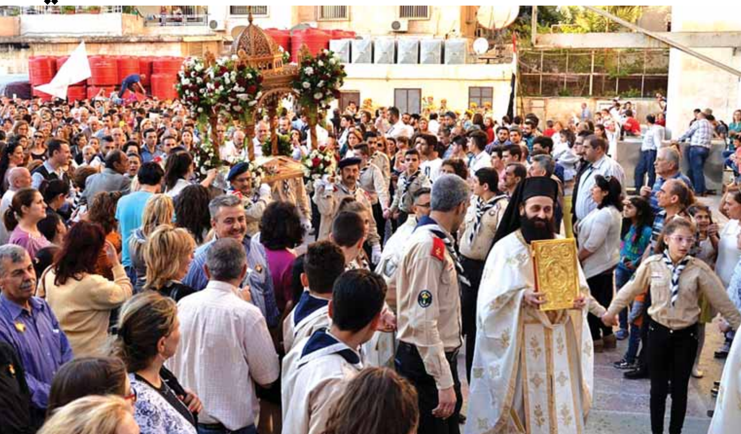
...رغم الحرب المدمرة في سوريا المسيحيون يحتفلون برتبة دفن المسيح

الخاصة بوقف القتال في سوريا ستكونان ضامنتين لهذا الإتفاق وتامان أن تلتزم جميع الأطراف المعنية بالتهديئة. ونصارت التقارير الأولية حول فترة سريان اتفاق التهديئة، ففي الوقت الذي أكد فيه مصدر لوكالة «ناس» أن نظام التهديئة سيكون مفتوحاً دون تحديد فترة زمنية له، نقلت وكالة «نوفوستي» للأنباء عن مصدر آخر أن نظام التهديئة سيستمر ٢٤ ساعة في ضواحي دمشق و٧٢ ساعة في محيط اللاذقية. هل تشمل الهديئة حلب؟ وفيما ذكرت وكالة «ناس» الروسية أنّ «الإتفاق سيطبق أيضاً على حلب»، نفت مصادر مقربة من مباحثات جنيف، الأنباء عن شمول حلب باتفاق التهديئة بين موسكو وواشنطن. وفي السياق، لم يذكر الجيش السوري في بيانه، دخول حلب ضمن إتفاق الهديئة. بيان الجيش السوري كما أعلنت القيادة العامة للجيش والقوات المسلحة السورية عن البدء بتطبيق نظام تهديئة بعد منتصف (ليلة أمس) لمنع ذرائع بعض المجموعات الإرهابية باستهداف المدنيين.