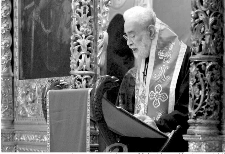
المطران عودة يلقي كلمته في كاتدرائية القديس جاورجيوس في وسط بيروت

مؤكد. هل كان في كلام هذا اللص المدان شيء عن الخلاص الروحي أو الخلاص الأبدي في كلامه للمسيح؟ طبعاً لا، فهو حصر خلاصه تلك اللحظة بالنجاه من الصلب والعذاب والعطش والآلام والإهانة والإخفاق والموت، مشدداً على «أن طلبية هذا الإنسان تمثل مشهتي مغلظاً إذ لا نرى في المسيح الذي أتى أو نتوقعه إلا مخلصاً من ضائقات ملحة. أما المذنب الآخر، فيرتقي فكره إلى بعد أسمى إذ يعترف أولاً بأنه خاطئ يستحق العقاب، ويطلب ثانياً رحمة المسيح إذ يقول له ذكركي يا رب متى جئت في ملكوتك»، مؤكداً «أن هذا يظهر الفرق بين إنسان وآخر. الجسدي يطلب خلاصه الأرضي المؤقت وكأنه الأغلى في حياته، والروحي يطلب لخلاصه الأبدي الدائم. الأول لا يرى في المسيح إلا مخلصاً أرضياً يخيب الظن فيه، والثاني يرى فيه مخلصاً سماوياً يضمن الحياة الأخرى. ونرى الفرق أيضاً بين إنسان يدرك أن حياته لا بد أن تنتهي على الأرض بطريقة أو بأخرى، ويوقت أو يأخر، بينما آخر يظن نفسه يعيش إلى الأبد... وهناك من يرى في المسيح مخلصاً أرضياً، وغيره من يعرف أن المسيح جاء ليخلص الخطاة ولا يوجد خلاص أبدي بدونهم». وختم: «جاء المسيح وقبض وأوجاع الموت، وصنع فداء، وحقق خلاصاً، وقام وصعد إلى السماء التي منها يأتي لياخذنا إليه فيها. هذا هو المسيح الذي - ليس بأحد غيره الخلاص. لأن ليس اسم آخر تحت السماء، قد أعطي بين الناس، به ينبغي أن نخلص. هذا هو المسيح الذي إليه وحده نصرخ خلاصاً يا ابن الله فيخلصنا».