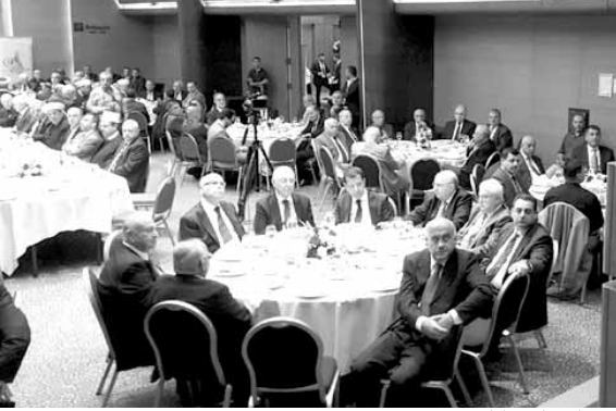
دريان يلقي كلمته

العريقة، نحن من نخtar التشريع الصحيح، لا نريد مشاريع اجنبية أو غربية يمحي منها أسماء من عملها، ثم ناتي بها إلى لبناننا لنوظفها، نحن الأدرى بما يحتاجه مجتمعنا، لن نسمح أيضا بأي تهميش للقضاء الشرعي، ولن نسمح أبداً بالاقتراء على قضاتنا الذين نعتز بهم وبكفاءتهم.»