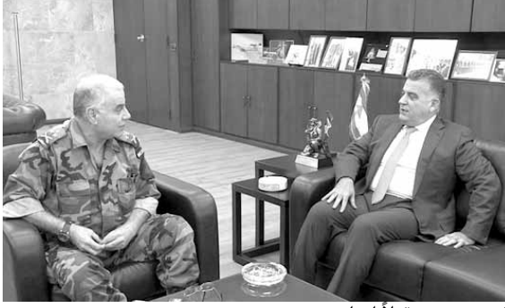
قهوجي مستقبلاً ابراهيم

استقبل قائد الجيش العماد جان قهوجي في مكتبه في البرزة، المدير العام للأمن العام اللواء عباس ابراهيم، وتناول البحث الأوضاع الأمنية في البلاد، وشؤوناً تتعلق بالتعاون بين المؤسساتين.