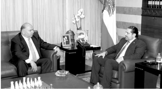
سفير جورجيا يزور الحريري

استقبل الرئيس المكلف سعد الحريري ظهر امس في «بيت الوسط»، سفير جورجيا في لبنان المقيم في الاردن غريغوري باتاتادزي، وعرض معه العلاقات الثنائية بين البلدين. كما التقى سفير جورجيا في لبنان رئيس مجلس الوزراء تمام سلام في المصيطبة. ثم التقى باتادزي وزير الداخلية والبلديات نهاد المشنوق، في زيارة تعارف وجرى البحث في «سبل التعاون بين الاجهزة الامنية الجورجية والاجهزة الامنية اللبنانية وتبادل الخبرات والتدريب». وقد استمع باتادزي لعرض من المشنوق حول «المستجدات على صعيد الوضع اللبناني والاقليمي»، كما تم التطرق الى «أزمة النازحين السوريين من خلال المقارنة لكيفية التعاطي معها من قبل دول الجوار».