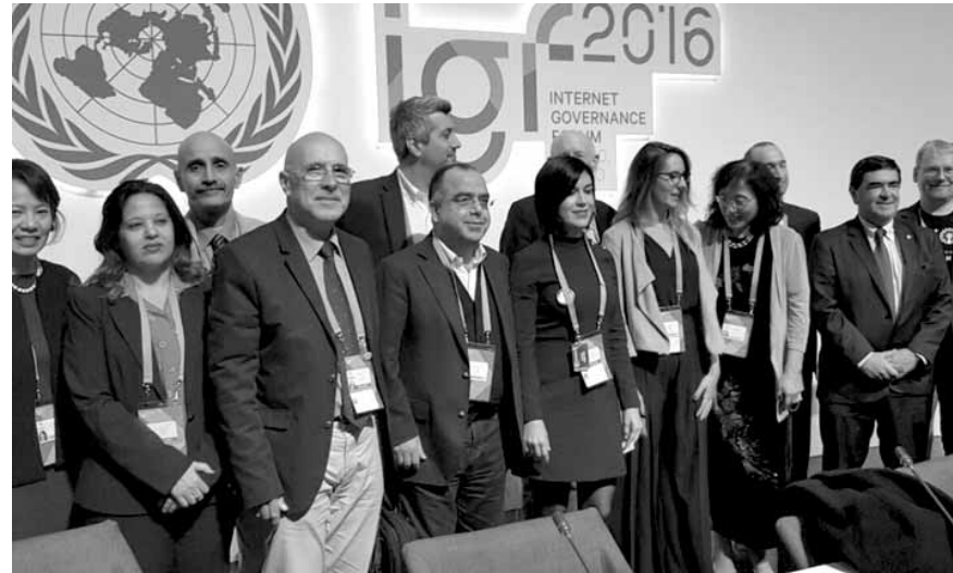
الوفد خلال مشاركته في المنتدى

شارك لبنان في المنتدى العالمي لحكومة الإنترنت الذي عقد بدعوة من الأمين العام للأمم المتحدة بان كي مون في مدينة غوادالاخارا في ولاية خاليسكو في المكسيك، تحت شعار «تحقيق النمو الشامل والمستدام».