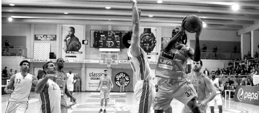
من مباراة الهومنتمن والتضامن زوق مكابيل