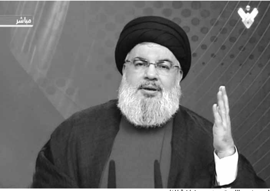
السيد نصرالله يتحدث عبر شاشة المنار

الآن طرف سياسي معني بتشكيل الحكومة يريد ان لا تتشكل الحكومة ولا تنتهم احدا بذلك». وتطرق الى بعض ما ورد في عدد من المقالات فأكد ان «الحديث عن معركة بين ثنائي شيعي او ثنائي مسيحي او هام» لافتا ايضا ان «هناك من يحاول ان يصور ان قيادة حزب الله مشغولة بالقوات وعلاقتها بالتيار وكيف نكف العلاقة، القوات قوة اساسية موجودة في البلد لكن نحن مشغولون بمكان آخر»، موضحا اننا «نحن وفخامة الرئيس ميشال عون وقيادة التيار كنا وما زلنا في علاقة ممتازة لا تشوبها شائبة». ووضح السيد نصر الله ان «ليس لدينا طريقة اسمها ان نبعث رسائل لا من خلال مصادر او بعض الاصدقاء الصحفيين او مقالات او سفارات وسواء كنا نتحدث مع صديق او حليف او مع خصم او نواجه عدوا نحن نتحدث بشكل مباشر إما في لقاء او في العلن، ولا يوجد لدينا ما يسمى مصادر في حزب الله او مصادر مقربة وكل ما يقال منسوب الى مصادر في حزب الله لا ينبغي ان يعتنى فيه».