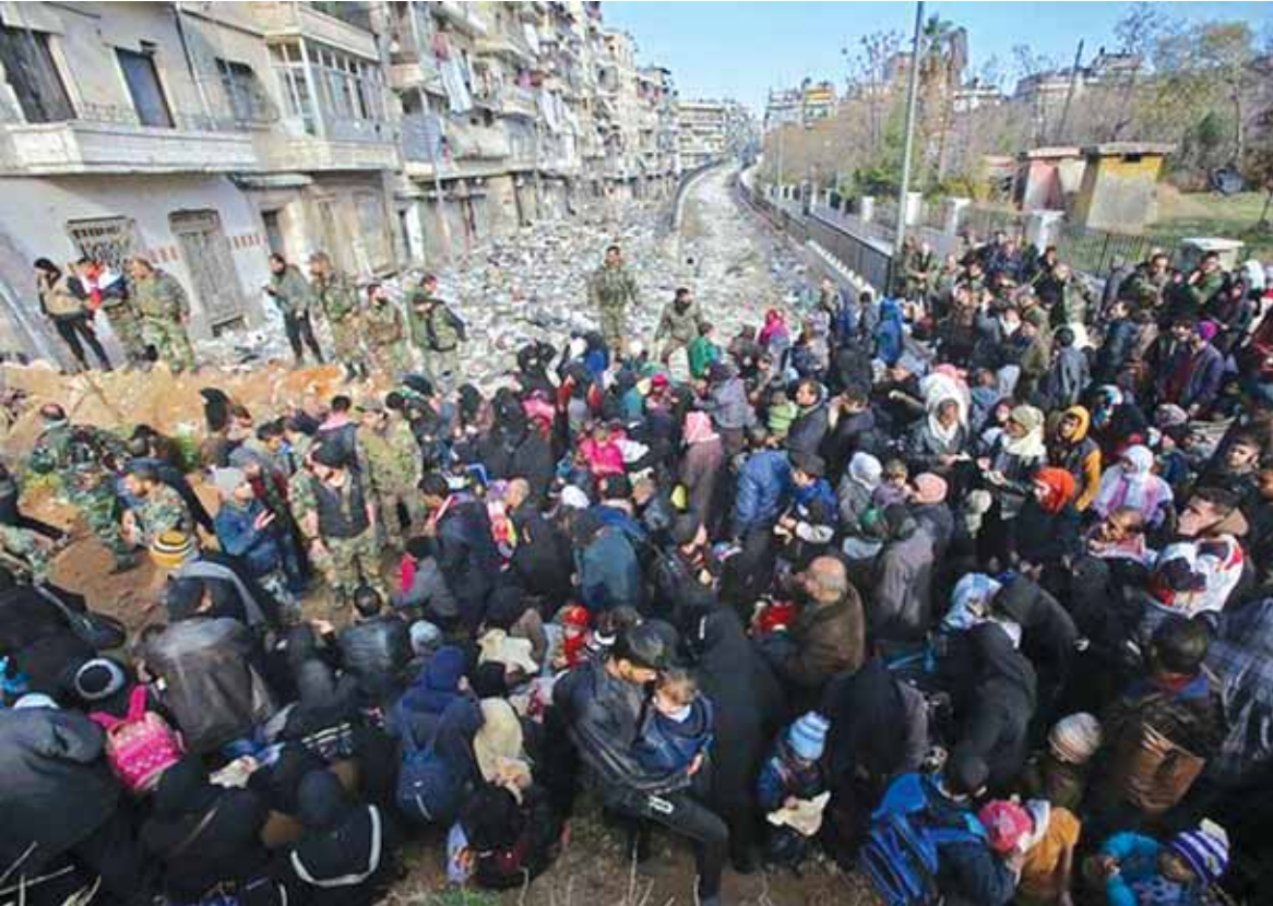
مدينون يخرجون من الاحياء الشرقية في حلب

استطاعت الطائرات الروسية ضرب مراكز داعش وجبهة النصرة بمناطق القلمون فيعني ذلك ان داعش ستصبح ضعيفة جدا على الجبهة اللبنانية وان الجيش اللبناني باستطاعته تأمين الحدود ويلتحم مع الجيش السوري ويقوموا مراكز مشتركة على طول السلسلة الشرقية لجرود عرسال ومناطق عرسال. اما بخصوص مدينة عرسال فلن يقترب منها الطيران الروسي ولن يقصفها الا اذا قامت مضادات أرضية باطلاق النار على الطائرات الروسية عندها ستقوم الطائرات الروسية بتدميرها وقصفها وهذا القرار الروسي على (تتمة الخبر السوري ص ١٦)