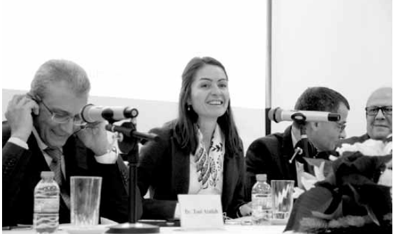
لاسن تلقي كلمتها

التعبير وضمان إمكان ممارسة المواطنين حقوقهم في اختيار ممثلهم. كما تطرق إلى دور الشباب في العملية الديمقراطية.