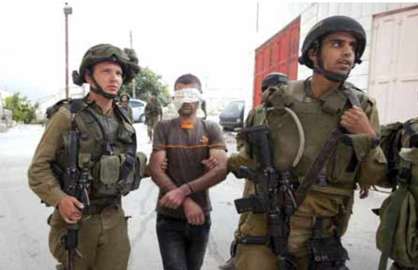
جيش العدو يعقل شابا فلسطينيا

وفي السياق ذاته، قامت القوات الإسرائيلية بتوزيع دفعة جديدة من إخطارات هدم إدارية لمنازل فلسطينيين في بلدة سلوان جنوب المسجد الأقصى في القدس بحجة عدم الترخيص. ورافقت قوة عسكرية إسرائيلية الطاقم البلدي، الذي ركن حملته على حي البستان الذي هدد الإحتلال قبل سنوات بهدم جميع منازل الـ ٨٨ لصالح مشاريع تلمودية واستيطانية في إطار تهويد المنطقة التي تعتبر الأقرب إلى المسجد الأقصى من الجهة الجنوبية.