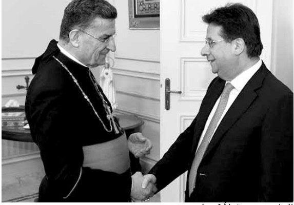
الراعي مستقبلا كنعان

فنحن نعتبر ان قانون الانتخاب مطلوب بالراح، وأمس قبل اليوم، ولا نجد أي مبرر لعدم شروع المجلس النيابي فوراً في إقرار قانون جديد للإنتخاب..