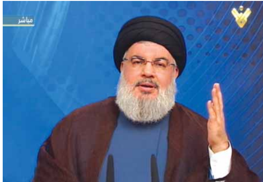
السيد نصرالله متحدثا

حرص جميع القوى على التنازل لانجاز التآليف ومن هذه النقطة انطلق السيد حسن نصرالله في خطابه ليفند كل التسريبات خلال المرحلة الماضية والتي طالت حزب الله وموقفه من الحكومة نافيا ان تكون للحزب مصادر اعلامية او سياسية او نيابية او مصادر مقربة لانه لدينا خطباء كثر وتحدث بوضوح كما لم نعتد على مصادر اعلامية في (تتمة المانشيت ص ١٦)