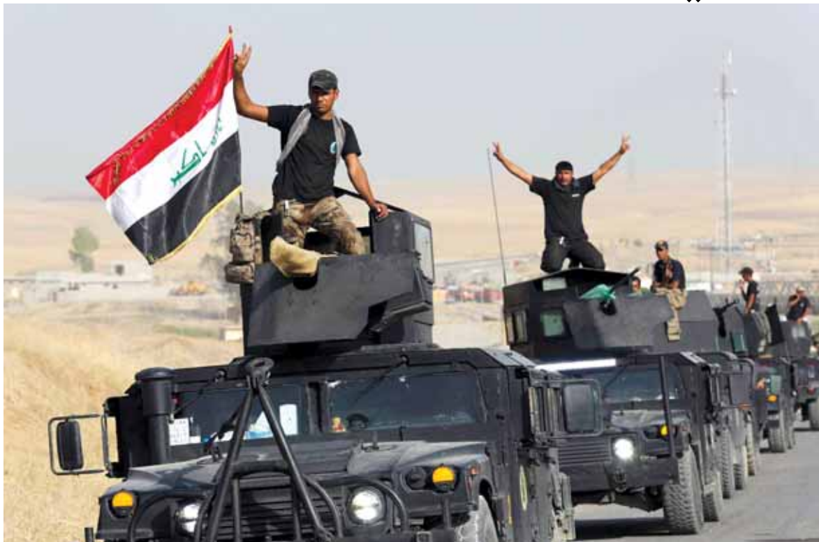
الجيش العراقي خلال تقدمه غرب الموصل

أعلن جهاز مكافحة الإرهاب التابع للقوات العراقية، تحرير ثلاثة أحياء في الساحل الأيسر (غرب) مدينة الموصل. وذكر الجهاز في بيان أن «قوات قيادة العمليات الخاصة الثانية في مكافحة الإرهاب تمكنت، بعد ظهر امس، من تحرير احياء العدل والإعلام والتأميم في الساحل الأيسر لمدينة الموصل» من سيطرة تنظيم «داعش». وأضاف البيان، أن «القوات رفعت العلم العراقي فوق مباني تلك المناطق بعد تكبيد العدو خسائر بالأرواح والمعدات».