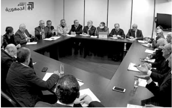
سليمان يتراس الاجتماع

تقي لبنان شر الأرباب، مشددا على «ضرورة الاتفاق حول الجيش ودعمه لبنانيا ودوليا، والعمل بجدية لاستعادة الهيئة السعودية لتجيزه بافضل العتدة والخائز». وفي بيان له بعد اجتماعه الدوري برئاسة الرئيس السابق ميشال سليمان، «حزن اللقاء من تداعيات زج لبنان الرسمي في سياسة