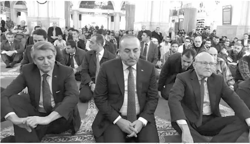
اوغلو يؤدي صلاة الجمعة برفقة سلام

أعلن وزير الخارجية التركية مولود جاويش أوغلو استعداد بلاده لمساعدة لبنان في المشاريع الإنمائية، لاسيما تلك التي تتعلق بالانتماء باوضاع النازحين، معتبرا ان انتخاب العماد ميشال عون رئيسا للجمهورية خطوة إيجابية على صعيد العملية السياسية اللبنانية ونأمل في ان تستثمر هذه الخطوات الايجابية وهذا الاتفاق في تأليف الحكومة العتيدة.