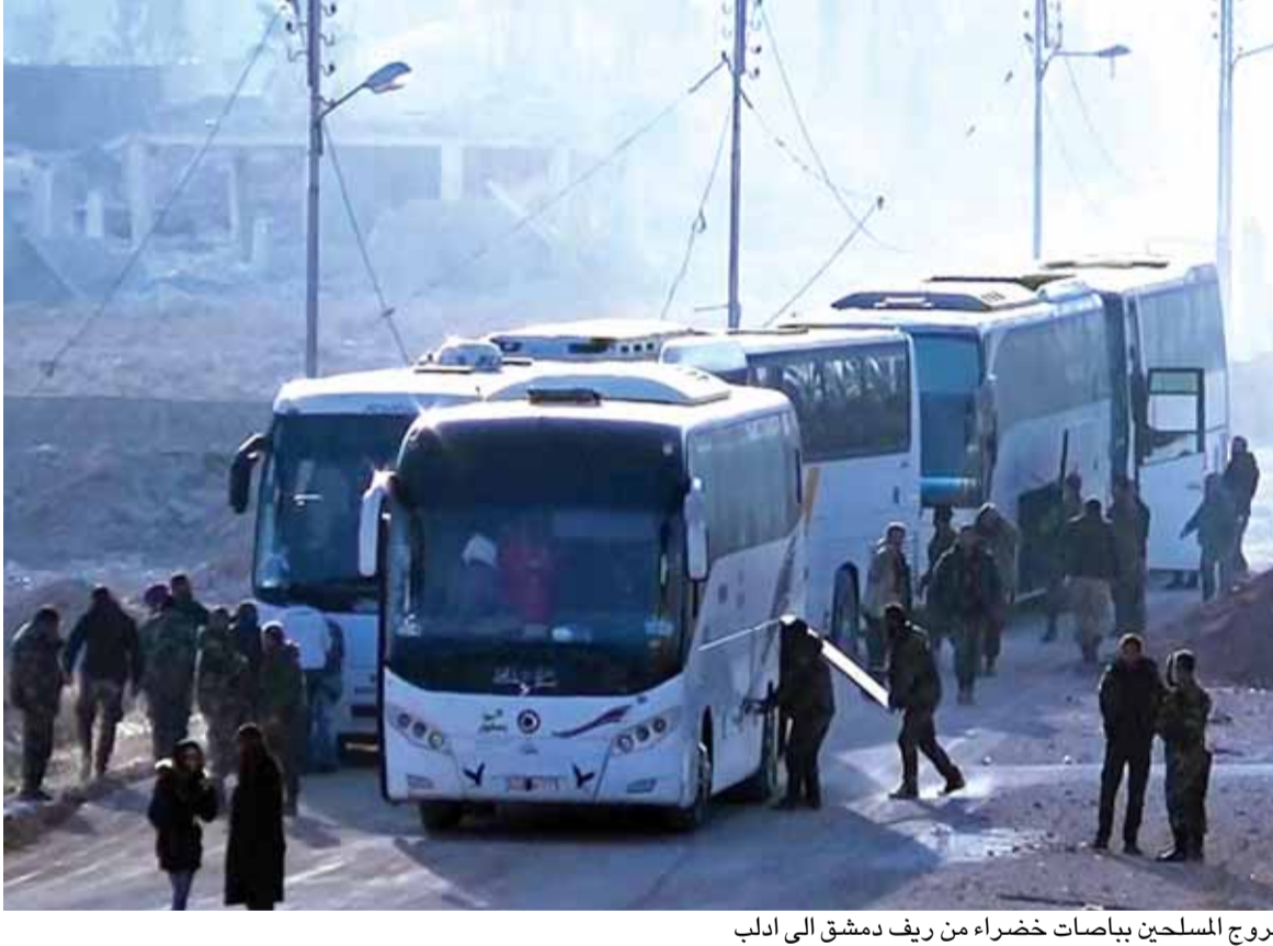
خروج المسلحين بياصات خضراء من ريف دمشق الى ادلب

بموازاة العمليات العسكرية واصل المدنيون (تتمتع الخبر السوري ص ١٦)