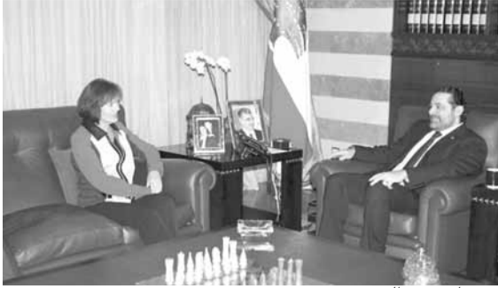
ريتشارد عند الحريري

استقبل الرئيس المكلف سعد الحريري بعد ظهر امس في «بيت الوسط» سفيرة الولايات المتحدة الاميركية اليزابيث ريتشارد في حضور النائب السابق الدكتور غطاس خوري وعرض معها آخر التطورات في لبنان والمنطقة والعلاقات الثنائية بين البلدين.