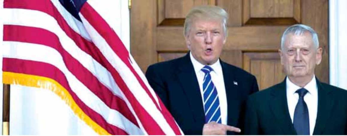
الرئيس ترامب ووزير الدفاع الجنرال جيمس ماتيس

رئيساً للقيادة الأمريكية العسكرية الوسطى. وسيحتاج ماتيس إلى موافقة مجلس الشيوخ وكذلك إلى استئناء خاص من قانون يحظر على جنرالات متقاعد تولي منصب وزارة الدفاع لمدة سبع سنوات بعد تقاعدهم. وفيما يلي لائحة بأبرز التعيينات التي قام بها ترمب حتى الآن: - وزير العدل: جيف شيبزنز (٦٩ عاماً) أحد أوائل مؤيدي ترمب خلال الحملة الانتخابية، وهو سناتور من الاباما مناهض للهجرة، وواجه أداؤه انتقادات شديدة بالنسبة للعلاقات بين مختلف الأعراق، ورفض ترشيحه في إحدى المرات لمنصب قضائي بسبب القلق بشأن تصريحات سابقة أدلى بها عن السود.