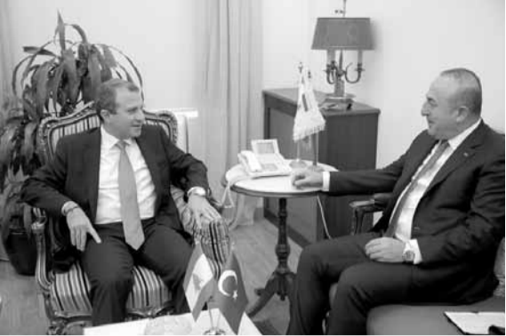
باسيل وشتاينماير خلال اللقاء

أضاف: «كذلك هناك موضوع الإرهاب التكفيري الذي يعني بلدينا والذي يشكل خطراً عابراً للحدود ضرب لبنان وتركيا مراراً، ونحن معنيون بمواجهته من خلال تنسيق أفعال بين البلدين لاسيما على المستوى العسكري والمخابراتي والأمني، إذ