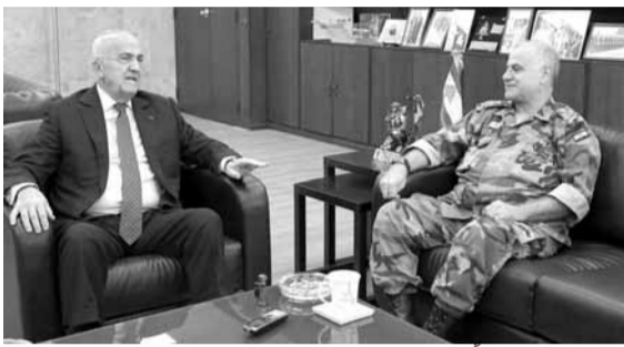
قهوجي مستقبلاً مقبل

زار نائب رئيس مجلس الوزراء وزير الدفاع الوطني سمير مقبل، قائد الجيش العماد جان قهوجي في مكتبه في البرزة قبل ظهر امس، وبحث معه التطورات الأمنية في البلاد، واورضام المؤسسة العسكرية واحتياجاتها المختلفة. من جهة أخرى، استقبل العماد قهوجي رئيس اركان الدفاع المالبزي الجنرال Tan Sri Zulkifeli Mohd Zain على رأس وفد مرافق، وجرى التداول في سبل تعزيز العلاقات الثنائية بين جيشي البلدين، ومهمات الوحدة المميزية العاملة في إطار قوات الأمم المتحدة المؤقتة في لبنان.