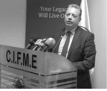
قمير خلال المؤتمر الصحفي

العالم كورنيليو دينكا عن قرار يقضي «بعقد مؤتمر الروراري الدولي في شهر شباط في العام ٢٠١٨ في بيروت».