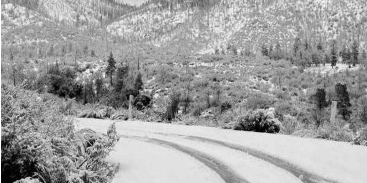
الثلوج في كفر ذبيان