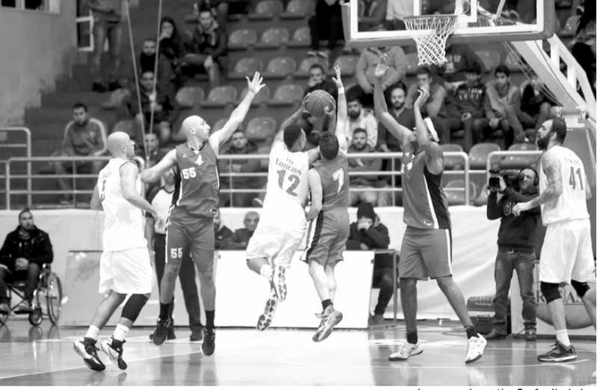
مباراة الحكمة والاتحاد ميروبا

صعق الاتحاد ميروبا مضيفة الحكمة، وفاز عليه بفارق ١٦ نقطة (٨٥-٦٩)، الربيع الأول (٢٢-٢١)، والثاني (٣٩-٣١)، والثالث (٥٩-٥١)، في المباراة التي جرت أمس الجمعة على ملعب غزير ضمن المرحلة الأولى من بطولة لبنان في كرة السلة لأندية الدرجة الأولى.