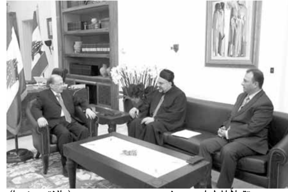
عون مستقبلاً المطران سوف (الداخلي ونهرا)

تندرج في إطار التواصل بين موارنة قبرص ورتاسة الجمهورية، مضيفاً «عرضنا على الرئيس دعمه للمساهمة في حل المسألة القبرصية عموماً واورضام القرى المارونية خصوصاً لتواصل الجماعة المارونية تقليديها الثقافي والديني والاجتماعي وفق الدستور القبرصي واملال العيباص، وهدم جزء لا يتجزأ من المجتمع القبرصي - علامة للتواصل بين ابناء البلد وارساء قواعد السلام والازدهار».