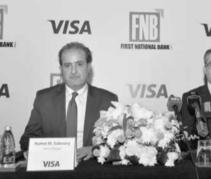
خلال المؤتمر الصحفي

وأضاف رزق «ان البطاقة الجديدة تتضمن الى تشكيلة مميزة من بطاقات الوفاء