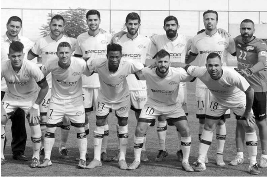
فريق النبي شيت