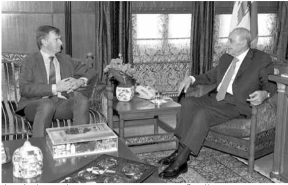
شورتر يزور عين التينة

استقبل رئيس مجلس النواب نبيه بري بعد ظهر امس في عين التينة، السفير البريطاني هيوجو شورتر الذي قال بعد اللقاء: «بحثنا في الوضع الراهن في لبنان والمنطقة، وكانت مناسبة لأعبر للرئيس بري عن وجهة نظري في هذه الاوضاع. تأمل المملكة المتحدة بقوة تأليف الحكومة اللبنانية