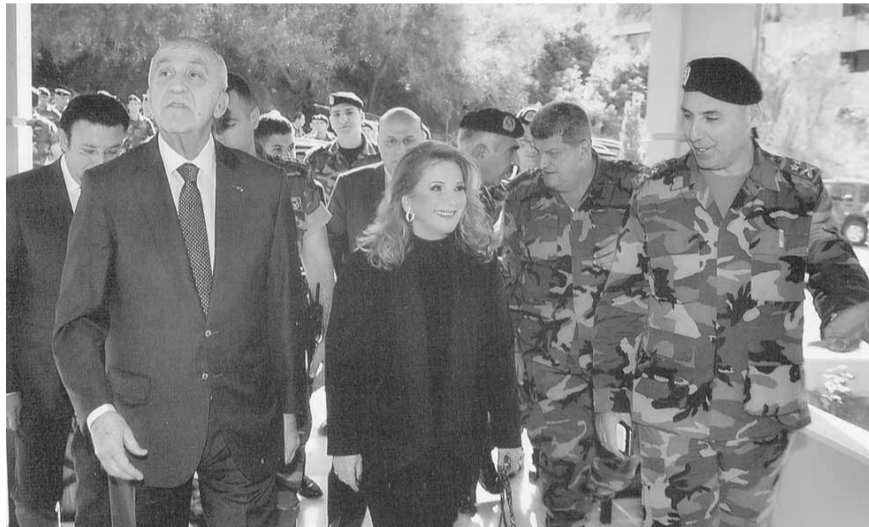
الصلح لدى وصولها الى مبنى المفتشية العامة وفي استقبالها مقبل اللواء الركن الحاج

الوطني سوف تستمر، ونحن على عتبة عهد جديد حاملاً داخله رياح التغيير والإصلاح آملين ان يكون حلالاً لمشاكل اللبنانيين لا حلالاً لاشكالات بيت المتسلطين في وطن يسمو فيه الحق على الباطل ويرقى فيه الايمان على الدين فترتفع الامة على الطوائف والمذاهب ونصل الى تفاهم وطني ولا نكتفي بتعايش «سلمي».