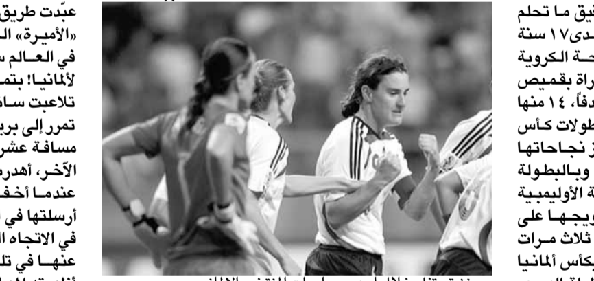
برينز تحتفل خلال إحدى مباريات المنتخب الألماني

عبدت طريق الأمانيات إلى النصر. ومن سوى «الأميرة» الحقيقية والوحيدة للعبة الأجل في العالم ستسجل الهدف الحاسم الأول لألمانيا؛ بتمويه جسدي في منطقة العميل أن تلاعت ساندرا سميسيك بمنافستها قبل أن تمر إلى برينز المتقدمة التي أرسلت الكرة من مسافة عشرة أمتار إلى الشباك. وفي الجانب الآخر، أهدرت مارتا فرصة تعديل النتيجة عندما أخفقت في ترجمة ركلة جزاء حيث أرسلتها في الجهة اليسرى لكن أنجيبر ارتمت في الاتجاه الصحيح وتصدت لها. حيث غاب عنها في تلك اللحظة السحر الكروي الذي أظهرته مهاجمة البرازيلية البالغة آنذاك ٢١