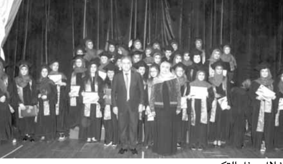
خلال حفل التكريم