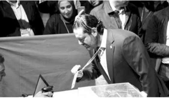
الحريري يدي بصوته

فاز الرئيس سعد الحريري بالتركيبة برئاسة تيار المستقبل في اليوم الثاني من المؤتمر العام الثاني لتيار المستقبل، بعد ان استمرت العملية الانتخابية ثلاث ساعات لاختيار عشرين عضواً في المكتب السياسي وذلك بعد ان اعطى الحريري