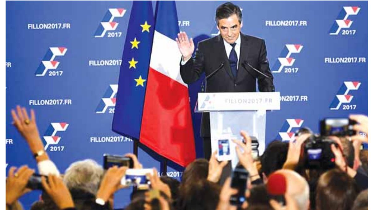
فيون يتحدث بعد فوزه