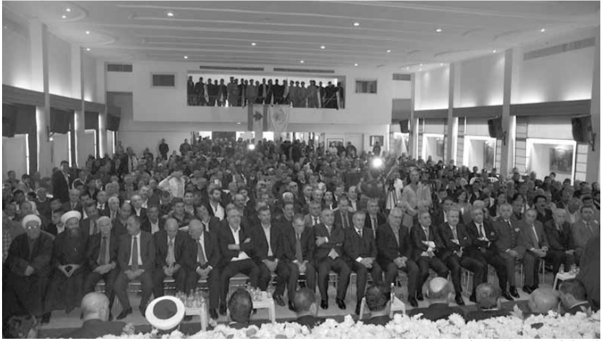
المشاركون في المهرجان

ستنبنى بالضرورة وفق رؤية مختلفة وحسابات مختلفة، وسيجد لبنان ان مصلحته الوطنية تقتضي وجوب اعادة تفعيل علاقته مع سوريا على كل المستويات».