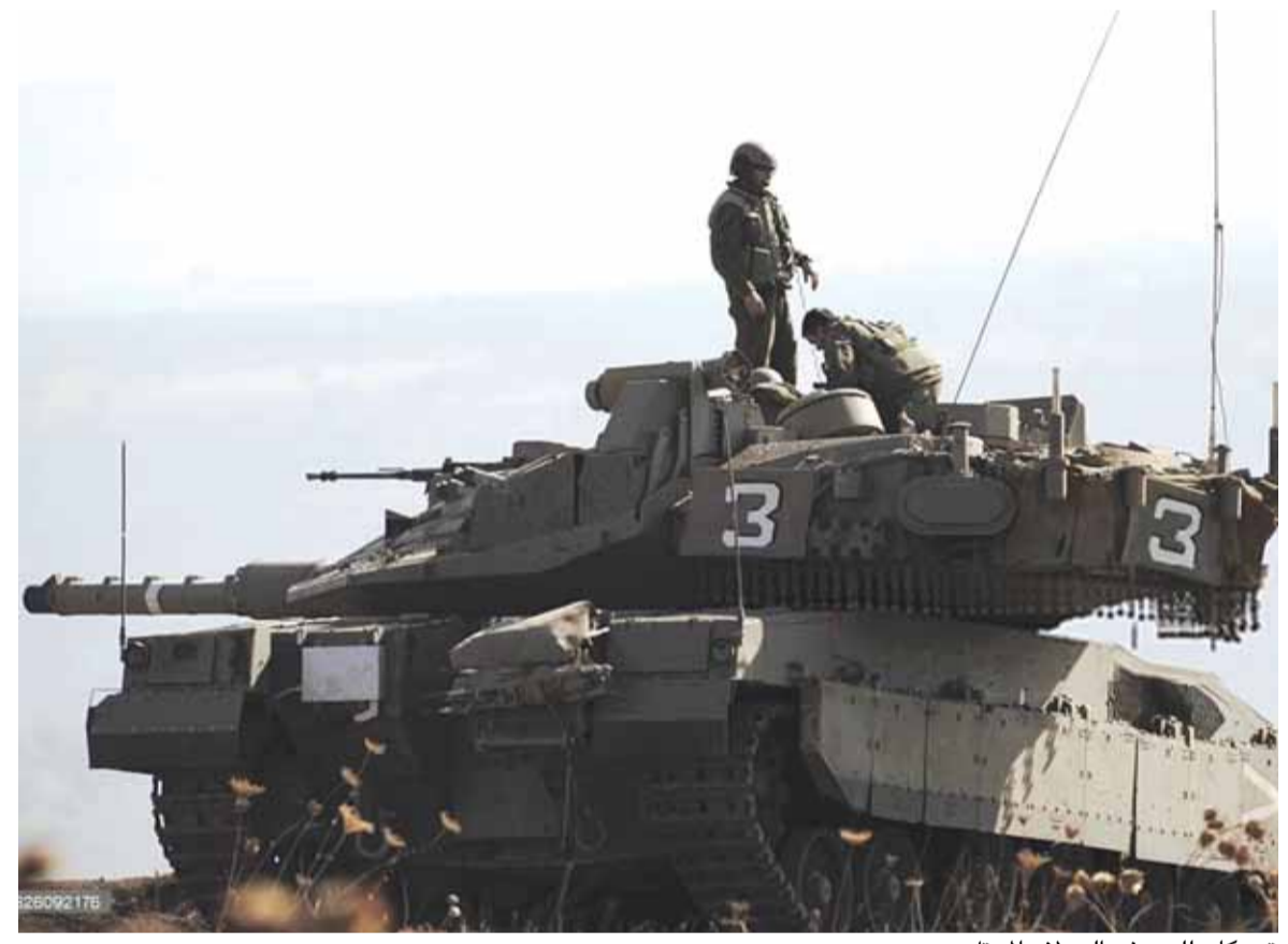
تحركات للعدو في الجولان المحتل

وعلى المنوال نفسه قال وزير التعليم، نفتالي بينيت إن إسرائيل تواجه «موجة إرهاب قومية هدفها قتل اليهود وزرع الرعب»، وأضاف بينيت، وهو من ائتلاف نتنياهو الحاكم، أن