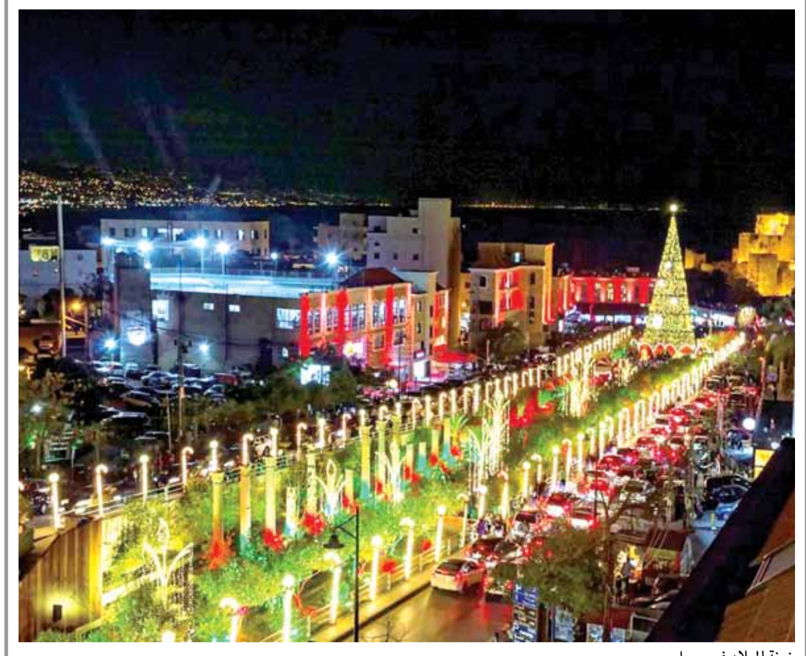
زينة الميلاد في جبيل