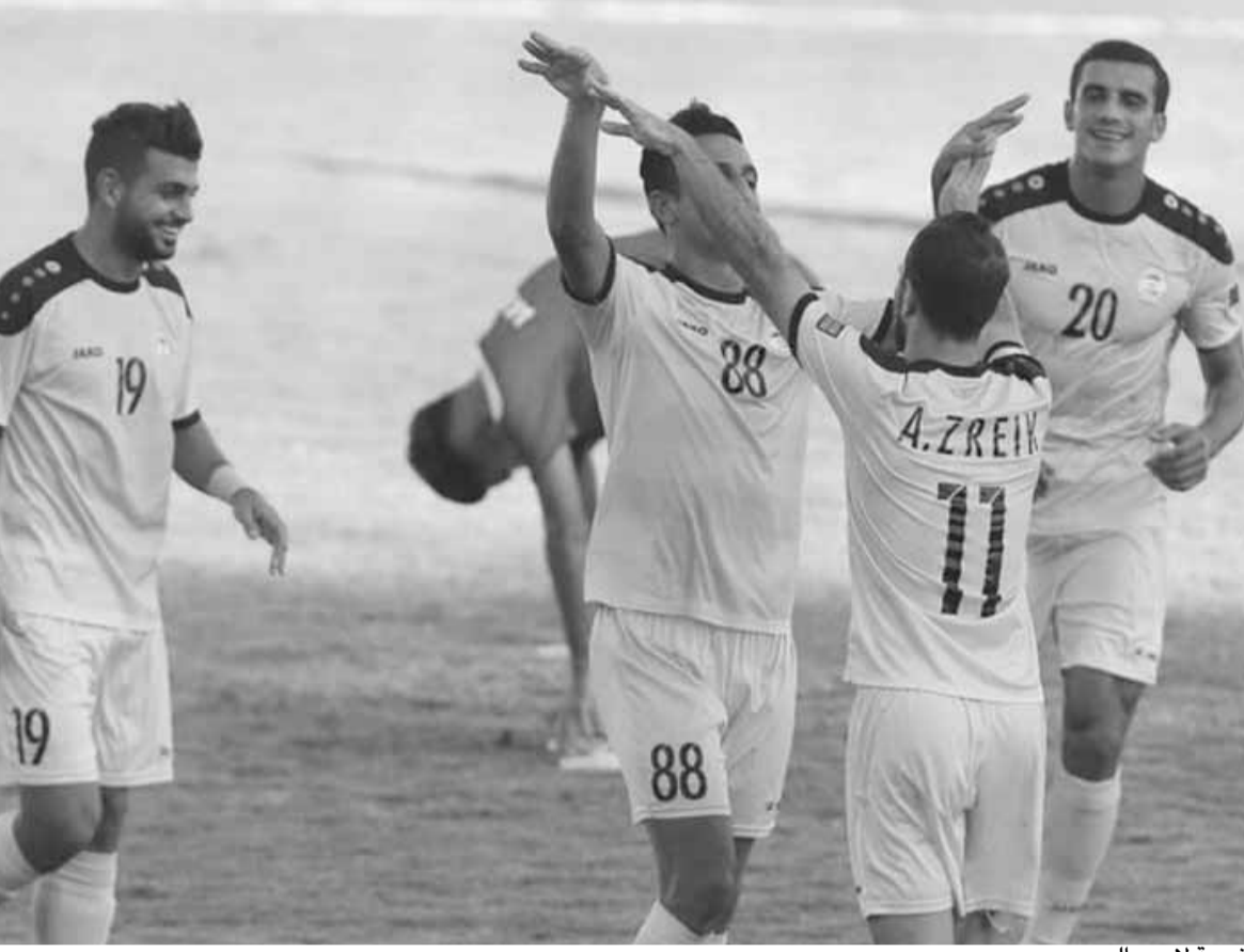
فرحة لاعبي العهد