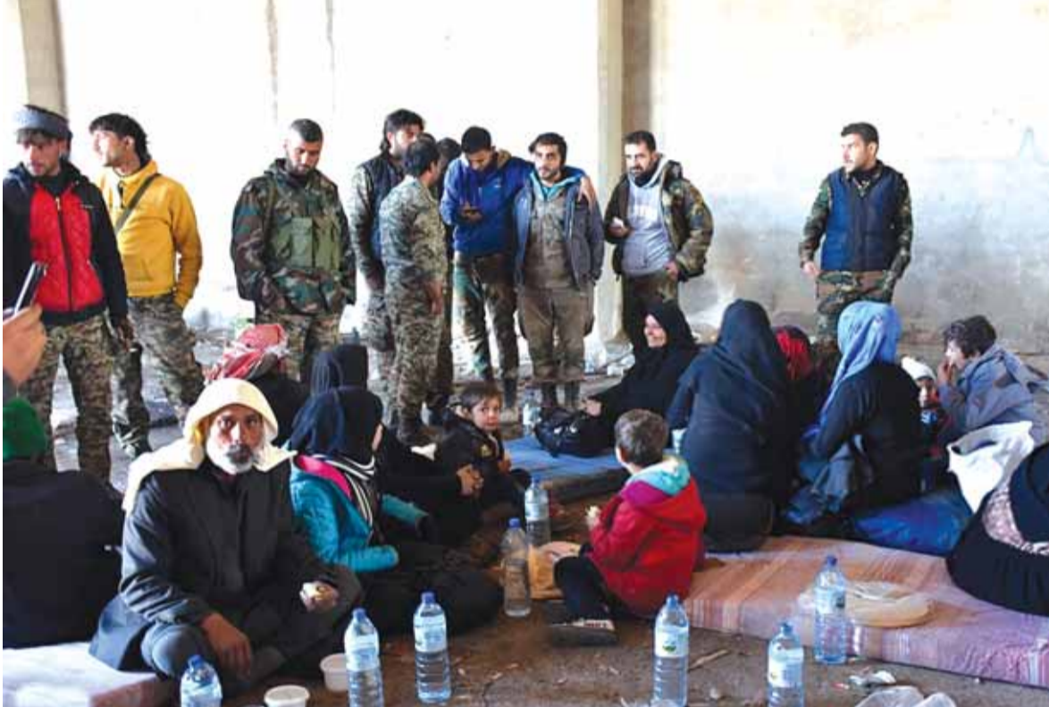
الاهالي الهاربون من «النصرة» يحتفون بالجيش السوري

لتركيبا مئة مليون دولار كي يمر السلاح القطري إلى مقاتلين في حلب. وقال وزير خارجية قطر مهمل حصل فلن تتخلى عن مقاتلي حلب وقامت تركية بتسليم السلاح الى المقاتلين التكفيريين في حلب وهذه الأسلحة هي حديثة جداً وتضم صواريخ باليستية تصيب الدبابات والشاحنات والوكبات من طراز سيغما ٢ الفرنسية. كذلك حوالي ٢٠٠٠ صاروخ من طراز سيغما ٣ الحديث جداً في فرنسا ولم يخرج بعد من فرنسا إلا إلى قطر وهذا الصاروخ هو لتدمير مراكز محصنة بالباطون أو محفورة تحت الأرض، كما انه (تتمتع المانشيت ص ١٦)