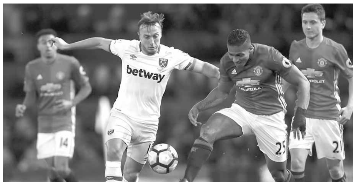
من مباريات مانشستر ويوست هام