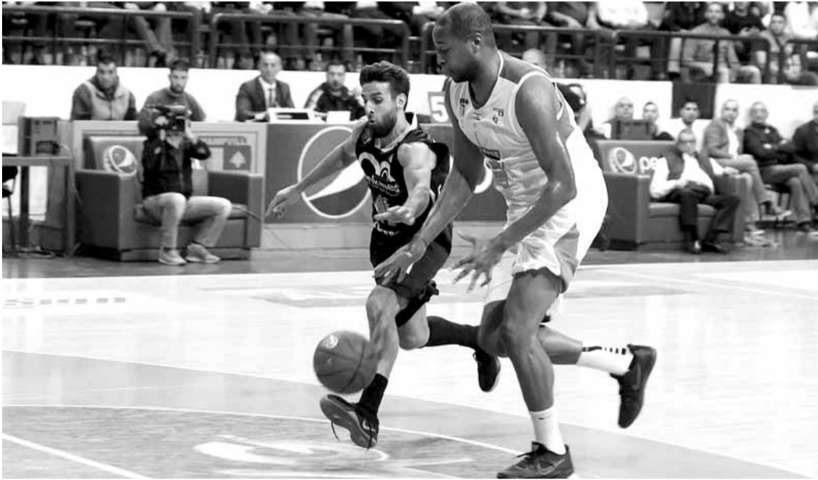
من مباراة الشانفيل والرياضي بيروت