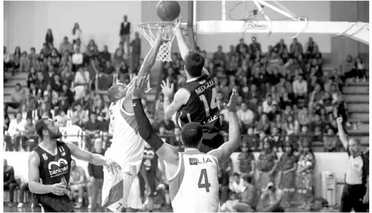
صراع طائر على الكرة