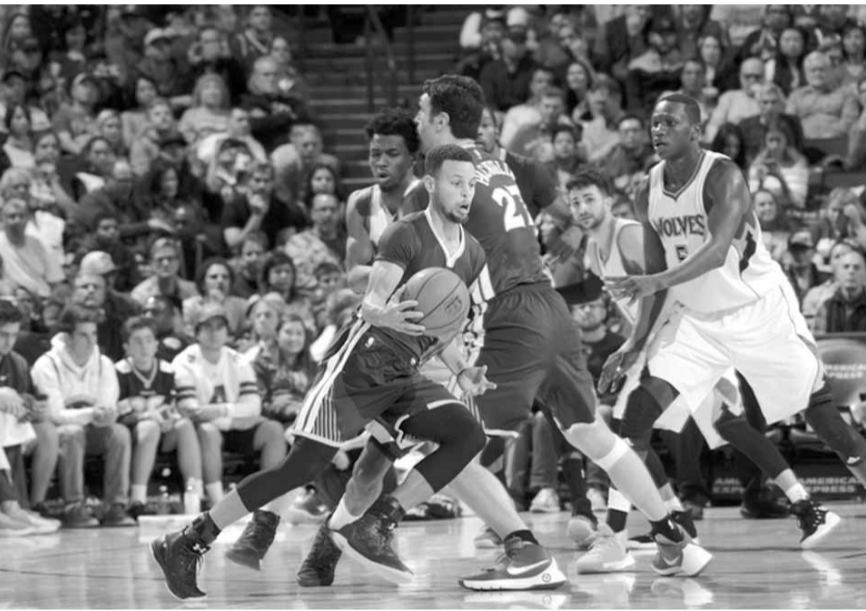
من مباراة غولدن ستايت ومينيسوتا

ويحتل اوكلاهوما الذي تخلى عن نجمه كيفن دورانت قبل انطلاق الموسم المركز السادس فقط في المنطقة الغربية برصيد ٨ انتصارات مقابل ٨ خسارات. وفاز تشارلوت هورنتس على نيويورك نيكس ١٠٧-١٠٢ محققاً فوزه التاسع في ١٦ مباراة حيث يتشارك مع