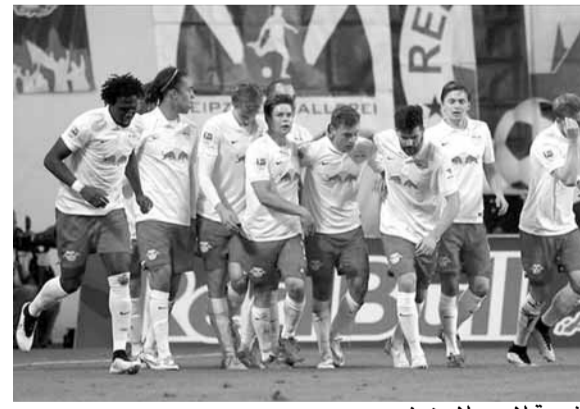
فرحة لاعبي لايبزيغ

صار فريق لايبزيغ، المساعد حديثاً للدوري الألماني، حديث وسائل الإعلام الألمانية، ويات الجميس يتساءل عن إمكانية، أن يكسر الفرق، احتكار بايرن ميونيخ للبطولة الألمانية. وحقق لايبزيغ، الذي تأسس عام ٢٠٠٩، أرقاماً قياسية منذ صعوده هذا الموسم، حيث لم يخسر أي مباراة بعد مرور ١٢ جولة على البطولة، وانتسز الصدارة من بايرن ميونيخ، بعدما فاز في ٩ مباريات، وتعادل في ثلاث. ■ هل يمكن أن يفوز لايبزيغ بالدوري؟ حقق لايبزيغ رقماً جديداً في الدوري الألماني، حيث إنه مع هوفنهايم بقي بدون هزيمة في مبارياته الـ ١٢ الأولى بعد صعوده للدوري. وهذا أمر لم يفعله حتى كايزرسلاوترن عندما عاد للدوري في موسم «١٩٩٧-١٩٩٨»، وفاز في النهاية بالبطولة، وهو ما جعل موقع «ويب، الألماني» يطرح السؤال التالي: هل يكفي ذلك كي يفوز لايبزيغ في النهاية بلقب الدوري الألماني؟ ويرى المدافع البافاري ماتس هوميلز،