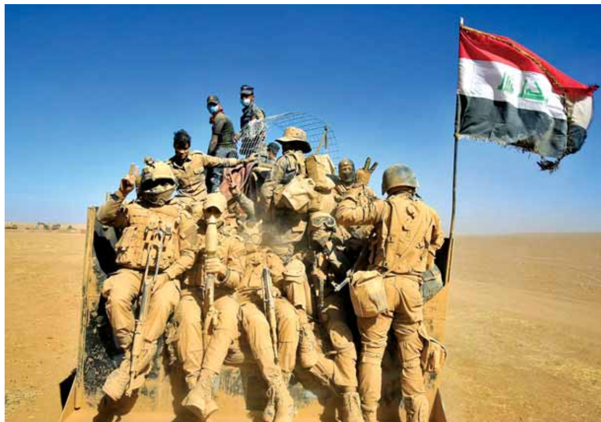
الجيش العراقي في مدينة بطلا بعد تحريرها

أعلنت بغداد استعادة السيطرة على قضاء الرطبة بالأنبار، فيما أكد البنتاغون بالتزامن مع دخول معركة الموصل يومها التاسع تحرير قرابة ٨٠٠ كيلومتر مربع من «داعش» في محيط الموصل. ووصفت وزارة الدفاع الأميركية، خلال مؤتمر صحفي، المرحلة الأولى من عملية تحرير المدينة المستمرة، بأنها كانت انطلاقاً جيدة. وأضاف البنتاغون أن المعركة تسير وفق الخط المخطط مسبقاً، وشدد على أن المستشارين الأميركيين في العراق يعملون بتنسيق وثيق مع القوات العراقية. وفي الوقت نفسه، قال مسؤولون أميركيون، تحدثوا للصحفيين شريطة عدم الكشف عن هوياتهم، إن المعارك ستزداد شراسة وصعوبة مع تقدم القوات نحو مركز مدينة الموصل، متوقعين تباطؤ وتأثر العمليات العسكرية تدريجياً. وكانت القوات العراقية التي قوامها زهاء ٩٠ ألفاً من عناصر الجيش الحكومي ومقاتلي البيشمركة الكردية والفضائل غير النظامية، قد أعلنت عن تحرير ٧٨ قرية وقتل ما يصل إلى ٨٠٠ مسلح من تنظيم «داعش» الإرهابي بعد مرور أسبوع على انطلاق العملية.