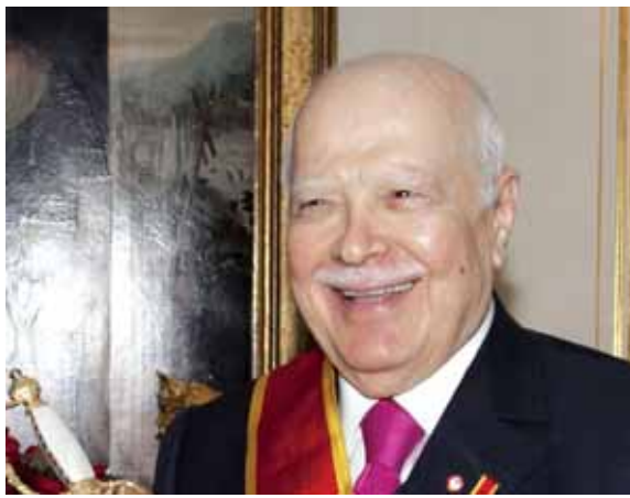
الرئيس عصام فارس

أوبرق النائب السابق لرئيس مجلس الوزراء عصام فارس الى أمير قطر الشيخ تميم بن حمد، معزياً بالأمير السابق الشيخ خليفة بن حمد آل ثاني. وفي ما يلي نص البرقية: «برحبيل صاحب السمو الأمير الشيخ خليفة بن حمد آل ثاني يغيب عن دولة قطر أحد أنبل وجوهها وأبر أبنائها. انني أعرب لسموكم ولجميع أفراد الأسرة الحاكمة عن أخلص مشاعر التعزية والمواساة بالمصاب الأليم والخسارة الجسيمة سائلاً المولى العلي القدير ان يستقبل سموه في رحاب جنانه ويحفظكم ويلهمكم الصبر والسلوان». كما أوبرق أيضاً معزياً الى صاحب السمو الأمير الشيخ حمد بن خليفة آل ثاني.