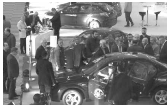
فتحلي مشاركا في الافتتاح من «البيال»

بإمكانات الاقتصادية والصناعية والتكنولوجية المتقدمة لدى الجمهورية الإسلامية الإيرانية، عقدنا العزم على إقامة معرض صناعة السيارات الإيرانية الذي يشهد تطوراً سريعاً وملحوظاً حيث تنتج إيران سنوياً في الوقت الحاضر مليون وخمسمائة ألف سيارة وعجلة من مختلف الأنواع، ومن هنا فسهي تأتي في المرتبة التاسعة عشر عالمياً في مجال صناعة السيارات. كما تملك الجمهورية الإسلامية الإيرانية سبعة مناطق حرة للتجارة والصناعة فضلا عن اثنين وثلاثين منطقة اقتصادية خاصة ولذلك فهي تحتل موقعا متميزا إقليميا في هذا المضمار.