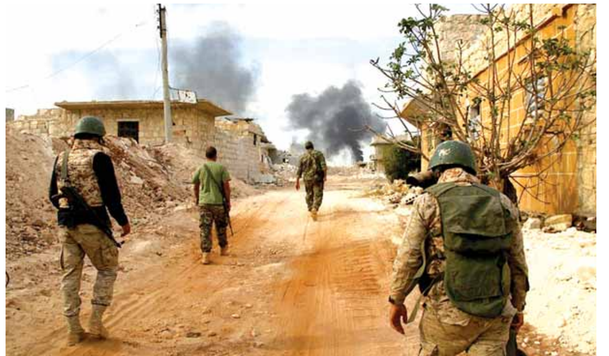
الجيش السوري على تلة بازو الاستراتيجية في حلب بعد السيطرة عليها

كل الاستعدادات اكتملت لمعركة حلب بعد ان دفع الجيش السوري وحلفاؤه بتعزيزات كبيرة، وتمكن من السيطرة على تلة بازو الاستراتيجية. كما احببت وحدات من الجيش السوري هجوما لجيش الفتح على كتيبة الدفاع الجوي في ريف حلب الجنوبي. وأشار مصدر في الجيش السوري الى ان الهجوم تم صدّه، علماً ان الجيش السوري وحلفاءه كانوا قد استعدوا كتيبة الدفاع الجوي خلال ايام. التقدم الميداني للجيش السوري جعله يتحكم بمواقع المسلحين في خان طومان وصولاً الى مشروع