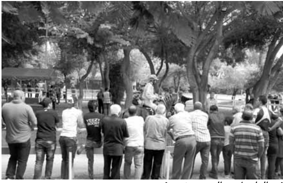
في البادوك... السوق ضعيف