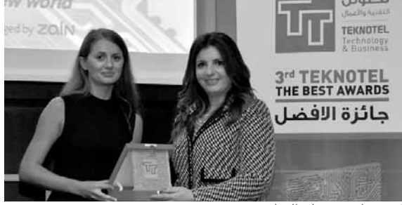
أبو ضاهر تسلم الجائزة

أصبح دور الهاتف النقال محورياً في حياتنا اليومية، عملنا في تاتش على تعزيز بيئتنا الداخلية ومدّها بخبراء وفريق عمل لديه الشغف والإرادة لفهم احتياجات العملاء بشكل أفضل، وتقديم أفضل تجربة خاصة بالهاتف النقال والتأثير إيجاباً على حياة الناس».