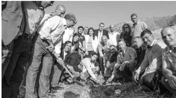
توسيع الغطاء الأخضر

أطلقت لجنة التخطيط المعنية بالممر الاجتماعي والبيئي في راشيا، خطتها الاستراتيجية البيئية الممتدة على ١٠ سنوات من أجل تحسين الظروف البيئية وتوسيع الغطاء الأخضر في المنطقة. وذلك بدعم من مشروع التحريج في لبنان الذي تولاه «الوكالة الأميركية للتنمية الدولية» USAID وتنفذه «مديرية الأجرح الأميركية»، تتضمن الخطة أنشطة كالتحريج، والوقاية من الحرائق، وحملات التوعية، وإدارة الغابات، والسياحة البيئية، وتنمية القررات، وخطة التواصل.