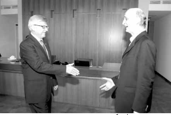
جعجع يرحب بزاسبكين

استقبل الرئيس نجيب ميقاتي سفير روسيا الاتحادية الكسندر زاسبكين ظهر امس في مكتبه، وعرض معه العلاقات الثنائية بين البلدين والتطورات الراهنة في المنطقة. كما زار سفير روسيا رئيس حزب القوات اللبنانية سمير جعجع في معراب، في حضور مستشار رئيس الحزب للعلاقات الخارجية ايلي خوري ورئيس جهاز العلاقات الخارجية بيار بو عاصي. وعرض المجتمعون التطورات السياسية الراهنة في لبنان والمنطقة، لا سيما ملف رئاسة الجمهورية.