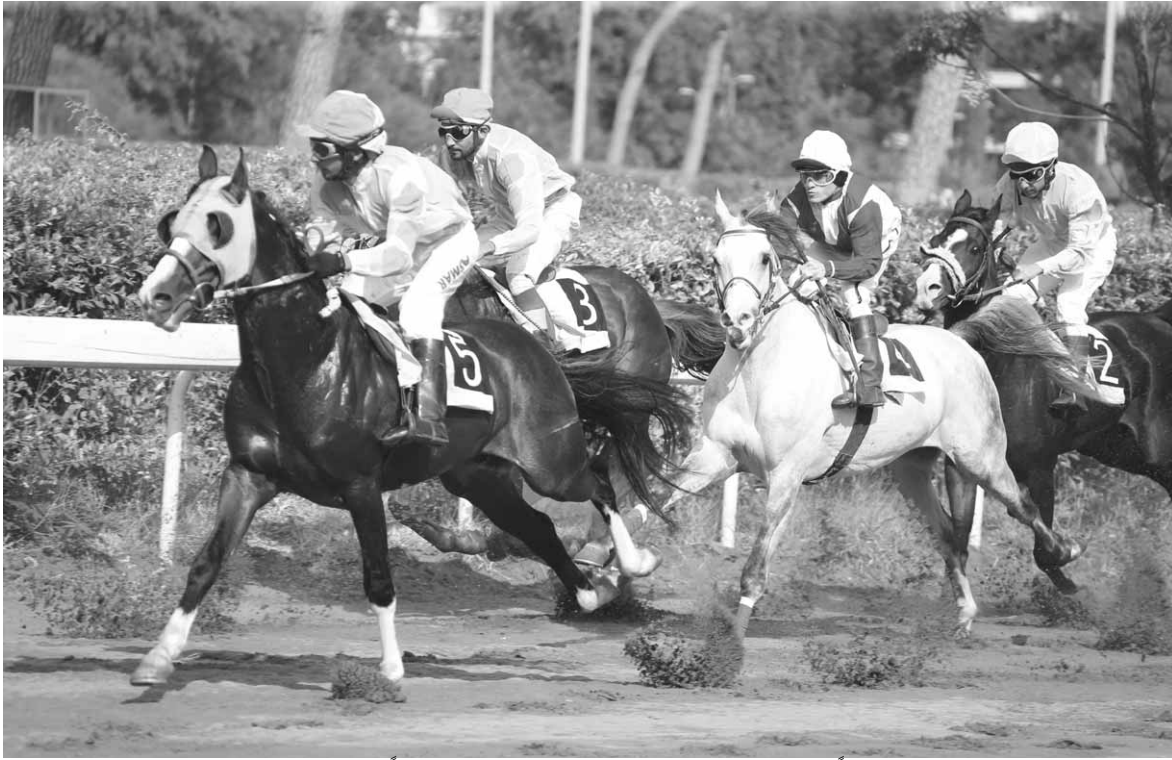
طير الاحرار على رأس المجموعة مطارداً من مفهوم وسلطان الزمان الذي فاز ومشاغب رابعاً