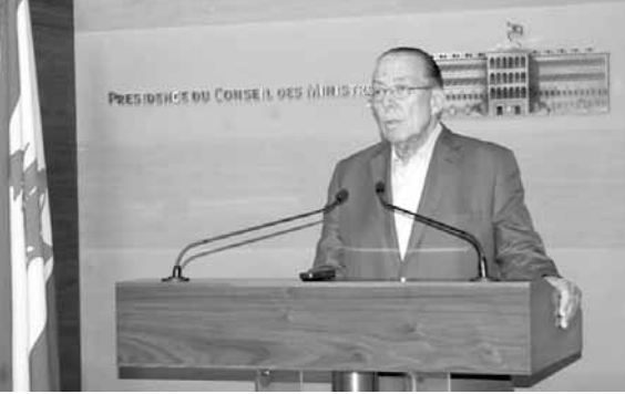
المشقوق متحدّثاً بعد لقائه سلام

زار وزير البيئة محمد المشقوق رئيس الحكومة تمام سلام في السراي، وقال بعد اللقاء: بعد «اليوم الوطني لحماية نهر الليطاني وبحيرة القرعون» لا بد أن نطلع الرئيس سلام على هذا اليوم الذي يمكن أن نعتبره الإنطلاقة الكبرى لعملية تنظيف مجرى نهر الليطاني وبحيرة القرعون ومنع التلوث عن كل هذا الحوض. وأطلعته على هذه الاحتفالية الرمزية التي أقيمت على مجرى النهر في حدود ٩٠ كيلومتراً من أصل ١٧٠، ولأحظنا أن هناك تجاوزاً كبيراً من المواطنين والبلديات ومن المجتمع المدني، وأن الكل يطالب ببدء التنفيذ فوراً، وقدمت للرئيس مجموعة المشاريع المتكاملة كخارطة طريق لتنفيذ هذه العملية التي قد تستغرق بضع سنوات، لكنها ستبدأ حتماً في شمال بحيرة القرعون أي على مستوى القرى التي تحتاج إلى شبكات الصرف الصحي ومعامل لتقنية المياه المبتدلة ومنع المصانع من تلويث النهر. وأبلغنا الرئيس سلام بأنه سيساعدنا جميعاً في دفع مجلس الإنماء والإعمار إلى البيت السريع بهذه المشاريع لتحقيق أفضل النتائج.