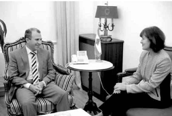
ريتشارد تزور باسيل

عرض وزير الخارجية والمغتربين جبران باسيل مع السفيرة الأميركية في بيروت اليزابيث ريتشارد مستقبل العلاقات الثنائية بين لبنان والولايات المتحدة، وتناول البحث سبل تطويرها وتنقيتها وتعزيز الديمقراطية في مواجهة التحديات، وجرى التأكيد على ضرورة الاستقرار.