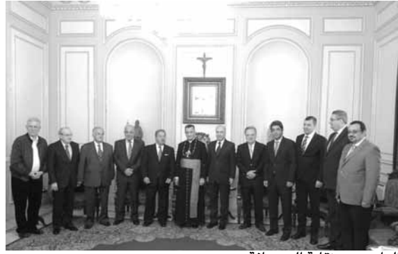
الراعي مع نقابة الصحافة

استقبل البطريك الماروني الكاردينال مار بشارة بطرس الراعي قبل ظهر امس، في الصرح البطريركي في بكركي وفداً من ابناء الكنيسة الأرمنية الأرثوذكسية في فرنسا يتزأسه المطران فاهان هوفانيسيان الرسول البطريركي في اوربا الغربية وراعي الكنيسة الأرمنية الأرثوذكسية في باريس.