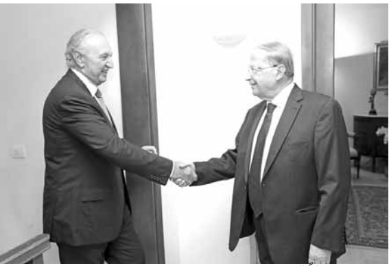
عون مستقبلاً الصفدي

التقى رئيس التكتل «التغيير والإصلاح» النائب العماد ميشال عون صباح امس في دارته في الرابية، الوزير السابق محمد الصفدي على مدى أكثر من ساعة، خرج بعدها الصفدي قائلاً: «لا نريد إلا أن نبارك للعماد عون».