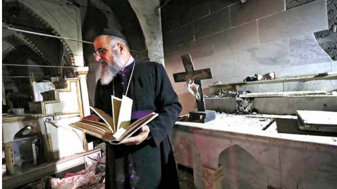
كاهن كنيسة مدينة بطة متفقدا الاضرار بعد تحريرها من داعش

النائب سليمان فرنجية عرض تفاصيل ما جرى معه رئاسياً منذ الاجتماعات مع الرئيس سعد الحريري في باريس. وأكد انه كان واضحاً خلال الجلسة الاولى التي دامت نصف ساعة مع الرئيس الحريري وقتل له بوضوح: «سأزور سوريا (تتممة الخبر المحلي ص ١٦)