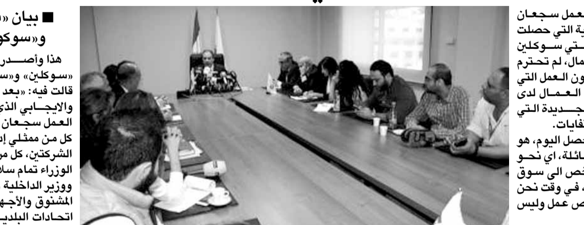
وقد الوزير قزي الى احترام حقوق العمال غير اللبنانيين، لأن هؤلاء ينتمون ايضا الى الجنس البشري ولايجوز التفاضل عن حقوقهم في اطار العقود القائمة بينهم وبين الشركة.