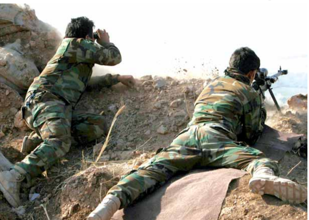
جنديان سوريان خلال الاشتباكات في حلب امس

عند الساعات الاولى من مساء امس صدر بيان امريكي - روسي ان وزيرى خارجية اميركا جون كيري وروسيا سيرغى لافروف اتفقا على استمرار الهدنة في حلب بعدما ظهر في الافق ان معركة كبرى آتية على منطقة حلب، خاصة انه بعد ثلاثة ايام من هدنة انسانية طرحتها قوات درع الفرات لم يخرج اهالي حلب من المدينة، قسم منهم لا يريدون مغادرة منازلهم، وقسم لان المسلحين متعومهم، والقسم الاكبر يريد البقاء في المدينة. معركة حلب اصبحت معركة اقليمية، فيها درع الفرات والتحالف الدولي وفيها تدخل تركي كبير بالإضافة الى التدخل الروسي المباشر بحجم قوي لم يسبق له مثيل حتى في زمن معارك الشيشان.