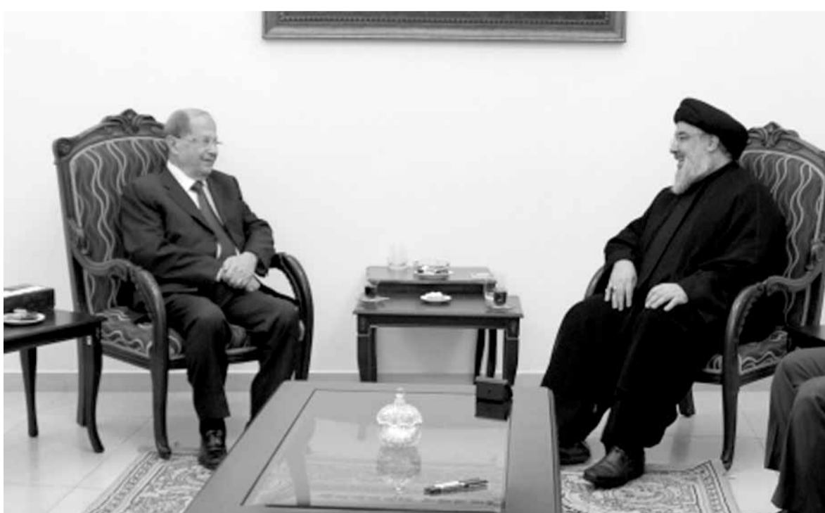
لقاء عون نصرالله مساء الاحد

وتقول المصادر ان الرئيس نبيه بري لديه هامش تحرك أوسع في فريق ٨ آذار فهو رئيس حركة أمل ورئيس مجلس النواب منذ أكثر من ٢٤ سنة (بدعم من حزب الله) ولا يقل أبداً ان تجري المياه من تحت قدميه دون معرفته وأن يتكلم البعض أو يشبهه البعض ما يحصل بميثاق ١٩٤٣. واشارت المصادر الى ان حزب الله سيفتح صفحة