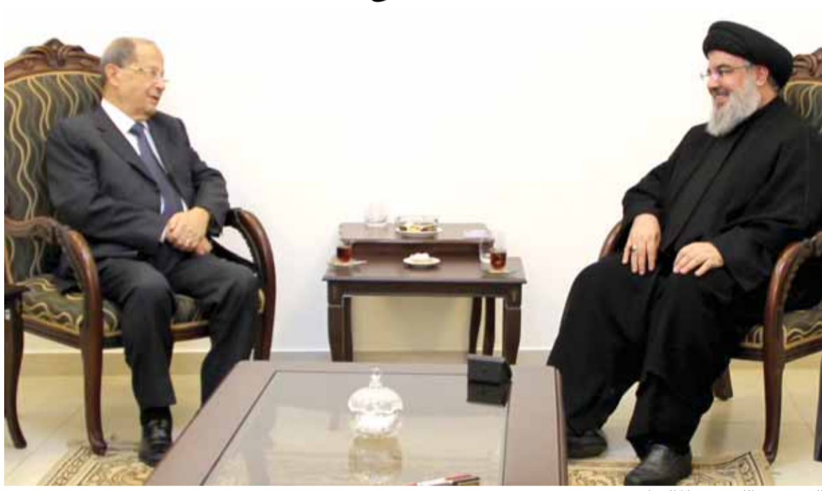
السيد نصرالله مستقبلاً العماد عون

البلاد امام معركة رئاسية والنائب سليمان فرنجية أكد بصراحتة المعهودة، انه مستمر في ترشحه وسيخوض الاستحقاق الرئاسي في ٣١/١٠/٢٠١٦ والانتخابات ستحصل واذا خسرتنا مستعدون نفسياً وسياسياً واذا ربنا مستعدون لذلك ايضاً.