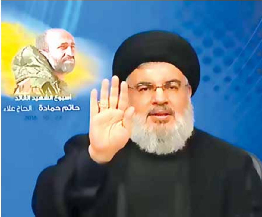
نصرالله يتحدث عبر الشاشة

حزبي، وليس هناك من الاصدقاء ولا من الخصوم من يفكر بعقلية الفوضى أو بعقلية العودة الى الحرب الأهلية». واكد ان «العلاقة بين حركة امل وحزب الله هي اعماق وأقوى وأصلب من ان تثار منها الفيركات». وأعلن السيد نصرالله انه «عندما تعقد الجلسة المقبلة لانتخاب الرئيس ستحضر كتلة الوفاء للمقاومة بكامل أعضائها لانتخاب العماد ميشال عون، وعندما نذهب الى الجلسة المقبلة سنذهب متفهمين متفاهمين مع حركة امل». واذ اعتبر السيد نصرالله «اننا نقدم تضحية كبيرة جدا عندما نقول اننا لانمانع ان يتولى سعد الحريري رئاسة الحكومة»، شدد على ان حزب الله «كان يريد من اليوم الاول انتخابات رئاسية، وقال: «اننا سنكون اهل الصدق والوفاء مع الحليف». وتوجه لجمهور التيار الوطني الحر بالقول: «لا تسمحوا لأحد بأن يستغل أو يسيء أو يحاول ان يشوه العلاقة بيننا وبينكم». وقال السيد نصرالله: «لا يراهن احد على تعينا، ونحن نفتخر بشهادتنا في سوريا، والحالة الوحيدة التي تعيدنا الى لبنان هي الانتصار في سوريا».