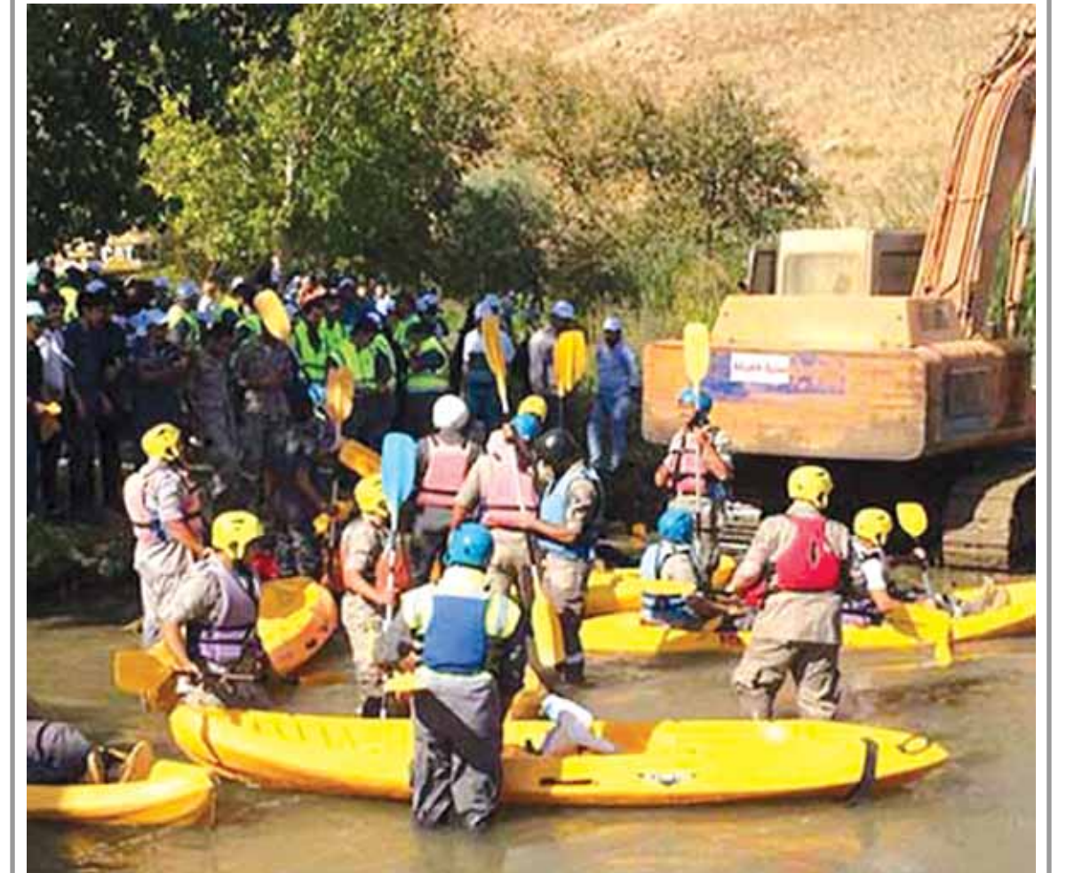
(التفاصيل ص٧)