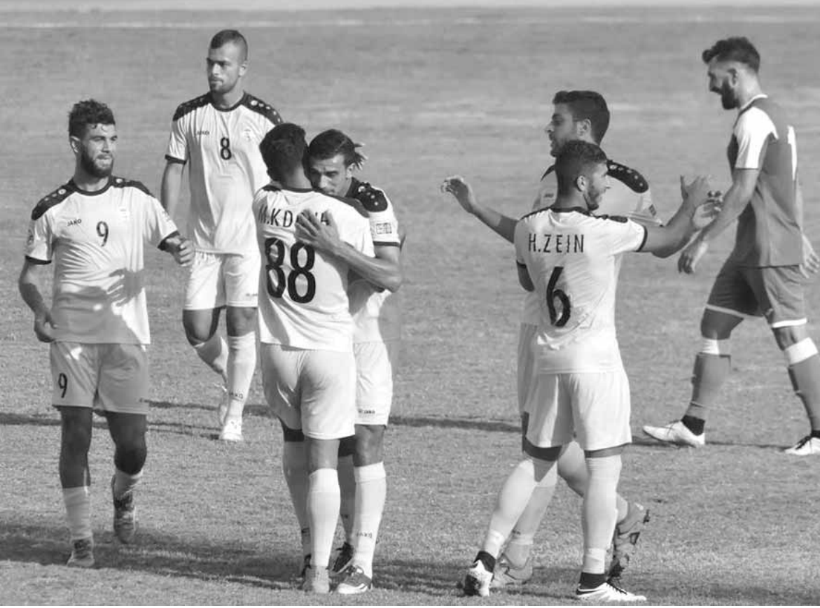
فرحة لاعبي العهد

تصدر العهد ترتيب الدوري اللبناني لكرة القدم بعدما حقق فوزه الرابع على التوالي وكان على حساب ضيفه الراسينغ بيروت ٣-١ أمس الأحد على ملعب صيدا البلدي في المرحلة الخامسة.