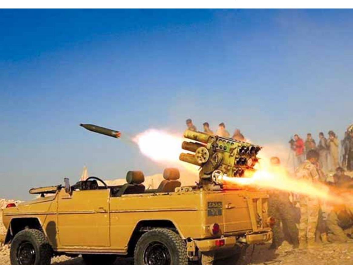
القوات العراقية توجه صليبة من الصواريخ الى مواقع «داعش» في الموصل

واشنطن تطالب روسيا وإيران بالتخلي عن دعم الأسد الجيش السوري استعاد السيطرة على كتيبة الدفاع الجوي في حلب