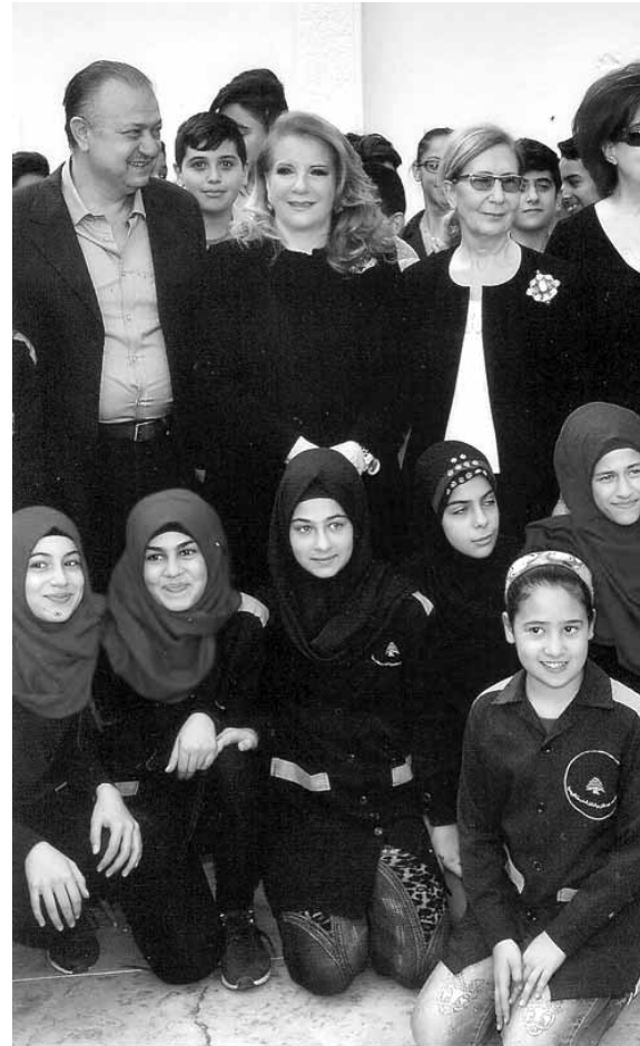
الصلح مع طلاب المدرسة والى جانبها علوية ونائب رئيس بلدية الغبيري بين الانقسام المسيحي والنترف السنني والتنافس الشيعي المستجد عجزوا عن الارتفاع فحفصوا من شأن الناس حتى الازلال.

اخيرا تسلمت الصلح درعين تقديريين من مديري المدرستين.