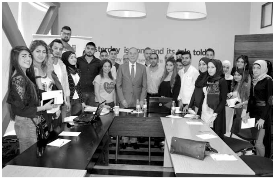
دبوسي مع وفد تجار البترول

وأكد أن «غرفة طرابلس هي البيت الاقتصادي الوطني للجميع ونحن متمسكون في كل حين بالشراكة الدائمة مع جمعية تجار البترول وقضاؤها ولأنها باتت عنوانا للتميز والتألق في كل مشاريعها وبرامجها. لدينا الكثير من المشاريع والخطط المشتركة التي تعزز مسيرة التلاقي والتعاون، ونحن على استعداد دائم في كل نضع أحسن ما لدينا بتصرف جمعية تجار البترول وقضاؤها لتحقيق تطلعاتها في النهوض الاقتصادي والتقدم الاجتماعي».