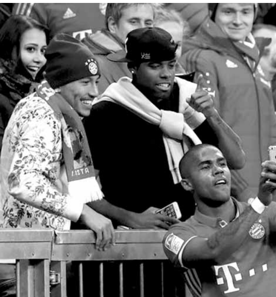
دوغلاس كوستا في «السيفي» الشهيرة أمام مونشغلادباخ

حدد كارل هاينز رومينغّه، رئيس نادي بايرن ميونيخ الألماني، منافس فريقه المباشر على لقب الدوري، مشيداً، في الوقت نفسه، بأداء اللاعبين في مباراة الفريق أمام بوروسيا مونشغلادباخ، السبت، والتي شهدت عودة الفريق للانتصارات. وقال رومينغّه أمس الأحد، في تصريحات لوقع ناديه الرسمي، «نحترم جميع المنافسين، لكن دورتموند يبقى المنافس الأكبر لنا». وأضاف عن مباراة مونشغلادباخ «كان هذا أفضل أداء لنا هذا الموسم، كان أدائنا في الشوط الأول