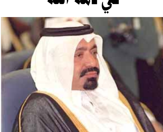
الشيخ خليفة بن حمد آل ثاني

أعلن الديوان الأميري القطري أمس، عن وفاة الشيخ خليفة بن حمد آل ثاني، والد أمير قطر السابق الشيخ حمد وجد أمير البلاد الحالي الشيخ تميم بن حمد. وقال الديوان الأميري، في بيان نقلته وكالة الأنباء الرسمية، إنه «يُعني فقيد الوطن المغفور له بإذن الله صاحب السمو الأمير الأب الشيخ خليفة بن حمد آل ثاني الذي وافته المنية مساء الأحد عن عمر يناهز ٨٤ عاماً». وأضاف البيان أن الشيخ تميم بن حمد آل ثاني أمر بإعلان الحداد العام في كافة أنحاء الدولة لمدة ثلاثة أيام. وتولى الشيخ خليفة مقاليد السلطة عام ١٩٧٢ حتى عزله عام ١٩٩٥، ليخلفه ابنه الشيخ حمد. والشيخ خليفة بن حمد بن عبد الله بن قاسم بن محمد آل ثاني (١٩٣٢ - ٢٠١٦)، سادس أمراء قطر. وهو أحد أبناء الشيخ حمد بن عبد الله آل ثاني. عين ولياً للعهد في عهد