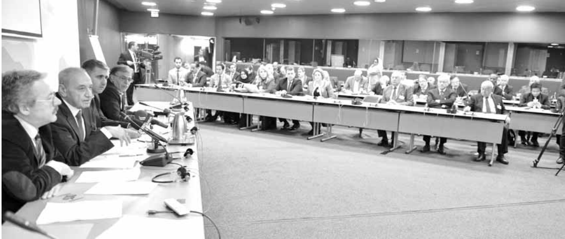
بري خلال الجلسة

صحیح ان الرئيس بري مشدود الي ما يدور حول الاستحقاق الرئاسي قبل جلسة انتخاب رئيس الجمهورية في ٣١ الجاري، إلا أنه كالعادة كان الحاضر الأبرز عشية بدء اجتماعات الاتحاد البرلماني الدولي في جنيف مترئسا الاجتماعين التشاوريين للبرلمانات الإسلامية والعربية ظهرا ومساء بصفته رئيسا للاتحاد البرلماني العربي. وبين الاجتماعين كشف النقاب في دريشة مع الوفد الإعلامي المرافق عن انه ابلغ العماد عون بان «تعطيل النصاب لجلسة انتخاب رئيس الجمهورية في جيبي الكبيرة، ولكن لست انا من يلجأ الى ذلك، فأنا لم افعلها مرة ولن افعلها». ومن دون مواربة او التباس اكد انه سيصوت للناخب فرنجية ما دام مستمرا بترشيع نفسه.