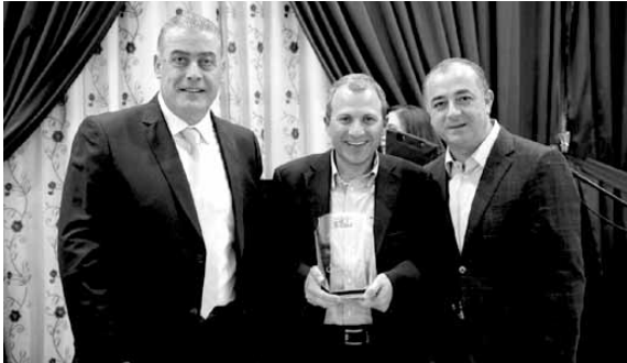
خلال توزيع الدروز

باسيل : التفاهم لا يكتمل من دون الدروز وجميع المسيحيين