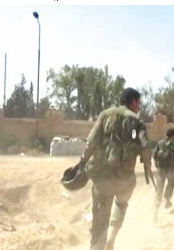
الجيش السوري يتقدم جنوبي حلب

سيطرته على عدد من الكتل هناك، وأشارت الى أن اشتباكات بين القوات الحكومية والمسلحين اندلعت أيضاً في حي بعبيدين شمال شرق حلب. واستهدف المسلحون، من جانبهم، مواقع الجيش في أحياء الشهباء الجديدة ودوار السلام غرب حلب والحمدانية وصلاح