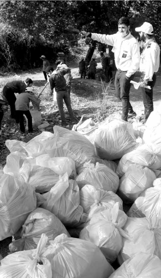
اكياس النفايات خلال حملة التنظيف

أهمية الحملة الوطنية أنها تبدأ لكي تستمر، وليس لنعلن عنها ثم نذهب إلى بيوتنا، وبالتالي على الجميع الاستمرار بمتابعة هذا الملف الوطني بامتياز، لأن أي ضرر يصيب نهر الليطاني، فإنه سيصيب كل اللبنانيين والسلامة العامة والإنتاج الزراعي والبيئة وحتى المنشآت السياحية القائمة على ضفافه»، مشيراً إلى أن «إقرار مجموعة من الاقتراحات ومشاريع القوانين في المجلس النيابي هو بفضل جهود العديد من النواب ومنهم نواب كتلة الوفاء للمقاومة وإخواننا نواب كتلة التنمية والتحرير الذين بذلوا جهداً كبيراً ليكون هناك قانون وبرنامج الإنماء والإعمار اتخذوا قراراً بإعطاء قروض ميسرة مما أدى إلى اهتمام ملحوظ من قبل كل الجهات المعنية».