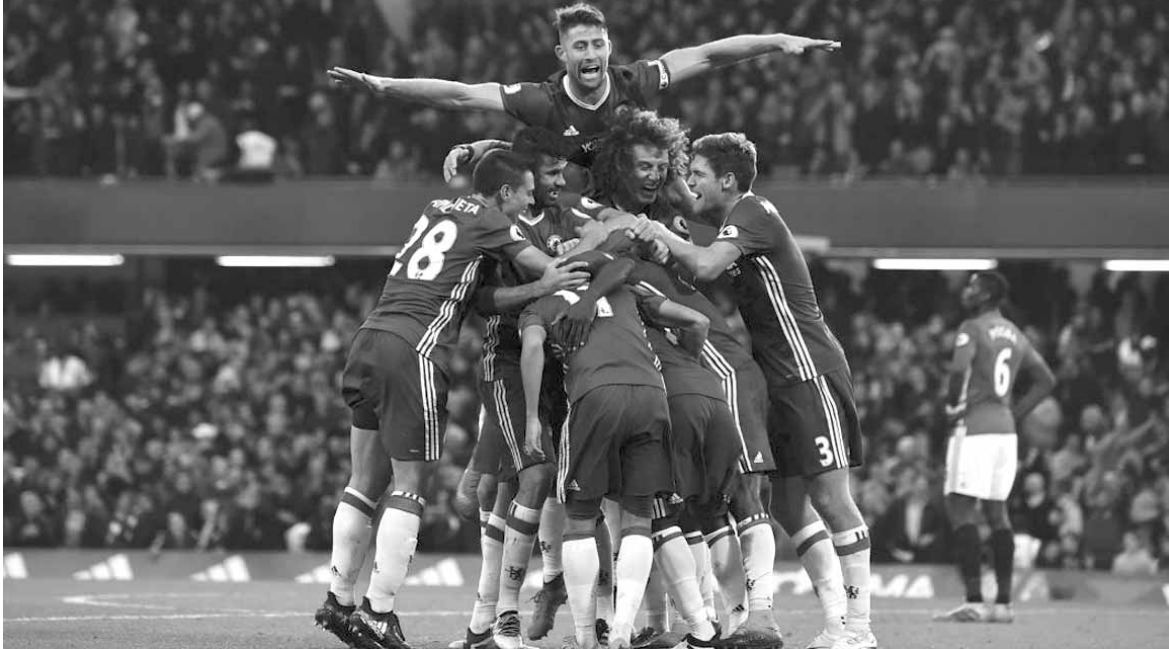
الفرحة العارمة للاعب تشلسي

فشل مانشستر سيتي في استعادة نغمة الانتصارات التي غابت عنه في المباريات الأربع الأخيرة في مختلف المسابقات وسقط في فخ التعادل الإيجابي أمام ضيفه ساونمبتون ١-١ أمس الأحد في ختام المرحلة التاسعة من الدوري الإنجليزي لكرة القدم.