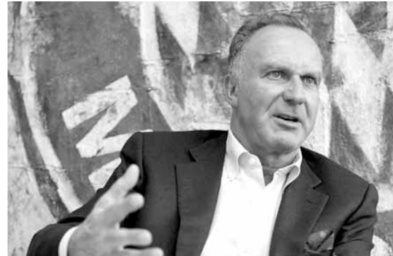
كارل هاينز رومينغّه