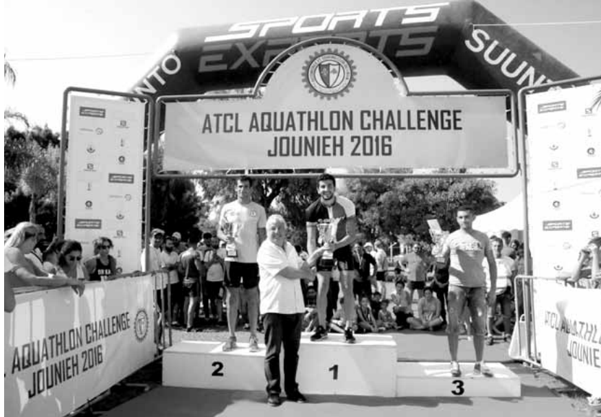
مسيحي يتوج أبطال فئة ١٩ - ٣٩ سنة