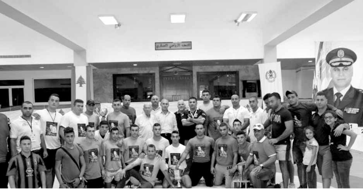
أبطال الجيش اللبناني في المصارعة