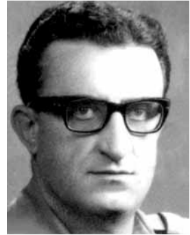
نعت قيادة الجيش - مديرية التوجيه العميد المتقاعد جوزيف زخور، الذي توفي بتاريخ ٢٠١٦/١٠/٢٠، وفي مسابلي نذرة عن حياته: - من مواليد ١٩٢٣/١/١ شرتون - عاليه - تطوع في الجيش بصفة تلميذ ضابط اعتباراً من ١٩٤٦/١٢/١، ورتي الى رتبة ملازم اعتباراً من ١٩٤٦/١٢/١، ثم تدرج في الترقية حتى رتبة عميد اعتباراً من ١٩٧٤/٤/١ - حائز عدة اوسمة وتوتيه العماد قائد الجيش وتيهنته عدة مرات.

تابع عدة دورات دراسية في الداخل وفي الخارج. - متاهل وله ٣ اولاد. - ينقل الجنان باليوم الساعة ١١.٠٠٠ من مستشفى سان شارل الى كنيسة مار تقلا- الفياضية، حيث يقام الماتم بالتاريخ نفسه عند الساعة ١٥.٠٠٠، ويوراي في الثرى في مدافن العائلة. تقبل التعازي قبل الدفن ويتسارخ ٢٣/١٠/٢٠١٦ اعتباراً من الساعة ١١.٠٠ ولغاية الساعة ١٩.٠٠، وبتاريخ ٢٤/١٠/٢٠١٦ اعتباراً من الساعة ١٤.٠٠ ولغاية الساعة ١٩.٠٠ في صالون كنيسة مار تقلا- الفياضية.