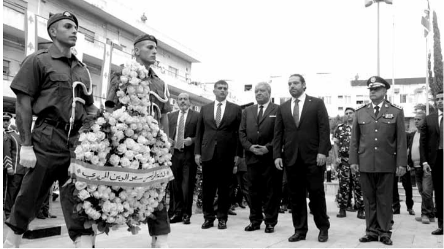
خلال وضع أكاليل من الزهر على نصب اللواء الحسن