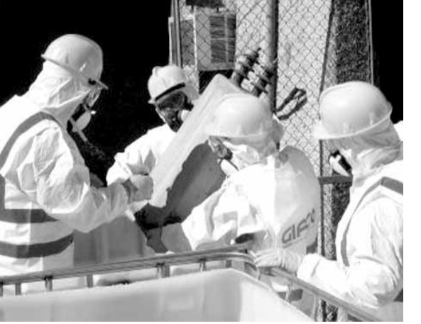
التخلص من المحولات

أعلنت وزارة البيئة في بيان «بدء الدولة اللبنانية بعملية التخلص من المعدات الخارجة عن الخدمة والتي تحتوي على نسب عالية من مواد «بيفنييل المتعدد الكلور»، وذلك ضمن مشروع «إدارة الملوثات العضوية الثابتة من نوع «بيفنييل المتعدد الكلور» في لبنان في قطاع الكهرباء المتقد في وزارة البيئة بالشراكة مع مؤسسة كهرباء لبنان وبالتعاون مع البنك الدولي وبتمول من مرفق البيئة العالمي».