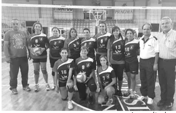
سيدات نادي عمشيت

من جهته، هنأ رئيس الاتحاد اللبناني لكرة السلة المهندس وليد نصار، نادي بيبولوس على الإنجازات التي حققها، «أملًا بتحقيق المزيد في الموسم المقبل». وقال: «أنا ابن هذا النادي وأحلامنا كانت كبيرة جداً لكن الظروف التي عشناها مغامرة من ظروف اليوم، وافتخر بهذا النادي الذي هو المدرسة التي أوصلتني إلى رئاسة الاتحاد». وأعلن «عدم ترشيحني مجدداً لرئاسة الاتحاد في الانتخابات التي ستجري بعد شهرين، وأن المناقشة التي ستحصل في ملف تزليم النقل التلفزيوني للدوري اللبناني لكرة السلة درجة أولى للسيدات والرجال ستكون بطريقة