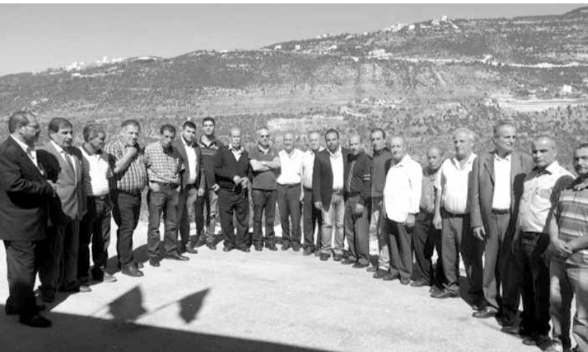
المشاركون في الندوات

الغورمونية ما أدى إلى تساؤل نسبة الترسبات في الثمار». وفي الختام تم توزيع بعض التقديمات لعينة (المبيدات البيولوجية وسم فأر الحقل ومصائد غذائية وفورمونية ومبيدات «جذب وقتل») لمكافحة ذبابة الفاكهة.