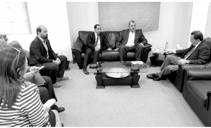
حرب مع وفد الشركات

استقبل وزير الاتصالات بطرس حرب وفداً من تجمع شركات الإنترنت جاء يطلب منه إعادة تشغيل خدمة الغوغل كاش لتحسين جودة خدمة الإنترنت لجميع المستخدمين على الأراضي اللبنانية.