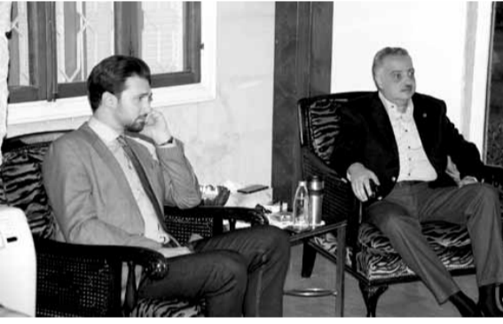
تيمور جنبلاط عند أرسلان

استقبل رئيس الحزب الديموقراطي اللبناني الامير طلال أرسلان، في دارته في خلدة، تيمور جنبلاط، يرأفقه وفد من الحزب التقدمي الاشتراكي ضم الوزيرين أكرم شهبه ووائل أبو فاعور، النائب غازي العريضي، ومفوض الداخلية في الحزب هادي أبو الحسن، في حضور الوزير السابق مروان خير الدين، نائب رئيس الحزب الديموقراطي تنسب الجوهري وعضوي المجلس السياسي لعمان الجري ولواء جابر، حيث تم التباحث في آخر المستجدات السياسية المحلية والإقليمية. بعد اللقاء، قال العريضي: «في بعض الاحيان هناك خلافات في وجهات النظر على مواقف معينة، لكن كان ثابتاً وواضحاً للجميع أننا حرصاء على وحدة الصف داخل طائفة الموحدين الدرزي، حرصاء على تأكيد وترسيخ مبدأ التنوع ضمن الوحدة داخل الطائفة الدرزية. والحمدالله الامور تسير بشكل جيد والتنسيق قائم ومستمر بين رفاقنا في «التقدمي اللبناني» والرفاق في «الديموقراطي اللبناني» بتوجهيات من وليد جنبلاط والامير طلال». وسئل العريضي هل سيصوت اللقاء الديموقراطي للعماد عون، فقال: «لقد دوننا من قبل رئيس اللقاء الديموقراطي النائب وليد جنبلاط الى اجتماع اليوم حيث سيكون نقاش تفصيلي بيننا جميعاً وبشكل