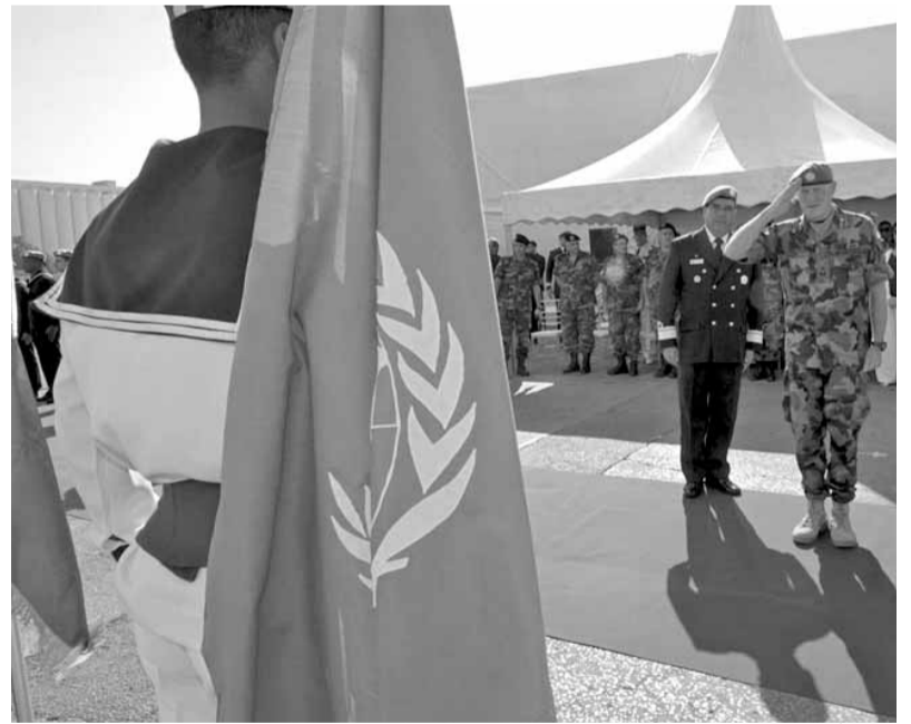
قائد «اليونيفيل» يستعرض عناصر البحرية في قوات الامم المتحدة

وفي بيان للمكتب الإعلامي لقوات «اليونيفيل» في الناقورة، ان قوة اليونيفيل البحرية انتشرت في ١٥ تشرين أول ٢٠٠٦ بناء على طلب من الحكومة اللبنانية في أعقاب اعتماد القرار ١٧٠١ من قبل مجلس الأمن الدولي، وهي تدعم البحرية اللبنانية في منع الدخول غير المصرح به للأسلحة أو المواد ذات الصلة عن طريق البحر إلى لبنان. كما أنها تساعد البحرية اللبنانية في تعزيز قدراتها من خلال تنفيذ مجموعة من الدورات التدريبية المختلفة والتدريبات المشتركة بهدف تسلم البحرية اللبنانية جميع الواجبات المطلوبة للامن البحري. وتضم قوة اليونيفيل البحرية حالياً أكثر من ٨٥٠ عنصراً من أفراد البحرية وسبع سفن، سفينتان من بنغلاديش، وسفينة واحدة من كل من البرازيل والمانيا واليونان واندونيسيا وتركيا، إلى جانب مروحيتين. في السنوات العشر الماضية، هاتمت قوة اليونيفيل البحرية أكثر من سبعين ألف سفينة، وأحالت أكثر من ٨٥٠٠ سفينة منها إلى البحرية اللبنانية للتفتيش.