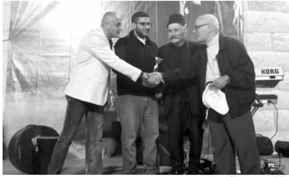
خلال توزيع الجوائز

نظمت لجنة وقف مارشليطا - فاريا دورة مار شليطا التاسعة على التوالي للرياضات التقليدية الشعبية، تحت إشراف لجنة التراث والاتحاد العربي للرياضات التقليدية الشعبية برئاسة مارون خليل خليل، وبمشاركة ابطال من مختلف المناطق، وذلك على مسرح ربة مارشليطا فاريا. وألقى خليل كلمة شكر فيها بلدية فاريا الداعمة للمهرجان بكؤوس وجوائز مادية ولجنة وقف مارشليطا، وبارك للابطال المشاركين في الدورة.