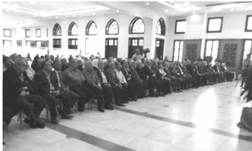
الحضور في حفل الزيتون

افتتح وزير الزراعة أكرم شهيب «اليوم الوطني للزيتون» في دار حاصبيا، بدعوة من اتحاد بلديات الحاصباني وغرفة صيدا والجنوب، في حضور وزير الصحة العامة وائل أبو فاعور.