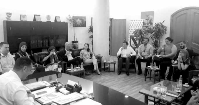
الوفد في البلدية

والاحتياجات الضرورية لمواكبة تدفق اعداد النازحين السوريين». وتساءل الوفد عن «القطاعات الخدمية الرسمة في المدينة». وعرض الوفد مشروع «تعزيز مرونة الشباب من خلال الرياضة» الذي ينفذه المجلس في مدن الفجاء، وتحديد التبانة، جبل محسن، القبة، البداوي والمنكوبين، وذلك بالتعاون مع البلديات المعنية وجمعيات المجتمع المدني.