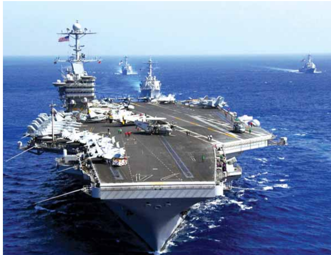
البوارج الروسية في المتوسط

قال وزير الدفاع الروسي ان روسيا حشدت ١٥ ألف جندي في مدمرات بحرية على طول الساحل السوري دون أن يوضح لماذا، لكن ناطقاً ثانياً يقول في قيادة الجيش ان روسيا تستعد للهجوم براً باتجاه حلب. أما تركيا فشددت ٦٠ ألف جندي مع اربعمئة دبابة تمهيداً للهجوم على كل محيط حلب وحلب إنما انذار اميركي يوثل الهجوم حالياً. وكتبت وكالات الأنباء ان المسلحين في حلب وصلتهم إمدادات بالف ومثني مسلح مزودين بصواريخ ضد الطائرات يستعملونها ضد الطائرات الروسية. أما من جهة تركيا فإن المسلحين يحفرون الخنادق ويزرعون المتفجرات بالمئات لنسف الطرقات والجسور والأراضي ويسكون معركة حلب معركة سوريا كأكبر معركة تحصل، فيما هناك مئة طائرة روسية وتركية تحلق في أجواء حلب والمنطقة. أما الجيش السوري النظامي فهو يسيطر على قسم كبير من حلب لكن المسلحين يسيطرون على شرق حلب وعلى احياء كثيرة فيها.