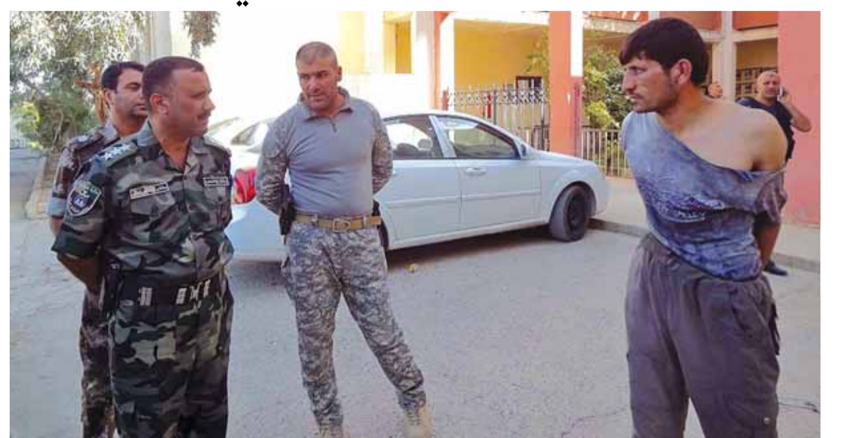
اعتقال مسلح من داعش في كركوك

شن تنظيم الدولة الاسلامية العديد من الهجمات في مناطق متفرقة من محافظة كركوك تمكن خلالها من الوصول الى مواقع حكومية واقتصادية مهمة جنوب المحافظة وشمالها. وأشارت معلومات الى ان الطائرات الاميركية قصفت بعنف عدداً من مواقع «داعش» في الاحياء التي سيطرت عليها واقامت مجلس عزاء في «كركوك» مما ادى الى مقتل ١٥ امرأة. فيما ايد وزير الدفاع الاميركي اشتون كارتر دور تركيا في المعركة ضد تنظيم