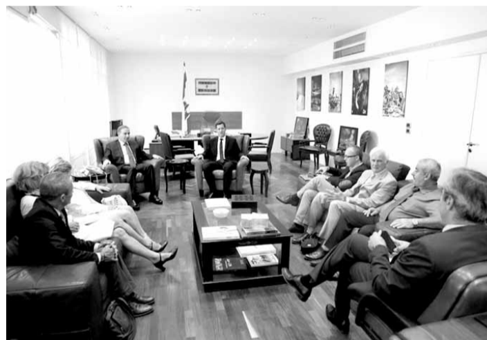
فرعون لدى استقباله الوفد الفرنسي

التقى وزير السياحة ميشال فرعون الأمين العام لوزارة السياحة اليونانية ديمتري ترفوتوبولس، يرافقه مساعد السفير اليوناني في لبنان اثناسيوس لوسيس.