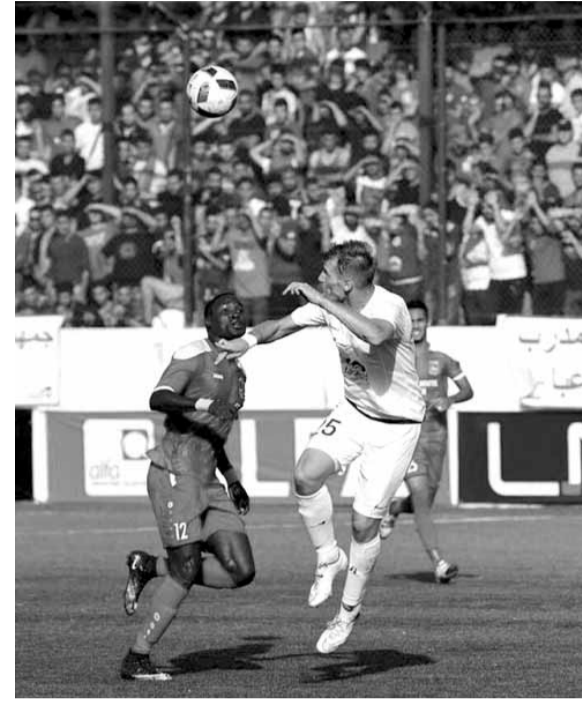
من مباراة النجمة والتضامن صور