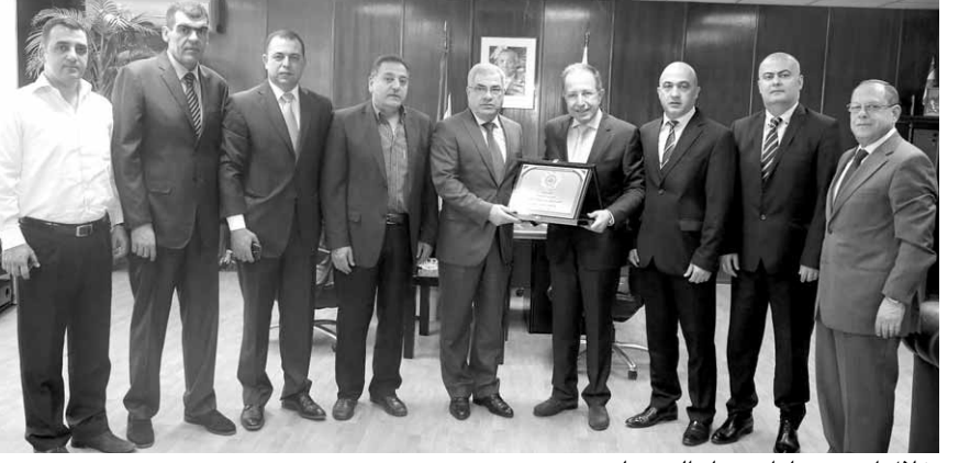
خلال احدى زيارات همّام الى حناوي

اجرى معالي وزير الشباب والرياضة العميد عبد المطلب حناوي اتصالاً هاتفياً برئيس اللجنة الاولمبية اللبنانية السيد جان همّام ابلغه فيه ان مجلس الوزراء اقر المرسوم الناظم للحركة الرياضية اللبنانية خلال