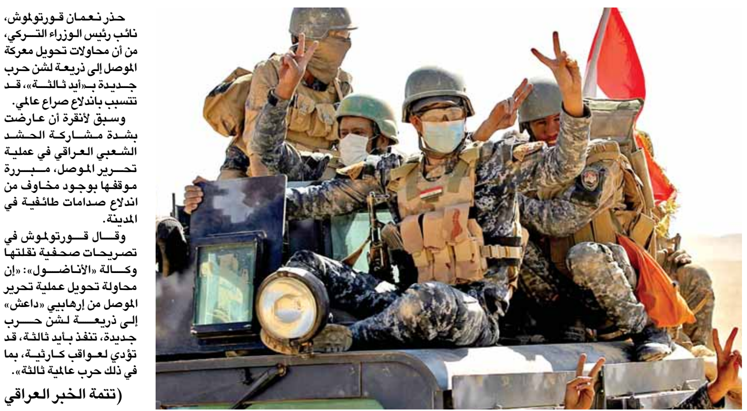
الجيش العراقي يرفع شارات النصر على مشارف الموصل