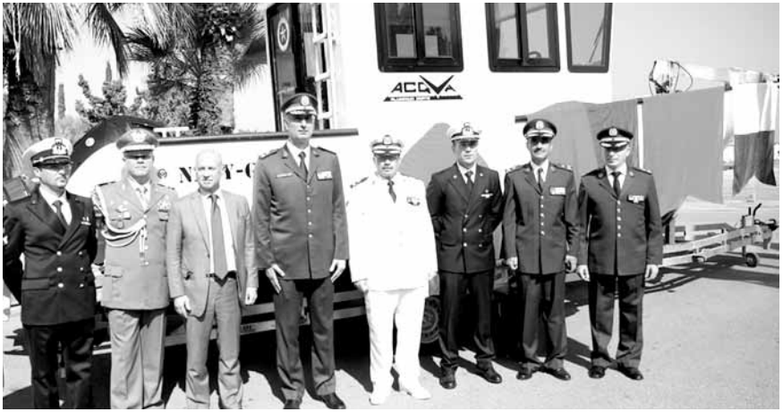
خلال استلام الزورق