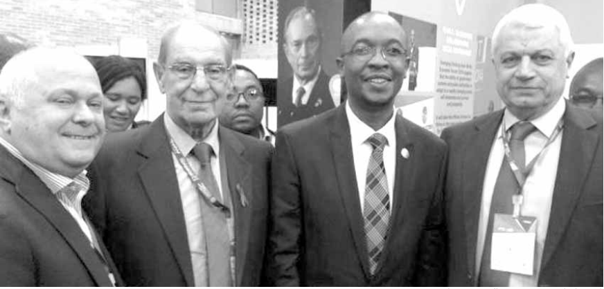
المشاركون في قمة بوغوتا

الإقرار السلبية للنزوح على البنى التحتية والنواحي المعيشية والاجتماعية دون مساعدة الدولة، إضافة على ظاهرة العنف في المدن وتأثير النزوح السوري في هذه الظاهرة، وطالبتنا «بضرورة وضع آلية واضحة المعالم، وتوفير فرص عمل للحد من هذه الظاهرة».