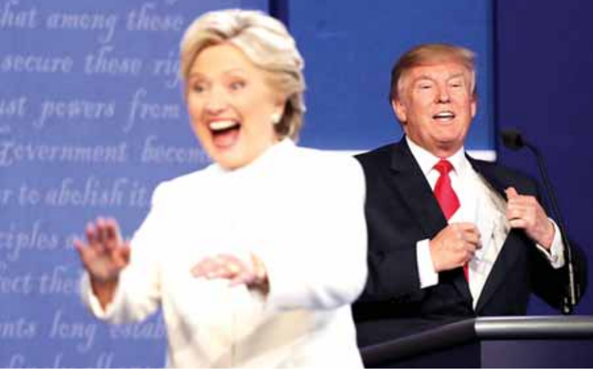
ترامب وكلينتون بعد انتهاء المناظرة

لدرجة انه قال عنها «يا لها من امرأة بغيفية». جرت في لاس فيغاس المناظرة الثالثة والأخيرة والحاسمة بين المرشحة الديمقراطية ومنافسها الجمهوري دونالد ترامب في لاس فيغاس بسجلات عنيفة، وتبادل اتهامات من العيار الثقيل، وصلت أكثر من مرة بالمرشح الجمهوري الى حد تحقير منافسته