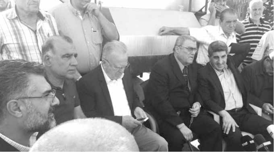
اتحادات النقل تواصل اعتصاماتها

للسنا هواة قطع طرققات او اعتصامات لكنهم يجبرونا على القيام بذلك، نريد اطعام عائلانا وتعليم اولادنا ونحن على هذا الاساس التقينا وزير الداخلية الاسبوع الماضي، فقال لنا: سلموني مذكرة بمطالبتكم كي اعرضها على مجلس الوزراء، فقلنا له: هل ستدافع عنها، فقال: لا، اجبته عندئذ: ان مجلس الوزراء هو من يقرر». وختم: «اليوم مجلس الوزراء مجتمع ومن الممكن ان يكون هذا آخر اجتماع، لان هناك جلسة لانتخاب رئيس اخر الشهر، وهناك بعدها رئيس وحكومة جديدة، فقررنا ان نجتمع غدا كقطاع للنقل، وهذا الاجتماع سيحدد المدة التي سنبقى فيها في الشارع من اجل تحقيق المطالب». وأفيد ان السائقين العموميين واصلوا اعتصامهم لليوم الرابع على التوالي عند مدخل مركز المعايينة الميكانيكية في العيرونية طرابلس بدعوة من اتحادالنقل البري في لبنان سعيا الى الغاء ما يصفونه بالصفقه المشبوهه في المعايينة الميكانيكية.. كما تم قطع الطريق امام مركز المعايينة الميكانيكية في الحدت، بانتظار قرار من مجلس الوزراء بالغاء صفقة المعايينة الميكانيكية واعادتها الى كنف الدولة.