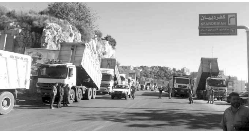
قطع طريق كفرديان

أفيد أن أصحاب وسائقي الشاحنات قطعوا طريق كفرديان، احتجاجاً على إقبال المرامل والكسارات وسط اجراءات أمنية لقوى الامن الداخلي. وطالب المعتصمون «الذين قطعوا الطريق بالشاحنات والجرافات الى الرجوع عن توقيف العمل برخص الستوكات، وإعادة العمل بالمقالع أسوة بغيرها من المناطق».