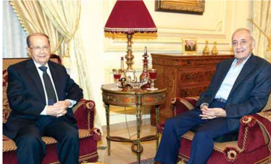
عون عند بري

قضى الامر، فخامة الرئيس ميشال عون رئيساً للجمهورية اللبنانية في ٢٠١٦/١٠/٣١ بنسبة اقتراع قد تصل الى ما بين ٧٣ الى ٨٠ صوتاً. العماد ميشال عون رئيساً للجمهورية بعد انتظار دام لـ ٢٧ سنة، وخرج من قصر بعبدا في ١٣ تشرين الأول ١٩٨٩ رافضاً للطائف ويعود اليه في ٢٠١٦/١٠/٣١ مع الطائف ودون اي تعديل، وبين الترشحين، تاريخ حافل بالمحطات اوصلت الرئيس عون الى بعداً بعد عمر ناهز الـ ٨٠ سنة.