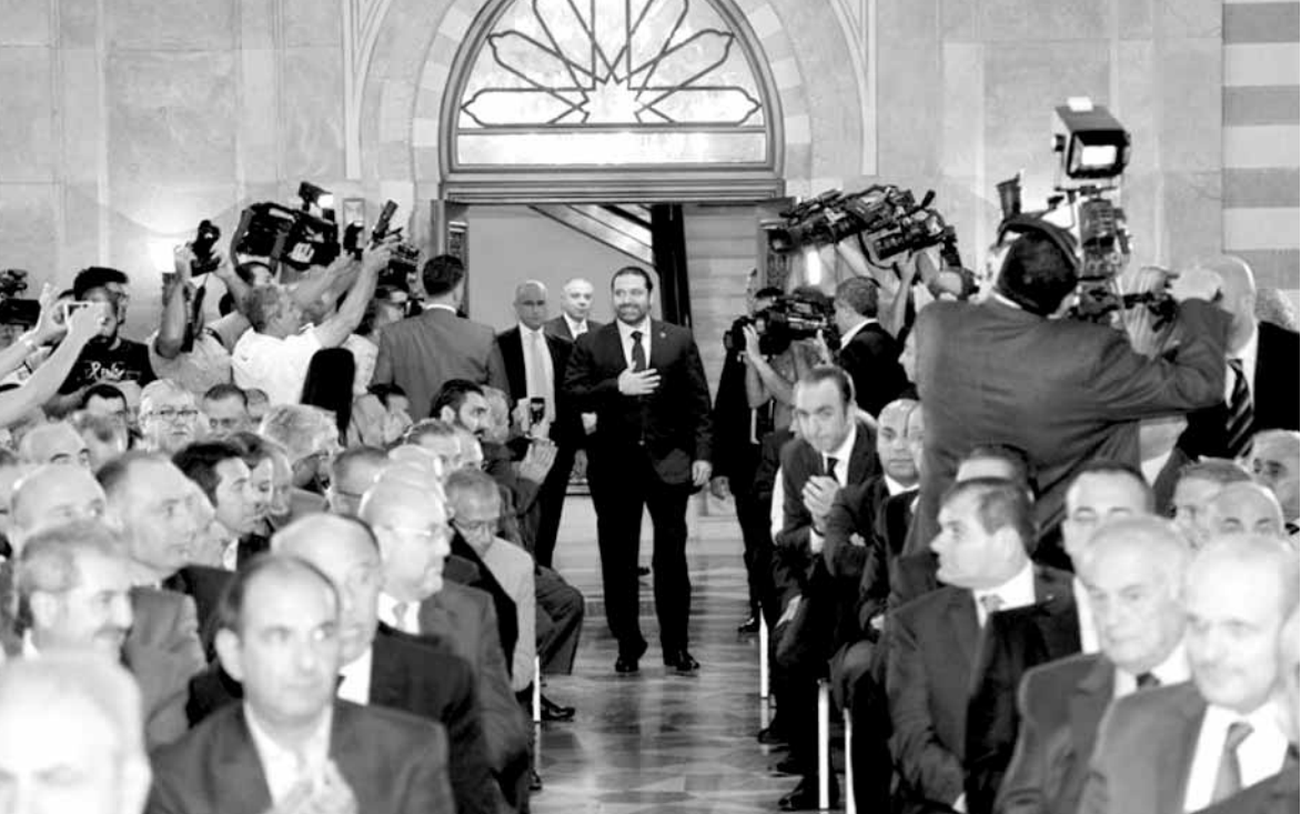
خلال دخول الحريري قبل الاعلان الرسمي

لمجلس النواب؟ ماذا سيصبح بالدولة؟ بالمؤسسات؟ بالاقتصاد؟ بالأمن؟ بالناس؟».