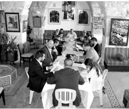
ارسلان يترأس الاجتماع

قرّر المجلس السياسي للحزب الديموقراطي اللبناني بعد اجتماعه الدوري برئاسة رئيس الحزب النائب طلال ارسلان إبقاء اجتماعاته مفتوحة انسجاماً مع دقة المرحلة، معتبراً أن العودة الى طاولة الحوار قد تكون حلاً لإشراك كل الأفرقاء في الحل المنشود لانتخاب رئيس الجمهورية وكذلك لإضفاء حالة من الثقة بين الشرائح السياسية اللبنانية.