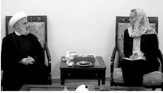
كاغ عند قاسم

جالت المنسق الخاص للأمم المتحدة في لبنان سيغريد كاغ على عدد من القنصاات السياسية، فعرضت في «بيت الوسط» مع الرئيس سعد الحريري المستجدات في لبنان والمنطقة في حضور مدير مكتبه نادر الحريري.