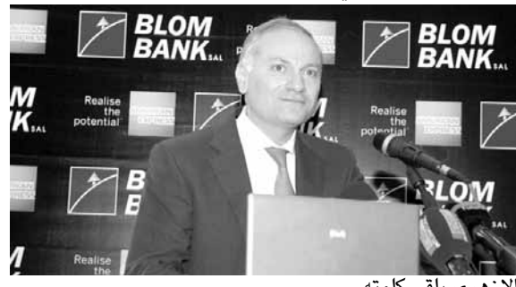
الأزهرى يلقى كلمته

أهم الشركات العالمية المتخصصة في بطاقات الائتمان وأنظمة الدفع». وأضاف أن «بنك لبنان والمهجر يسعى دائماً لتأمين أفضل المنتجات المصرفية والمالية التي تعتمد على أعلى معايير الجودة والسلامة والتطور الإلكتروني والتي يضعها في متناول الجمهور من كل أطراف المجتمع»، مؤكداً أن «هذا الأداء ينسحب وبامتياز على منتجات صيرفة التجزئة، حيث يحتل البنك المركز الأول بين البنوك اللبنانية على صعيد جميع منتجات التجزئة ومنها قروض السكن وقروض السيارات».