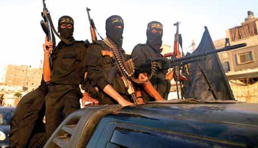
عرض عسكري للجهاد الاسلامي في غزة