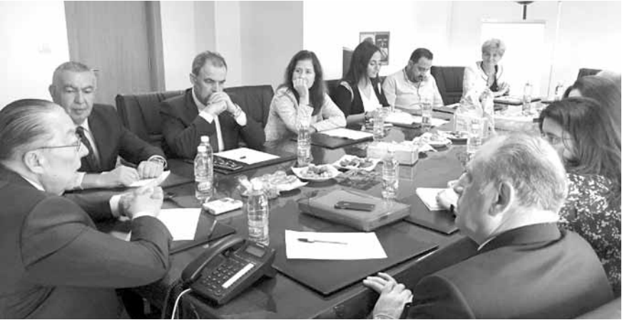
المشوق مترئساً الاجتماع

المنيع على المصّب بهذه الارقام الضخمة التي هي ١١٠٠ مليا مع اقرار القرض من البنك الدولي، يؤدي الى تنشيط عملي لهذه القضية وخصوصاً في المنطقة التي هي فوق بحيرة القرعون والتي تسبّب التلوث في حوض الليطاني، ونعتبر ما حصل هو انتقال من مرحلة التخطيط وخارطة الطريق وغيرها الى الحوض مباشرة في عمليات التفتيش، املين في استكمال المشاريع التي انطلقت أساساً من اجل تحقيق منظومة كاملة من الشبكات ومعامل التكرير والمعالجة للمياه المتدثرة لوقف الاضرار التي لحقت بهذه المنطقة وبنهر الليطاني، ونعتبر ما جرى إنجازاً تاريخياً متمين ان يعود هذا الشريان الحيوي على طول ١٧٠ كيلومتراً شرياناً للمياه العذبة النخيلية.