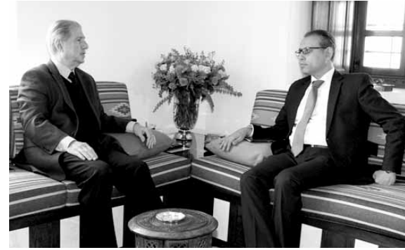
سفير مصر عند الجميل

شدد سفير مصر نزيه الجباري على ضرورة ان «تسعى القوى السياسية اللبنانية الى التوافق وان تمضي باليات لبنانية لانتخاب رئيس الجمهورية»، مشيراً الى ان «مصر عازمة على مساعدة اللبنانيين في تحقيق ما يتوافقون عليه في شكل متوازن يحقق مصالح جميع القوى السياسية والأطراف في لبنان، فلبنان والمنطقة لا يتقدمان الا بمتكاتف الجميع وهذا ما نأمل ان يكون عليه الحال في لبنان والمنطقة».