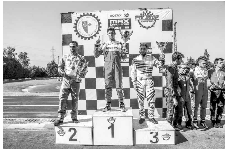
نتويج أبطال احدى الفئات