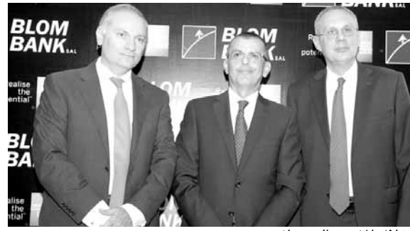
خلال المؤتمر الصحفي