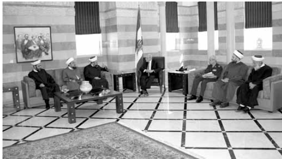
سلام مجتمعاً مع هيئة العلماء المسلمين

استقبل رئيس مجلس الوزراء تمام سلام قبل ظهر امس في السراي الكبير، وفداً من هيئة العلماء المسلمين برئاسة الشيخ سالم الراعي، وجرى خلال اللقاء بحث في الاوضاع والتطورات الراهنة.