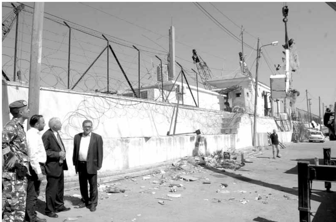
ازالة العوائق من مرفأ صيدا

ضمن حرم المرفأ واليوم نزله ونقوم بحملة تنظيف تمهيداً لبدء مشروع تأهيل المرفأ وتحويله للصيادين. وايضا سوق السمك لزمناه وقريبا المنتهد سيبدأ بتأهيله وسيليه لتزيم لاعادة تأهيل المرفأ من تنظيف الحوض وتأهيل الأرصفة