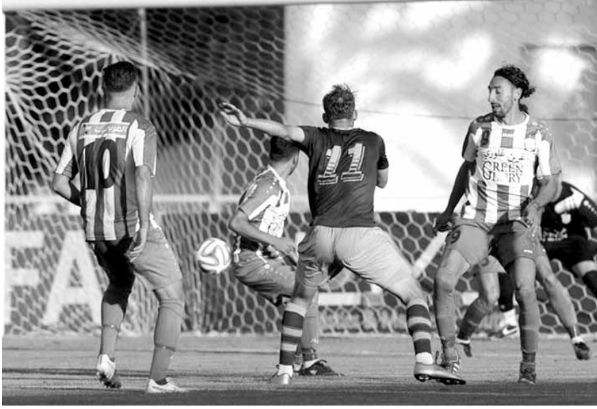
من إحدى مباريات النجمة والأصناف

ويستعد العهدة إلى فوزه الثاني عندما يستضيف الاجتماعي طرابلس على ملعب مدينة كميل شمعون الرياضية بعد غد الأحد علماً أن الوصيف يمتلك مباراة موجهة ضد شباب الساحل.