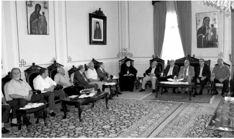
الوفد عند المرطان عودة

الذي هو ظالم للمستاجر وللمؤجر في آن معا والمجلس النيابي مطالب بإعادة النظر في هذا القانون من أجل أن يكون منصفاً للفئات الشعبية من المالكين ومن المستأجرين على حد سواء. أيضاً كان لا بد من الحديث عن نسبة البطالة المرتفعة التي تؤدي بالشباب إلى الهجرة من لبنان مما يؤثر سلباً على التكوين الديموغرافي لهذا البلد. تحركنا كلقاء نقابي موسع سيتخذ أشكالاً نضالية متغيرة، أو متجددة بغير بعض الشيء عما شهدنا في السابق من أساليب، لكن أهدافنا تبقى ثابتة بوجوب أن ينصف العامل وينصف كل صاحب دخل محدود في البلد وأن يشعر أبناء الطبقة الحاكمة بأنهم ليسوا وهدم في هذا البلد ولا يستطيعون الاستمرار في لعبة اقتسام الغنائم وتقسيم الشعب اللبناني على أسس مذهبية وطائفية».