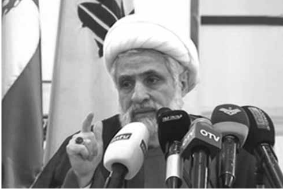
قاسم يلقي كلمته خلال حفل التخرج

أهداف إسرائيل هل هذه لعنة أو مكرمة؟! إذا كانوا هم مقتنعون بهذا العمل ويقومون به فحقن نوصفه، إذا كان لعنة لما قام به وذهبوا إلى إسرائيل. لماذا نتزعجون عندما نقول بأن السعودية تخدم أهداف إسرائيل، عندما يصافح مسؤولون سعوديون الإسرائيليين، وعندما يبنون اتفاقات مع إسرائيل، وعندما لا يدعمون المقاومة لا مالياً ولا سياسياً ولا في المواقع المختلفة، وعندما يقفون مع إسرائيل جنباً إلى جنب لتخريب سوريا واليمن والعراق والمنطقة، ماذا نقول؟ هل نقول ان السعودية رائدة الحل في المنطقة، لا نقول: السعودية خادمة المشروع الإسرائيلي. إذا كانت السعودية تفكر أنها تخرب سوريا لتزيح، وتخرب اليمن والعراق لتزيح، وفي اهمة، السعودية تستخدم من أمريكا وإسرائيل لتخرب المنطقة، وتخرب السعودية على رؤوس أصحابها وقياداتها، وأكد انه اذا اكملت السعودية على هذا المسار سيذكر التاريخ بأن السعودية كانت هنا، فهم سيرون نحو الهاوية بالطريقة التي يسلكونها.