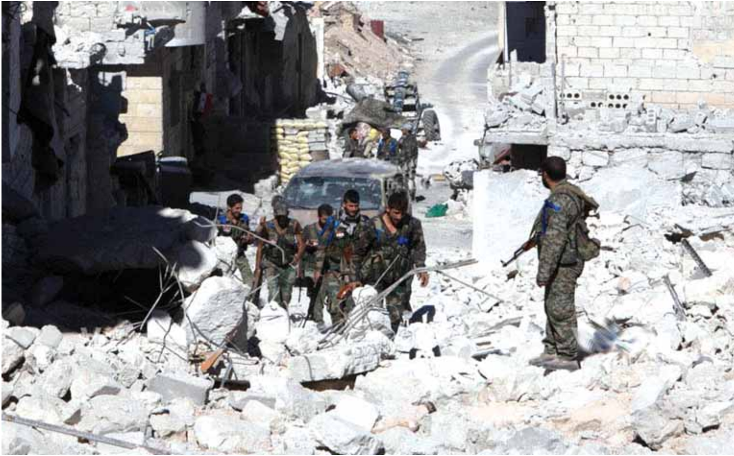
الجيش السوري في مخيم حنرات شرق حلب

العلاقات الاميركية - الروسية شهدت تدهوراً خطراً في الساعات الماضية وحملت اعلامية تجاوزت الاعراف الدبلوماسية مع كلام المتحدث الرسمي باسم وزارة الخارجية الاميركية الذي لوح بشن هجمات على مدن روسية قد يشنها اراهابيون سيستغلون فراغ السلطة في سوريا في حال استمرت الحرب الاهلية. الموقف الاميركي جده وزير الخارجية الاميركي جون كيري الذي اكد على ان واشنطن على وشك تطبيق المناقشات مع روسيا بشأن سوريا وقد نسعى لبدائل جديدة في حال لم تغير الاطراف الاخرى نهجها. هذا الكلام لقي ردود فعل عنيفة من عدد من المسؤولين الروس، لكن الرد الاعنف كان من قبل الناطق باسم وزارة الدفاع الروسية الذي قال: «إذا تعلق الامر بتهديد روسيا وحياة جنودنا في سوريا، فإن المسلحين لن يعثروا هناك حينها على الاكياس لوضع اشلائهم فيها، ولن يتسنى لهم الهروب من هناك. وفي ظل هذا السجسجال الكلامي العنيف تواصلت المعارك في حلب واحياؤها الشرقية، وواصل الجيش التقدم لتضييق الحصار على الارهابيين في الاحياء الشرقية واستعاد السيطرة على مخيم حنرات شمال حلب، وسط اشتباكات عنيفة مع تنظيم «جبهة النصرة». وهذه هي المرة الثانية التي يستعيد فيها