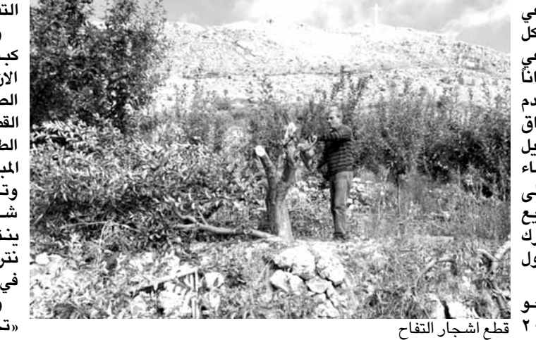
قطع أشجار التفاح

التفاح عبئا عليهم. وأكد المزارعون أن «ما يحصل كارثة كبيرة فنحن لم نستطع بيع التفاح حتى الآن ومن يريد أن يشتري يقترح علينا ثمن الصندوق ٤ آلاف ليرة. في حين أن تكلفة القطف مع إيصال الصندوق من الحقل إلى الطريق ٣ آلاف ليرة، هذا عدا عن ثمن المبيدات وثمان ممولد الكهرباء لرشها وتعبنا. وفضلنا قطعها لأنها لم تعد تنفع. شبعنا وعودنا من المسؤولين والتفاح لا ينتظر، حان وقت قطافه ولا يمكننا أن نتركه على الأشجار أو أن نقطفه ونضعه في الصناديق دون أخذه إلى البرادات».