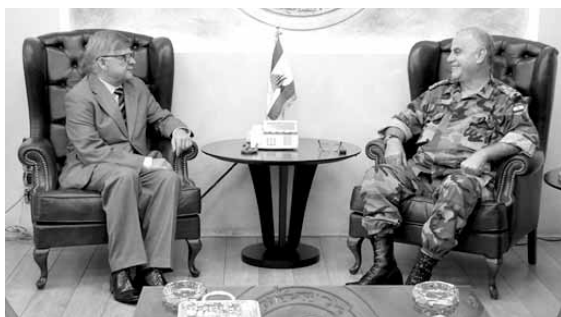
قهوجي مجتمعاً مع زاسبينكين

استقبل قائد الجيش العماد جان قهوجي في مكتبه في البرزة قبل ظهر امس، السفير الروسي الكسندر زاسبينكين يرافقه المحقق العسكري العقيد راتمير غاباسوف. وتناول البحث الاوضاع العاصمة في لبنان والمنطقة، والعلاقات الثنائية بين جيشي البلدين.