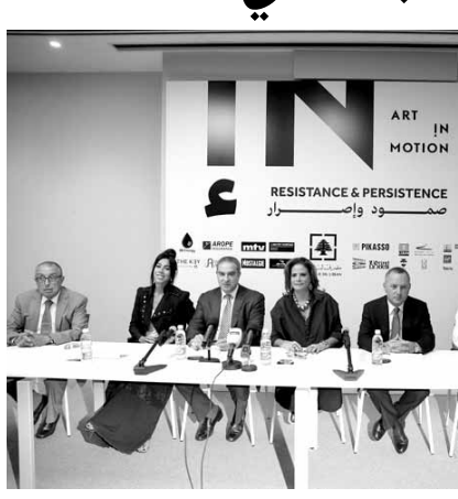
خلاف اعلان المعرض

أما فرعون فلاحظ أن الشهرين الأخيرين «كانا حافلين بحركة استثنائية وبالنشاط الثقافي والفني رغم الوضع السياسي غيرالمستقر». ووصف المعرض الذي سيقام في حديقة الصنائع بأنه «مشروع طموح ومهم ويستكمل عدداً من المشاريع الثقافية المهمة التي شهدناها الأسبوعان المنصرمان». وإذ لاحظ أيضاً أن «مشاريع فندقية ترى النور في بيروت»، رأى أن «هذه الحركة ستتمتع أكثر عند إذا تحققت استقرار سياسي وأمل في أن يكون المعرض «المحطة الأولى لجمعية Art in motion وأن يتكثف نشاطها