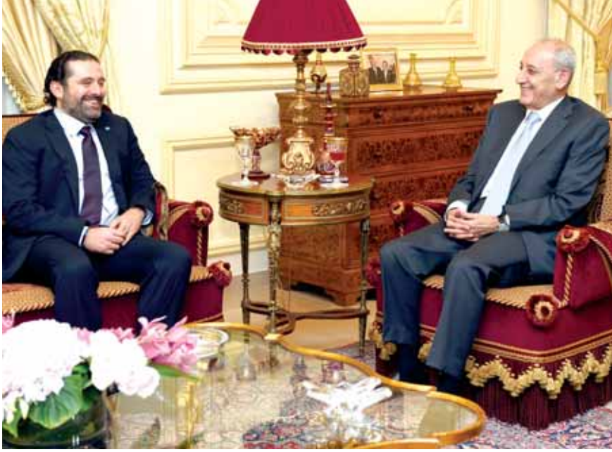
الرئيس بري مستقبلاً الرئيس الحريري

السياسية والبيان الوزاري وسلاح المقاومة والمحكمة الدولية وغيرها. وإذا شعر الرئيس بري أن في اتفاق عون - الحريري أي شائبة أو أي أمر لا ينطبق مع الثوابت الوطنية سيدخل لوقفها على الفور. حزب الله حذر أيضاً، ومن حقه رغم تأييده المطلق للعماد عون والثقة به، لكن هذه الثقة لا تنطبق على الرئيس سعد الحريري. وبالتالي فإن الرئيس بري وحزب الله يريدان كشف ما اتفق عليه جبران باسيل وندار الحريري وما إذا كان هناك «ستر مخفي» عبر صفقة ما. وعلى أساس كشف كل هذه الأمور عبر معادلة ٢=١+١، وفي ضوء كل هذه التفاصيل يتحدد الموقف النهائي. وبالتالي نحن نذهبون إلى معادلة بان يصبح الرئيس نبيه بري المفتاح (تتمة المانشيت ص ١٦)