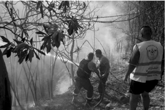
أخمد الحريق في كفرحتي في صيدا

تحقيق مباشر بالكارثة البيئية المذكورة، والإقتصاص من كل من يثبت تورطه». وطلب من الجهات المعنية وتحديد العميد حطار «تزويد مركز الشويفات في الدفاع المدني بسيارة إطفاء ثانية».