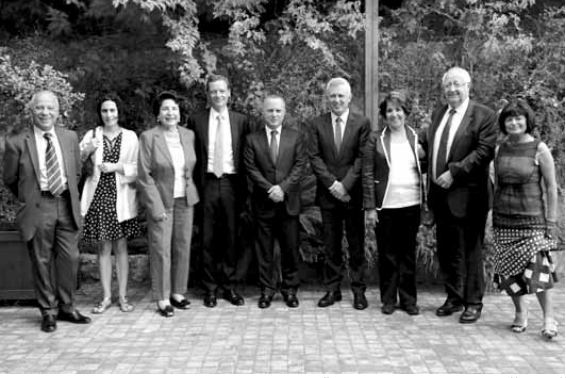
الوفد الفرنسي يزور فرنجة

لبنان ان يحتملها»، مؤكداً «تضامنه الانساني معهم».