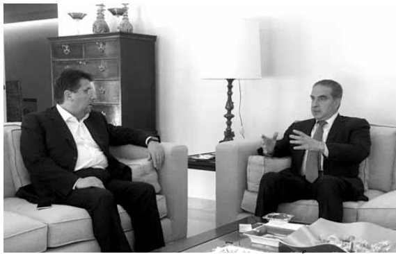
فرعون مستقبلاً كنعان

قال وزير السياحة ميشال فرعون، خلال لقائه اعضاء من المجلس البلدي لمدينة بيروت ومخاتير واهالي منطقة الاشرافية، «نحن مع اجسواء الحريرية والديموقراطية وتحرك المجتمع المدني واستمرار الامن المسوك الذي يتيح لنا التحرك في هذه الاجواء نحن لسنا مع اجسراء الانتخابات النيابية مجرد