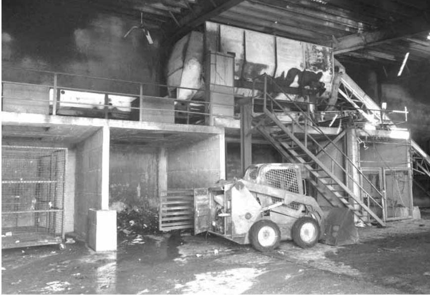
حريق معمل النفايات في بعليك

مكتب وزير الدولة لشؤون التنمية الإدارية، وزارة العدل، وزارة الداخلية والبلديات، محافظ بعليك وبلدية بعليك.