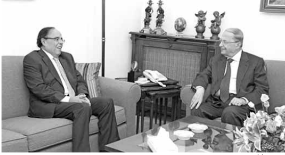
سفير المغرب عند عون

التقى رئيس كتل التغيير والإصلاح، النائب العماد ميشال عون في دارته في الرابية، سفير المغرب علي أواميل في زيارة وداعية بعد انتهاء مهامه الدبلوماسية في لبنان.