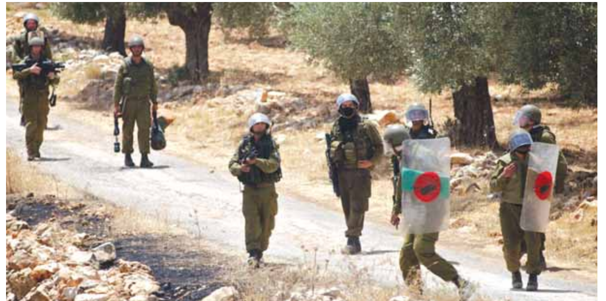
استفزاز لجيش الاحتلال

قالت صحيفة يديعوت احرونوت الإسرائيلية ان وفدا عسكرياً اردنياً من ١٢ جنرالاً متقاعداً زار اسرائيل سرا، والتقوا مع نظرائهم في جيش الاحتلال. وازدادت الصحيفة ان هؤلاء الجنرالات المقربين من الملك الاردني انهوا زيارة سرية اواخر الاسبوع الماضي، من دون