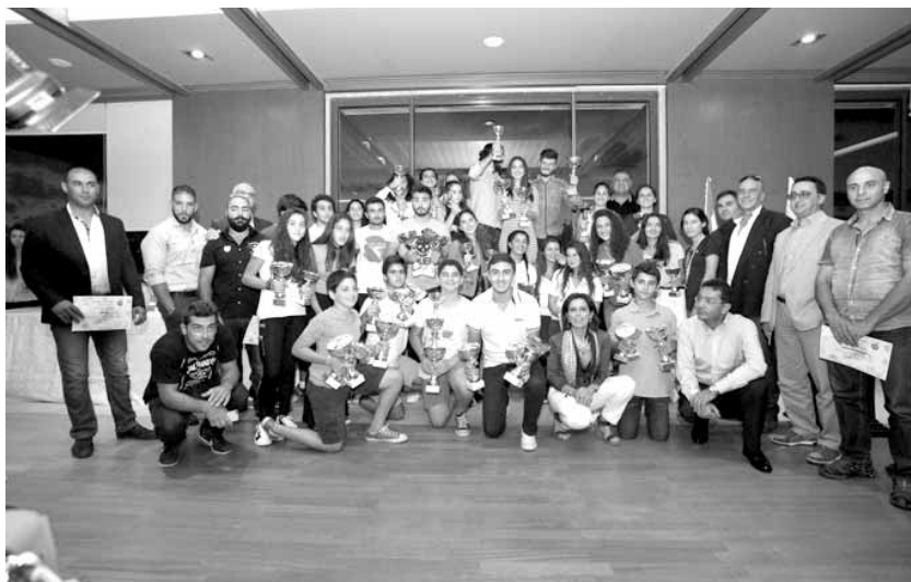
رئيس وأعضاء الاتحاد مع الإبطال والبطلات

ومن جهته وبعد خسارته في المرحلة الثانية أمام الوافد الجديد لايزينغ (صفر-١) في الدوري المحلي، انتفض فريق المدرب توماس توخل وحقق ثلاثة انتصارات متتالية إلى جانب فوزه على ليجيا وارسو، مسجلاً ٢٠ هدفاً في أربع مباريات.