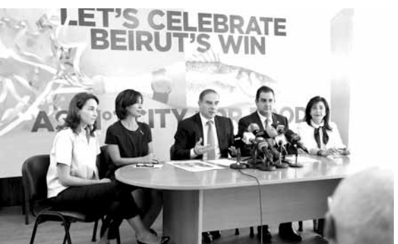
خلال المؤتمر الصحافي

تم القى الوزير فرعون، كلمة استهلها بشكر وسائل الاعلام على مواكبتها ونقابة اصحاب المطاعم والمقاهي ومؤسسة «هوسبيتاليتي» على تنظيم هذا الحدث واعطاء الصورة الحضارية للبنان وسياحته، خصوصاً بعد انتخاب لبنان كأول مقصد سياحي للطعام في لبنان، في ظل وجود مطابخ عالمية في باريس وروما وغيرها من الدول التي تتمتع بسمعة طيبة في هذا المجال، وقد استشفنا هذا الحدث مثل اي شخص آخر عبر الوسائل الاعلامية، وهذا يعني ان بيروت نالت هذا اللقب عن جدارة وتاريخ وتراث، وبالتالي مفروض علينا ان نؤرخ هذا الطعام ومصدره والذي هو مجموعة من الأطعمة البيزنطية والعربية والأوروبية وكيف تطوّر، وسنهت بهذا الموضوع لاننا نملك مشاريع كبيرة سنعلن عنها في القريب العاجل». وقال: «لقد استأهلنا هذا اللقب، وعلينا ان نحتفل به وان نبقي على مستواه، واعتقد ان نقابة اصحاب المطاعم ستعطينا نموذجاً في التعاون مع وزارة السياحة لتجميع بعض المناطق ونعكس بيروت كمقصد للطعام في العالم».