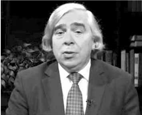
شكوى حكومته يوم الاثنين.

وقال صالحى في كلمته مستخدما الاسم الرسمي للاجتماع «التوقعات بشأن الرفع الشامل والسريع لجميع العقوبات كما هو منصوص عليه في خطة العمل الشاملة المشتركة لم يتم الوفاء بها بعد.