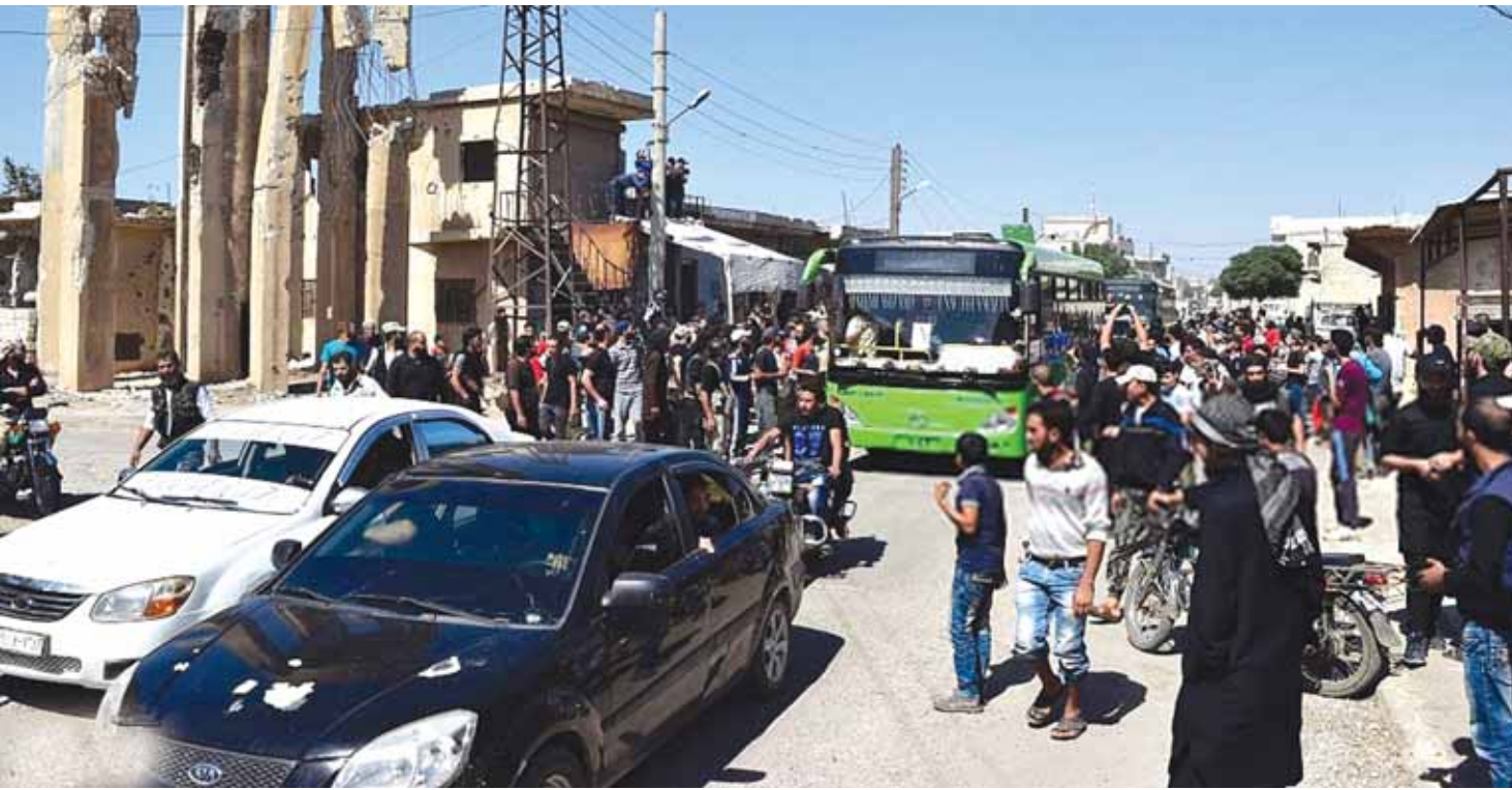
المسلحون يتجمعون للخروج من حي الوعر

العلاقة الروسية - الاميركية تشهد حالياً الكثير من التوتر والانتكاسة وعدم الثقة اذ ان قضية قصف الطائرات الاميركية لجنود سوريين في دير الزور الى جانب عدم فصل المعارضة المعتدلة عن الارهابيين عزز شكوك موسكو في ان واشنطن لا تريد ضرب جبهة النصرة ولا تريد اقصاء الارهابيين في سوريا في حين اعتبرت الولايات المتحدة ان روسيا اقدمت على جرائم حرب وذلك ما يجعل واشنطن شديدة التوجس حول التنسيق الامني مع موسكو.