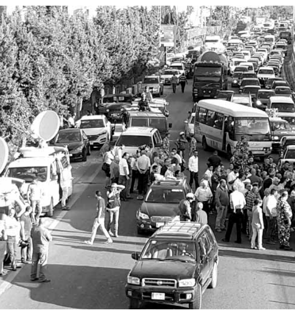
اعتصام المزارعين على اوتوستراد جبيل

الفنية المحددة في التشريعات النافذة. المادة الثانية: يقدم أصحاب العلاقة طلبات الإستيراد الى مكتب وزير الزراعة. المادة الثالثة: يلغى أي قرار يتعارض مضمونه مع مضمون هذا القرار. المادة الرابعة: يبلغ هذا القرار حيث يلزم ويعمل به فور نشره في الجريدة الرسمية.