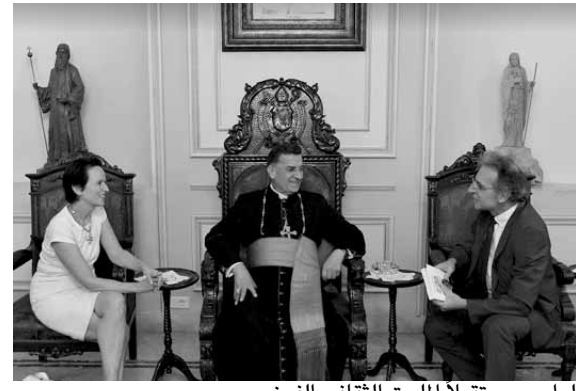
الراعي مستقبلاً الملحق الثقافي الفرنسي

ماورو، وكان عرض اللواضع العامة المحلية والإقليمية ولا سيما موضوع رئاسة الجمهورية والنزوح السوري.