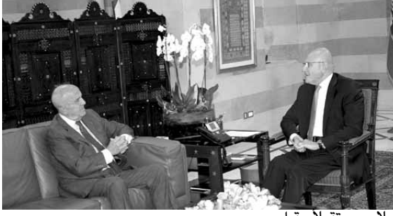
سلام مستقبلاً مقبل

استقبال رئيس مجلس الوزراء تمام سلام في السراي الحكومي، نائب رئيس مجلس الوزراء وزير الدفاع سمير مقبل، وجرى عرض للاوضاع والتطورات.