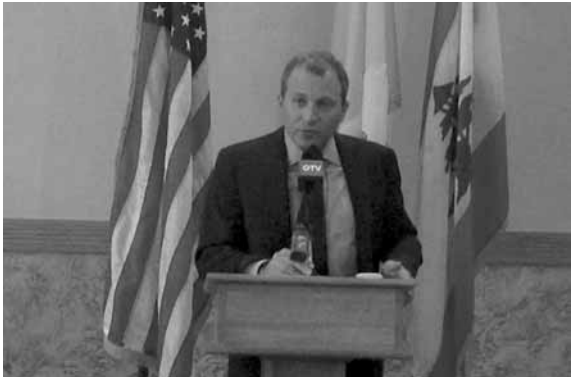
باسيل يلقي كلمته

أكد وزير الخارجية والمغتربين جبران باسيل من شيكاغو، «ان النفايات لها أشكال كثيرة، وثمة نفايات في العالم فكرية لا تلوثه فقط بل تثقل البشر، تلوث أذهان الناس فيقتلون على الهوية والانتماء. نحن اللبنانيين لدينا الجواب والتجربة لأننا نميز بين الخطأ والصواب، ولبنانيتنا بمفهومها الإنساني أبعد من الطوائف تجمع البشر على الخير وتبقيهم في الأرض ليتشاركوا فيها العيش، وتجمعهم في دولة يتشاركون فيها السياسة والحكم السليم».