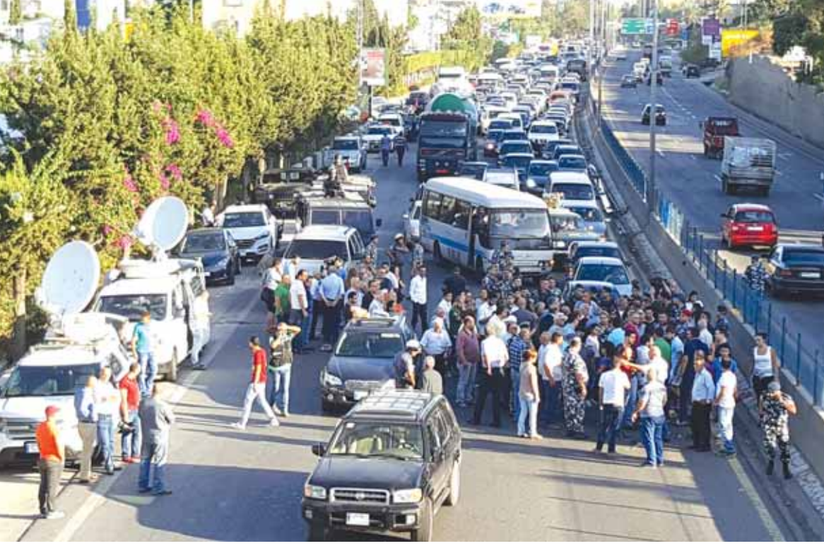
مزارعو التفاح يقطعون الطريق احتجاجاً على عدم تصريف الموسم