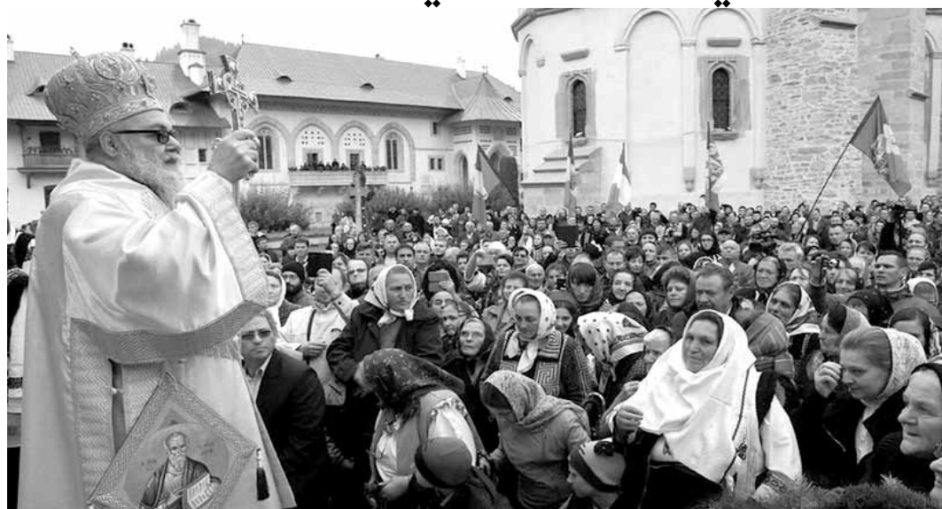
يوحنا العاشر خلال القداس مع المؤمنين

كغيرها ثمن الإرهاب والتكفير والخطف والتهجير واستباحة المقدسات والاديار. هنالك تهجير للمسيحيين ولغيرهم من الشرق الأوسط وهناك محاولة لوانه البشرية وقيمها في الأرض التي أطلقت الى الدنيا بشارة يسوع المسيح. هناك مطاردة تخطف كهنة ورهبان وشعب بهجر وقرى تستهدف لمجرد كونها من اللون الطائفي أو من غيرهِ. أما أن للعالم أن يستنق؟ لقد مضى على مطراني حلب يوحنا إبراهيم وبولس بازجي أكثر من ثلاث سنوات من الخطف الجائر. إن ما يجري في سوريا من إرهاب وتكفير أعمى لايمت للبشرية بصلة. إن ما يجري هو استرخاص للبشرية في سوق المصالح والسياسات. نحن شعب بابي الخروج من أرضه وبابى أيضا ان يعطى دروسا في الديمقراطية وحقوق الإنسان عندما تسخر تلك وتمتلي لفتك بالإنسانية وبامن الشعوب وسلامها. والمسيحية في الشرق لم تكن يوما دخلية عليه. هي من قلبه ومن كيانهِ. يكفيها إرهابا طالها وطل غيرها».