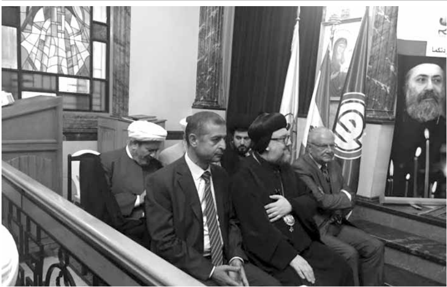
خلال الاحتفال في كاتدرائية مار بطرس وبولس في المصيبة

من جهتها، أكدت الرابطة «أنها ملتزمة قضايا مسيحيي الشرق، مهما ساءت الظروف وأدلهم الخطر. وأنها في لبنان تفتح أبوابها لكل المراجعات وستدافع كما دائماً عن حقنا بالبقاء والمواطنة والمساواة وضد التهجير والعنف والحقد والإغواء».