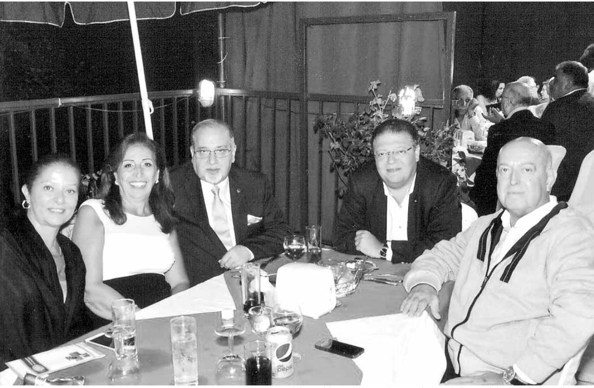
الحاكم السابق وجيه عكاري والدكتور ناجي رياشي واليون كلود زكا