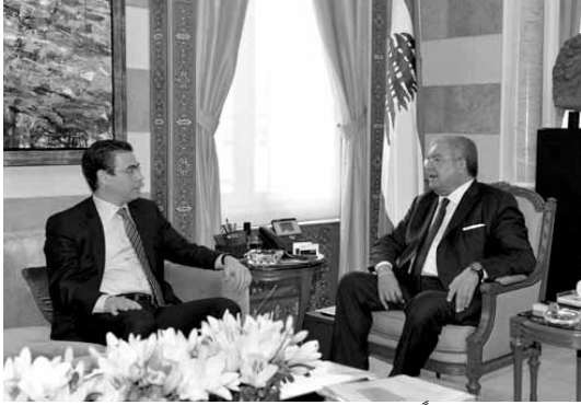
المشنوق مستقبلاً صنناوي

استقبل وزير الداخلية والبلديات نهاد المشنوق وزير الاتصالات السابق نقولا صنناوي، وعرض معه مستجدات الوضع.