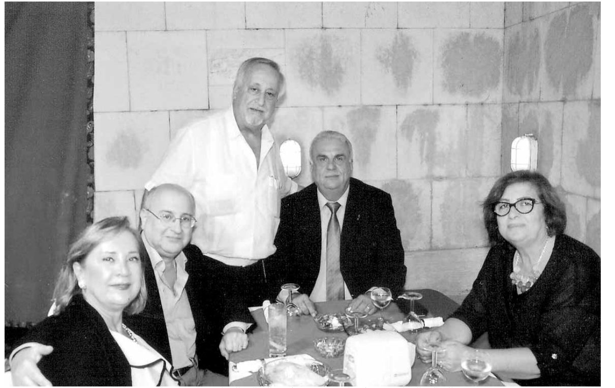
الحاكم المهندس جورج بو شديد والحاكم السابق ميشال قليموس وعقيلته والحاكم السابق غابي جبرائيل وعقيلته