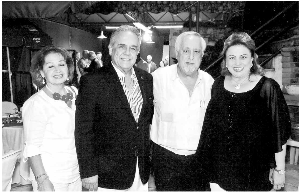
الحاكم السابق جورج بو شديد والحكمة السابقة مرسل سلامة والحاكم المير البير شهاب وعقيلته