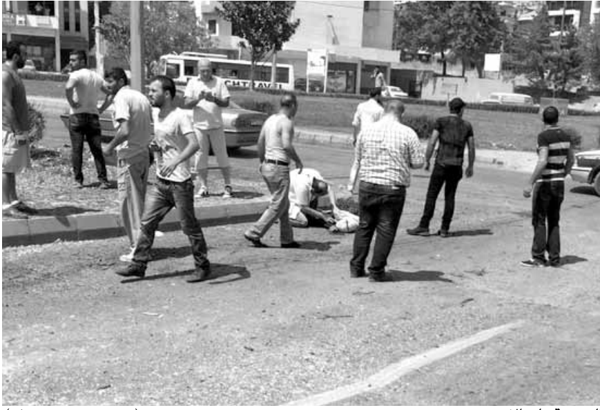
الضحية على الأرض