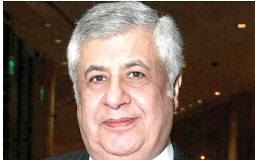
رجل الاعمال جيلبير الشاغوري

وزير الخارجية برئاسة كلينتون ومؤسسة كلينتون الخيرية التي عادت وبرزت تحت المهر من جديد خلال خوض كلينتون السباق الرئاسي.