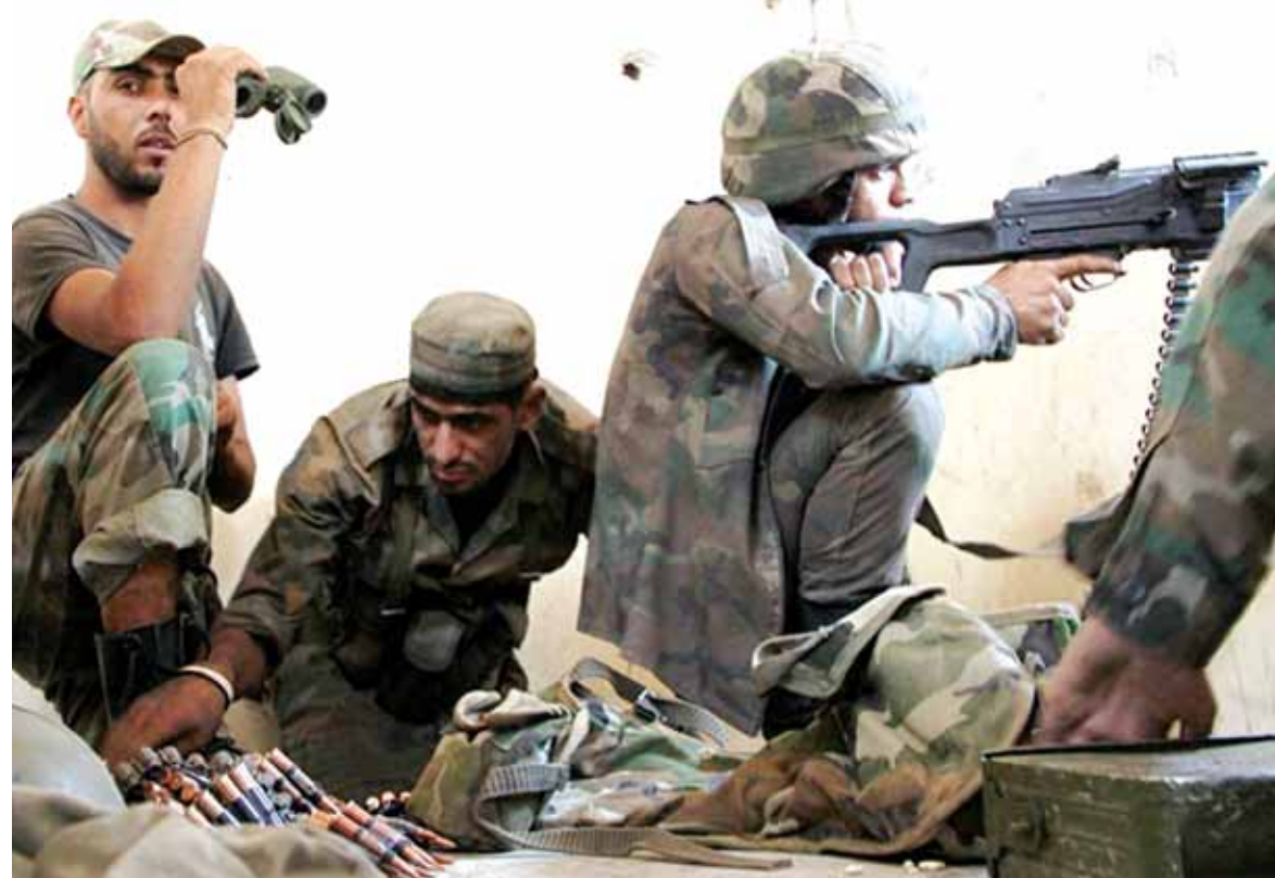
الجيش السوري في ريف حماة

الجهات السورية على سخونتها المتهبة في محافظة حلب وتوسعت دائرتها لتشمل محافظة حماة مع هجوم واسع للمسلحين على مواقع الجيش السوري في عدة بلدات في محافظة حماة، وقد حقق المسلحون تقدماً بالسيطرة على عدة بلدات تبعد عن مدينة حماة مسافة ١٣ كلم. السخونة العسكرية في محافظة حماة، لم تمنع الجهود والاتصالات لعقد معالجات واخراج المسلحين من عدد من المدن في ريف دمشق، حيث تتركز الاتصالات على حي الوعر في حمص والمعضمية في ريف دمشق الذي سيتم اخلاؤها من المسلحين خلال ٤٨ ساعة. العمليات العسكرية تجري وسط فشل الاتصالات السياسية بين واشنطن وموسكو لتحقيق هدنة في حلب لمدة ٤٨ ساعة، واعلنت الرئاسة التركية أنها لن توقع أي اتفاق لوقف إطلاق النار مع المقاتلين الأكراد في شمال سوريا. وان العملية العسكرية متواصلة ولا هوادة في المعركة ضد حزب العمال الكردستاني الكردي.