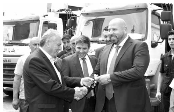
نهر يسلم المفاتيح لرؤساء البلديات

المعنين، الدولة والبلديات، لان هذه المشكلة أصبحت لا تحتمل..