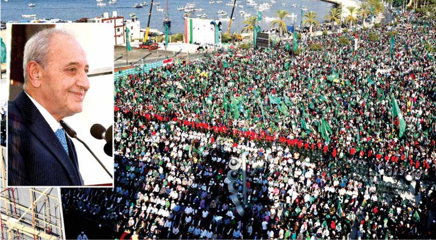
حضور مهرجان تعقيب الامام الصدر في صور وفي الكادر الرئيس بري