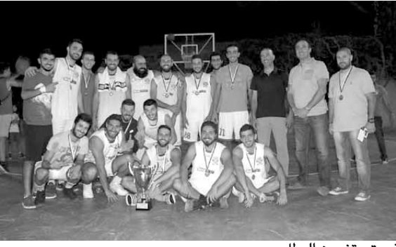
فريق بتغرين البطل

في ختام حاشد ومثير، احرز فريق بتغرين لقب «كأس تحدي الضيع» في كرة السلة التي نظمتها بلدية بيت مري على ملعب الفرير بالتعاون مع شركة «سپورتنس مينيا» Sports mania.