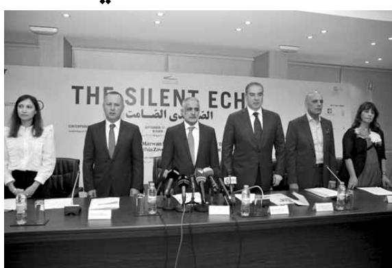
المشاركون في المؤتمر الصحفي

لغنائين عالميين من الصين والولايات المتحدة وفرنسا ومن لبنان. واختيار بعلبك الأثرية مكاناً لأعمال فنية معاصرة تأكيد على أن مسار الحياة خط متواصل يبدأ من بدء التكوين وصولاً الى أن نهايات الجنس البشري، وتأكيد على أن الإبداع الإنساني تكامل حضاري بين شعوب الأرض، لا يفرق في الأزمنة والحدود الجغرافية والجنس والاديان».