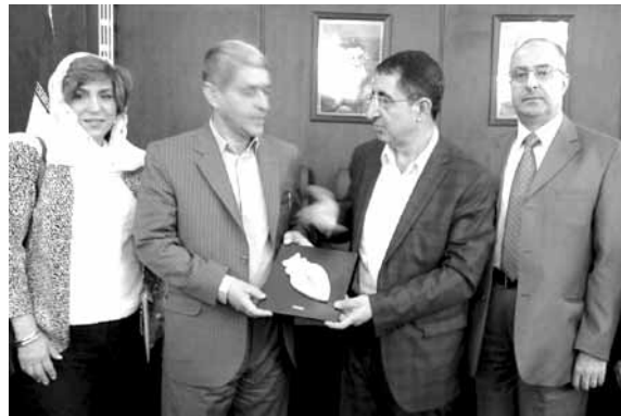
الوزير حسين الحاج حسن في إيران

«التجارة بفتح ربط القلوب بين ابناء الشعوب وتوفير الأرضية المنيئة لتعزيز التعاون»، وعرض الحاج حسن الصورة النفطية في لبنان بعد اكتشاف احتياطات كبيرة من النفط والغاز في المنطقة الاقتصادية الخاصة للبنان والتحضيرات التي يقوم بها لبنان على صعيد الاستثمار النفطي، شارحاً الإطار القانوني الذي يقوم على مبدأ اعتماد إما شركات مشغلة أو ما يعرف عنه بالشركات لاصحاب الحقوق.