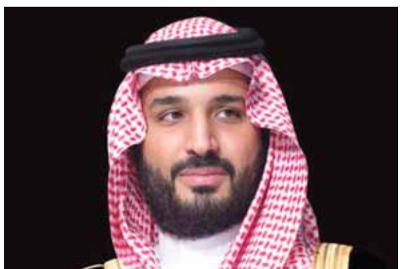
محمد بن سلمان

قبل ساعات من توجهه إلى الولايات المتحدة الأميركية، قال ولي العهد السعودي محمد بن سلمان إنه إذا عاش لخمسین عاماً فالمتوقع أن يحكم البلاد، وأضاف «ولن يوقفني شيء إلا الموت»، متعهداً بالقضاء الكامل على «ما تبقى» من فكر جماعة الإخوان المسلمين. المقابلة التي سجلتها شبكة سي إن بي إس نيوز الأميركية في وقت سابق، وبنت قبل لقاء بن سلمان بالرئيس الأميركي بيوم واحد، يبدو أنها تحمل رسائل