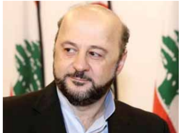
التفاصيل ص ٥