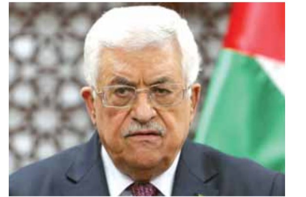
الرئيس محمود عباس

أكد الرئيس الفلسطيني، محمود عباس، أمس الإثنين، أنه يحمل حركة حماس مسؤولية تفجير موكب رئيس الحكومة الفلسطينية، رامي الحمد لله. واتهم عباس، في كلمة أمام القيادة الفلسطينية، مقر الرئاسة الفلسطينية، حماس بالتورط في محاولة اغتيال رئيس