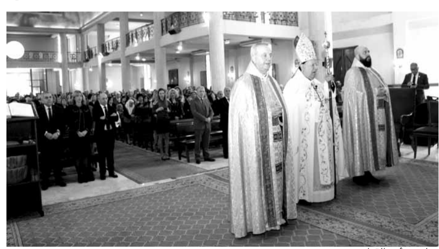
مطر يترأس القداس

التسمية، بل الناس أعطوه إياها. «بي الكل» يحب الجميع وينصف الجميع ولكن محبة لبنان وكرامته وقيمه. نصلي من أجل الرئيس عون وهو ابن هذه الرعية المباركة، رعية مار يوسف، ليلهمه الله ليكون أباً صالحاً للبنانيين». وقال: «العائلات تمر اليوم في ظروف صعبة، بخاصة في الغرب، يفقدون هناك روح العائلة. وإذا ضربت العائلة، ضرب المجتمع أيضاً، بصورة أكيدة. نصلي على نية العائلات لتتصدد في وجه الأعاصير. يجب أن يضحى الآباء والأمهات في سبيل أولادهم. لا يجب أن يترك الأولاد بسبب مزاجات غير معروفة المصدر ولا العواقب. العائلات بحاجة إلى اقتصاد منيع، ليتأمن لأولاد المدرسة والبيت والمستقبل والغذاء والصحة. الدولة مسؤولة عن كل هذا حتى تكون العائلات في مأمن. عندنا اليوم أزمات في المدارس والتعليم. الدولة مسؤولة عن حل هذه الأزمات. عندنا أزمات في الاقتصاد ندعو المسؤولين لحل هذه الأزمات، وهذا الحل لا يتحقق إلا إذا توحدنا وتضامنا بروح العائلة والمحبة للجميع. مار يوسف اليوم، يعطينا أمثلة، نحن جميعاً، بالخدمة الصالحة والخدمة الصامتة، بالمحبة لله وليسوف والمسيح ومريم، من دون حساب ولا حدود. هذه هي المحبة التي يجب أن تحمي العلاقات فيما بيننا».