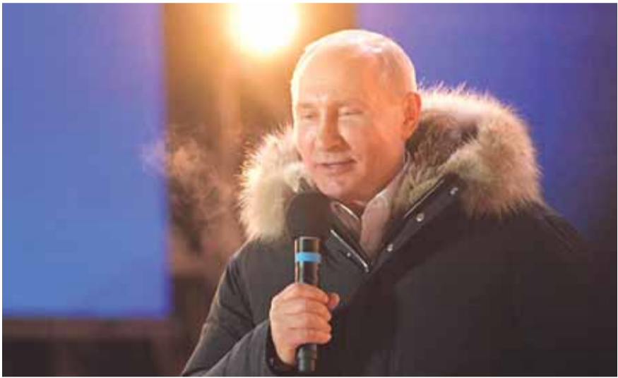
بوتين يلقي كلمته بعد فوزه

حصد الرئيس الروسي فلاديمير بوتين نتيجة مطلقة في الانتخابات الرئاسية الروسية وهكذا يصبح بوتين رئيساً من جديد لجمهورية روسيا الاتحادية لولاية رئاسية لمدة ٦ سنوات. وقد اشتعلت موسكو والمدن الروسية بالاسهم النارية واطلاق الاضواء سواء في المنازل او الشرفات او على الطرق وسارت الاف السيارات لابل مئات الاف السيارات في كل روسيا وهي ترحب بانتخاب بوتين رئيساً لروسيا الذي كان يبدو بعافية جيدة وبصحة ممتازة وبدا كان عمره اربعون عاماً، فيما اشارت الرياضة العنيفة التي يقوم بها كل يوم ظهرت على جسده بقوة وفاعلية وهو يتجول بينت الناخبين ومراكز الاقتراع وكان يضحك دائماً وعندما تم الاعلان عن النتيجة واجتيازه الهـ ٧ بالمئة من عدد الناخبين والذي قد يصل الى ٩٠ بالمئة فقد فرح جدا وعندما هجم نحوه روسي لتقبيله منعهم الحرس من الاقتراب منه واعطى الاوامر ان لا يقترب منه احد بل يبقوا على مسافة ١٠ امتار.