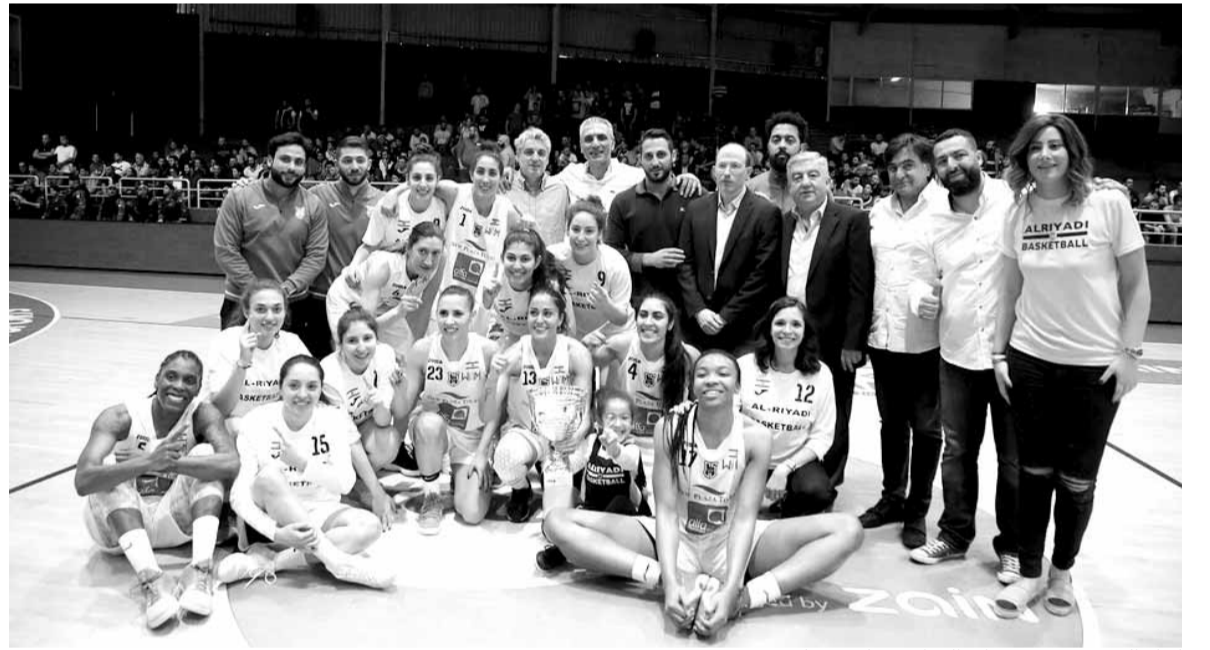
كبار الحضور مع سيدات الرياضي (بيروت) بعد تتويجهن

احتفظت سيدات نادي الرياضي (بيروت) بلقب مسابقة كأس لبنان في كرة السلة لعام ٢٠١٨ بعد فوزهن في المباراة النهائية على سيدات نادي انترانيك (بيروت) ونتيجة (٦٨-٦٤) بفارق اربع نقاط في اللقاء الذي اقيم على ملعب نادي غزير أمس الأحد. وجاءت نتيجة الأرباع كالآتي: (٢١-١٢) (٣٧-٣) (٥٤-٥٤) (٦٨-٦٤). وجاءت المباراة متكافئة وتقاربت النقاط منذ بداية اللقاء حتى نجحت لاعبات فريق الرياضي في حسم اللقاء في الدقائق الأخيرة من المباراة.