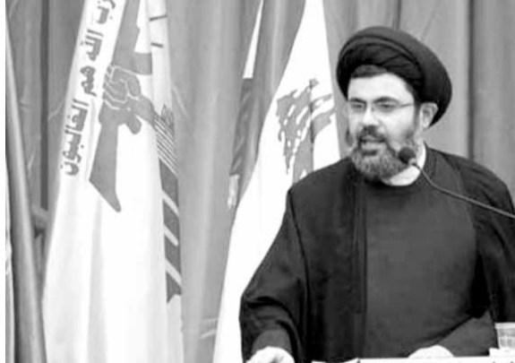
صفي الدين يلقي كلمته من حسينية بلدة دير قانون النهر الجنوبية

قابل الإصلاح بشكل جذري، وبالتالي من يعتقد أن بإمكانه أن يحدث تغييرا جذريا للتخلص من الفساد المستشري في لبنان، فهو مخطي، ومن يعد الناس بذلك، فإنه يعدمهم بما لا يقدر عليه ما دام أن هناك نظاما لبنانيا طائفا يقوم على المحاصصة وإنتاج زعامات فاسدة، تشرع الفساد وتصر عليه دائما، ولذا ينبغي أن نطرح اها بفا موضوعية، وننتحدث مع الناس بكل صراحة».