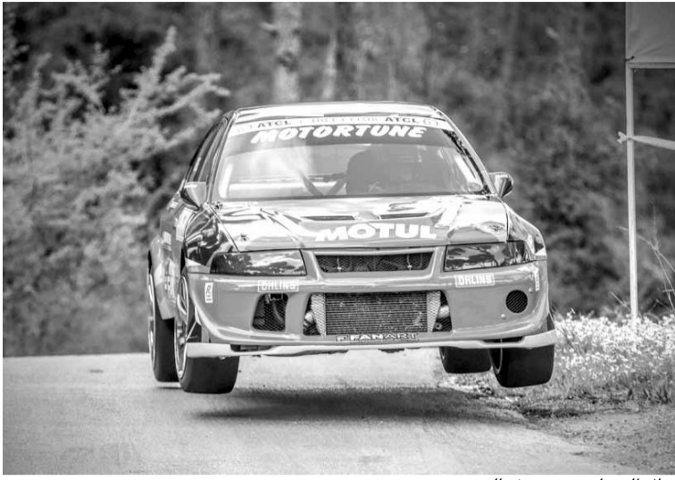
بطل السباق روجيه فغالي