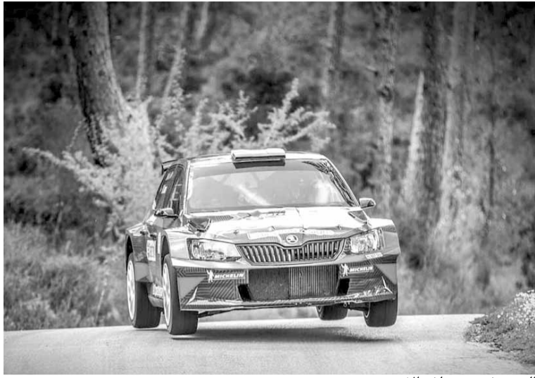
الوصيف رودولف الاسمر