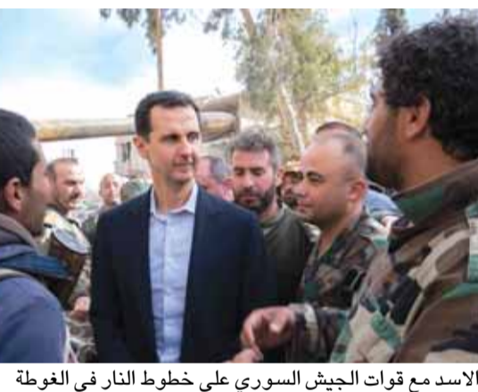
زار الرئيس السوري بشار الأسد، أمس، عددا من قوات الجيش السوري على خطوط النار في الغوطة الشرقية، بريف دمشق. وذكرت وكالة الأنباء السورية «سانا»، نقلا عن الحساب الرسمي للرئاسة السورية على موقع «تلغرام»، أن الرئيس الأسد زار خطوط النار في الغوطة الشرقية.