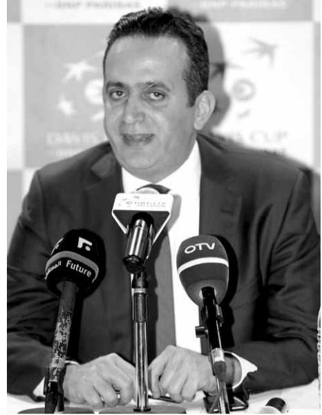
رئيس اتحاد التنس أوليفر فيصل