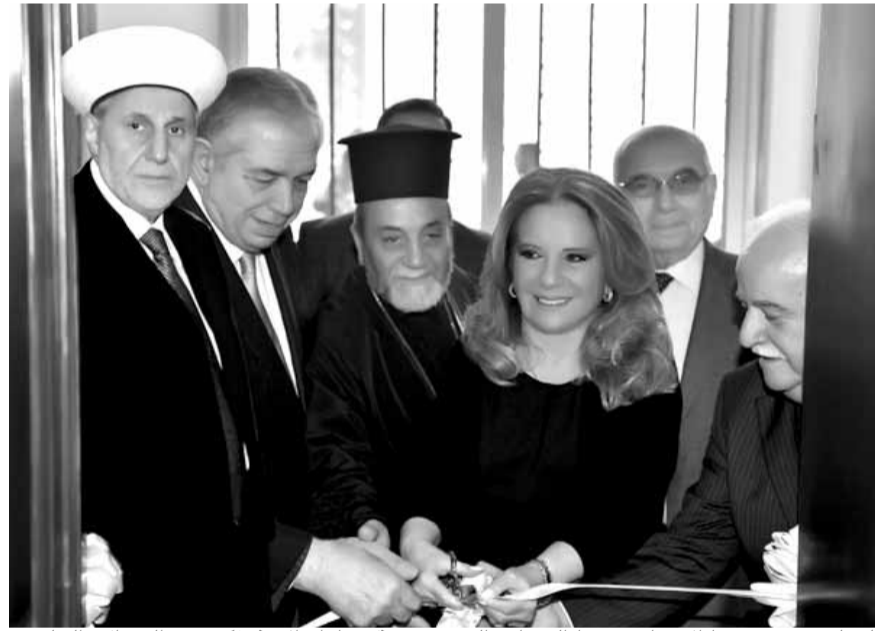
الصلح تقص شريط الافتتاح ومعها الشعار والجسر وممثل مطران الأرثوذكس في الشمال والحلوة

الشعار والوزير السابق سمير الجسر وممثلين عن الفعاليات السياسية والدينية والأمنية وعدد كبير من فعاليات المنطقة.