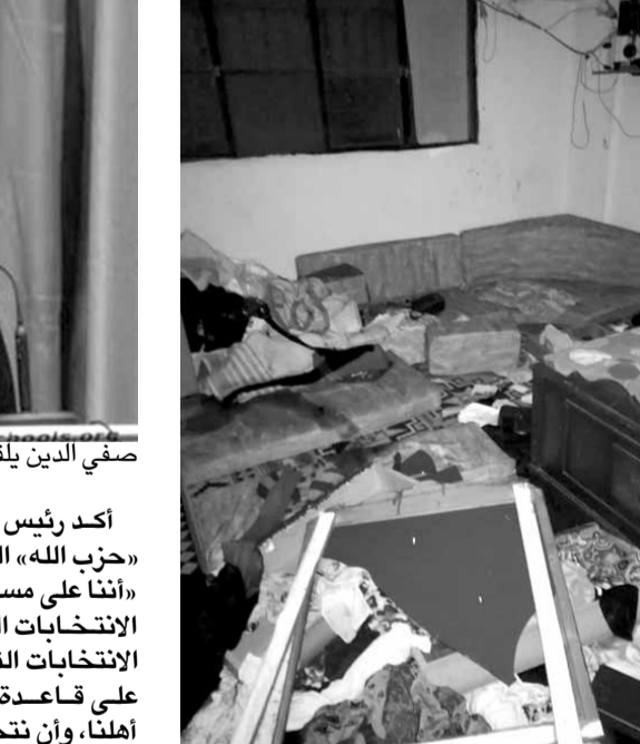
الغرفة التي وجدت فيها القتيلة وطفلتها