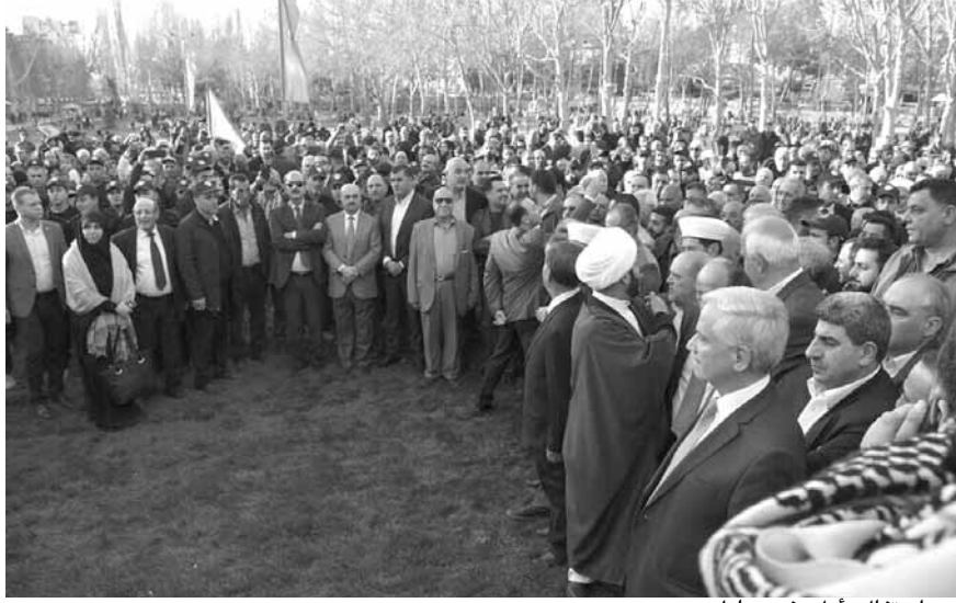
من احتفال «أمل» في بعلبك

وقال: «ها هي المقاومة يا سيدي تقف بالمرصاد للعدو الاسرائيلي، وها هي اسرائيل تخسر استراتيجيتها الحربية، وها نحن يا سيدي في المقاومة وفي التنمية والتحرير نحمل السلاح بيد والمنجل باليد