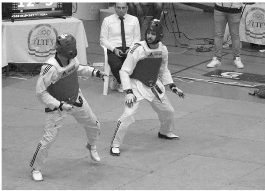
لقطة من احد اللقاءات