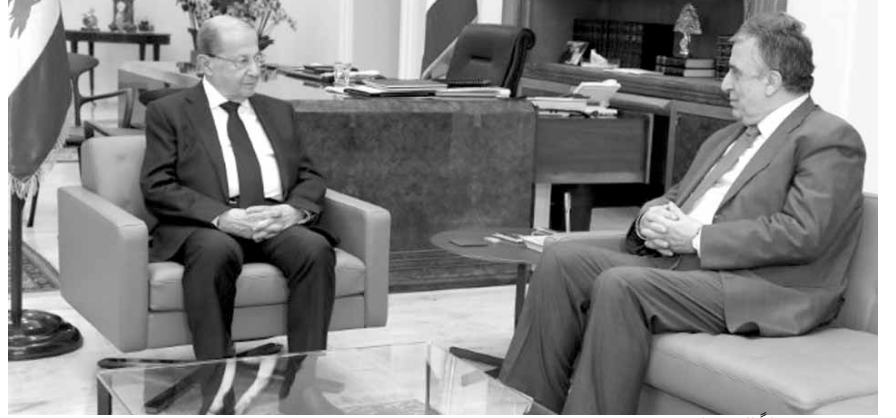
عون مستقبلاً البستاني

استقبل رئيس الجمهورية العماد ميشال عون الوزير السابق ناجي البستاني، وعرض معه الأوضاع العامة في البلاد. كما جرت جولة أفق حول كافة الملفات