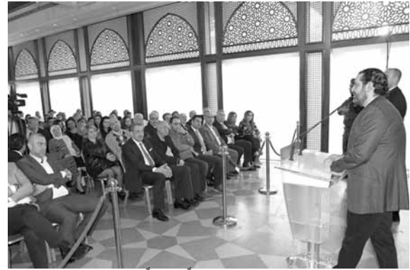
الحريري يلقي كلمته خلال لقائه وفداً شعبياً

أكد رئيس مجلس الوزراء سعد الحريري «أن هدف مؤتمر روما، دعم وتقوية الجيش اللبناني والقوى الأمنية كافة، وهذا من شأنه تعزيز سلطة الدولة كلها وتأمين الاستقرار في كل لبنان، لأن الدولة تبقى هي المظلة والضامنة لأمن جميع اللبنانيين من دون استثناء». كلام الحريري جاء خلال استقباله بعد ظهر أمس في بيت الوسط، وفداً شعبياً من مناطق بيروتية. وقال: «المشاكل التي نواجهها عديدة، وتعمل على حلها بالحوار مع سائر الأطراف السياسيين. وكما تعلمون عندما تسلمت مهام رئاسة الحكومة، كانت معظم المؤسسات معطلة أو لاتعمل جراء الفراغ الرئاسي الذي عاشه لبنان، والآن كما تلاحظون عادت هذه المؤسسات للعمل بوتيرة أفضل من السابق». ومساءً، قال الحريري خلال افتتاحه مهرجان «شمس الربيع» الذي نظمته جمعية تجار بربر في شارع بربر، انه: «علينا أن نحمي هذا البلد