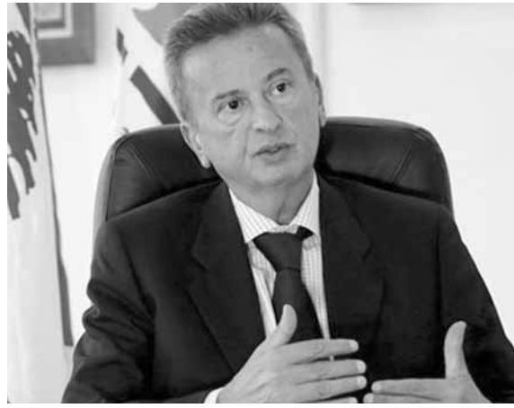
حاكم المركزي رياض سلامة

قال حاكم مصرف لبنان المركزي رياض سلامة إن انتقادات صندوق النقد الدولي للمالية العامة في لبنان صحيحة، لكن مشروع ميزانية البلاد للعام ٢٠١٨ يرسل إشارة جيدة لأنه يسعى لخفض واحدة من أعلى نسب الدين إلى الناتج المحلي الإجمالي في العالم من مستويات فوق ١٥٠ في المئة.