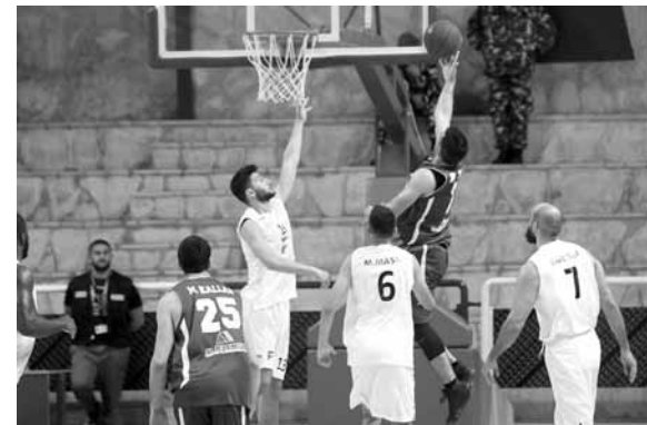
صراع تحت السلة في لقاء الأنطوني بعيدا واللوية

و(١٣) و(١٩-١٩) و(١٧-١١) و(٢١-١٤). وهذا الفوز التاسع للأنطوني مقابل ١٥ خسارة في المركز الثاني، بينما خسّر اللوية للمرة ١٦ مقابل ٨ انتصارات في المركز الرابع.