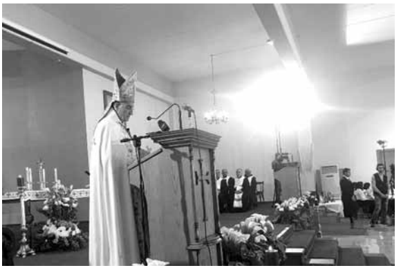
الراعي يترأس القداس

خاصة، يختارها لهم أهلهم بحكم حرية التعليم والاختيار، وفقاً للدستور. فإننا نجدد معكم النداء والتحفيز إلى رئيس الجمهورية والحكومة والمجلس النيابي، في هذا الوقت الذي تناقش فيه الموازنة العامة، وتعقد المؤتمرات الدولية، مشكورة، لدعم لبنان على التوالي في روما للجيش والقوى الأمنية وفي باريس للإلتزام الاقتصادي، وفي بلجيكا لسد حاجات النازحين السوريين».