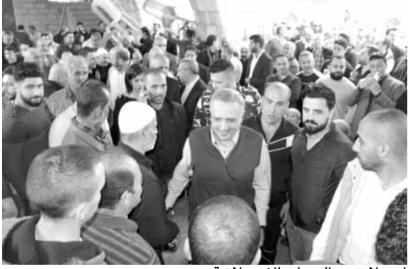
أرسلان من السراي الارسلانية

اللقبي رئيس الحزب «الديمقراطي اللبناني» وزير المهجرين طلال أرسلان، في السراي الأرسلانية في الشويفات، وفوداً رسمية ومناطقية، راجعته في قضايا إنمائية وخدمانية، تقدمها مشايخ من مختلف المناطق، قادة أمنيين، رؤساء بلديات ومختارين وحشد من الحزبيين والمناصرين.