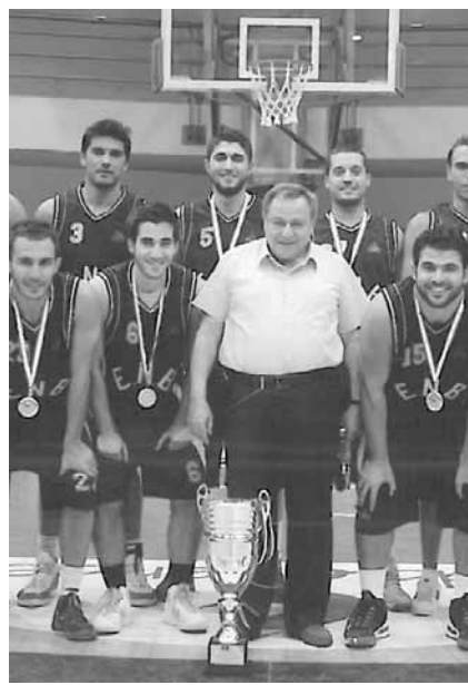
رئيس نادي أبناء نبتون الدكتور فريجة مع لقب جديد