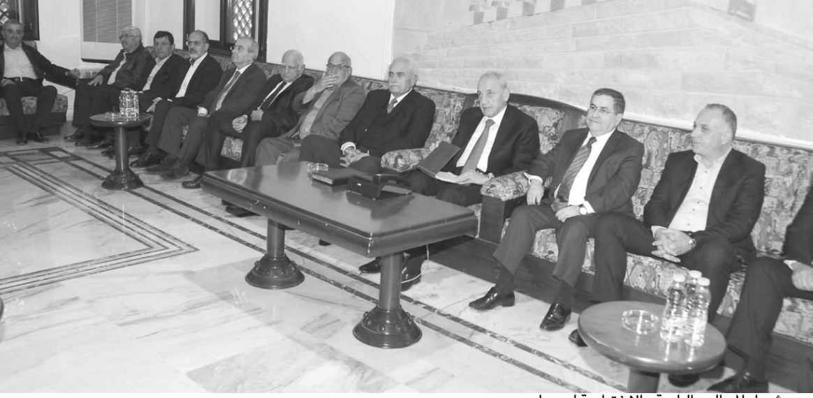
... ورؤساء المجالس البلدية والاختيارية لصيدا

الأخرى، نبني المجتمع المقاوم لحفظ الكرامة وصيانة الوطن»، مضيفاً «ها هي «أمل» حركتك كما وصفناها حركة وطنية صامدة بايمانها بالله وبلبنان انها حركة لصيانة الوطن وللقيام بالدور الذي يجب أن تقوم به في هذه الأمة. ها هي قلعة بعلبك الصامدة العصبية على المؤامرات، بعلبك الحاضرة دائماً لتكليب النداء، وها هم أبناء بعلبك كما عهدتهم وكما وصفتهم مخلصون للقيم والمبادئ وللقسم، هم خزان المقاومة وهم عرينها».