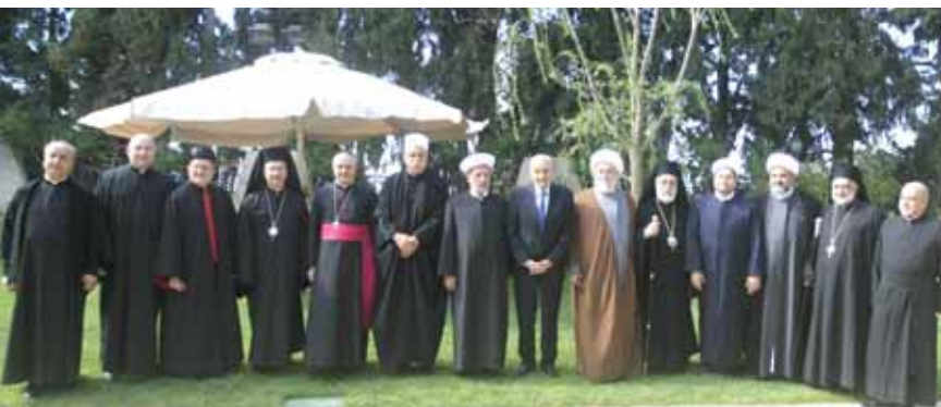
بري مع رؤساء الطوائف الروحية