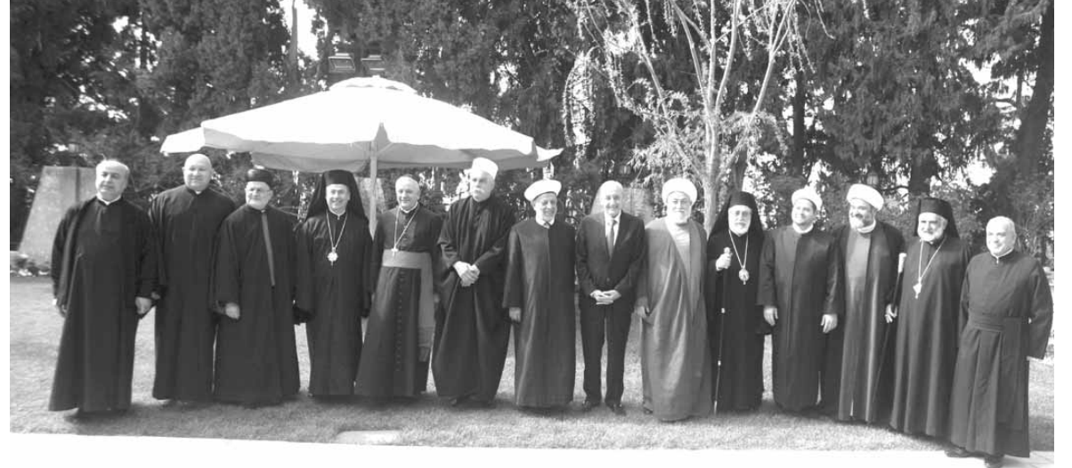
الرئيس بري ورؤساء الطوائف