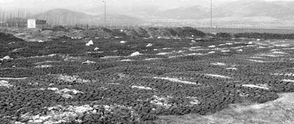
أضرار التلوث حول محطة إيعات