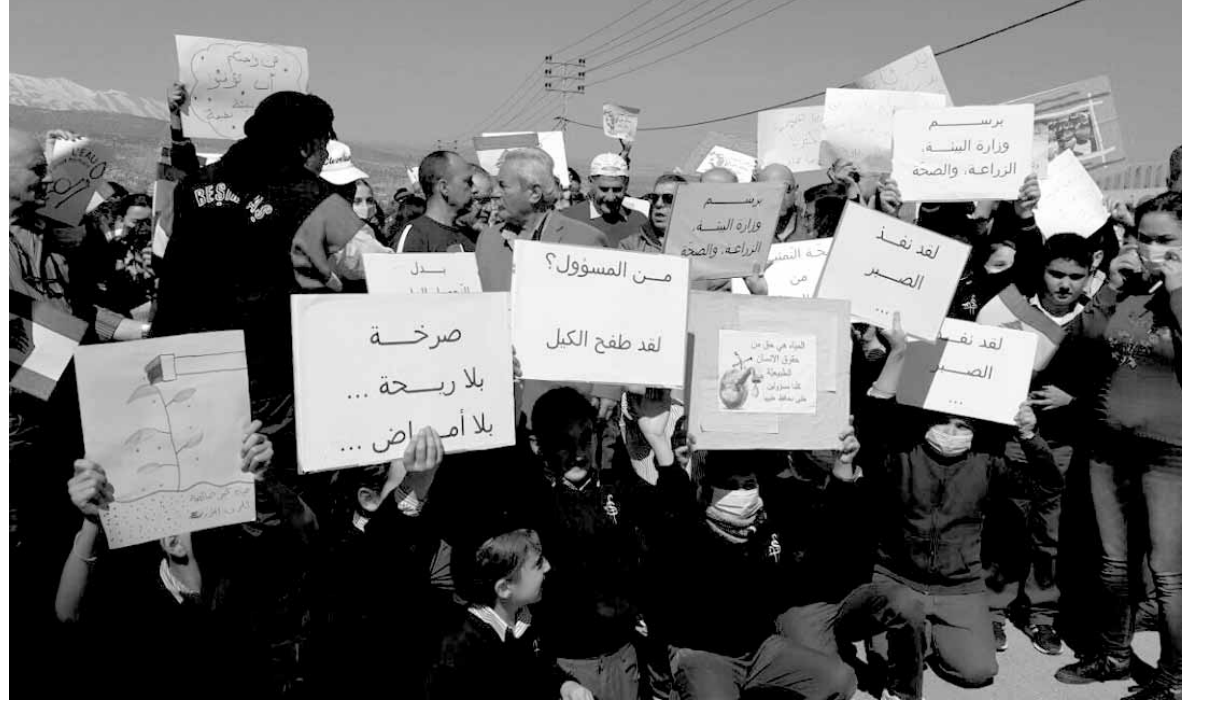
الاهالي والتلاميذ يرفعون شعارات منددة

المهندس المسؤول عن محطة التكرير المنهكم بالفحوصات داخل المختبر لمدخلات المياه المبتذلة ومخرجاتها قال ان البعض يعمد الى تحطيم الريغافرات وشطف المياه قبل وصولها الى المحطة اما بالنسبة للروائح والمياه المبتذلة فهي بسبب تجميع وركود المياه