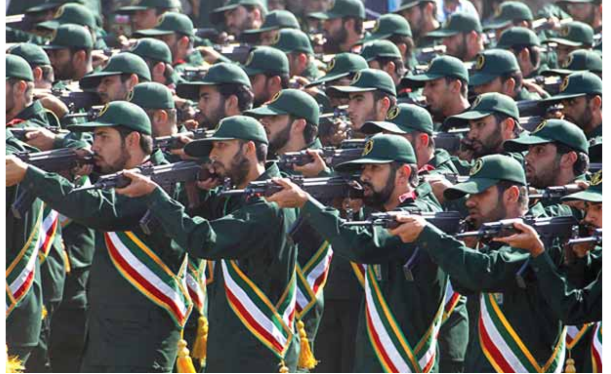
الحرس الثوري الإيراني

ولذلك فإن الجيش الروسي الموجود في القاعدة البحرية وعده ٣٢ الفاً، منهم ١٥ الف جندي مقاتل كذلك وجود ٢٠ الف جندي روسي في دمشق مع قاعدتين جويتين واحدة على الساحل وواحدة قرب العاصمة يعني ان الاتفاق السري الفعلي هو التزام من الرئيس الروسي بوتين تجاه الرئيس بشار الاسد في الحفاظ عليه في رئاسة سوريا والدفاع عن النظام السوري. وهكذا بعد ٧ سنوات من الحرب في سوريا كان هدفها اسقاط نظام الرئيس بشار الاسد انتهت الامور الى اتفاق بين احدي اكبر دول العالم روسيا التي هي في حجم القوة الاميركية وبين الرئيس السوري بشار الاسد حيث تضمنت روسيا بقاء النظام السوري كما يرأسه الرئيس بشار الاسد، وبقاء الرئيس بشار الاسد رئيساً لسوريا ومنع اي دولة من الهجوم على سوريا ومنع حصول انقلاب في سوريا ضد الرئيس بشار الاسد.