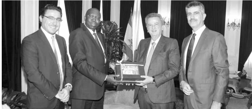
سلامة مع الوفد