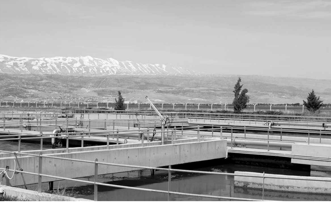
محطة تكرير إيعات

المعلمات والاساتذة يشكون من الامراض جراء الروائح المنبعثة.