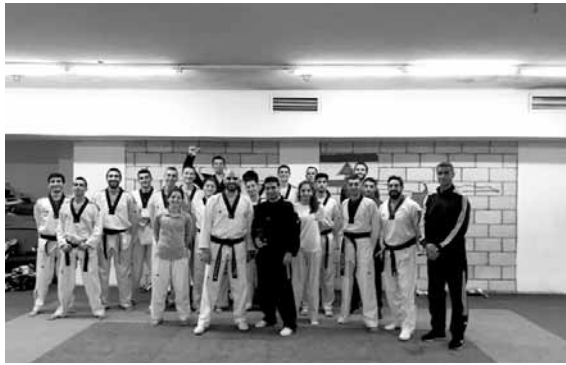
الفريقان في صورة جامعة