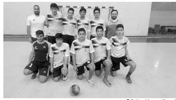
احد الفرق المشاركة

تواصلت تصفيات دورة الألعاب المهنيتية في المحافظات بمتابعة من اللجنة العليا ومدير الدورة علي علوية وأسنادة الرياضة، وأقيمت مباريات بكرة الصالات وكرة القدم المصغرة في محافظتي الجنوب والبقاع وأسفرت عن الاتي: