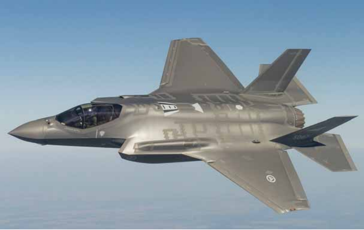
طائرة اف ٣٥ الاميركية