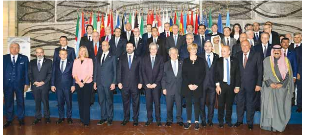
المشاركين في مؤتمر روما ٢

على بعد عشرة ايام من مهلة الإعداد الإلزامي للوائح الانتخابية، التي تنتهي في السادس والعشرين من الشهر الجاري، تعقيدات كثيرة لا تزال تعيق تشكيل اللوائح، وفيما سيجري تزخيم الحركة الانتخابية في الساعات القليلة المقبلة على خط «تيار المستقبل» والتيار الوطني الحر، انتهى مؤتمر «روما ٢» لدعم الجيش اللبناني والاجهزة الأمنية، باجماع دولي على ضرورة الاستقرار على الساحة اللبنانية، دون ان تتجاوز النتائج سقف طموحات ما كان متوقفاً مسبقاً لجهة مراعاة تلك الدول للمصلحة الإسرائيلية اولاً، ما ينعكس حكماً على نوعية الاسلحة التي ستتمح الى الجيش. «طيف» حزب الله كان حاضراً في المناقشات، والتشكيك في قدرة لبنان على التوصل الى «استراتيجية» دفاعية.. اما على هامش المؤتمر فقد ابلغ الاميركيون الوفد اللبناني تجميد ملف النزاع البحري والبري بين لبنان واسرائيل الى ما بعد استلام وزير الخارجية