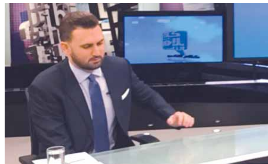
تيمور جنبلاط خلال المقابلة التلفزيونية

أكد تيمور وليد جنبلاط في اول اطلالة اعلامية، ان «الروز أوفياء وعندي واجب تجاه الناس وخدمتهم».