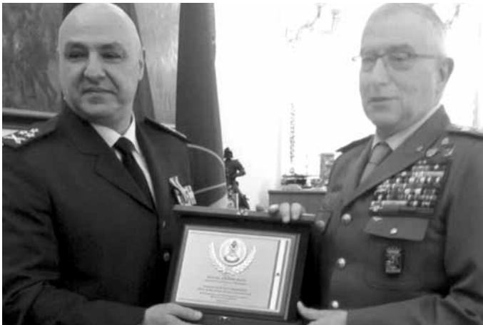
قائد الجيش مع رئيس أركان الدفاع الإيطالي الجنرال كلاوديو غراتسيانو

عقد قائد الجيش العماد جوزاف عون لقاءات جانبية عدة، على هامش مؤتمر روما، أولها مع رئيس أركان الدفاع الإيطالي الجنرال كلاوديو غراتسيانو في مقر القيادة العسكرية، حيث تم التداول في شؤون الجيشين وسبل تطوير العلاقة بينهما وتفعيلها.