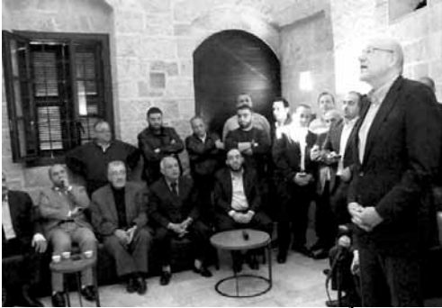
ميقاتي يتحدث امام الوفود

أمت دارة الرئيس نجيب ميقاتي في طرابلس امس وفود شعبية وفعاليات اجتماعية وثقافية من منطقة المنية. وقال ميقاتي: «منذ بداية اعدادي لقانون الانتخابات ايام حكومتي، لم اكن اعتبر المنية إلا امتدادا لمدينة طرابلس. وتاريخيا، فإن المنية والضنية كانتا جزءاً من قضاء طرابلس، والعلاقة بين المنطقتين طبيعية وقوية، إذ ان أهل الضنية بالذات يعتبرون طرابلس مدينتهم في الشتاء، وأهل طرابلس يعتبرون الضنية مدينتهم. اما المنية فهي الجامعة لكل الطيبين وانتم على اسهم».