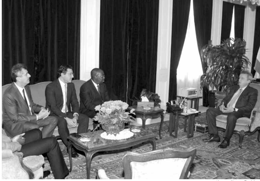
سلامة مع الوفد الافريقي

من جهته قال سيزا: «لقد تشرفنا بزيارة عدد من المسؤولين اللبنانيين في العاصمة اللبنانية بيروت، وفي مقدمهم وزير الاقتصاد والتجارة رائد خوري، وحاكم مصرف لبنان رياض سلامة، وتجمع رجال وسيدات الأعمال اللبنانيين في العالم برئاسة الدكتور فؤاد زمحل، اضافة إلى عدد من رؤساء مجالس إدارة مصارف لبنانية، وبحفنا معهم في التعاون وتبادل الخبرات، ولا سيما ان لبنان يعتبر بلداً فريداً في مجاله، إضافة إلى عدد من المصرفيين اللبنانيين يحمل تاريخاً كبيراً من الخبرات وتجاوز التحديات». وشدد سيزا على «أهمية التعاون وتبادل الخبرات»، مبيداً ترحيبه بـ«التسهيلات التي تلقيناها من حاكم مصرف لبنان المركزي الذي أبدى حرصه على التعاون والتأزر ومتابعة الاتصالات بين الجانبين في هذا الشأن».