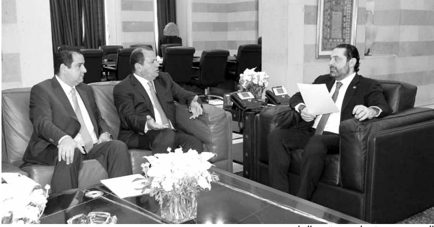
الحريري مجتمعاً ببيروت والرامي

تأكيد على الالتزام بمبادئ حقوق الانسان واستعدادنا للمساعدة في هذا المجال. كما استقبل الرئيس الحريري رئيس نقابة المطاعم طوني الرامي والامين العام لاتحاد النقابات السياحية جان بيروني، الذي قال بعد اللقاء: «أطلعنا الرئيس الحريري على الواقع السياحي والمستجدات بالنسبة لمسيرة الاستثمار الحالية في لبنان، وقد طماننا دولة اننا نسير نحو مرحلة يسودها الهدوء في ظل الانتخبات المقبلة، ونأمل ان يعكس ذلك على الموسم السياحي. والقي الرئيس الحريري وفدا من المستثمرين اللبنانيين والاجانب برئاسة اليكس ريس وجرى عرض سبل الاستثمار في لبنان.