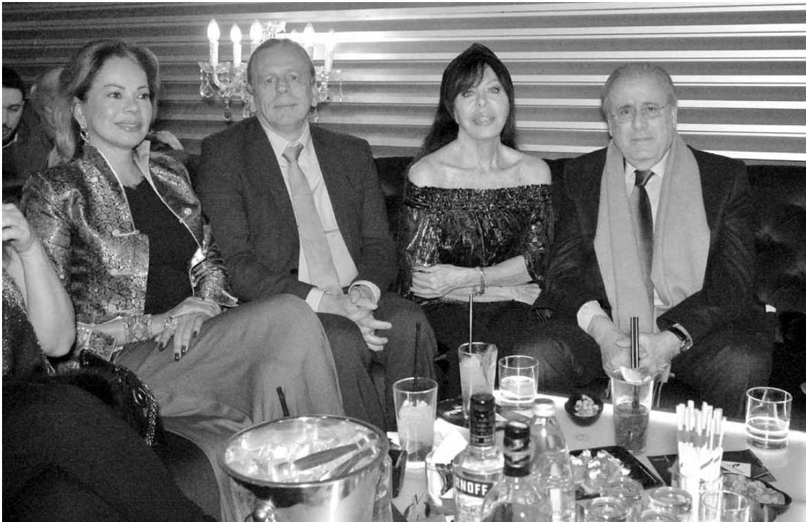
العميد جوزف حبيس، فيفيان اده، سفير بلجيكا، والسفيرة الأوروبية