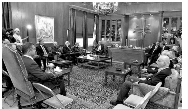
بري مع النواب

كرر رئيس مجلس النواب نبيه بري امام نواب «لقاء الأربعاء» أن توقيع الرئيسين ميشال عون وسعد الحريري على الدورة الاستثنائية لمجلس النواب «لزوم ما لا يلزم».