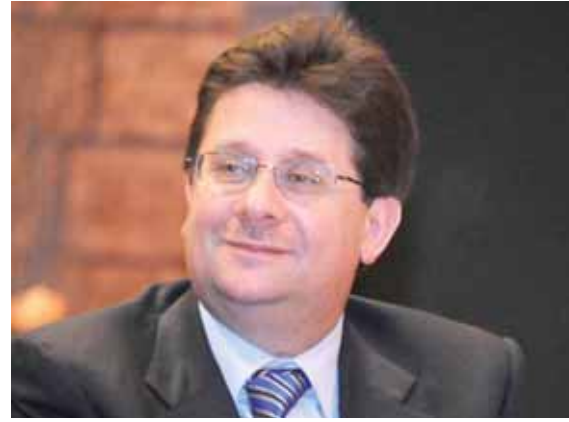
النائب ابراهيم كنعان

ولذلك اقر النائب ابراهيم كنعان برنامجاً سريعاً فوق العادة اذ انه سيعقد يوم الجمعة اجتماعاً قبل الظهر وبعد الظهر والسبت كذلك ايضا، اما الاحد عطلة، لكن يوم الاثنين والثلاثاء والاربعاء والخميس والجمعة فسيتم عقد اجتماع قبل الظهر وبعد الظهر وكل ذلك خلال اسبوع حتى توافق لجنة المال على الموازنة ويتم ارسالها الى الهيئة العامة في المجلس النيابي لقرارها.