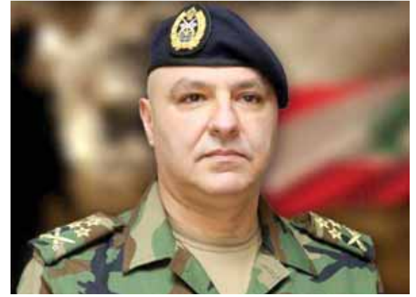
قائد الجيش العماد جوزف عون

واذا تقرر عدم استئجار البواخر فان الخطة البديلة هي انشاء معامل ومولدات الطاقة الكهربائية، وهذا يعني انتظار ٣ سنوات. فالرئيس عون سيدخل الى مجلس الوزراء ويقول اننا ليس لي علاقة بالبواخر او غيرها، انما الحكومة قدمت عرضا في استئجار البواخر ستاتي بالطاقة الكهربائية في شهر ايار بعد شهرين ونصف بطاقة ٨٥٠ ميغاوات ويصبح تقنين الكهرباء في لبنان بين ٤ ساعات وساعتين، ويؤدي استئجار البواخرتين الى تأمين الكهرباء لمدة ٢٠ ساعة و٢٢ ساعة، بينما الخطة البديلة والتي انا ارجب بها هي قيام وانشاء مولدات كهرباء على البر ولكن وفق دراسات اكبر شركات دول العالم فان ذلك يتطلب وقتا لا يتقص عن ٣ سنوات. وسيطرح على الحكومة اما استئجار البواخر والحصول على الكهرباء في مطلع الربيع في ايار كي يبدأ موسم الاصطيف ووصول المغتربين في جو تعم الكهرباء في