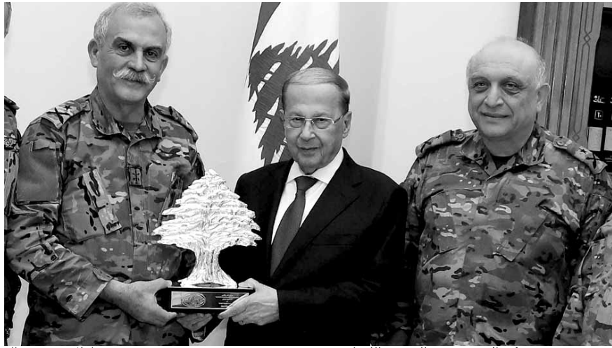
عون مع وفد مركز البحوث في الجيش اللبناني

مواقف الرئيس عون جاء خلاله استقباله وفداً من الحملة العالمية للعودة إلى فلسطين»