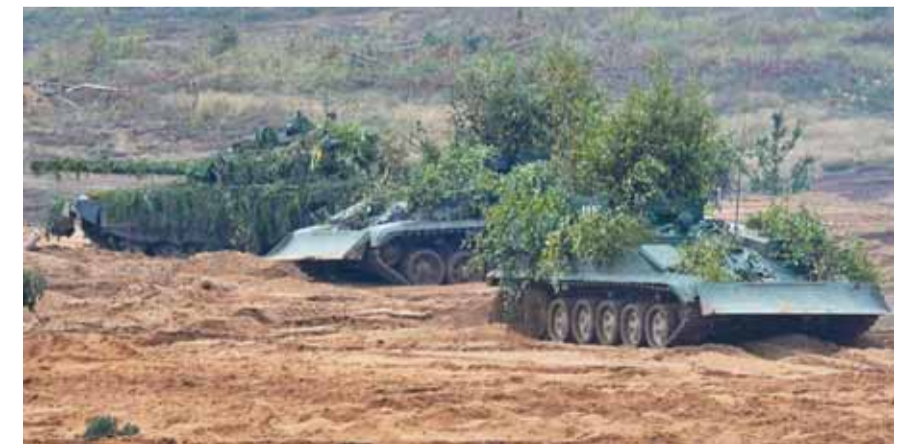
ديابات الجيش السوري في الغوطة

قبل ان نتحدث عن معركة الغوطة لا بد من الإشارة الى ان ٥٦ بالمئة من الغوطة الشرقية التي تبلغ مساحتها ١١٠ كلم مربع اصبحت تحت سيطرة الجيش العربي السوري فيما بقي ٤٤ بالمئة مع فيلق الرحمن وجيش الاسلام. لكن الفرق هو ان عدد سكان المناطق التي سيطر عليها الجيش السوري لا يزيد عن