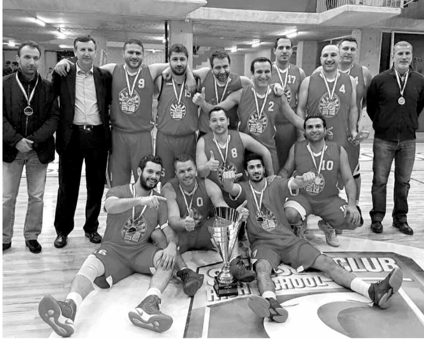
المدرّب بستاني مع فريق نقابة المحامين بعد احرازه أحد الألقاب