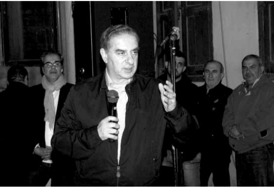
فرعون يلقي كلمته

أكد وزير الدولة لشؤون التخطيط ميشال فرعون أن الإنماء يبقى أولوية بالنسبة إليه، ويحظى بمتابعة يومية لاصلة لها باستحقاق الانتخابات النيابية، مبدياً أسفه «للتعطيل المتعمد للمشاريع الإنمائية التي أعدت لجزء من العاصمة، وتحديدًا لمناطق الأشرفية والرميل والصفى والمدور، من قبل إحدى الحكومات السابقة بين العامين ٢٠١١-٢٠١٤».