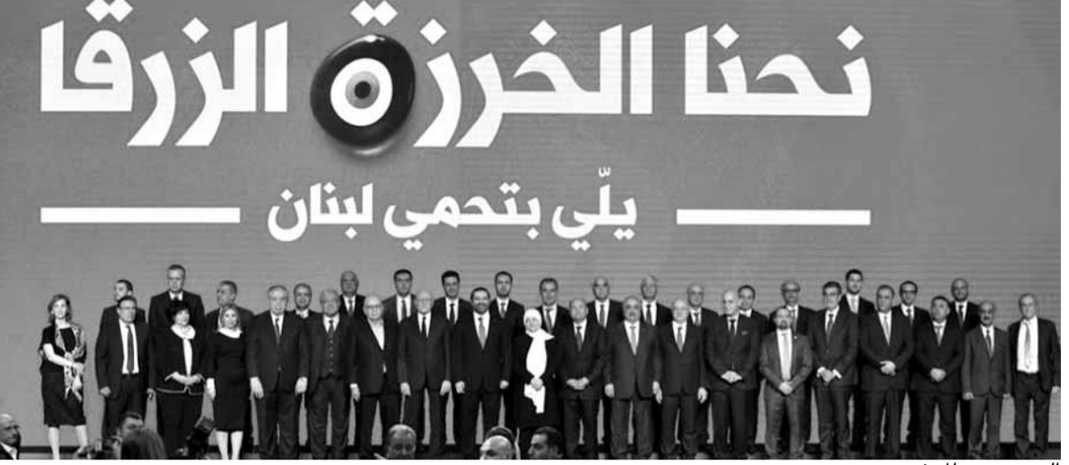
الحريري مع المرشحين

والحرية والديموقراطية والسيادة والأمن الاجتماعي والعمل الوطنية والنهوض بالاقتصاد، لإيجاد فرص عمل للشبان والشابات في بلدنا، ونحن سنأخذ معنا الى ثلاثة مؤتمرات دولية جمعنا العالم فيها للمضي فيه».