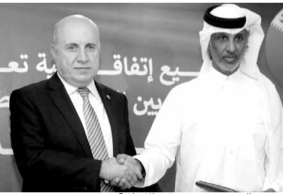
حيدر والشيخ حمد بعد توقيع الاتفاقية

وقّع الاتحادان اللبناني والقطري لكرة القدم اتفاقية تعاون وتبادل خبرات بينهما خلال مؤتمر صحفي حاشد عقد في فندق «كمبينسكي سمرلاند» في العاصمة اللبنانية بيروت. تقدّم الحضور رئيس الاتحاد اللبناني للعبة المهندس هاشم حيدر ونظيره القطري الشيخ حمد بن خليفة آل ثاني، سفير قطر