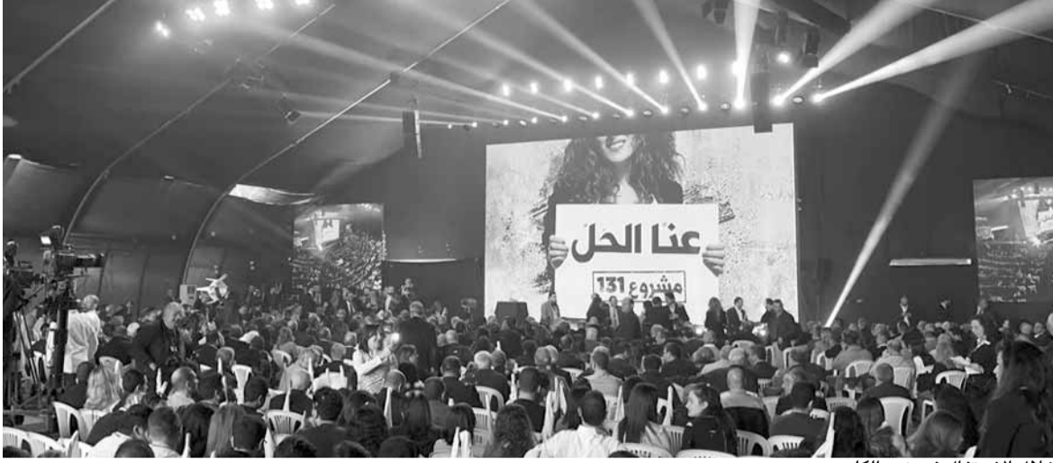
خلال الاحتفال في نهر الكلب

المحاسبة. وشدد على ان حزب الكتائب اخذ خيار المواجهة بمساعدة الناس. ووعد الجميل كل من يؤمن بالخط النظيف الذي نمثله بأننا ناهبون بمعركتنا حتى النهاية ولن نتراجع فيها وسننتصر.