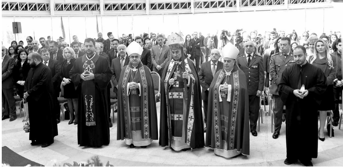
الراعي يترأس قداس الأحد

بكلية احمل حرره من قيود الضعف والحاجة. هكذا تفعل فينا نعمة سر التوبة: تحررها من قيود الأيام والتجارب التي تأسرنا، وتضعف قوتنا، فنصنع مقادير بها وإلهاها. بكلمة إش ففتح الرب يسوع أمامه طريقاً جديداً بمشيئه. هكذا في سر التوبة يفتح أمامنا المسيح الفادي طريقاً جديداً مستقيماً لنسلكه على أنوار الروح القدس، مع الله والذات والناس. فليخضع كل واحد منا أمام المسيح، طبيب الأرواح والأجساد، ملتزمين نعمة الشفاء ورافعين نشيد المجد والتسبيح للآب والإبن والروح القدس، الآن وإلى الأبد، آمين.