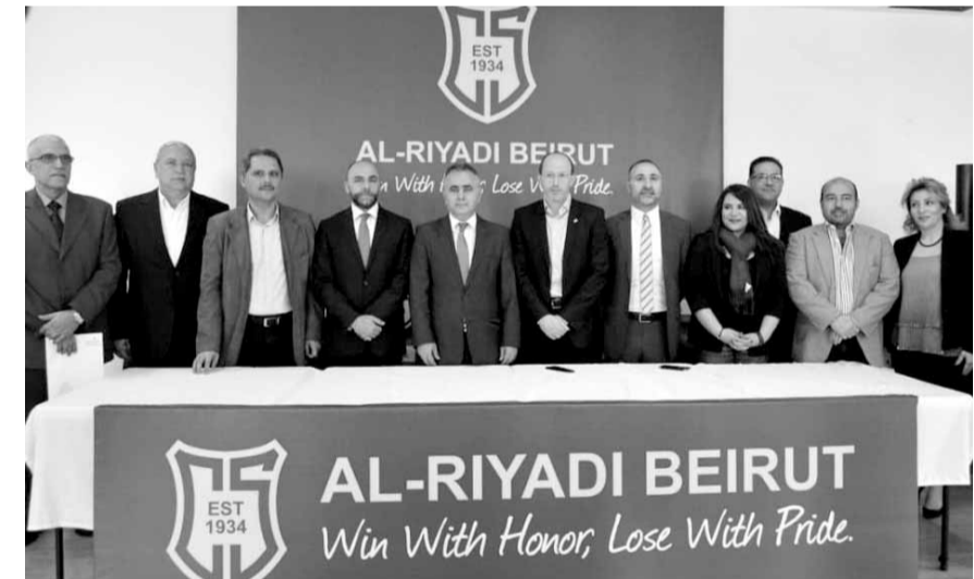
اللجنة الادارية الجديدة للنادي

دون اي شائبة على الرغم من العدد الكبير الذي شارك فيها.