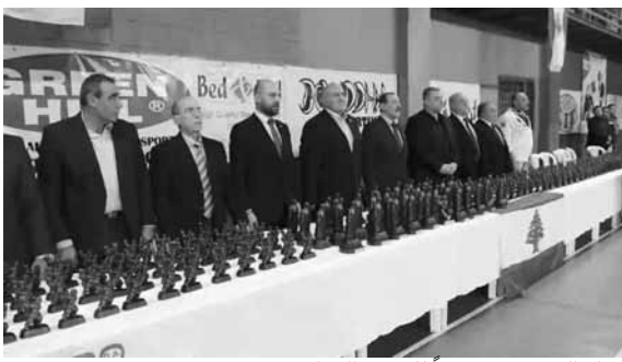
كبار الحضور ووقوفاً للنشيد الوطني