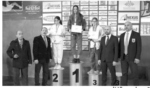
تتويج إحدى الفئات