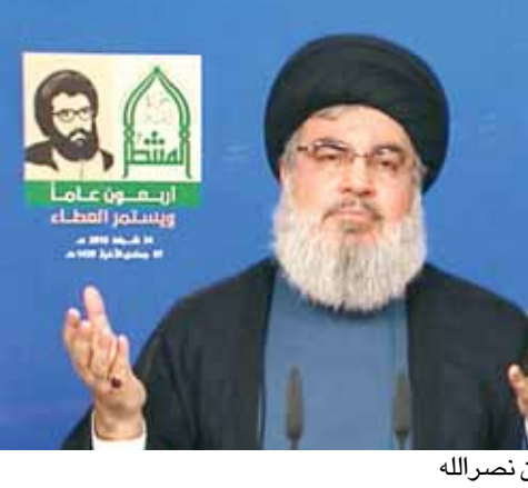
السيد حسن نصرالله

والتحضير الاول والثاني، هناك اكثرية شعبية لبنانية تؤمن بالمقاومة كاحد عناصر الفوز في المعادلة الذهبية. من جهته تحدث رئيس مجلس النواب نبيه بري امام برلمان الطلاب في المجلس النيابي فدعا الى انتفاضة دستورية وتنفيذ الاستحقاقات مؤكدا ان لبنان لعب ادواراً تاريخية لدعم حقوق الشعب الفلسطيني، كما دعا الى تطوير قانون الانتخاب (التفاصيل ص ٤-٥)