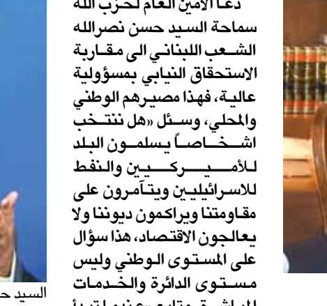
الرئيس نجيب ميقاتي

قال الرئيس نجيب ميقاتي، في تغريدة عبر «تويتر»: «شكراً لمجلس الأمن الدولي على قراره وقف اطلاق النار في سوريا، بما يتيح معالجة الواقع الانساني المؤلم في الغوطة، وكم كنا نتمنى لو يقف العرب صفا واحداً حقناً للدماء العربية التي تهر مستصرخة ضمير الانسانية وما من مجيب».