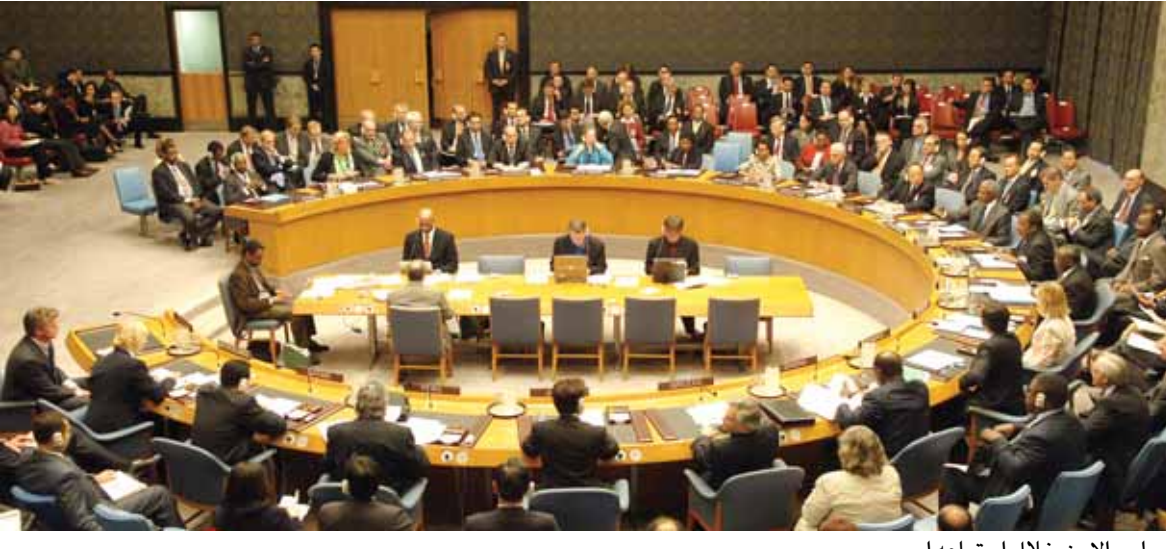
مجلس الامن خلال اجتماعه امس

دول غير دائمة العضوية فان الـ ١٠ دول الدائمة العضوية كانت متفقة كلها على المشروع، و٤ دول الصين بريطانيا الولايات المتحدة فرنسا موافقة باستثناء روسيا التي توقفت عند عبارة وقف اطلاق النار فوراً، ورفضت هذه العبارة وقالت ان ذلك غير منطقي. لكن المشروع الكويتي - السعودي كان في الاساس لا يقول بوقف اطلاق النار فوراً، بل يقول بوقف اطلاق النار دون تأخير، لكن اقترح بعض الاعضاء وضع كلمة وقف اطلاق النار فوراً، فتم العودة الى المشروع الكويتي - السعودي الاساسي وهو وقف اطلاق النار دون تأخير وفتح كامل الطرقات الى المناطق