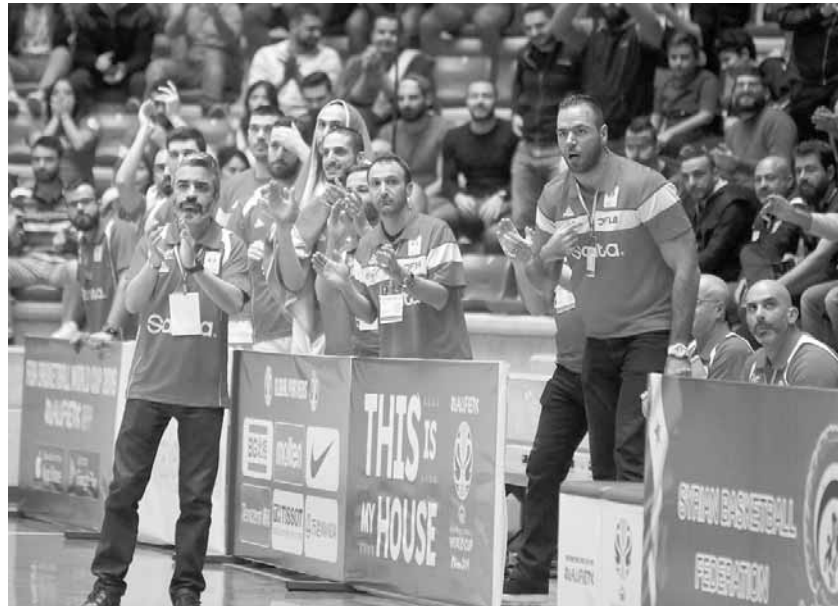
حماسة لا حدود لها