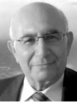
فؤاد ابو زيد

قياساً الى ما وصلت اليه مسيرة الانتخابات النيابية حتى اليوم، يمكن القول ان فريق ٨ آذار بقيادة حزب الله، انهي بنسبة مرتفعة جداً تحالفاته الانتخابية في الدوائر القادر على التأثير فيها، وانصرف عملياً الى معركته الانتخابية في الدوائر الاساسية بالنسبة اليه، في الجنوب والبقاع وبيروت وبعيداً، في حين ان احزاب وقوى ما كان يعرف بقوى ١٤ آذار، ما زالت غارقة في مباحثاتها وحوارها مع بعضها بعضاً، ومع التيار الوطني الحر، لتعرف في اي مرفأ تحالفي ستترسو، واغلب الظن ان الموعد النهائي لإعلان التحالفات - في حال حصولها - واللوائح سيأخذ وقته كاملاً، اي في الموعد المحدد لسحب الترشيحات في الاسبوع الأخير من شهر آذار المقبل، وحتى ذلك الموعد، او قبله بقليل، سيبقى الغموض والضباب، سيدي الموقف.