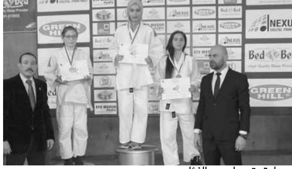
سعادة يتوج إحدى الفئات