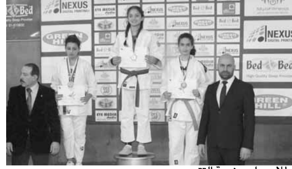
بطولات على منصة التتويج