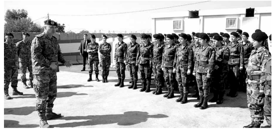
قائد الجيش خلال الجولة

بدأت ثلاثتها مع عهد رئيس الجمهورية العماد ميشال عون في العام ١٩٨٩، وأكد استمرار هذا التطوع والعمل على تفعيل دور العسكريين الإنثاء وزيادة عديدهن مستقبلاً، انطلاقاً من إيمان الجيش بتكافؤ الفرص والمساواة بين جميع المواطنين، ومشاركتهم معاً في مسيرة نهوض الوطن والدفاع عنه.