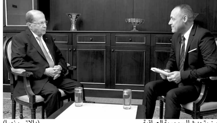
عون يتحدث للسومرية العراقية (اللاتي ونهرا)

أكد رئيس الجمهورية العماد ميشال عون في حديثه في برنامج «زاوية أخرى» على قناة «السومرية» العراقية، ان «الوضع الحالي لا يسمح لإسرائيل ان تتخطى الحدود لأن هناك قراراً لبنانياً بالدفاع عن هذه الحدود برأً وبحراً».