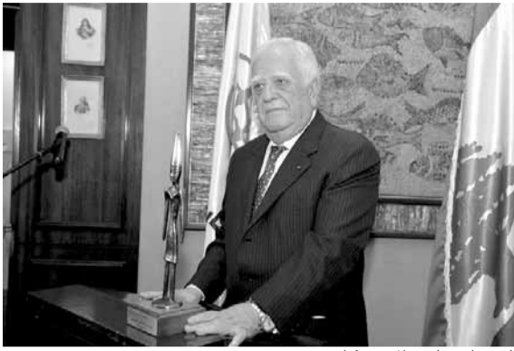
القصار يتلقى الأوسكار

الاقتصاد الوطني، والإرتقاء بمكانته في الوسط التجاري العربي والدولي، وتقوية دور الجمعية كهيئة رئيسية ضمن الهيئات الاقتصادية اللبنانية.