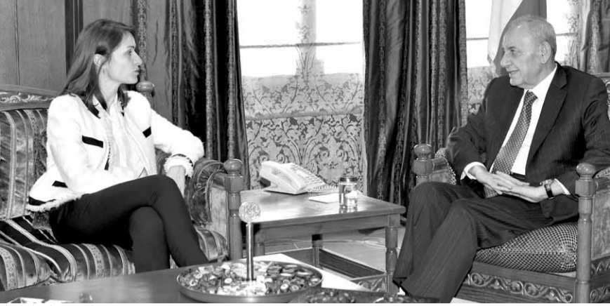
بري مجتمعاً مع لاسن استقبل رئيس مجلس النواب نبيه بري، بعد ظهر امس، في عين التينة، سفيرة الاتحاد الأوروبي في لبنان كريستينا لاسن وعرض معها للاوضاع الراهنه في لبنان والمنطقة. وكان الرئيس بري استقبل نقيب الصحافة عوني الكعكي وعضو مجلس النقابة جورج بشير والمهندس جورج ريمون نجار.