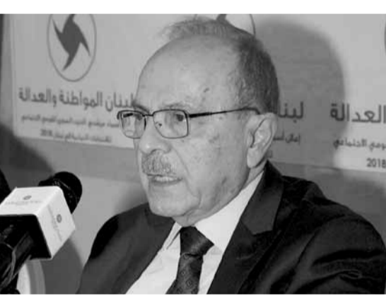
الناشف يعلن الاسماء

وأشار الى أن «دائرتي المتن الشمالي وبعيدا تخضعان لمزيد من البحث والتشاور وسيصدر قرار عن رئيس الحزب بهما قبل انتهاء مهلة الترشيح».