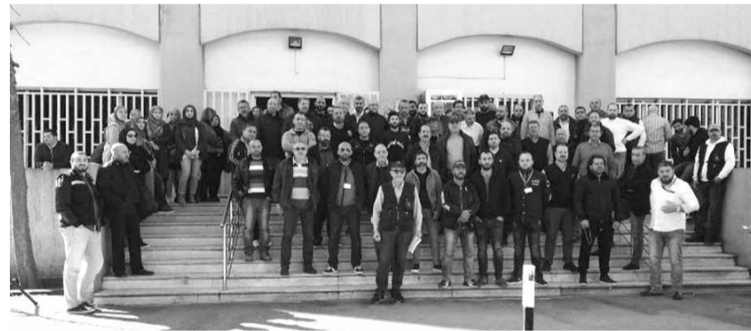
اضراب عمال أوجيرو

واصل عمال ومستخدمو هيئة «أوجيرو» اعتصامهم أمام مركز «أوجيرو» احتجاجاً على التأخير غير المبرر في المصادقة على مشروع سلسلة الرتب والرواتب لمستخدمي الهيئة وامتنعوا عن القيام بأي عمل استجابة لدعوة المجلس التنفيذي لنقابة عمال «أوجيرو».