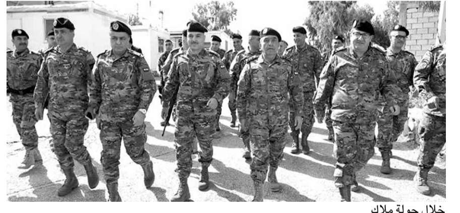
خلال جولة ملاك

وتفقد رئيس الأركان اللواء الركن حاتم ملاك قبل ظهر امس، الوحدات العسكرية المنتشرة في قطاع جنوب الليطاني، حيث زار قيادة القطاع في صور، ثم جال في وحدات لواء المشاة الخامس في مناطق شمع واللبونة، ورأس الناقورة قبالة النقطة M2، حيث يقوم العدو الإسرائيلي بإقامة الجدار الفاصل. وقد نوه ملاك خلال لقائه الضباط والعسكريين، ب«جهودهم وتضحياتهم أداء مهمة الجيش الأساسية وهي الدفاع عن الحدود الجنوبية ضد العدو الإسرائيلي، والحفاظ على استقرارها بالتعاون مع قوات اليونيفيل تنفيذاً للقرار ١٧٠١».