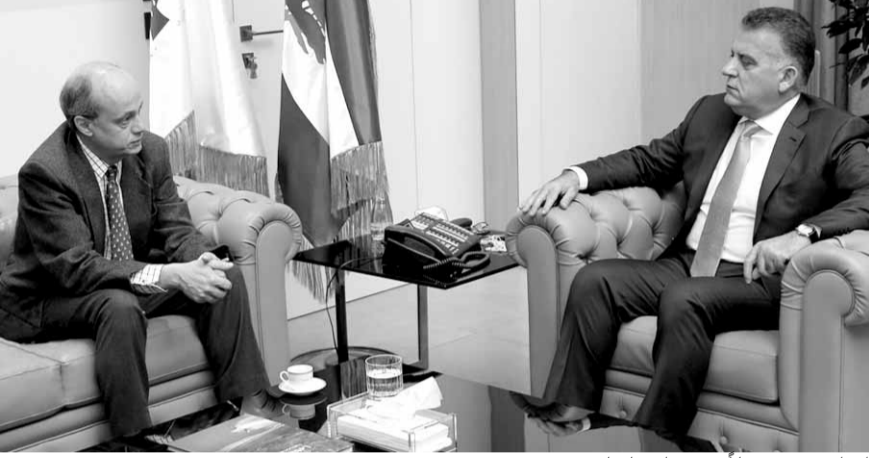
إبراهيم مستقبلاً سفير إسبانيا