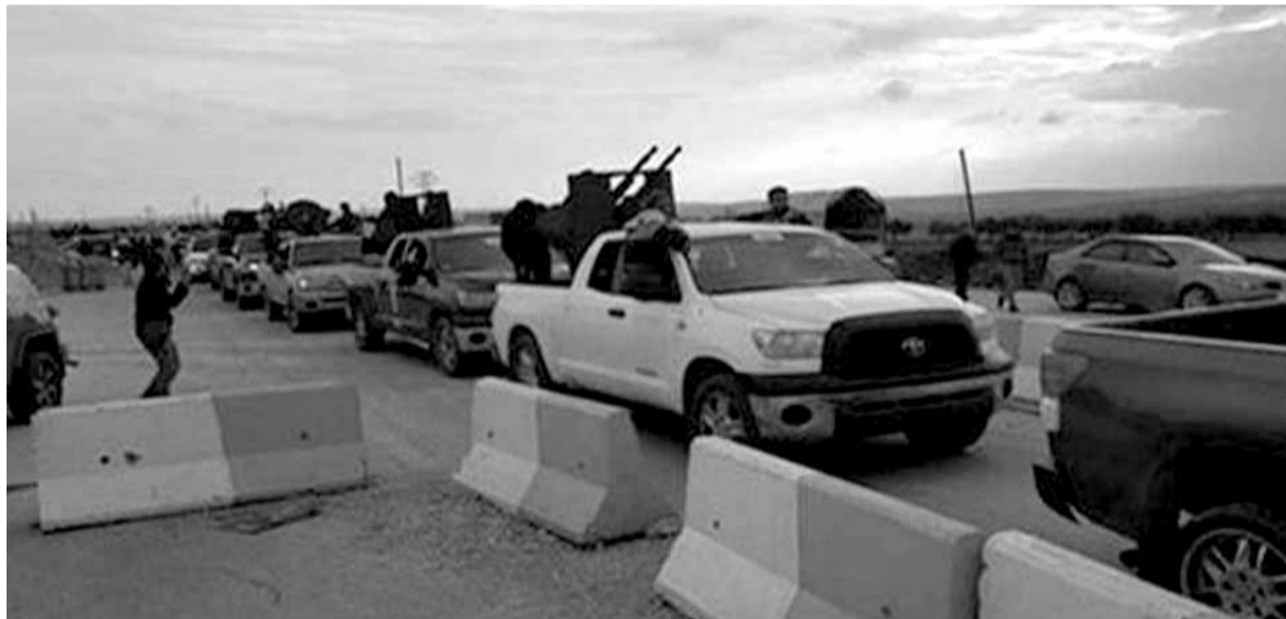
قاسم يعلن الاسماء

وكل ما ذكر هو أمر يؤهل بقوة شخص كرئيس وزراء تركيا للترشح على منصب رئيس الدولة التي فيها عشر قواعد عسكرية للناتو، بجانب أن جميع طرقها البرية وموانئها البحرية تحت تصرف قوات حلف الأطلسي التي لها كامل الحرية في إنشاء أجهزة الانذار المبكر والرصد والرادارات في جميع أنحاء تركيا، وعند ذكر كلمة رادارات يجب ان نتذكر منظومة الرادارات التي وضعتها الولايات المتحدة بتركيا لكي