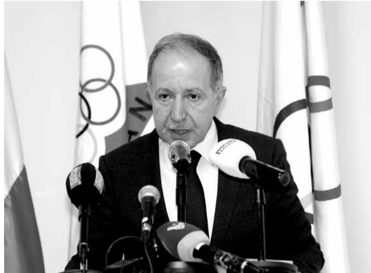
رئيس اللجنة الأولمبية جان همام يلقي كلمته

لمسافة ٢ كلم باتجاه مسبح الجامعة الأميركية ومن ثم العودة إلى نقطة الانطلاق. وأوضح أن الدول في القارة الآسيوية وبناءاً لطلب المجلس الأولمبي الآسيوي بدأت تنظيم سباقات للمرح للترويج لهذه الألعاب الآسيوية وقد نظمت كل من دبي - قطر - البحرين سباقاتها على هذا الصعيد وأنه في الأشهر المقبلة حتى حزيران سيقام مثل هذا السباق في كل من: سيريلانكا - ماليزيا - فيتنام - كمبوديا - تشاينيز تايبه - مكاو - بوتان - نيبال - كازاخستان - طاجكستان - كوريا الجنوبية - منغوليا - الصين - اليابان - كوريا الشمالية - سنغافورة - إيران - الهند - تيمور الشرقية، وأخيراً في جاكارتا خلال شهر حزيران حيث يبدأ العد العكسي لانطلاق فعاليات الدورة.