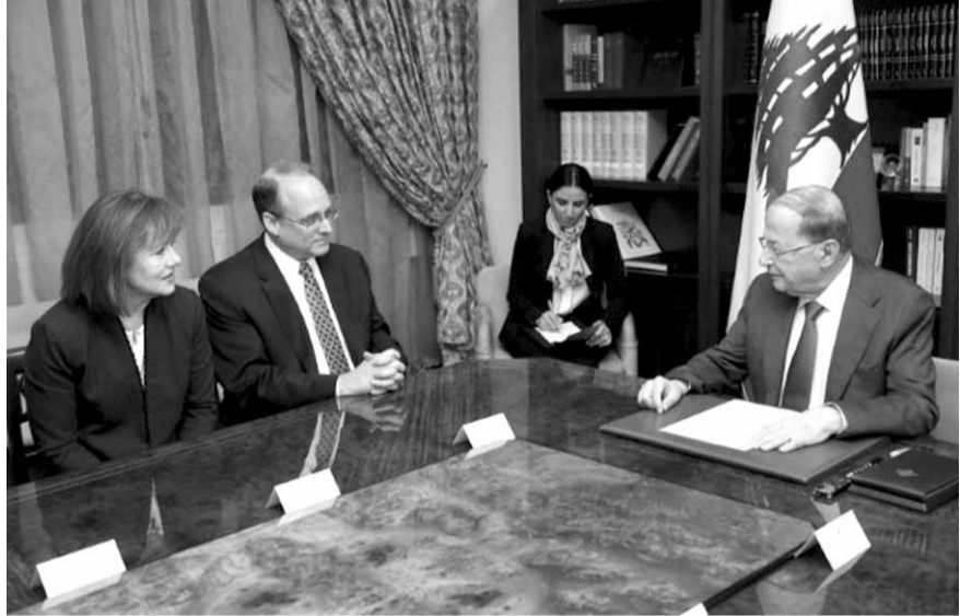
بيلينغسليا عند عون

الأميركية من مصرف لبنان، والسلطات المالية اللبنانية، كما أكد التزام بلاده دعم الإقتصاد اللبناني والجيش الذي اعتبر ان دوره اساسي في المحافظة على الاستقرار في لبنان.