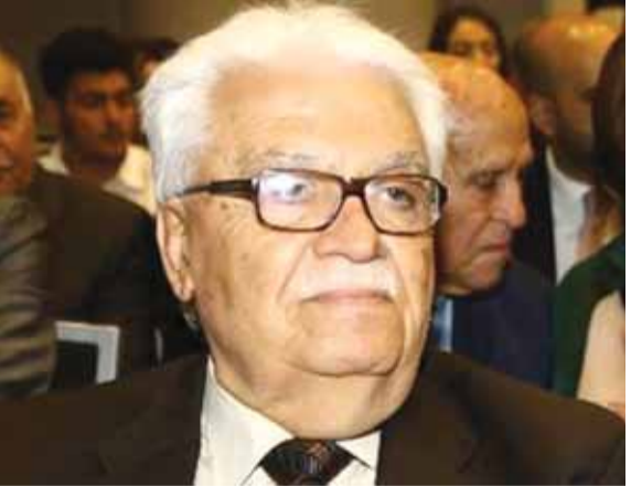
الراحل محمود عبد الخالق