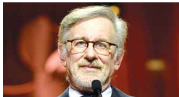
مخرج فيلم The Bost الاسرائيلي

بعد قيام الأمن العام اللبناني بمنع عرض فيلم The Bost الاسرائيلي قام وزير الداخلية والبلديات نهاد المشنوق بالسماح بعرض فيلم The Bost الاسرائيلي مخالفا أمرين: ١- المقاطعة لاسرائيل ومنع التطبيع معها طالما ان لبنان وفق القانون الدولي ووفق الواقع العدواني الاسرائيلي هو في حالة حرب مع العدو الاسرائيلي. ٢- السماح بخرق فني سينمائي بروح اسرائيلي وفيلمه وهو أحد الذين يتباهون بالعدوان على لبنان من قبل