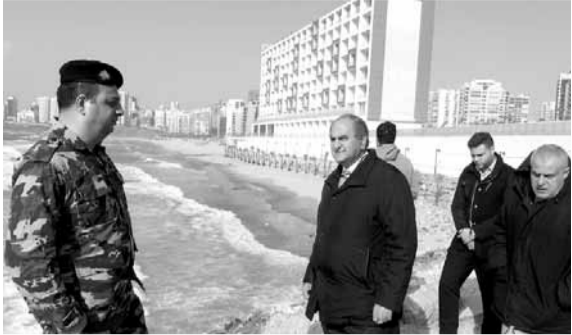
الخطيب خلال تفقده المشروع

تفقد وزير البيئة طارق الخطيب ظهر امس مع فريق من مصلحة البيئة السكنية ومصحة تكنولوجيا البيئة مشروع Eden Bay على شاطئ الرملة البيضاء بعد الشكاوى التي وردت الى وزارة البيئة عن مخالفات وعدم التزام بخطة الادارة البيئية.