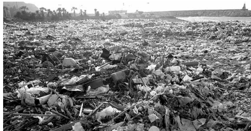
التفاريات على شاطئ ذوق مصبح (حسين جعفر)

وتابع إن ولوج الاتحاد العمالي العام باب إقامة مراجعات أو دعاوى أو طعون في هذه المسألة أو تلك ليس ترفاً، بل إنها من صلب واجباته الوطنية والرقابية والعملية والاقتصادية والاجتماعية بل، والأخلاقية كما يبنى عليها دستور ونظامه