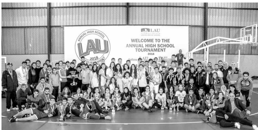
كبار الحضور مع الفائزين والفائزات