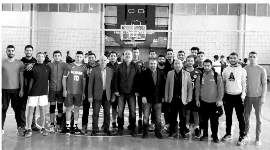
رئيس وأعضاء الاتحاد والمدربون مع اللاعبين